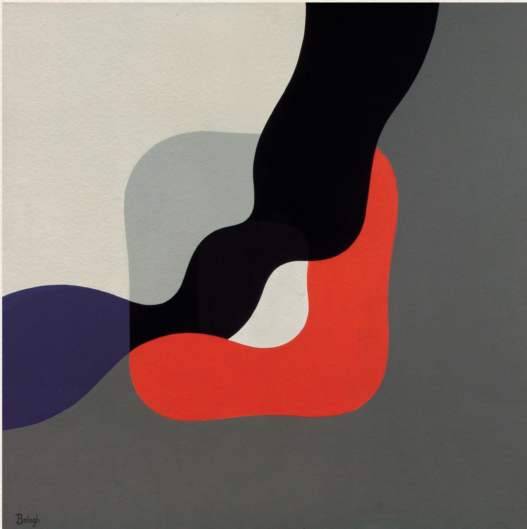
ORGANIKUS FORMA II. - 2000., vászon, akril, 80x80 cm