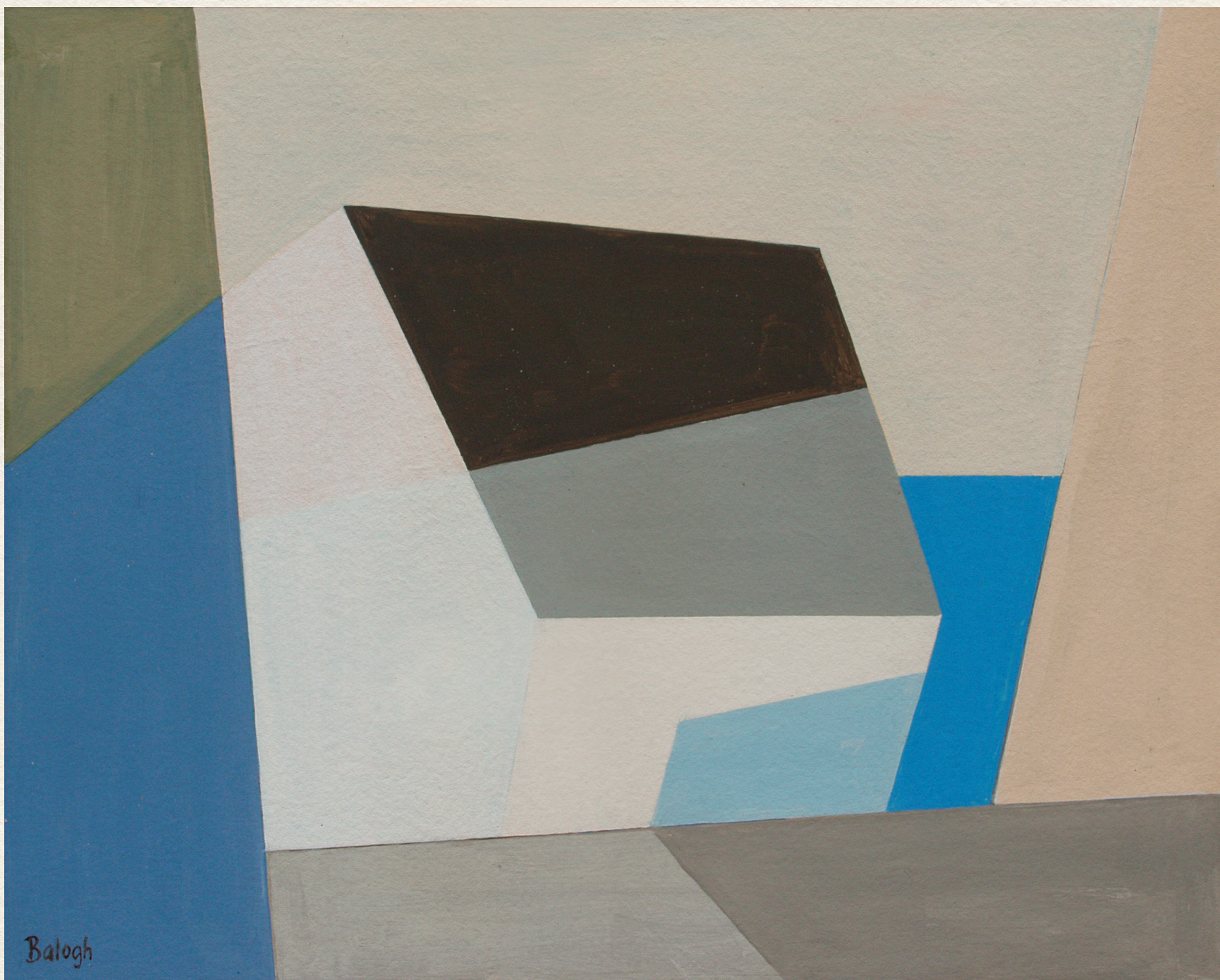
ÉLMOZDULÁS – 2000., vászon, akril, 70x80 cm