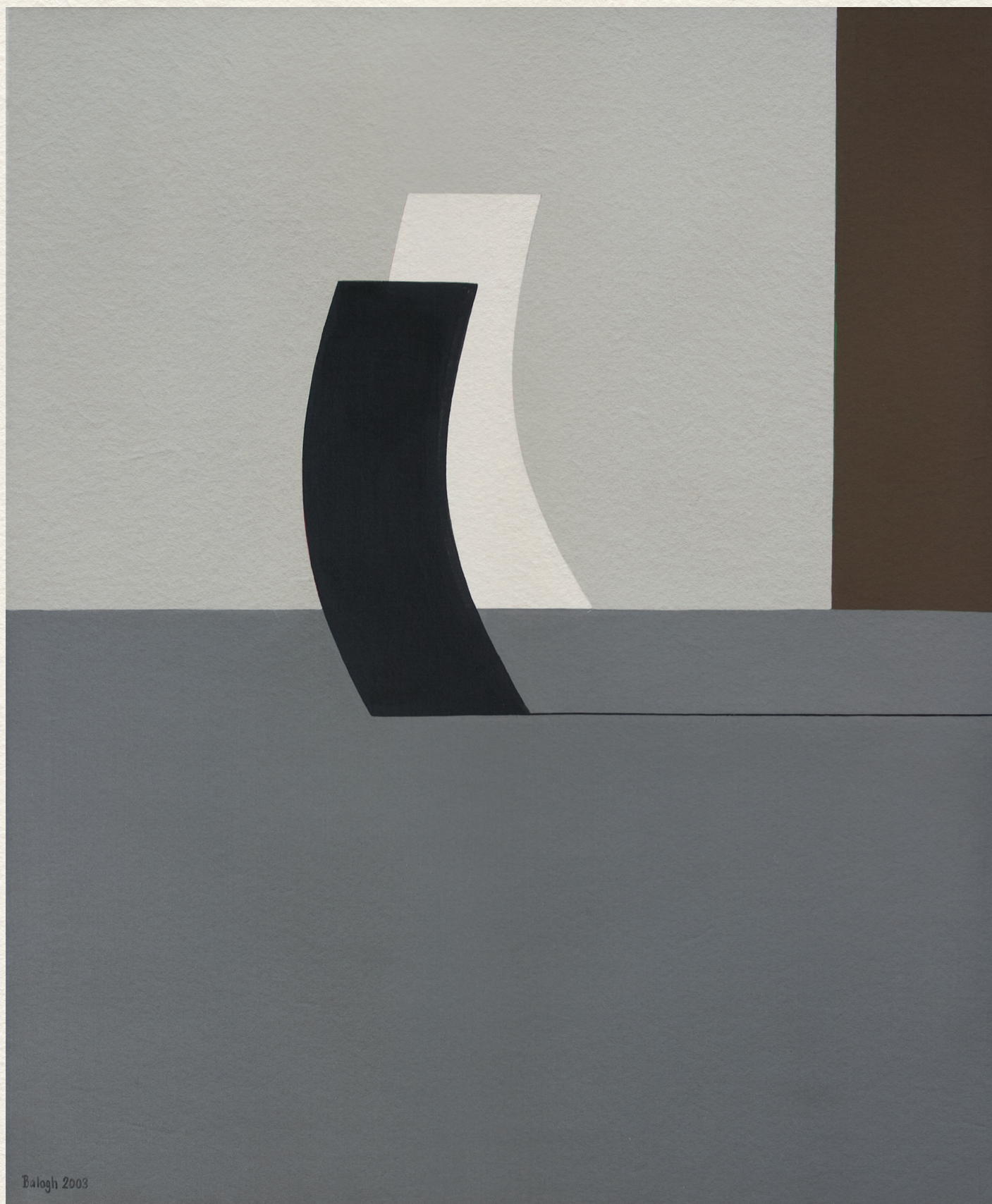
JELEK – 2003., vászon, akril, 120x100 cm