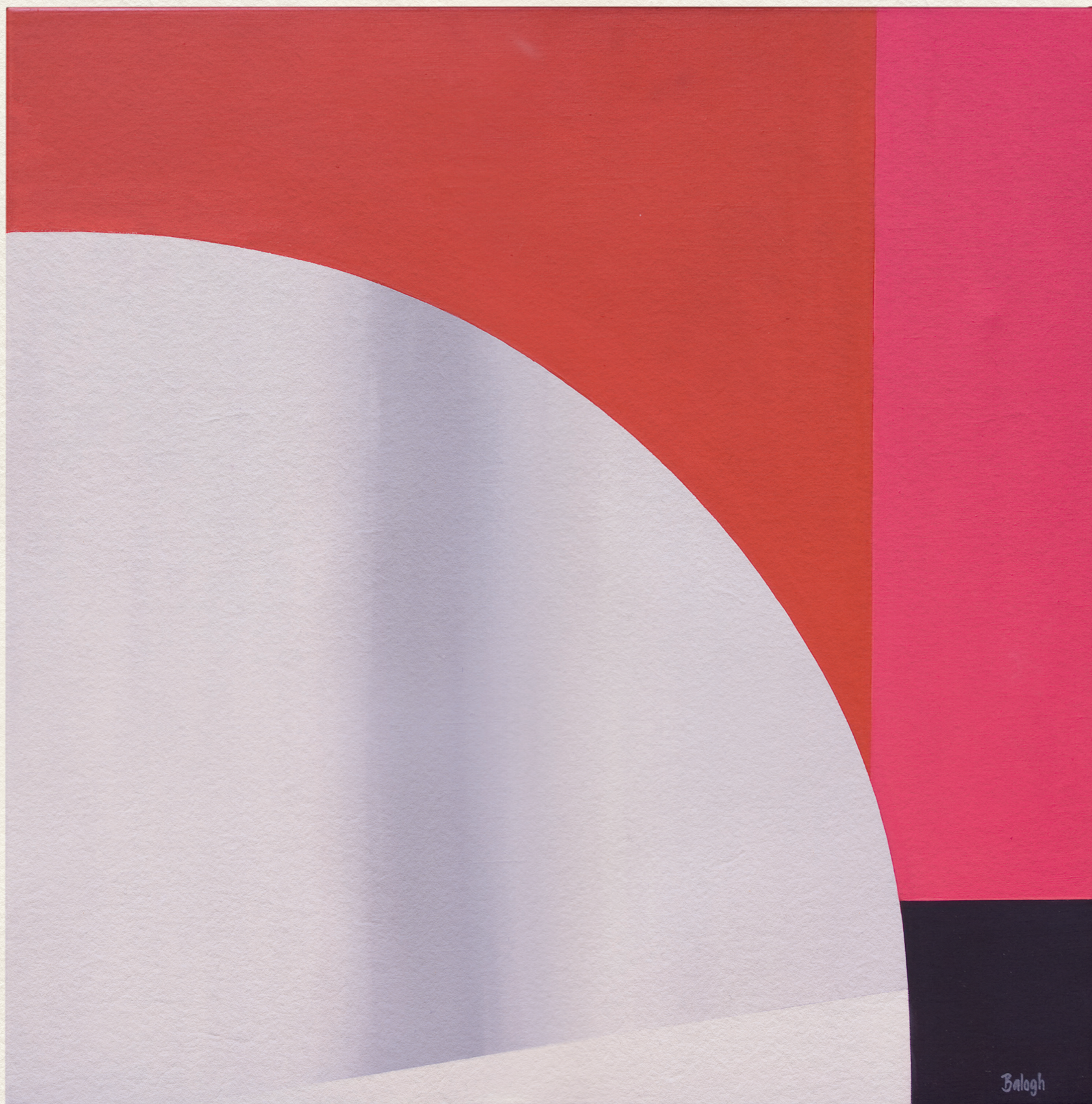
ELMOZDULÁS - 2000., vászon, akril, 80x80 cm