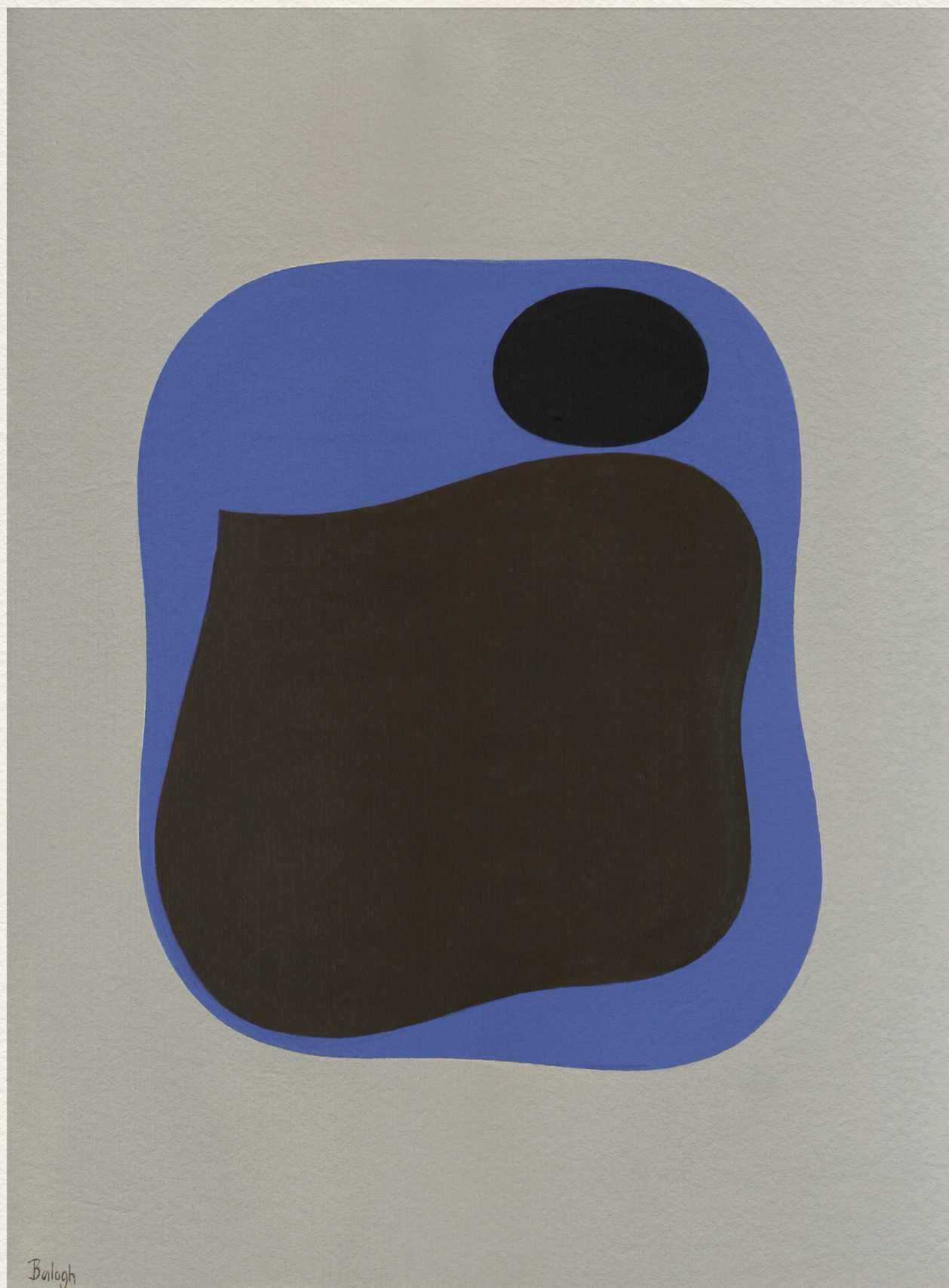
ORGANIKUS FORMÁK – 1999., vászon, akril, 80x60 cm