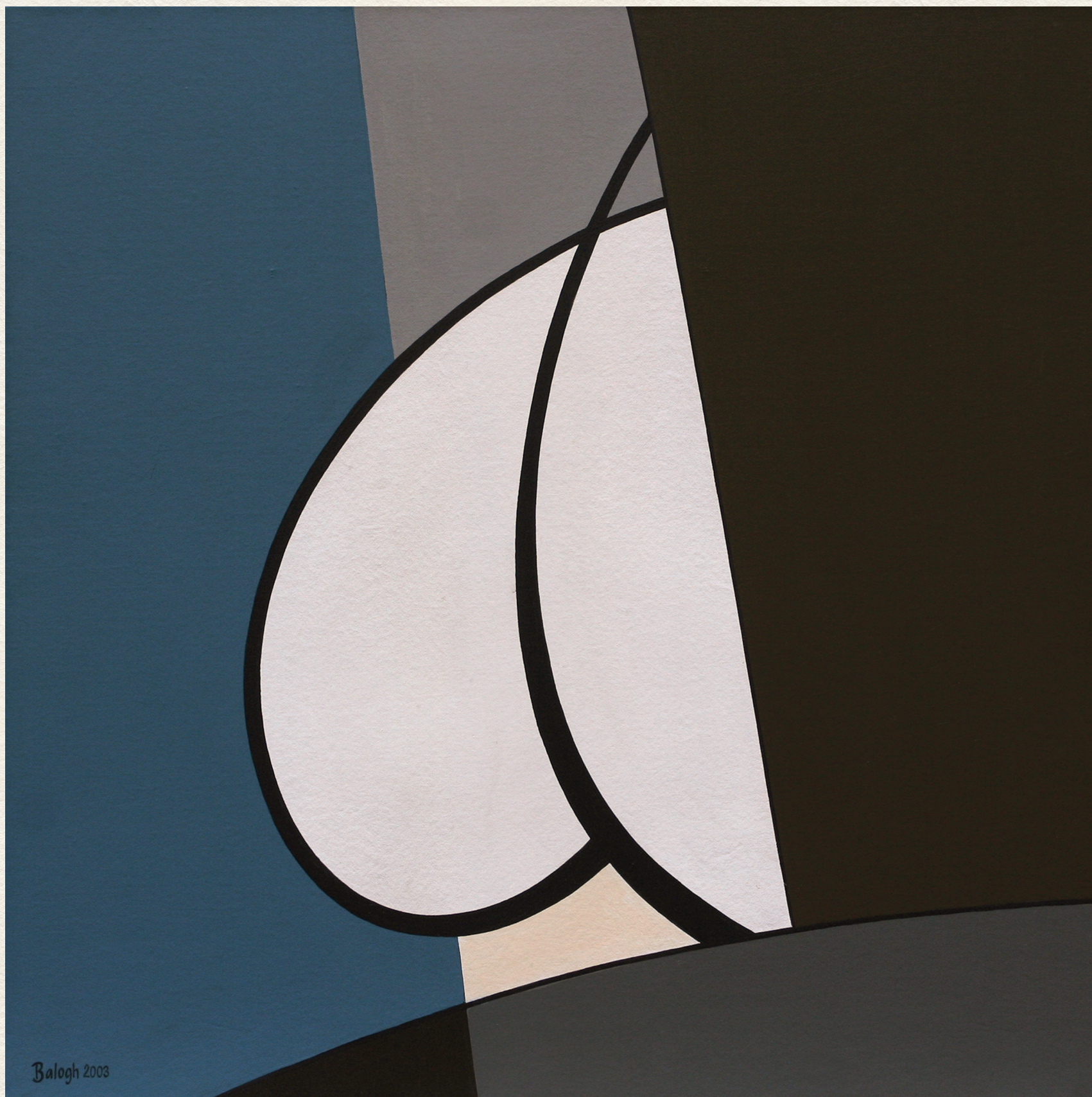
BONTAKOZÓ FORMÁK – 2003., vászon, akril, 80x80 cm