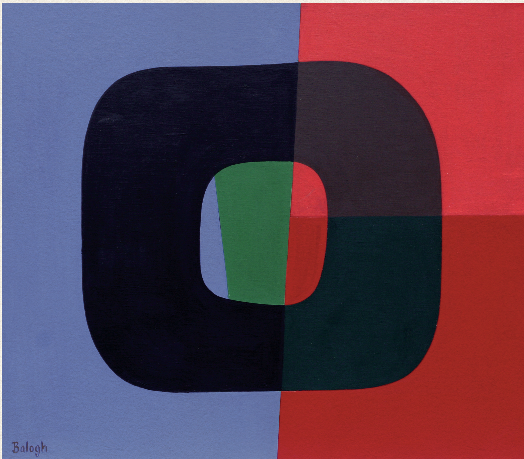
ORGANIKUS FORMA – 2000., vászon, akril, 70x80 cm