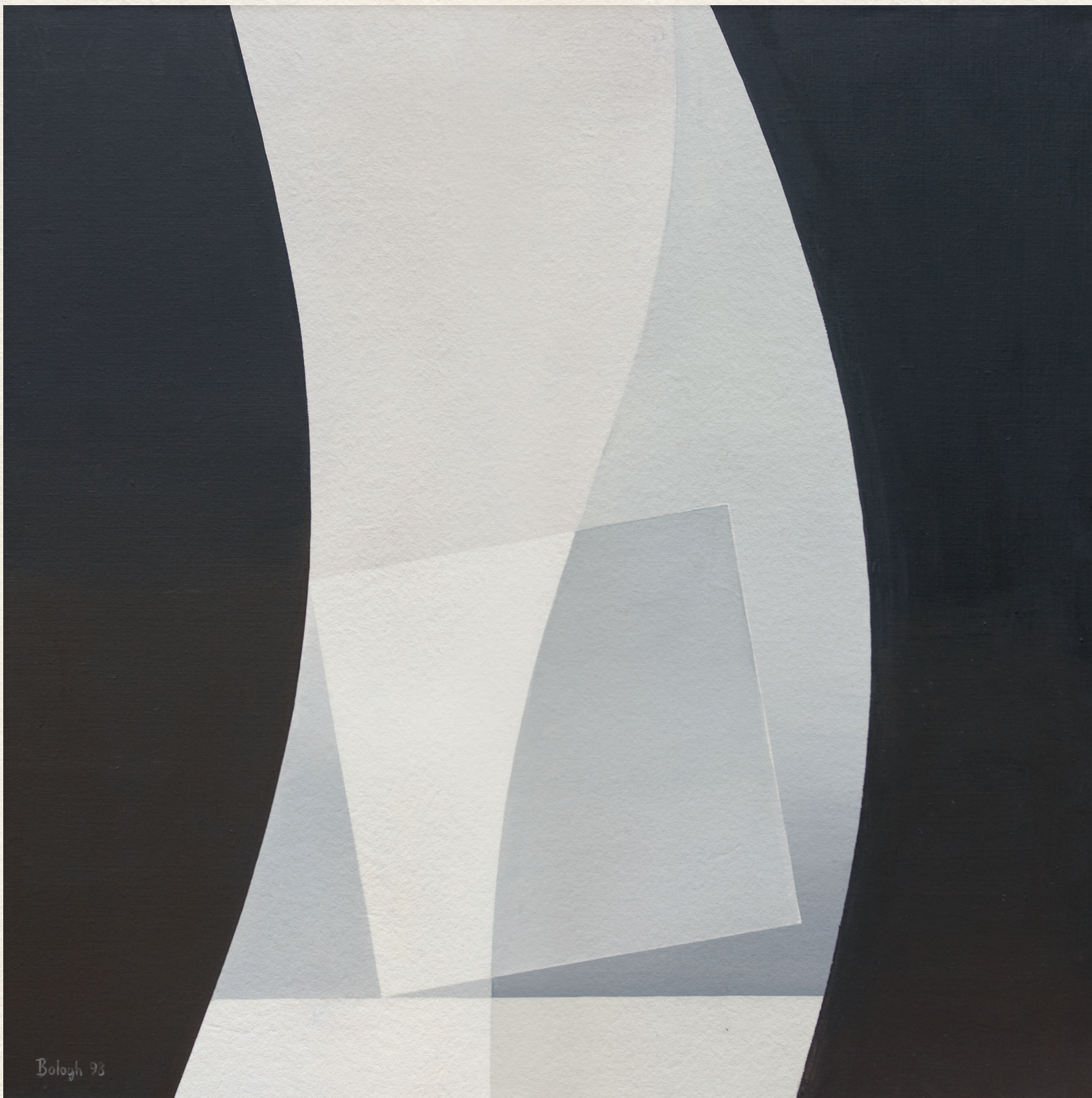
ÉLMŰLÁS – 1998., vászon, akril, 70x70 cm