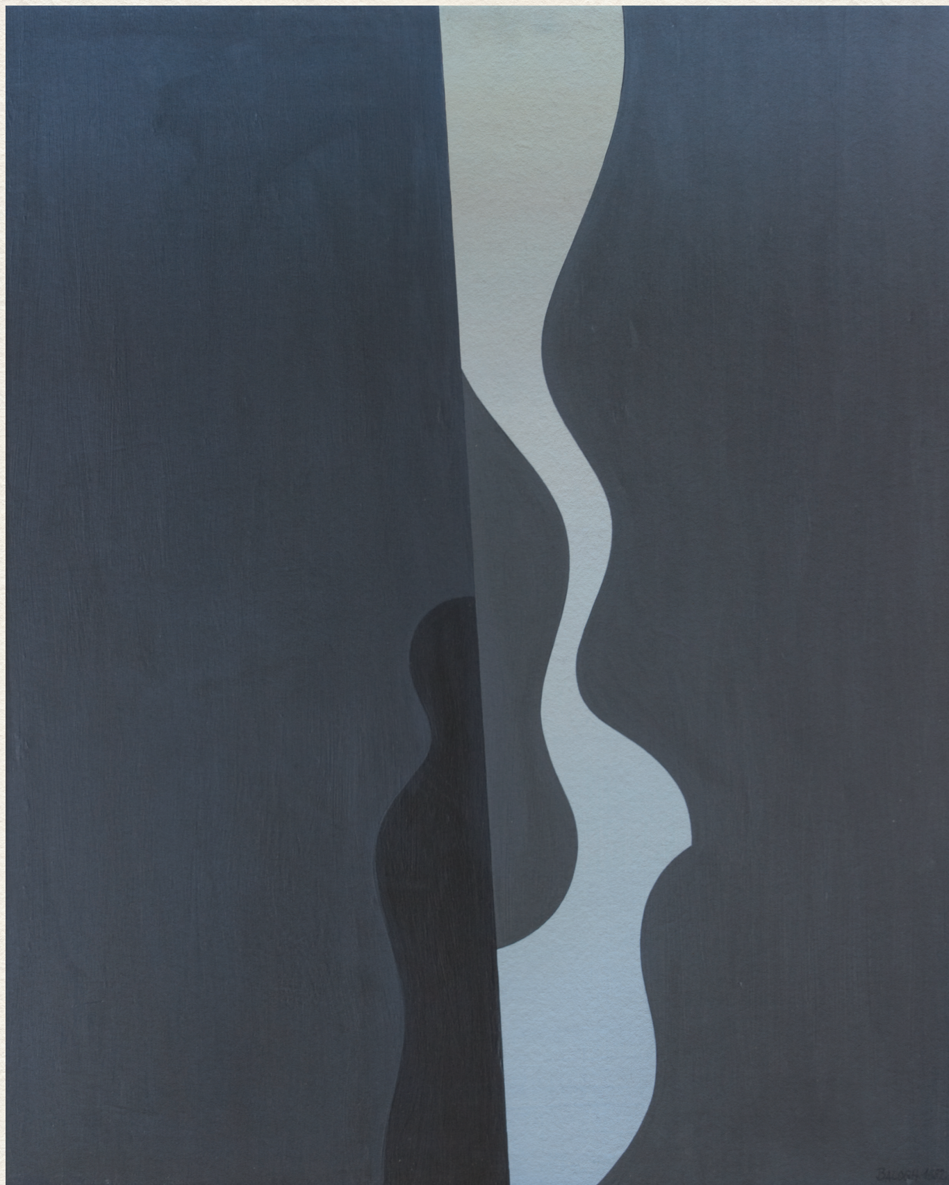
ÉLMOZDULÁS - 1982., fa, akril, 70x57,5 cm