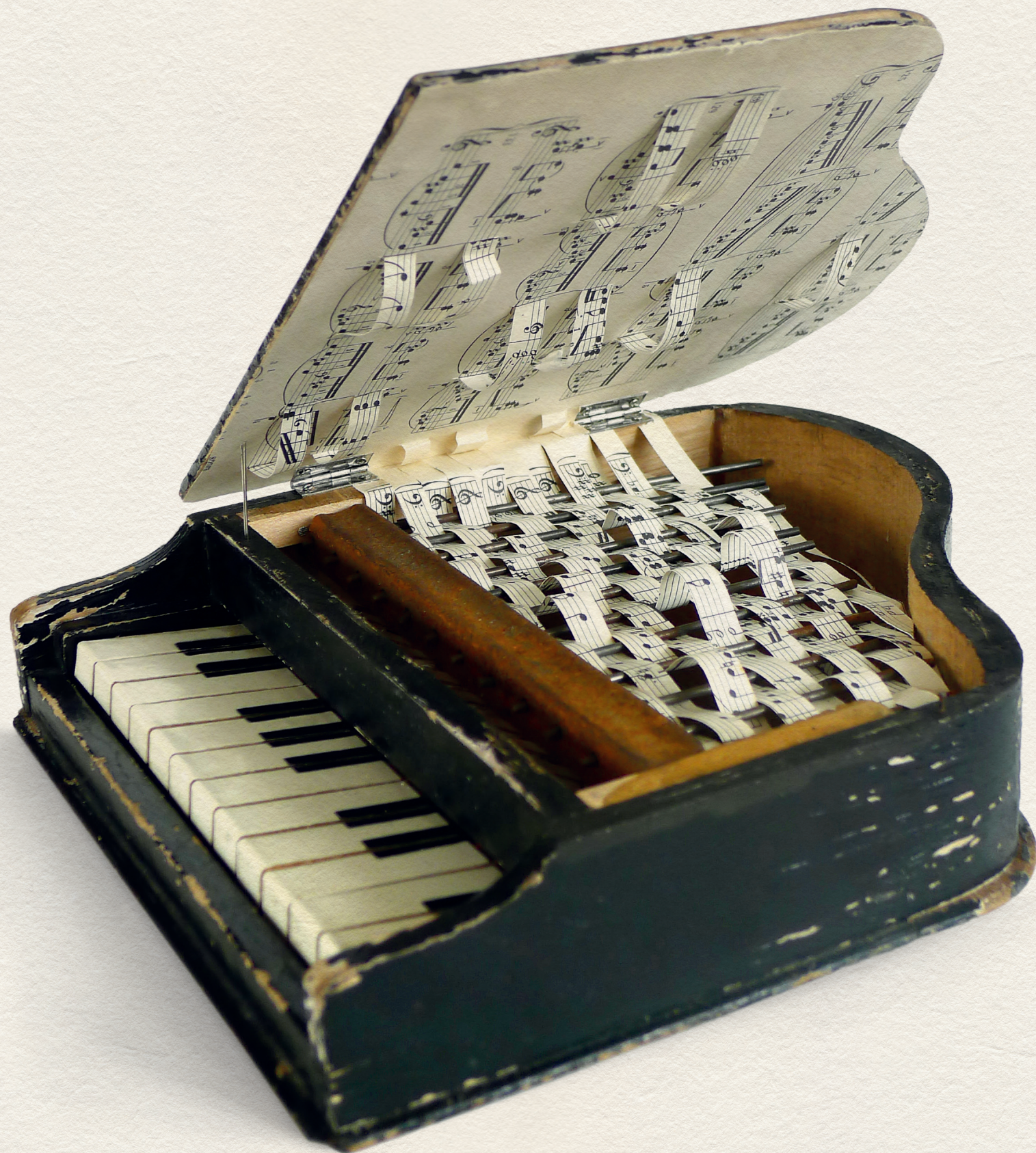
IN MEMORIAM DEBUSSY - 2013., vegyes technika, 310x220 mm