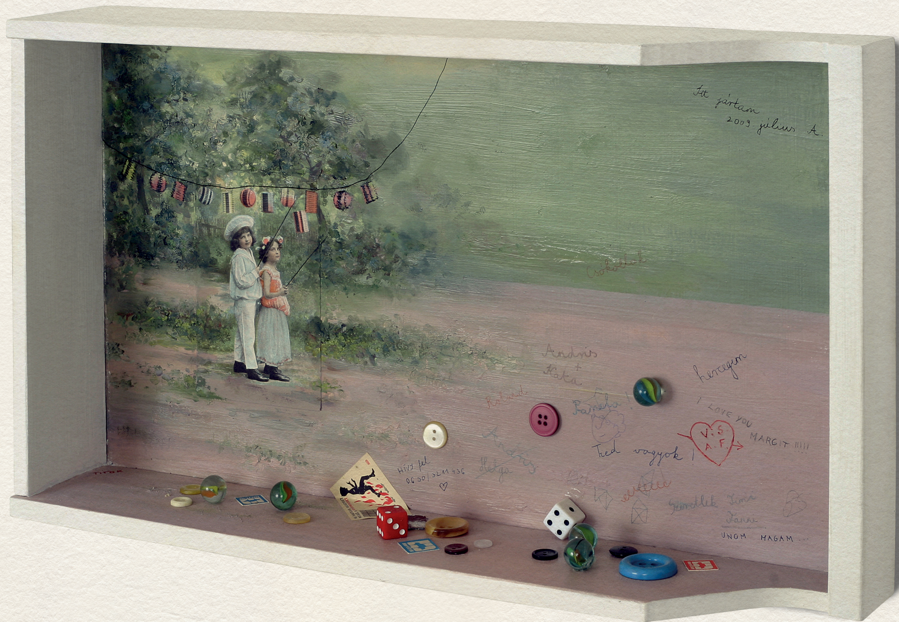
APRÓSÁGOK I - 2013., vegyes technika, 500x285x95 mm