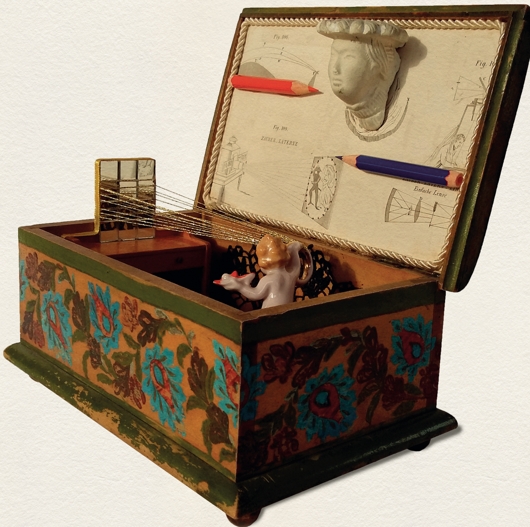
A PAPUCS - 2017., vegyes technika, 100x180x80 mm