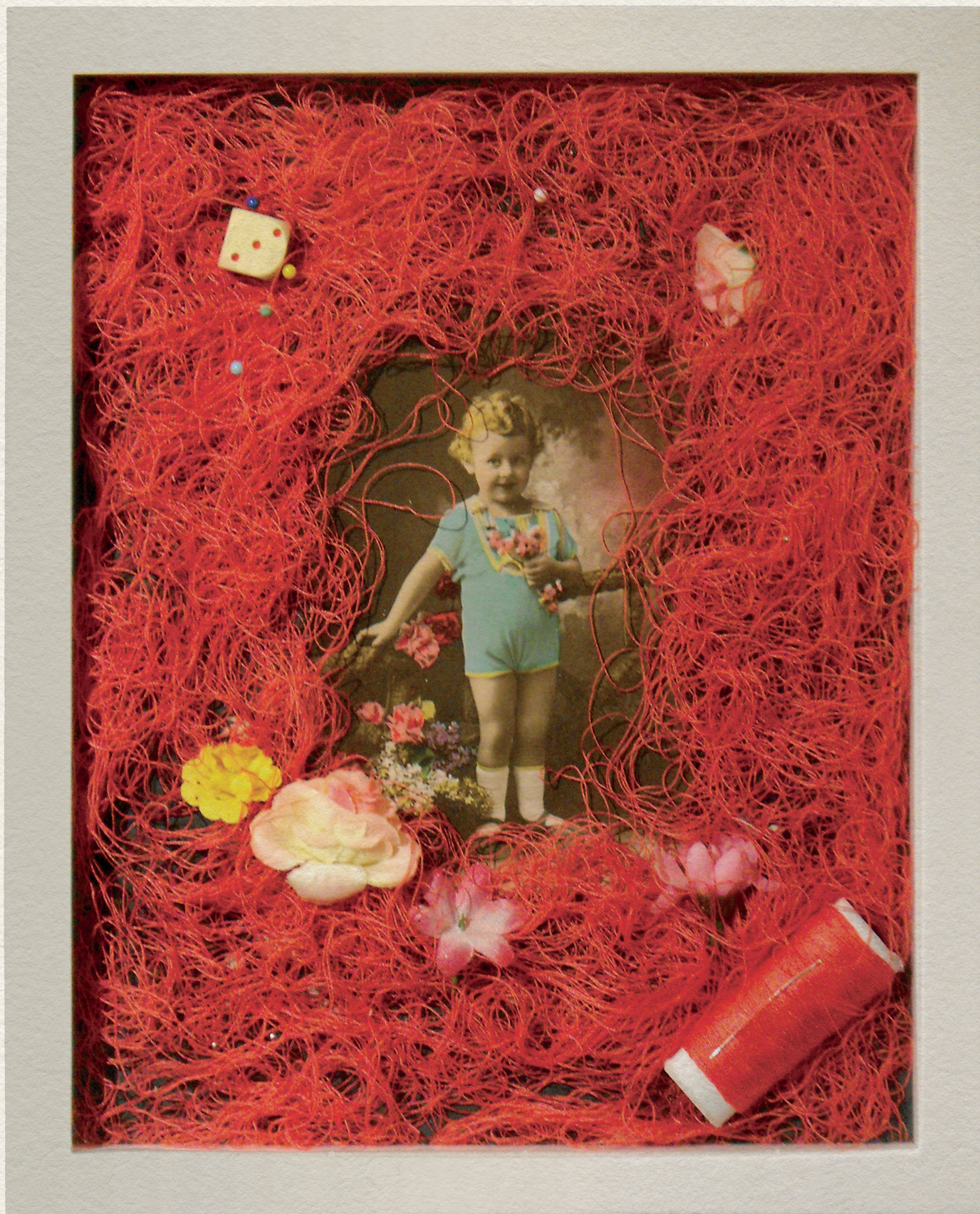
POSTA-LÁDA - DRÁGA HERMINA! - 2010., vegyes technika, 210X300 mm