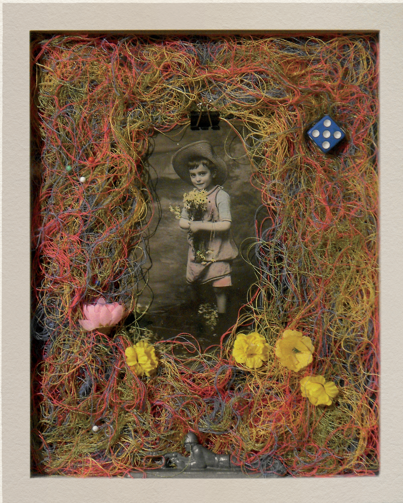
POSTA-LÁDA - DRÁGA LACI! - 2010., vegyes technika, 210x300 mm