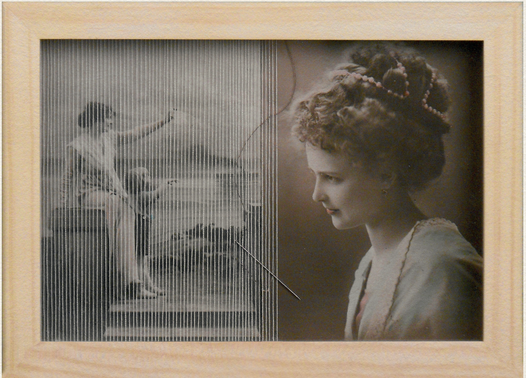
WARHEIT - 2010., vegyes technika, 195x145 mm