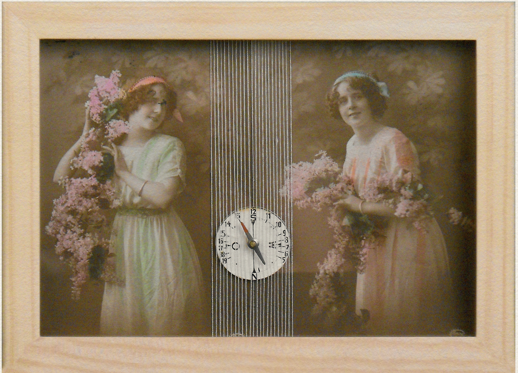
NACHWAHL - 2010., vegyes technika, 195x145 mm