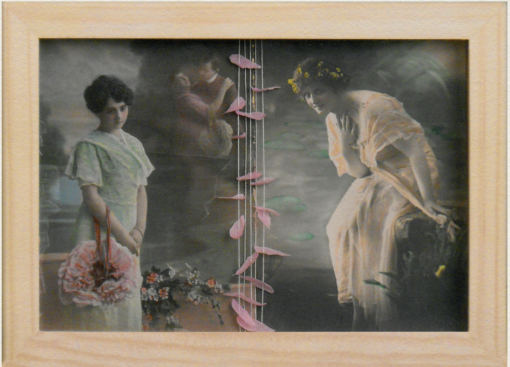
GEHEIMNIS - 2010., vegyes technika, 195x145 mm