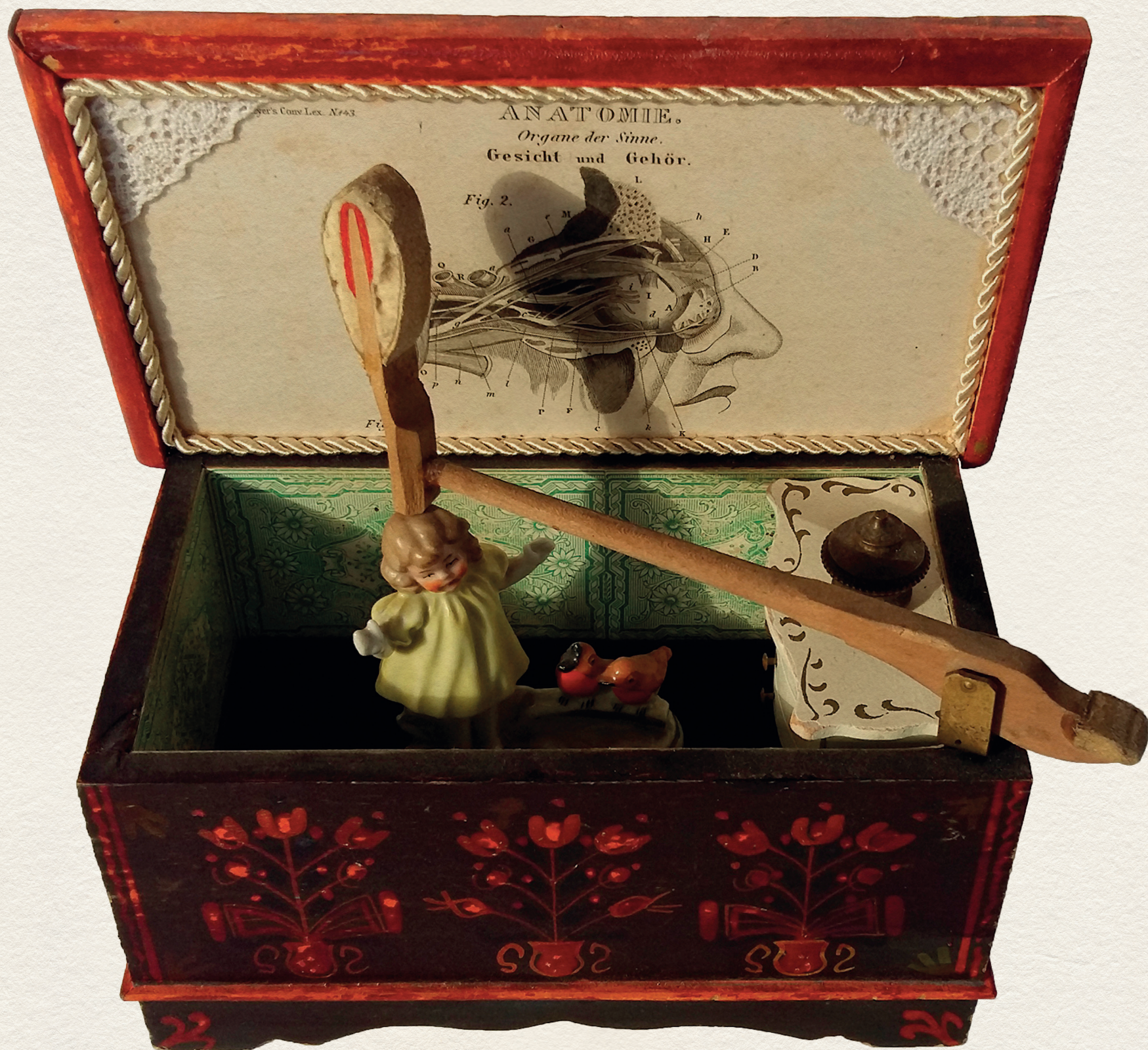
A ZONGORALECKE - 2017., vegyes technika, 80x160x50 mm