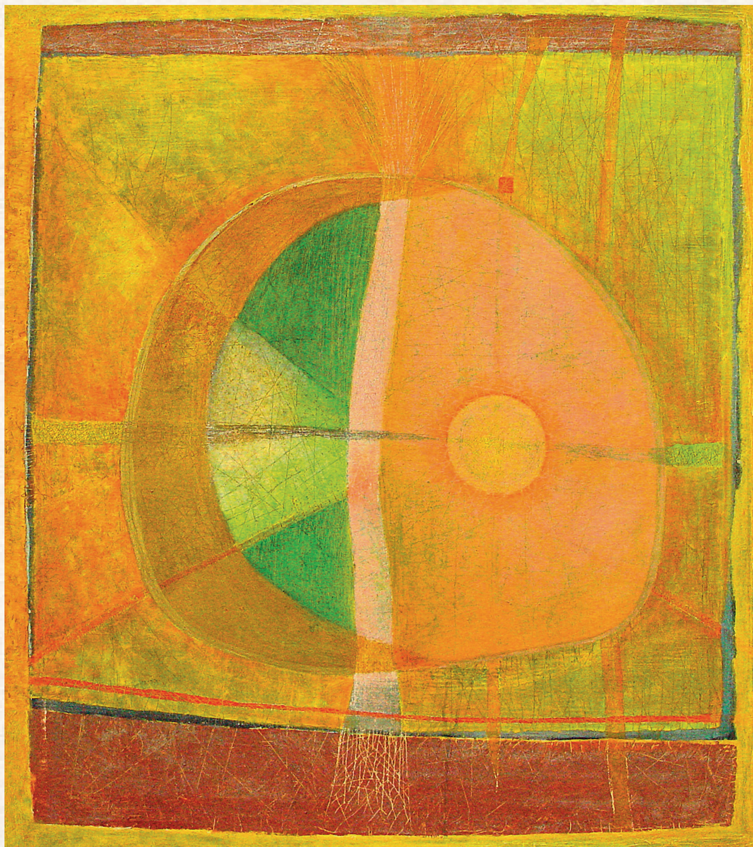
SZITAPÉNTEK-DOBSZERDA - 2001., vászon, olaj, 90x100 cm