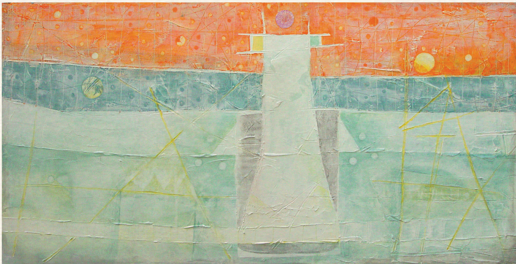
ÉPÍTIK AZ ÉGBOLTOT - 2003., vászon, olaj, 50x100 cm