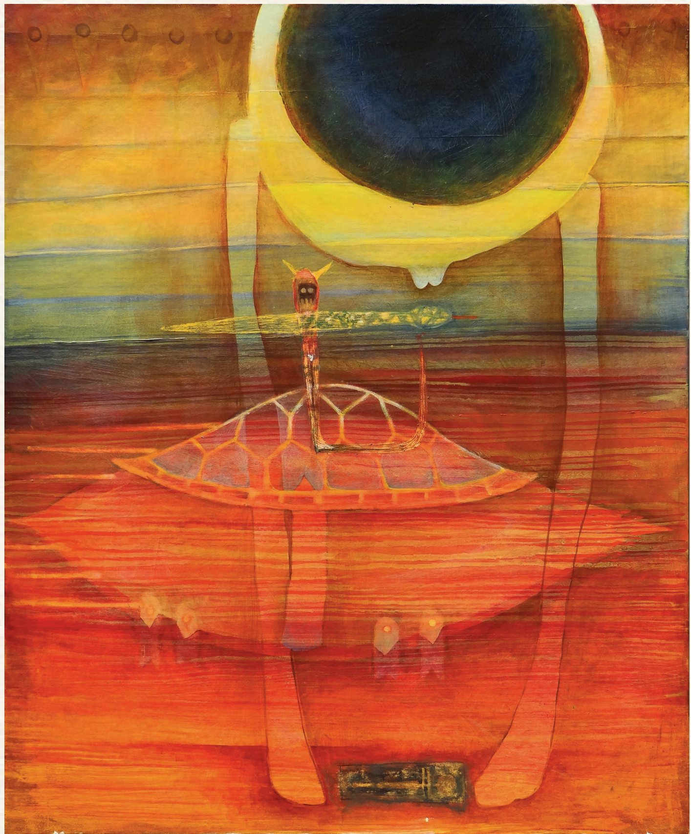
OZÍRISZ ÁLMA - 2016., vászon, akril, 100x80 cm