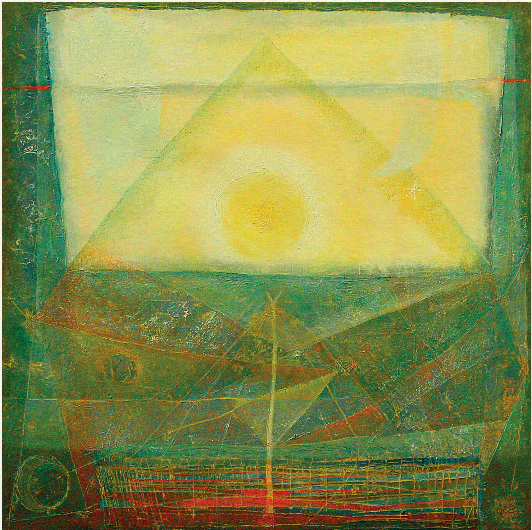
DECEMBER 21., 2001. - 2001., vászon, olaj, 80x80 cm