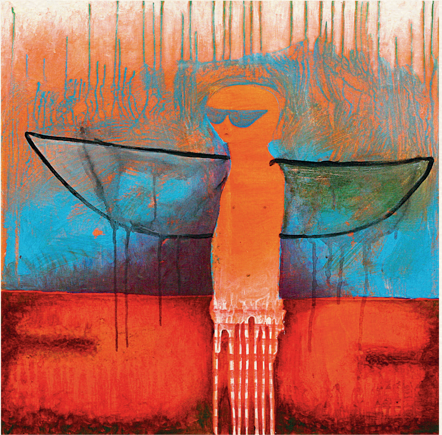
SÁVOK - 2007., vászon, olaj, 70x70 cm