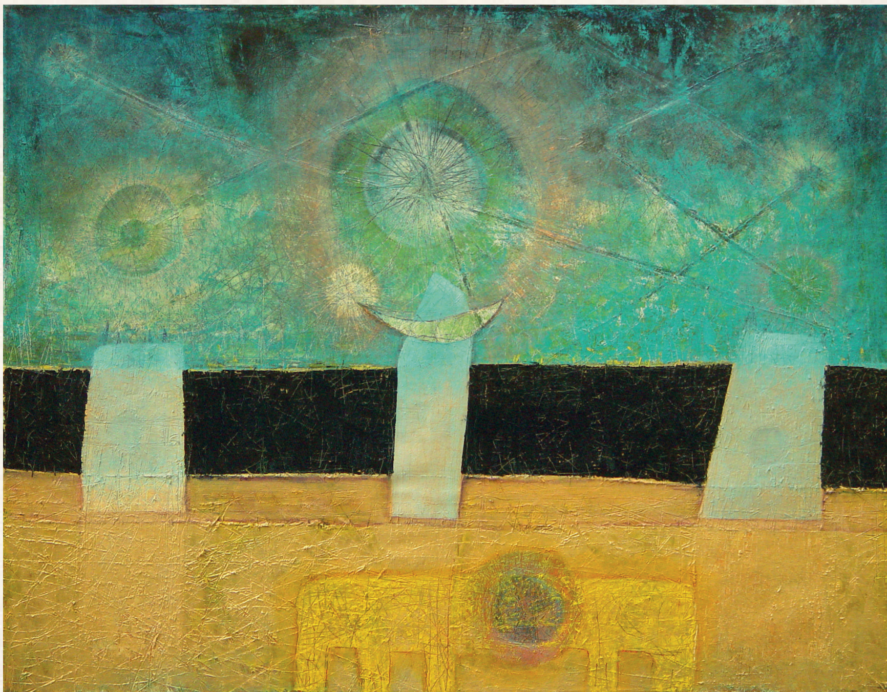
OROSZLÁNOK CSILLAG-KÉP-BEN - 2002., vászon, olaj, 90x70 cm