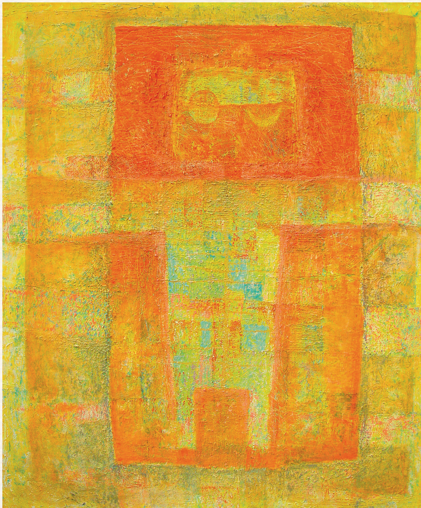
LÉLEK LÉP A LAJTORJÁN - 2000., vászon, olaj, 100x120 cm