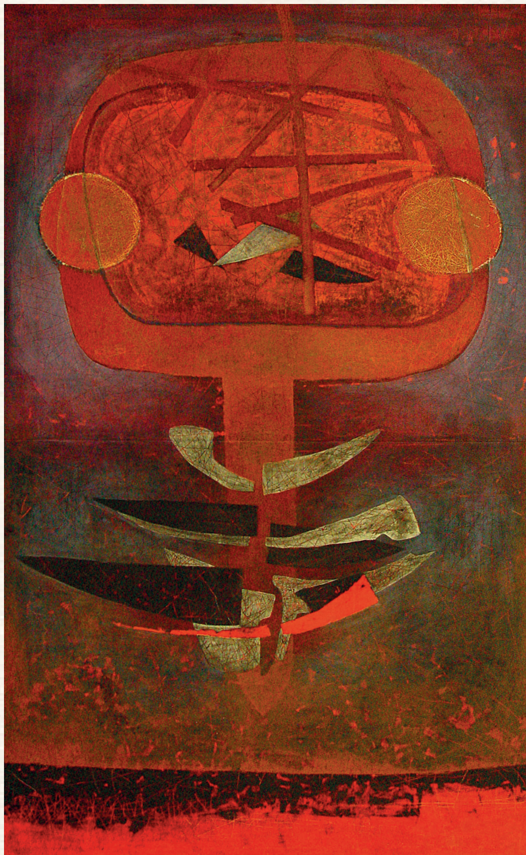
ORIENT - 2003., vászon, olaj, 200x120 cm