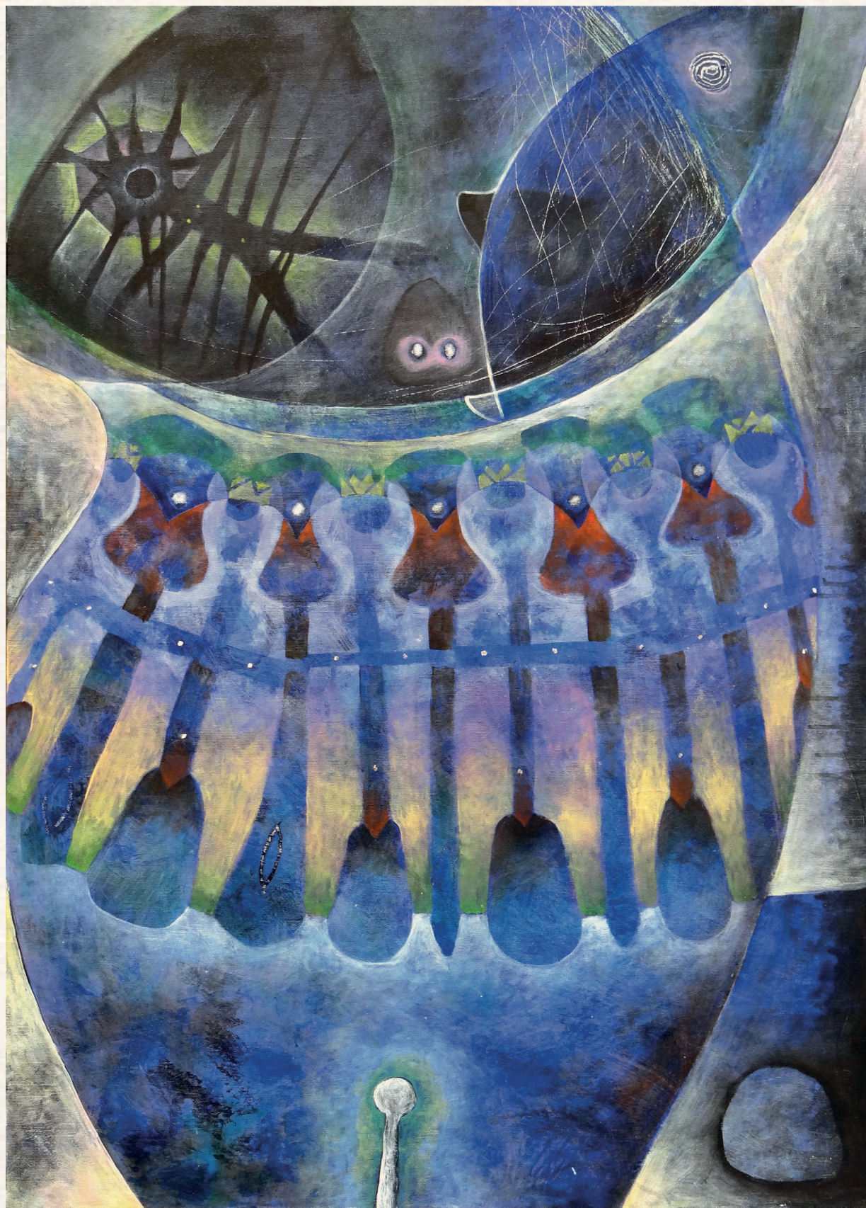
Víz - 2016., vászon, akril, 100x80 cm