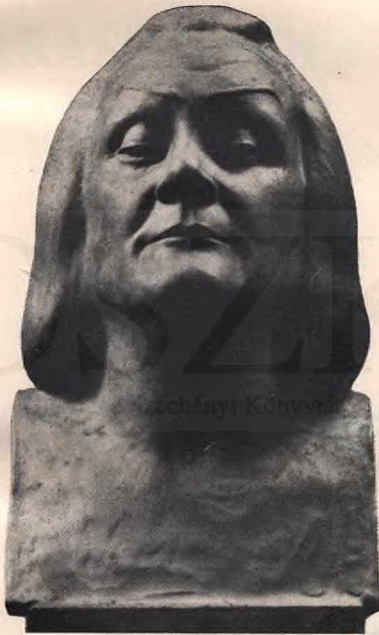
A parasztpróféta, Ruotsalainen Pál szobra. Alpo Sailo műve.