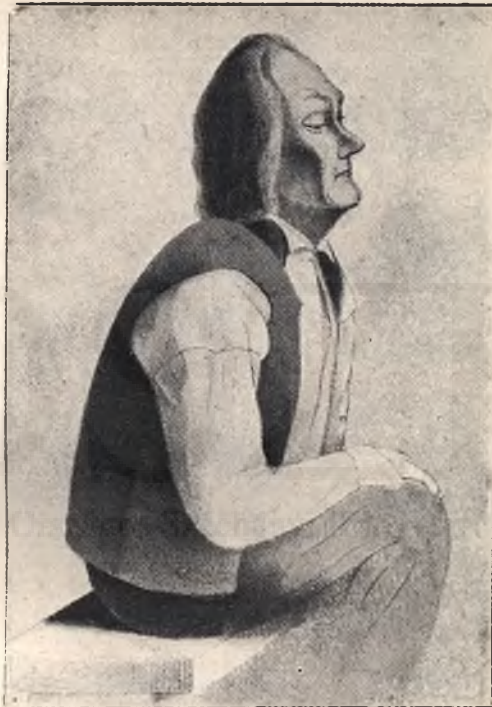
Ruotsalainen Pál. Egykorú rajz.