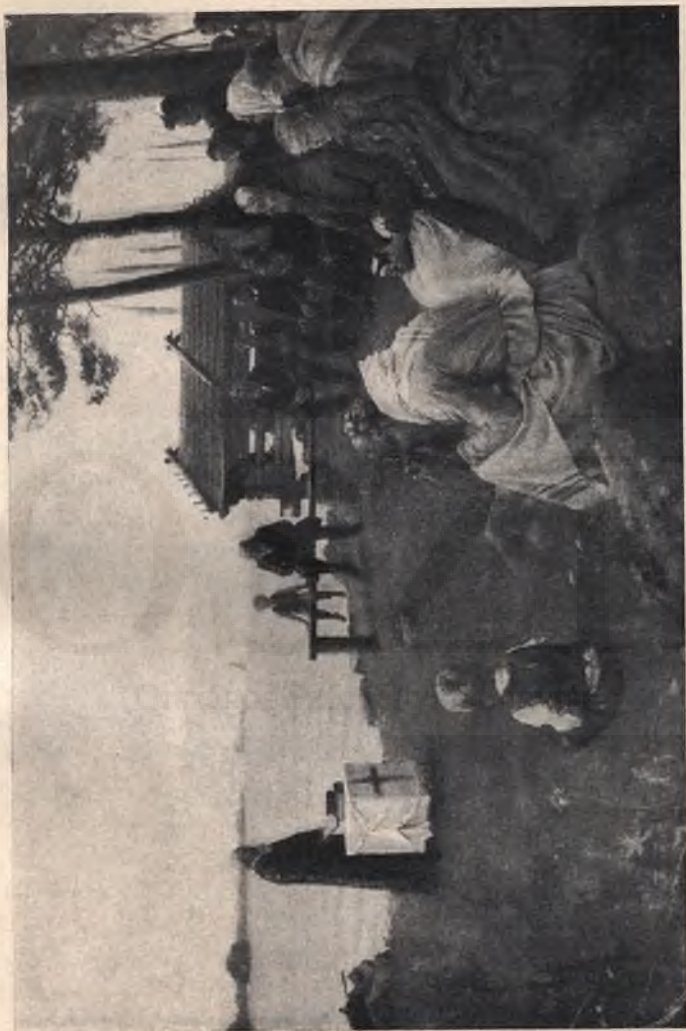
Edelfelt Albert: Istentisztelet a tó partján.