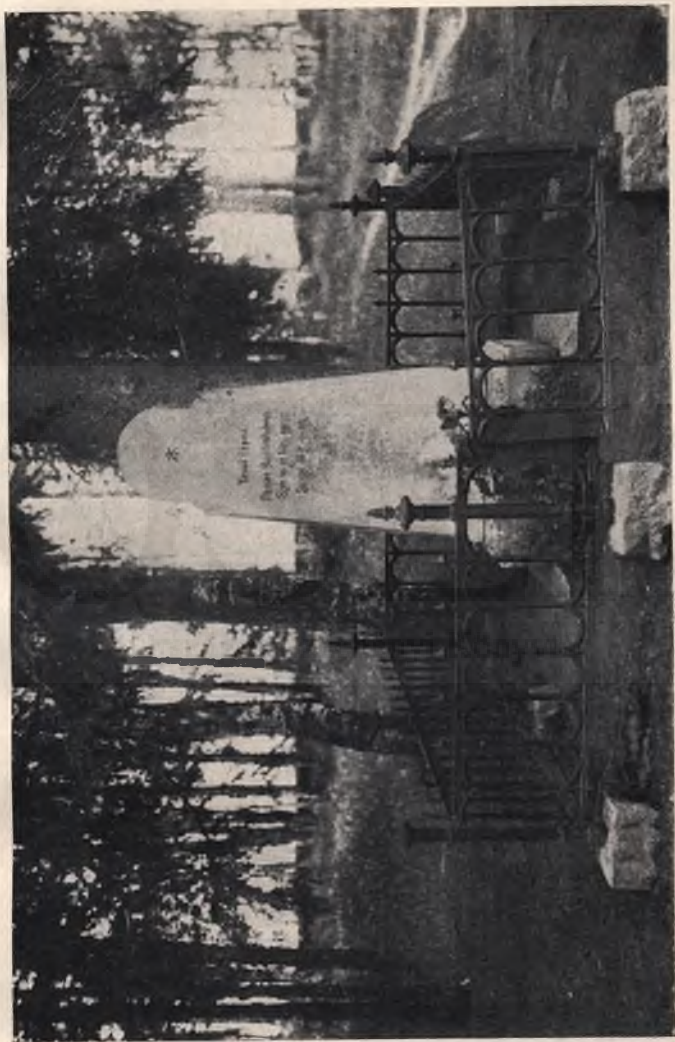
Ruotsalainen Pál sírja a milsiái temetőben.