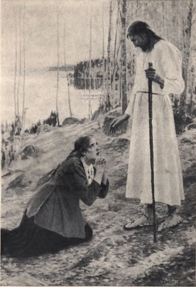
Edelfelt Albert: Krisztus és Mária Magdaléna.