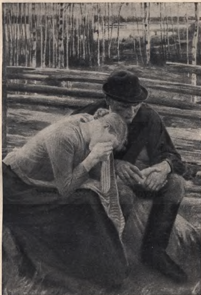
Edelfelt Albert: Szomorúság.