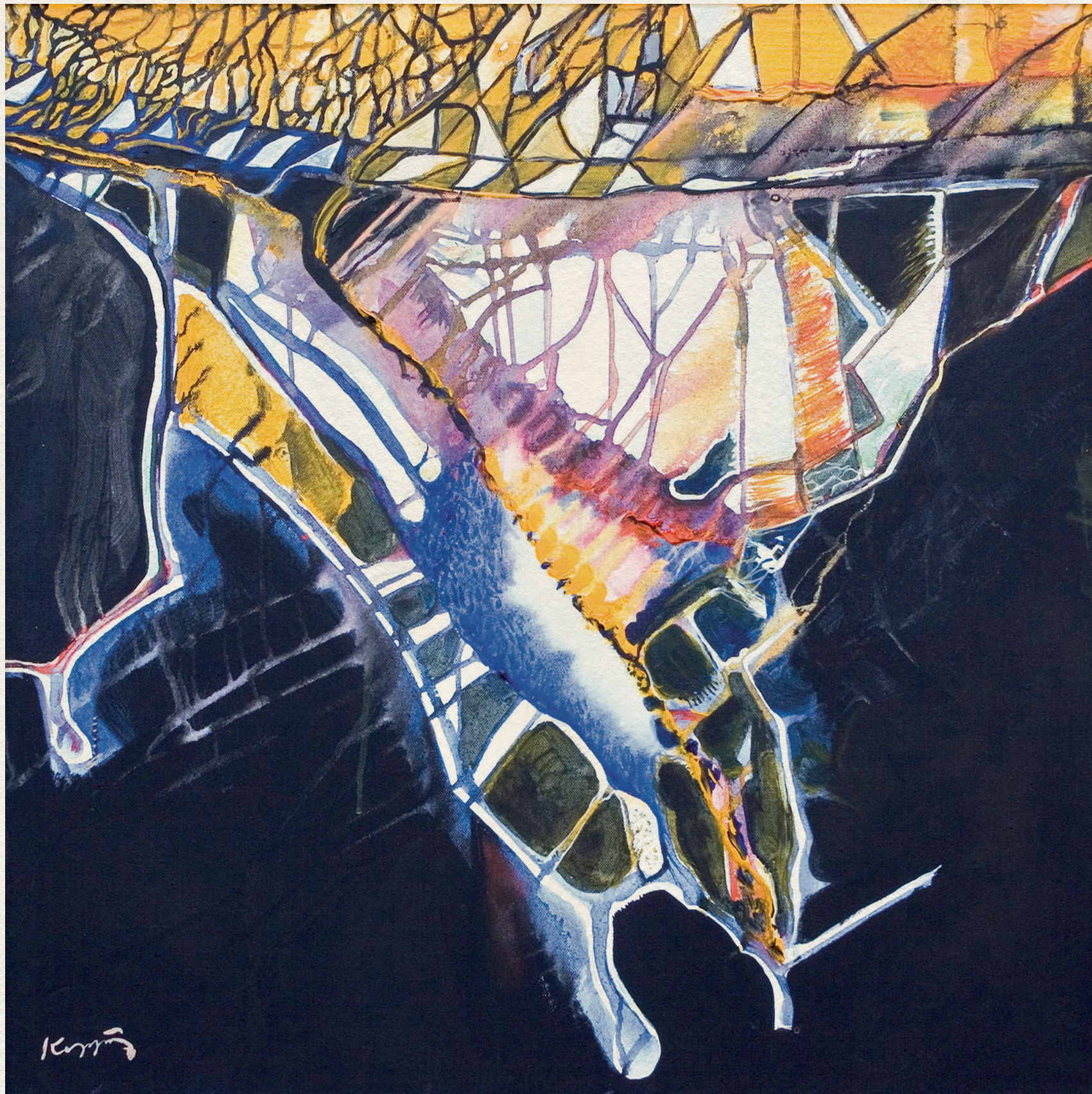
MERÜLÉS - 2005., vászon, akril, 70x70 cm