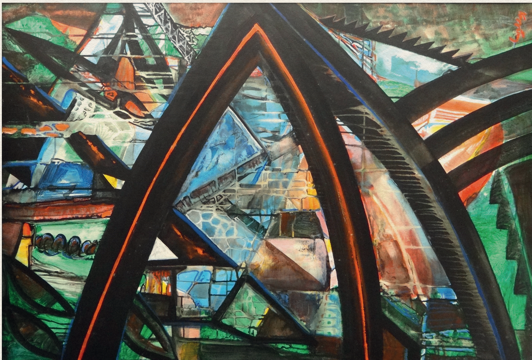
TITANIC - 2005., vászon, akril, 120x80 cm