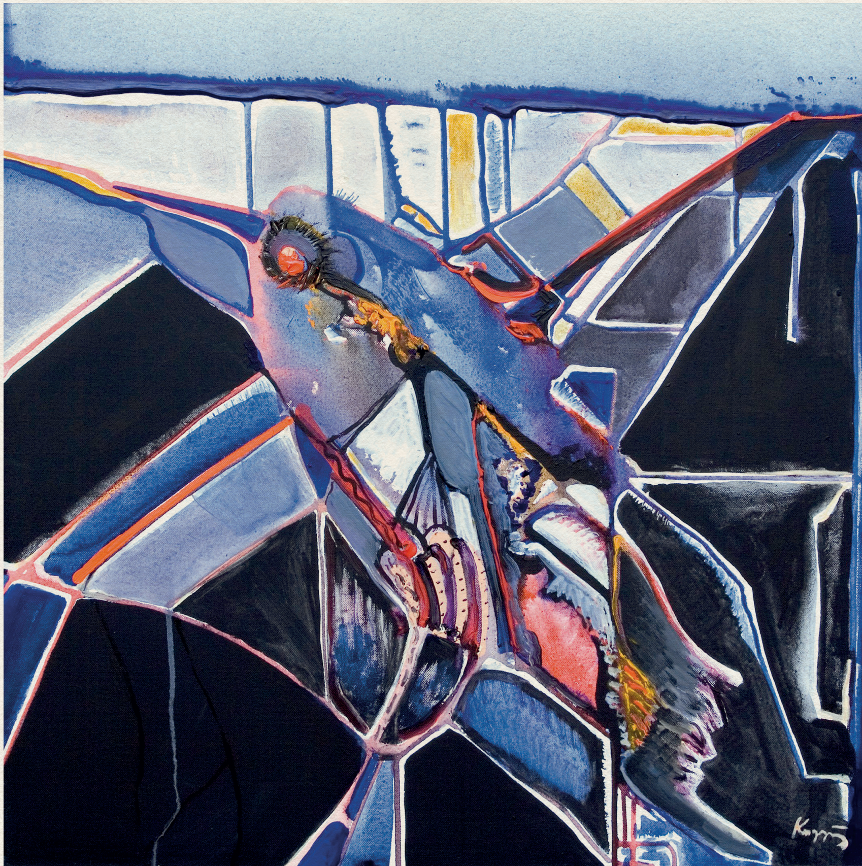
JÉGMADÁR - 2005., vászon, akril, 70x70 cm