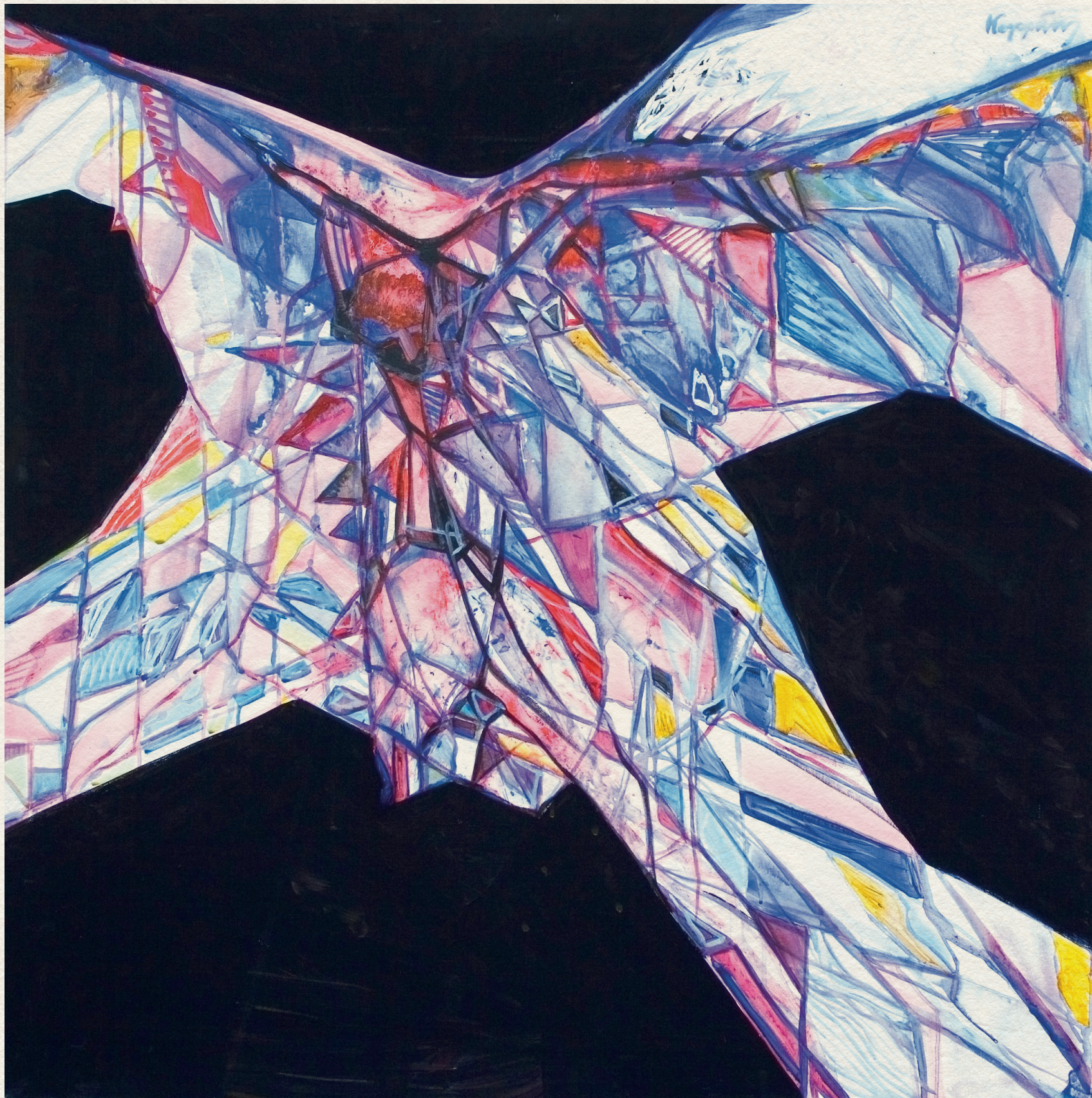
A GÉNIUSZ SZÜLETÉSE - 2006., vászon, akril, 100x100 cm