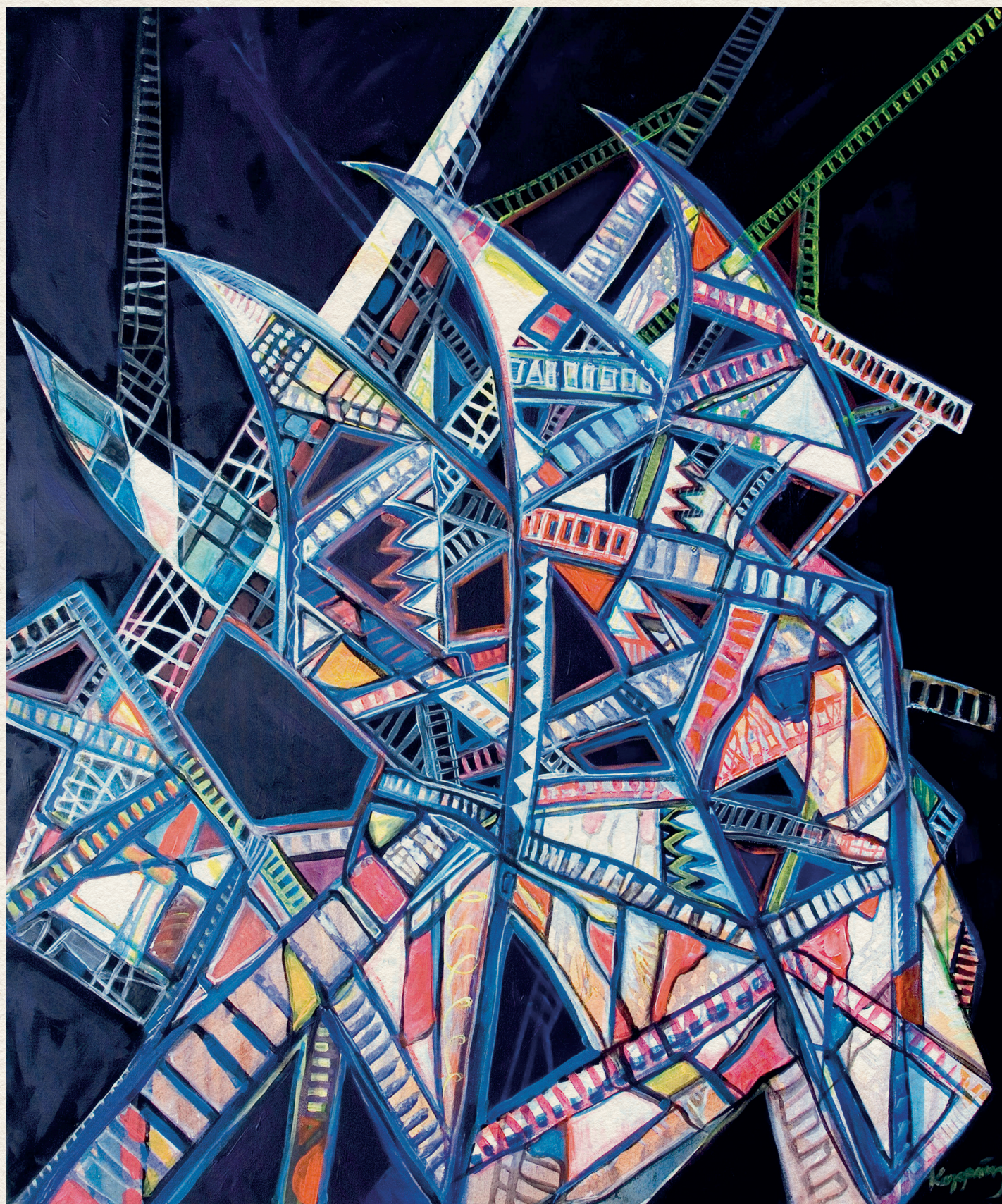
JÁKOB LÉTRÁI - 2007., vászon, akril, 120x100 cm