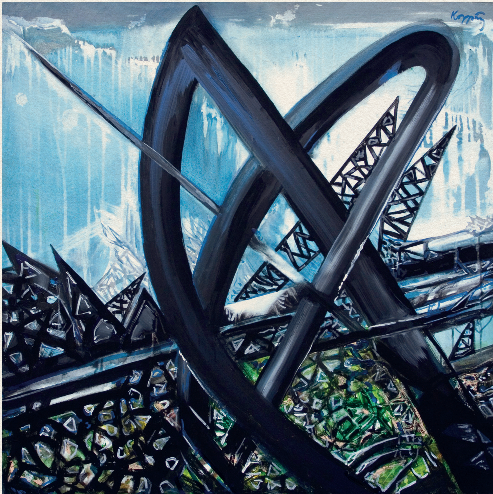
A JÖVŐ EMLÉKEI I. - 2006., vászon, akril