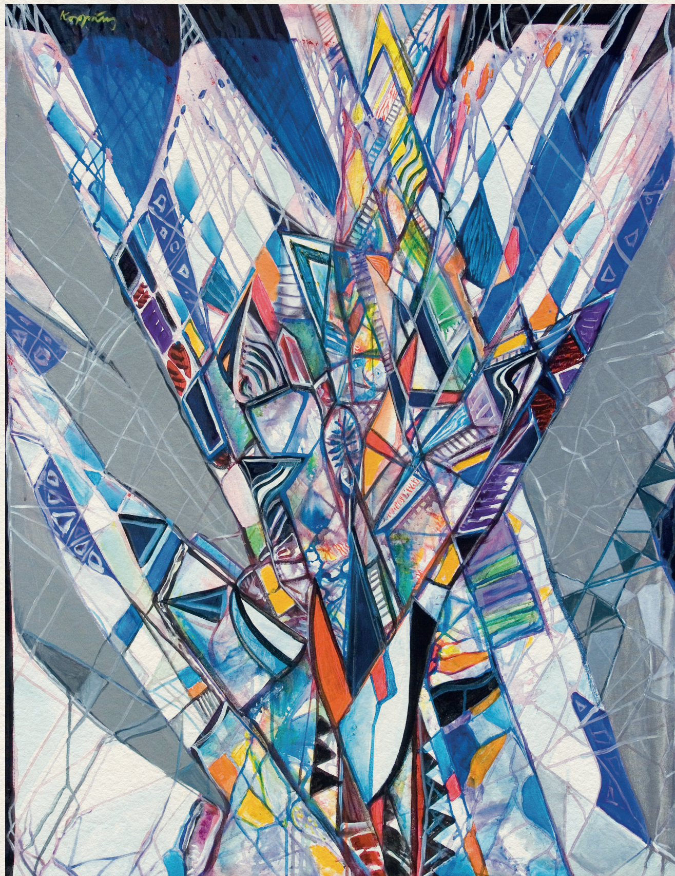
G. A. ÚR X-BEN - 2007., vászon, akril, 120x100 cm