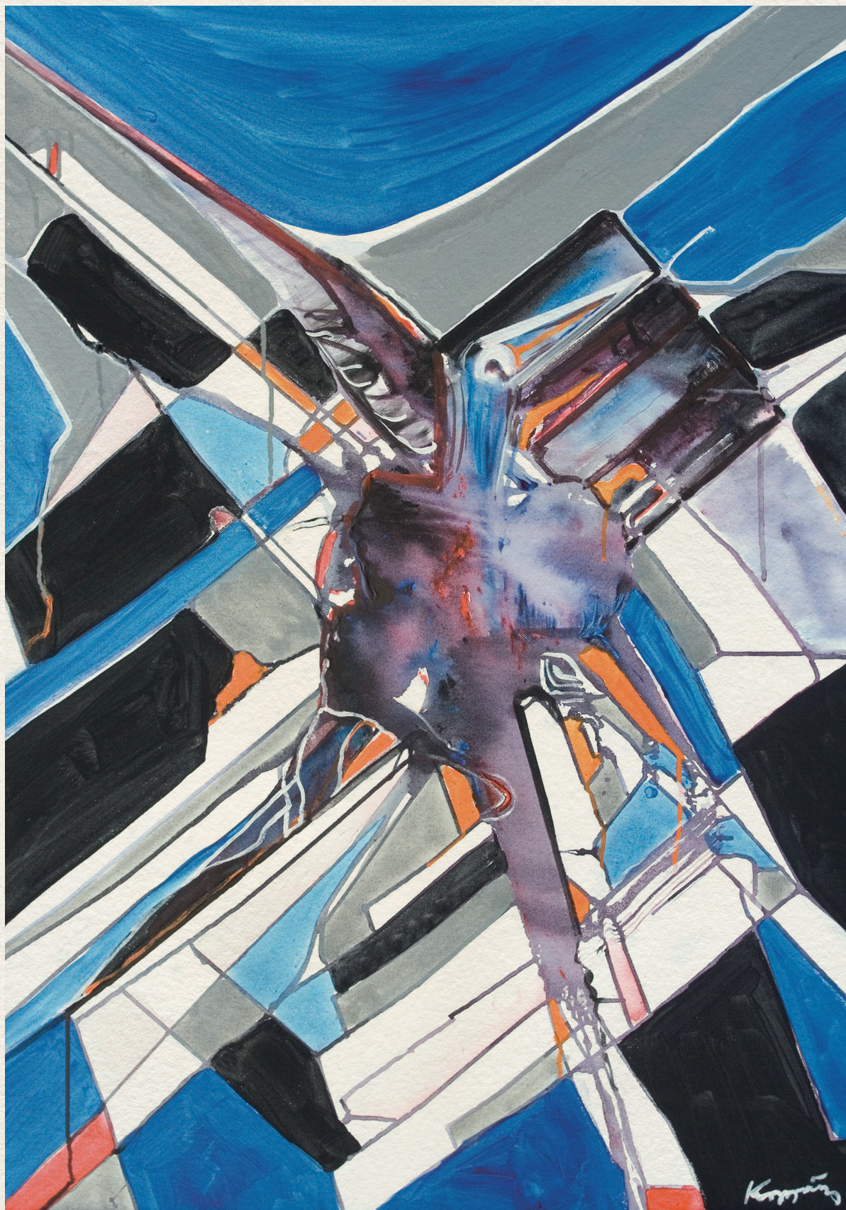
DEAD BIRD - 2008., vászon, akril, 100x70 cm