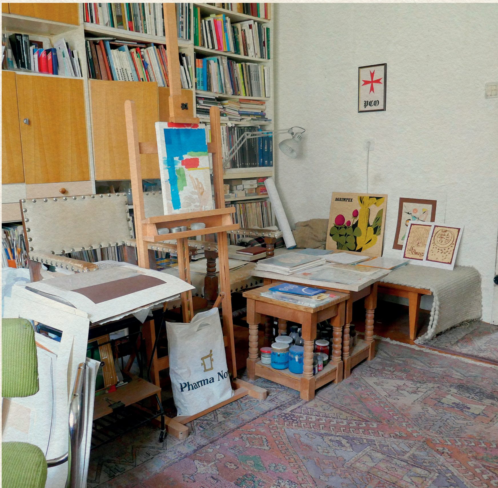
SZEKERES ISTVÁN MŰTERMÉBEN - 2018.