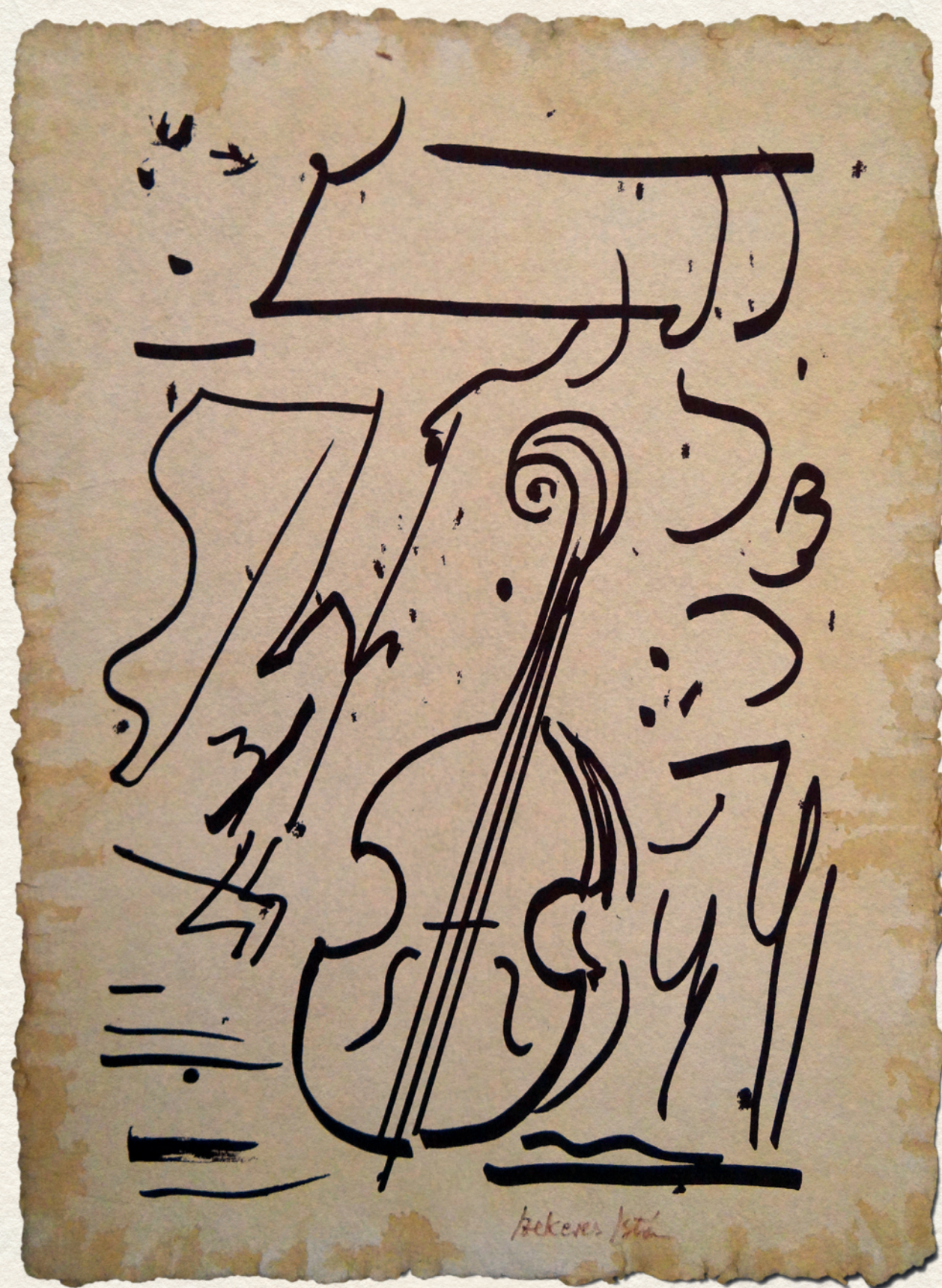
HEGEDŰ – merített papír, tus, 44x32 cm