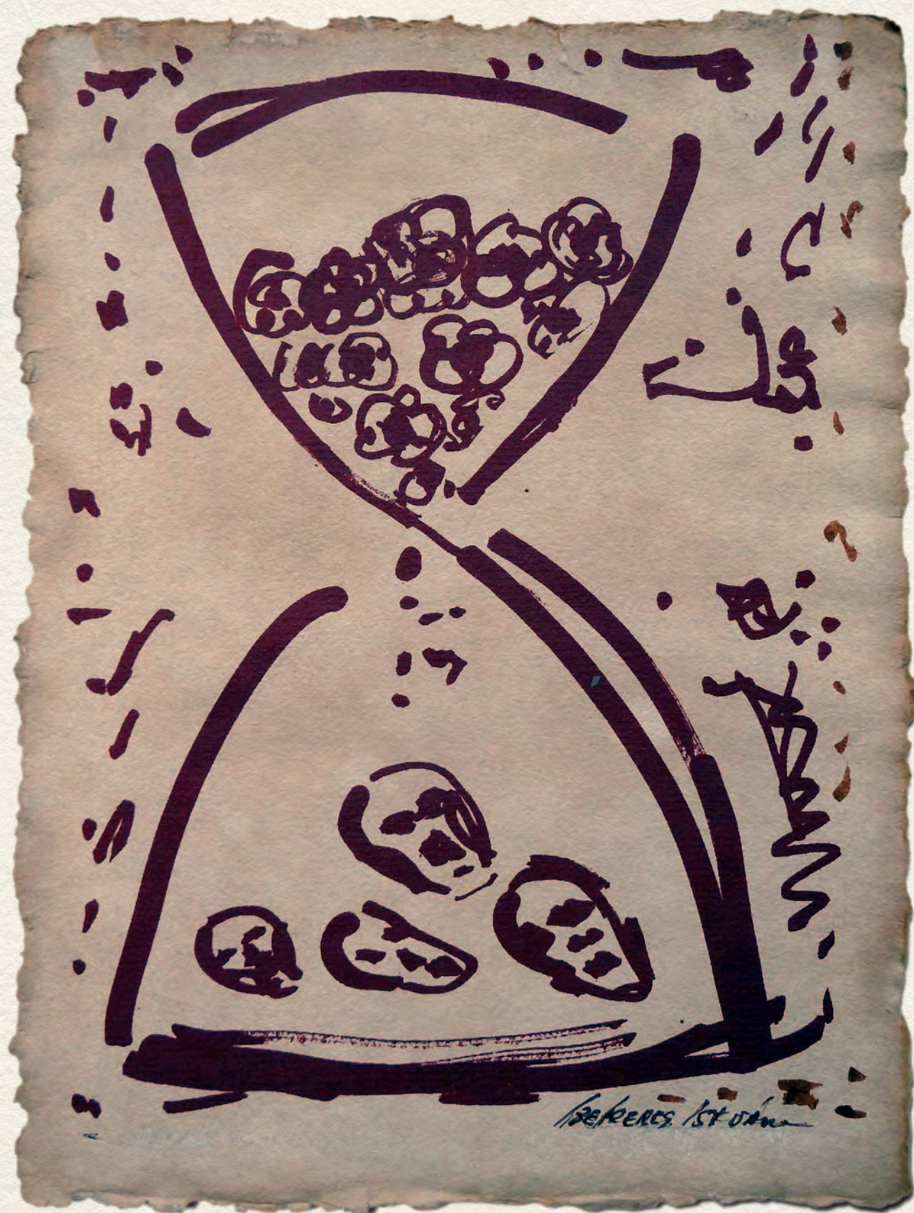
HOMOKÓRA – papír, vegyes, 44x32 cm