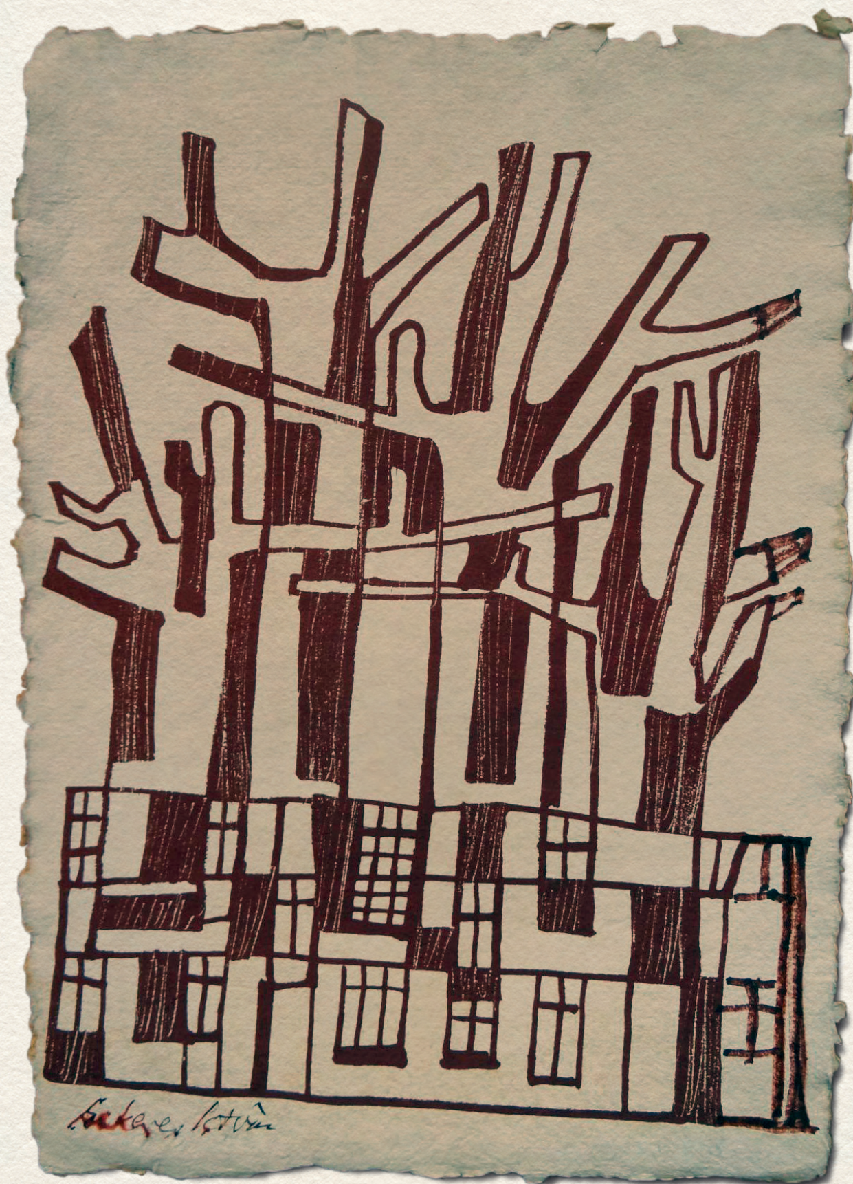
BESZORÍTVÁ – merített papír, tus, 44x32 cm