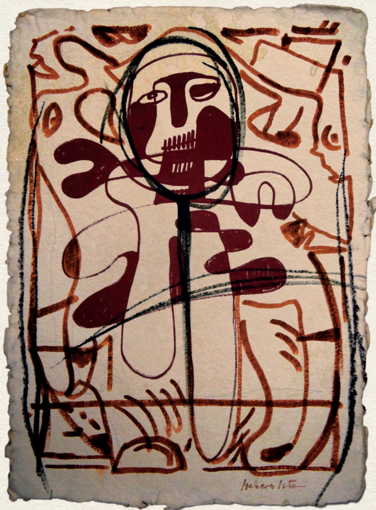
ÚRI VILÁG – 2008., merített papír, tus, 44x32 cm