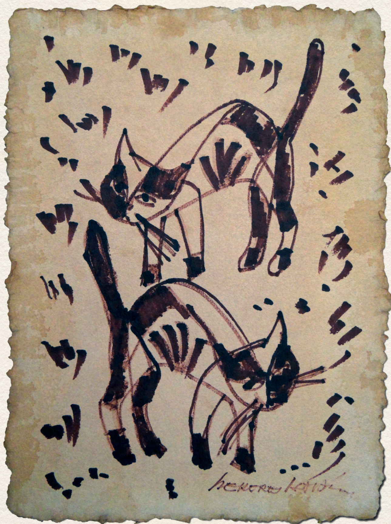
MIAU-MIAÚ – merített papír, tus, 43x21 cm