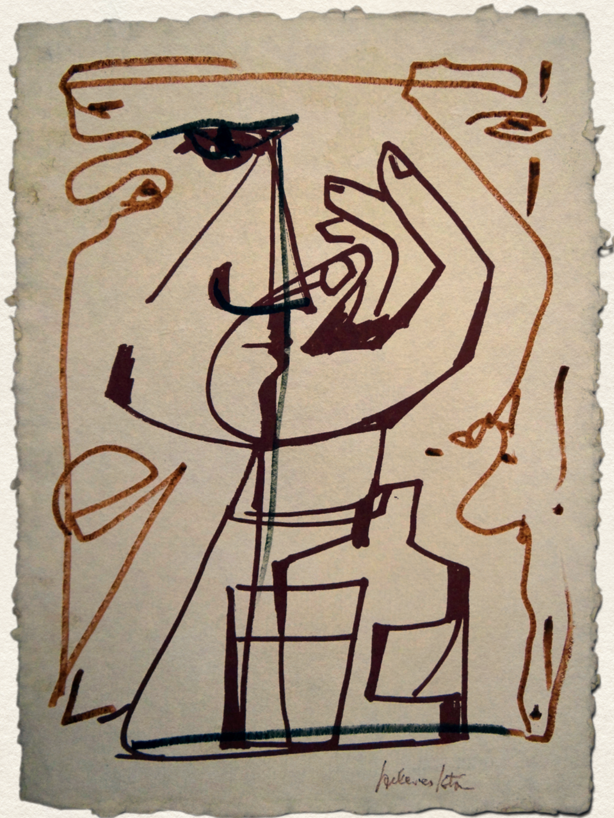
SZEKERES ISTVÁN GRAFIKUSMŰVÉSZ, TERVEZŐGRAFIKUS KÖTETE - 2019.