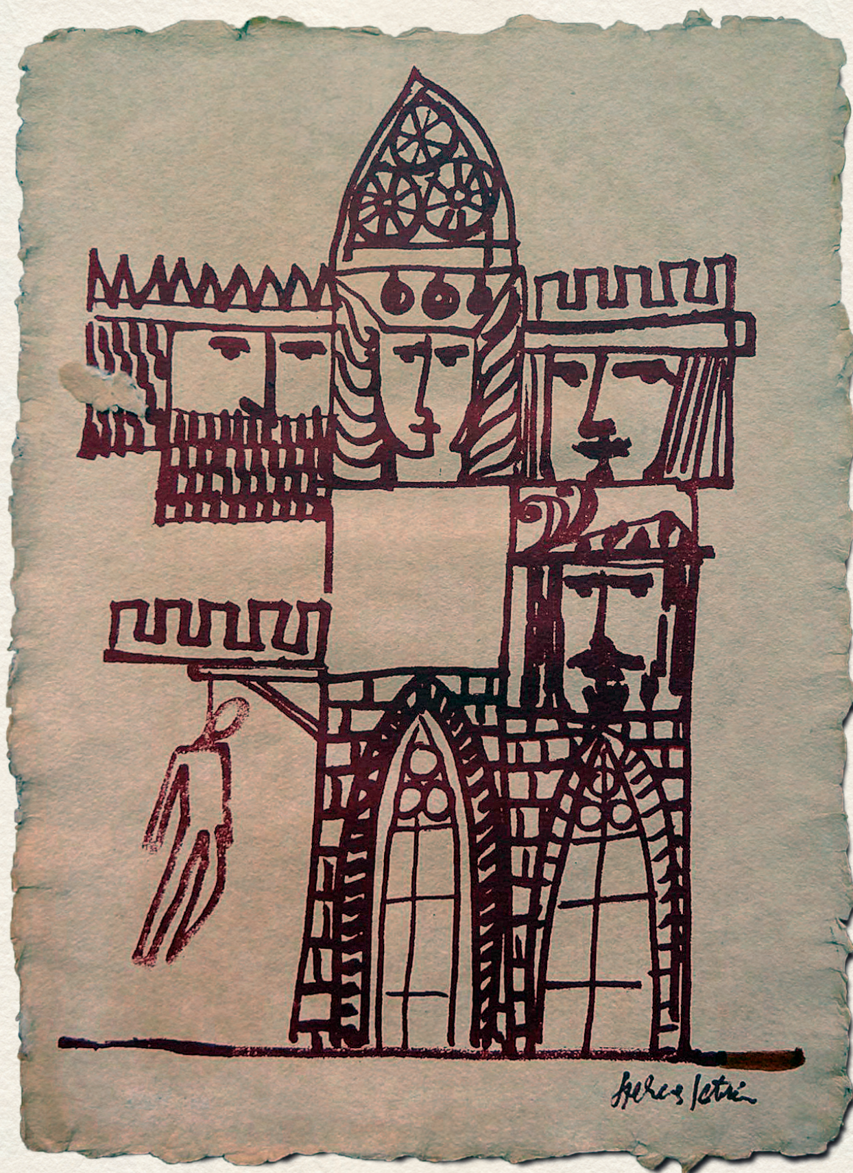
VÁRUDVAR – papír, vegyes, 44x32 cm