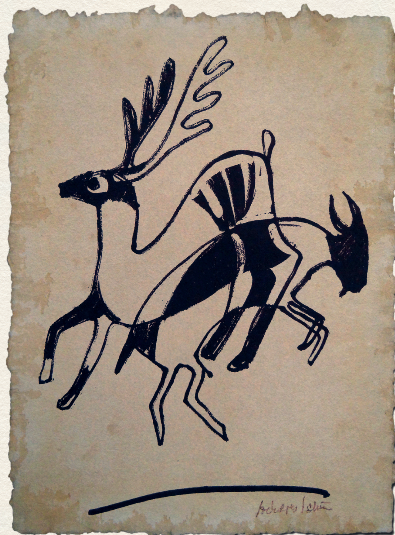
KARAKTEREK – merített papír, tus, 44x32cm