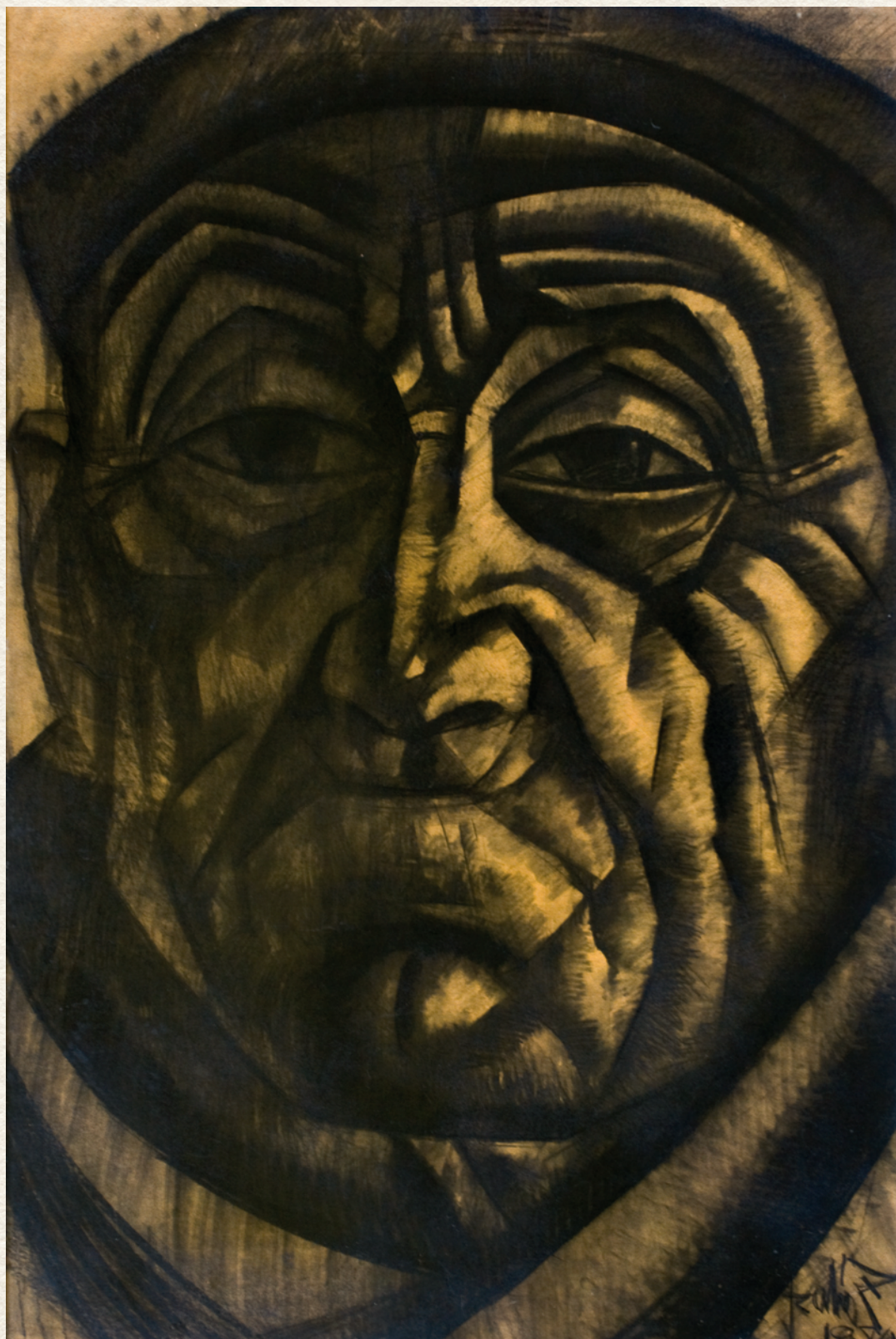
APÁM - 1970., karton, szénrajz, 130x110 cm