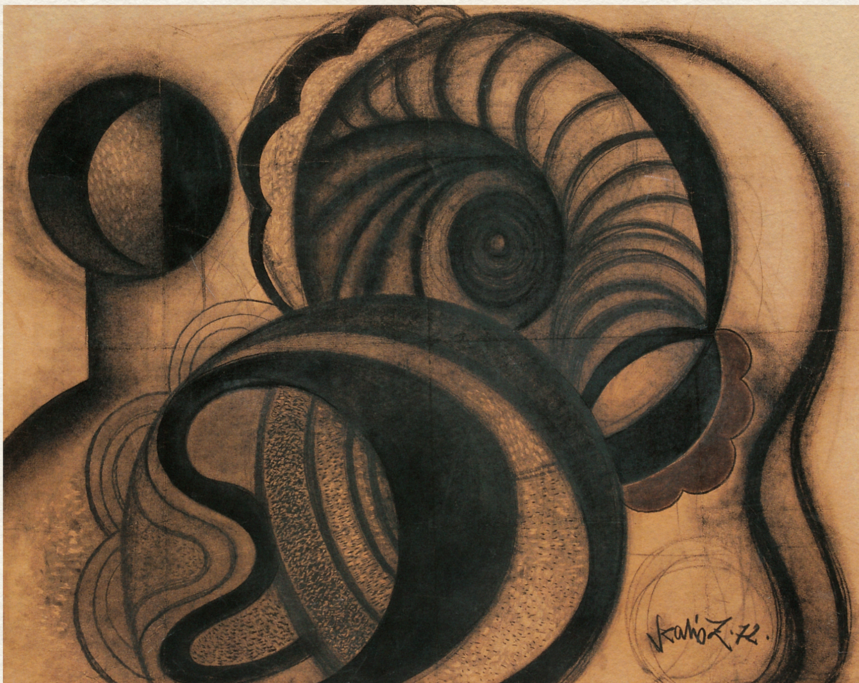
KOMPOZÍCIÓ - 1972., papír, pasztell, 100x130 cm