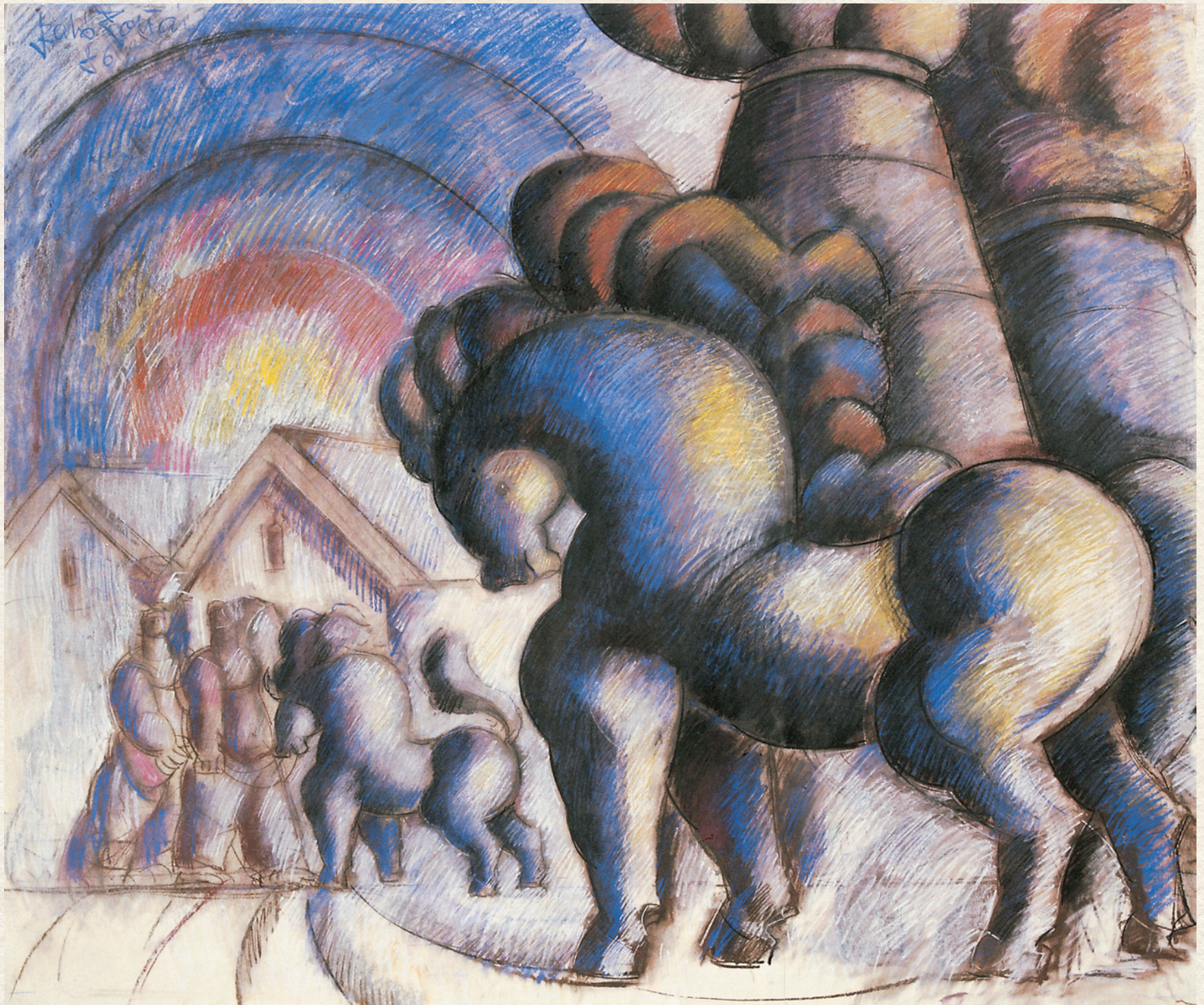
LOVAK GYÁRKÉMÉNNYEL - 1986., papír, pasztell, 120x150 cm