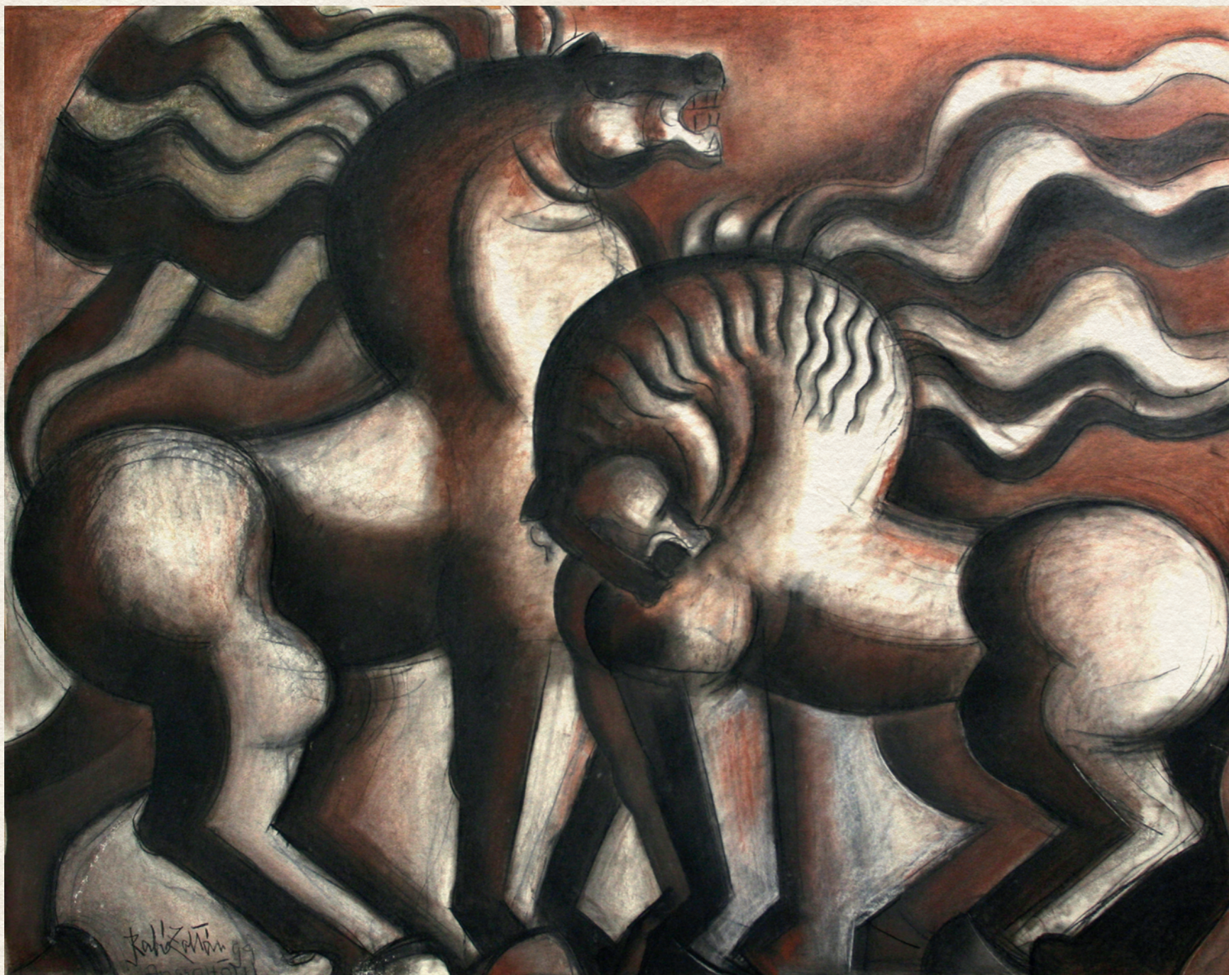
HÁBORGÓ LOVAK - 1999., papír, pasztell, 130x157 cm