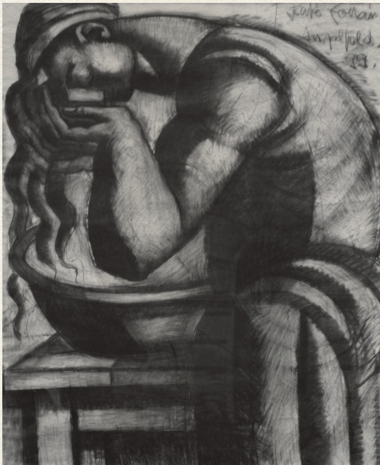
MOSAKODÓ - 1999., papír, pasztell, 157x130 cm