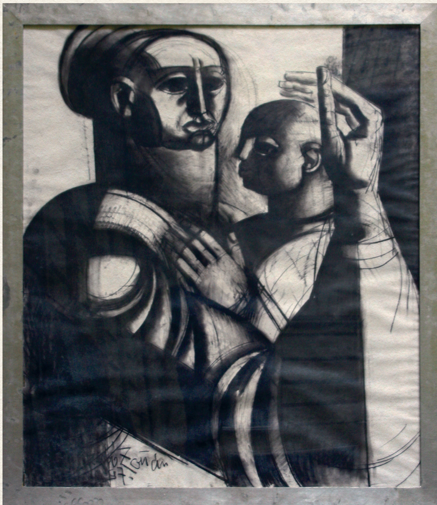
ANYA ÉS GYERMEKE - 1997., papír, pasztell, 157x134 cm