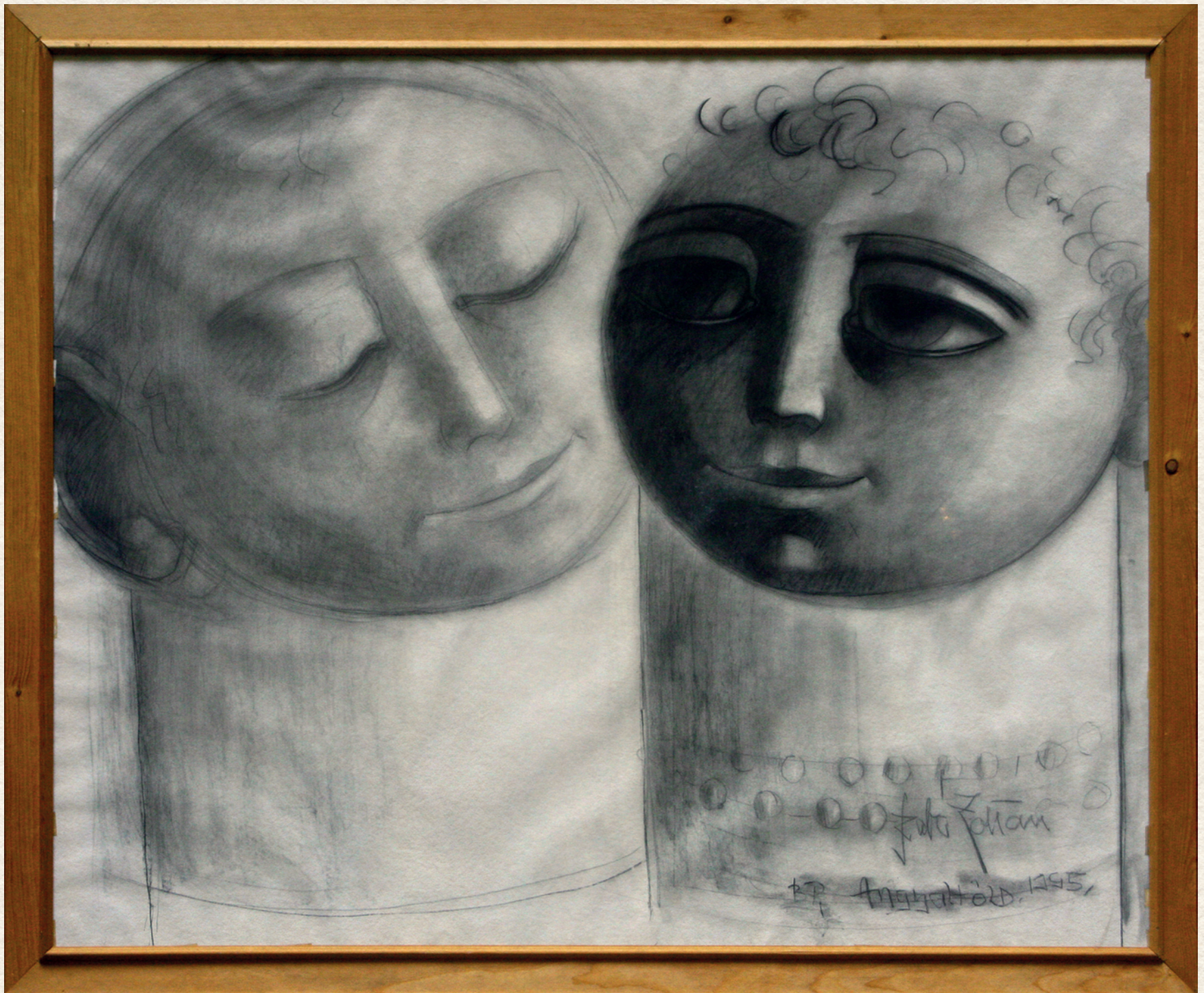
FEJEK - 1995., papír, pasztell, 128x157 cm