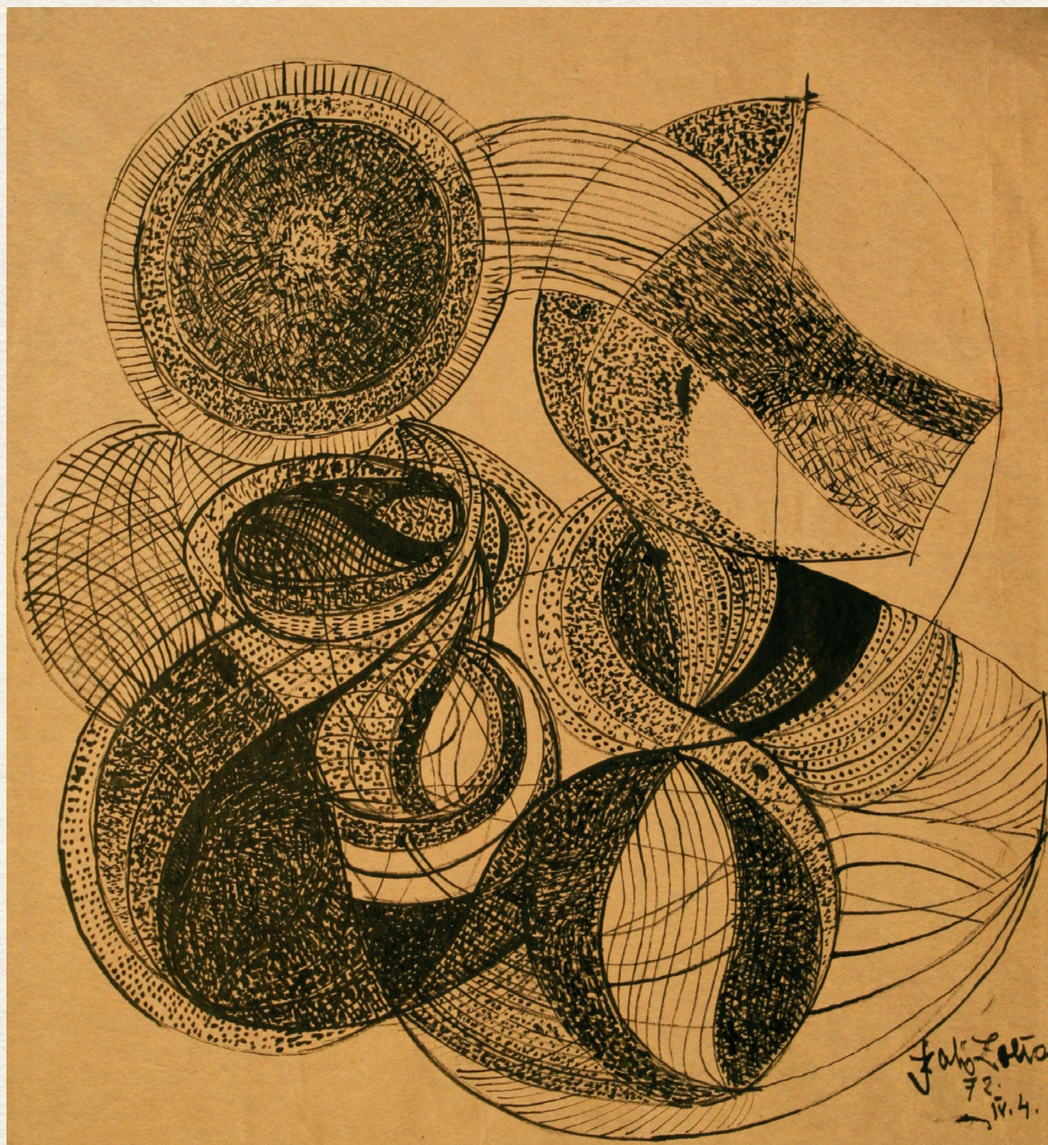
HÁLÓZATOS FORMÁK - 1972., papír, pasztell, 44x41 cm