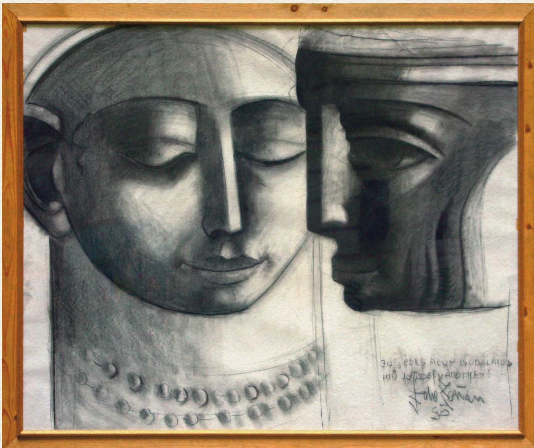
JÖJJ ÉDES ÁLOM - 1995., papír, pasztell, 129x157 cm