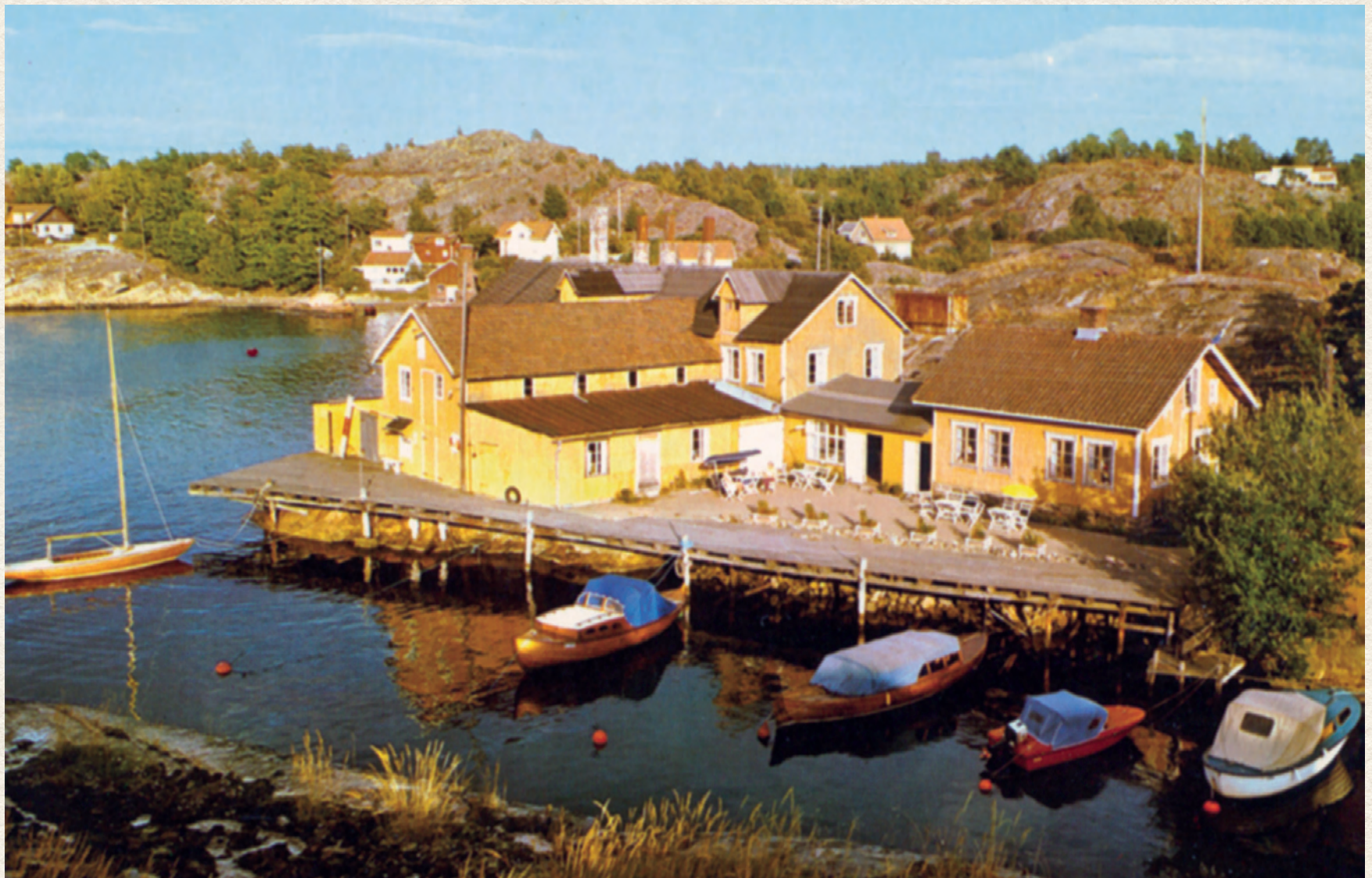
STRÖMSTAD, SVÉDORSZÁG: ANTAL BÍRO ÉS FELESÉGE MŰVÉSZTELEPE