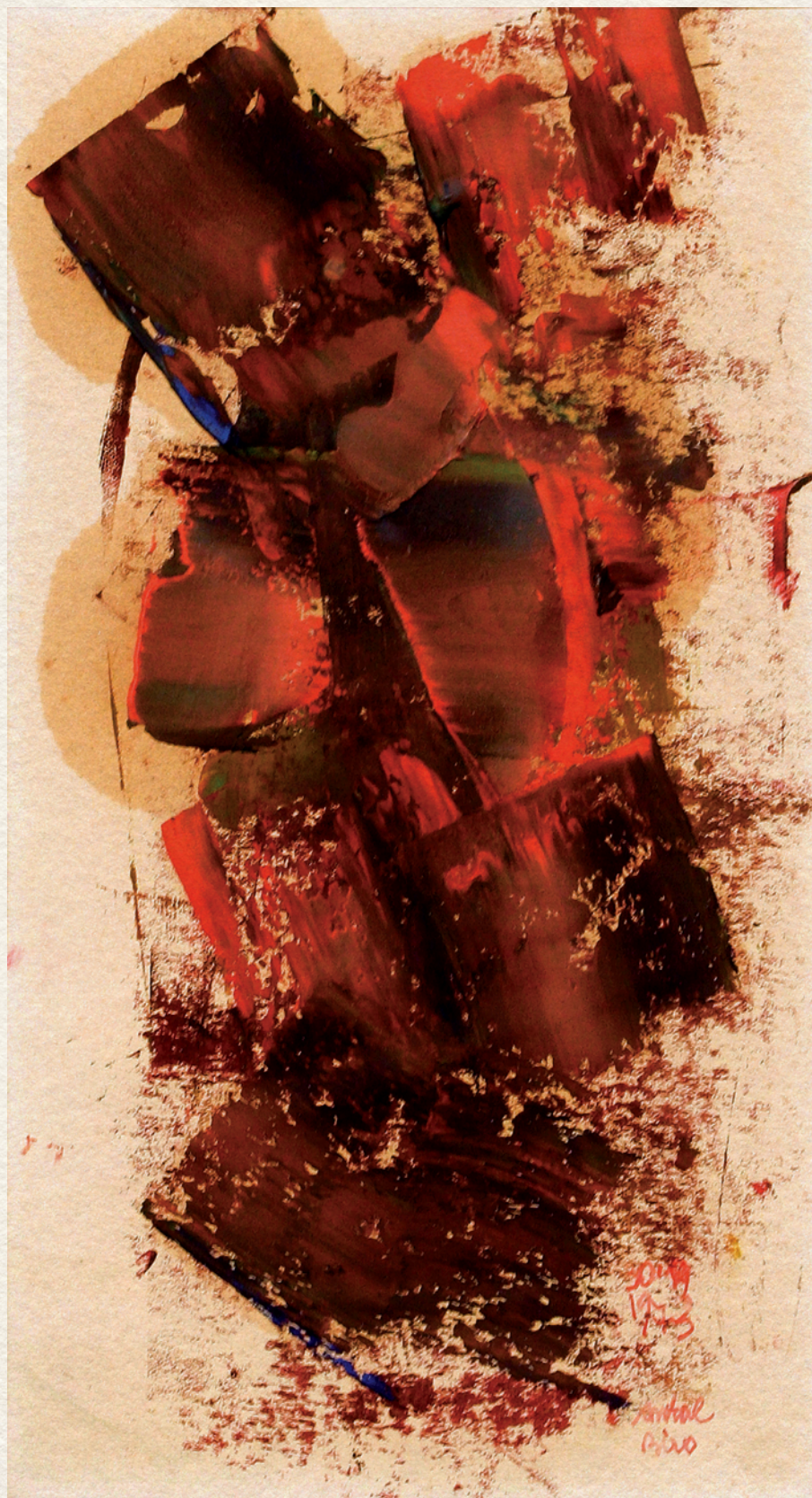
CÍM NÉLKÜL IX. - 1973., papír, vegyes technika, 24x14 cm