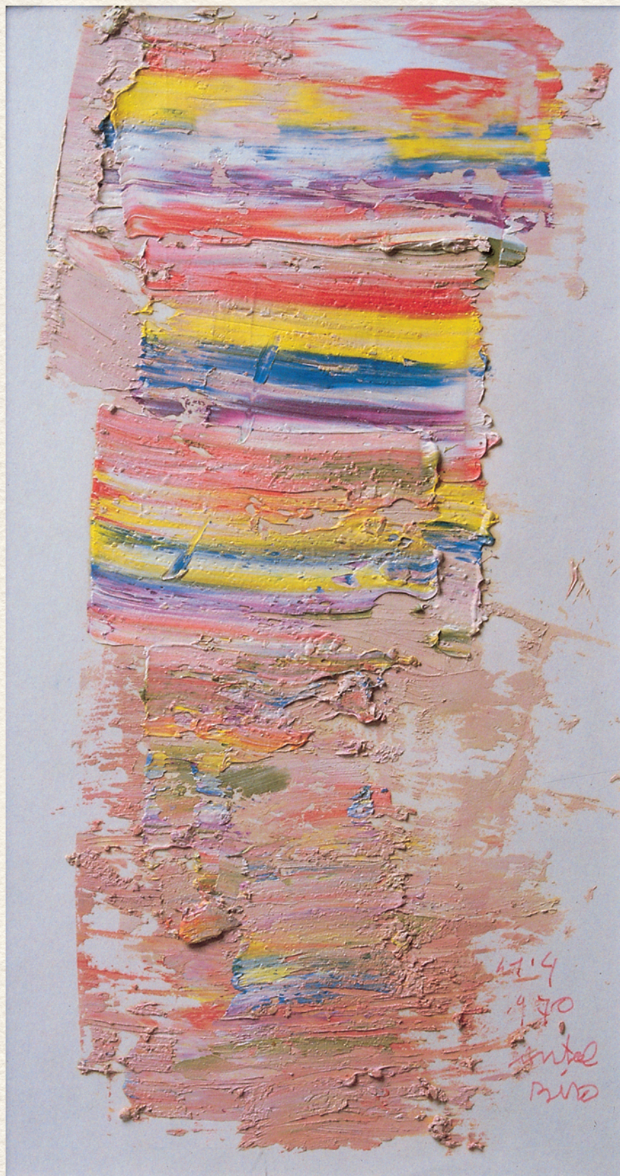
CÍM NÉLKÜL - 1970., papír, vegyes technika, 31x19 cm