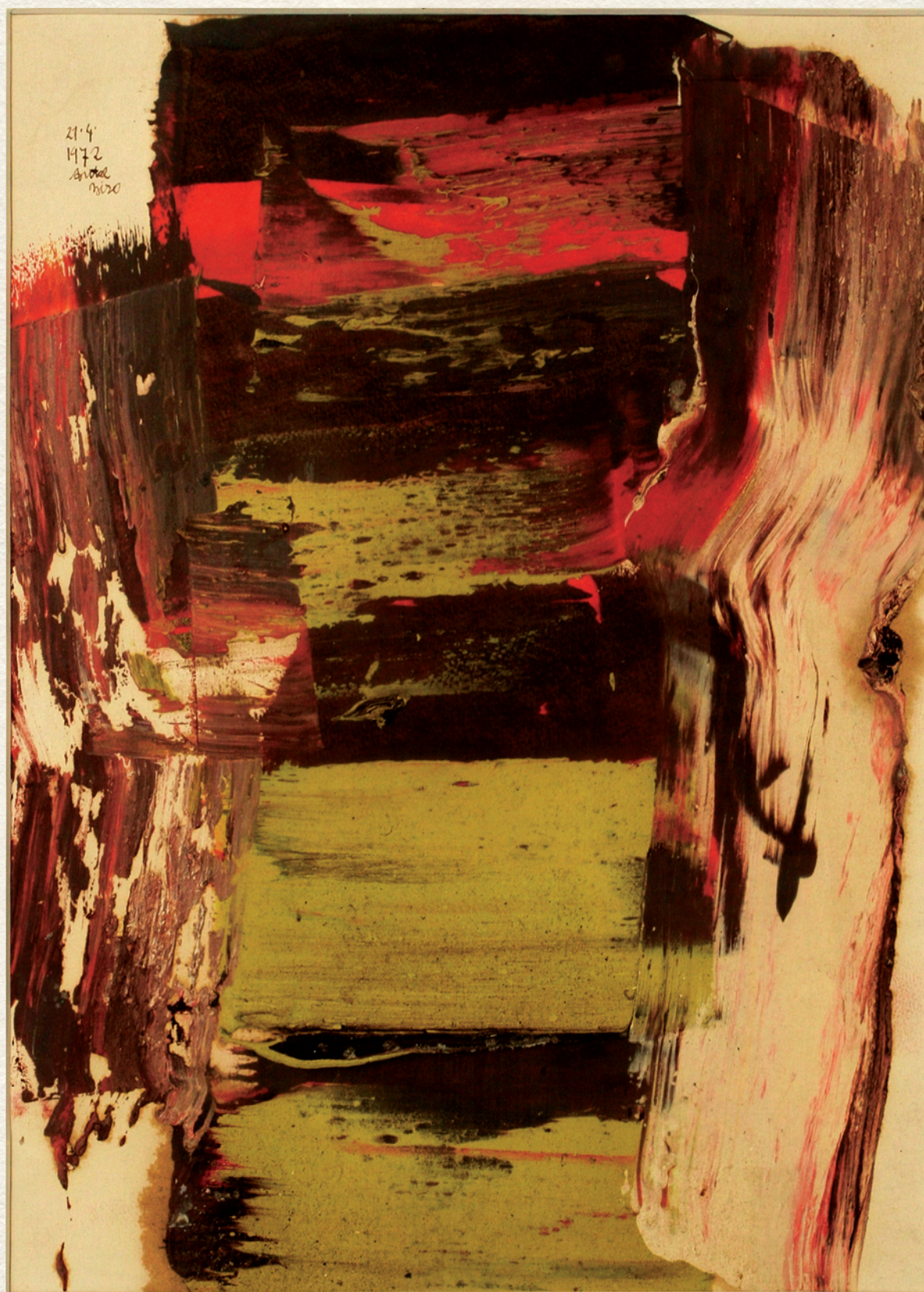
CÍM NÉLKÜL XXI. - 1972., papír, olaj, 38x27 cm