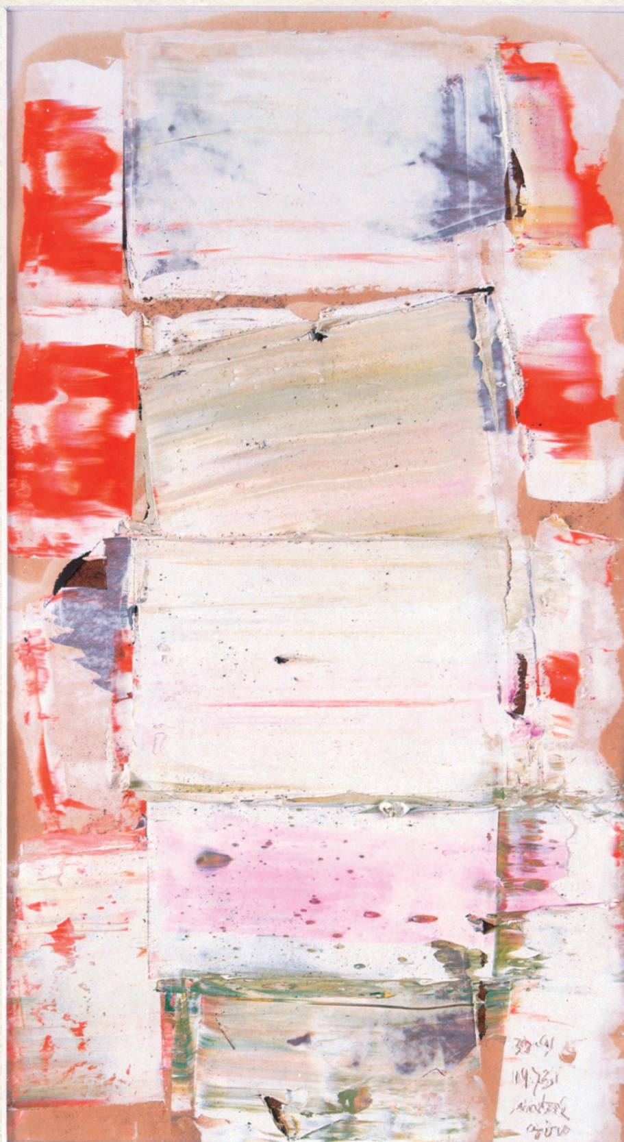
CÍM NÉLKÜL - 1973., vegyes technika papír, 35x19 cm