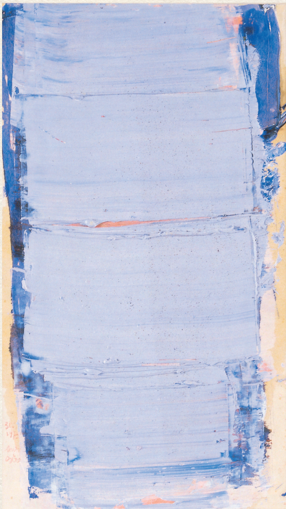
GYÖNGY SZÜRKE - 1970., papír, vegyes technika, 35x19,5 cm