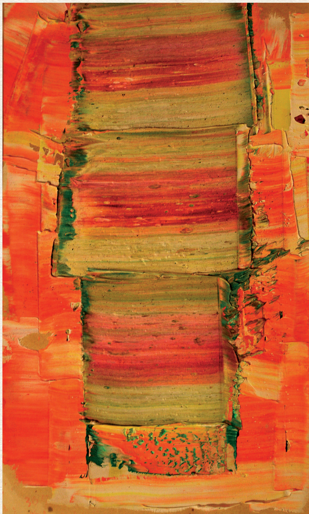
CÍM NÉLKÜL – 1973., papír, olaj, 26x16 cm