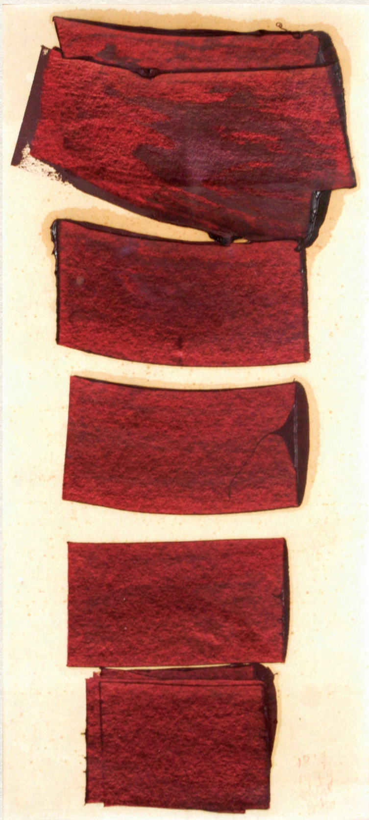
CÍM NÉLKÜL – 1979., papír, olaj, 34x15,5 cm