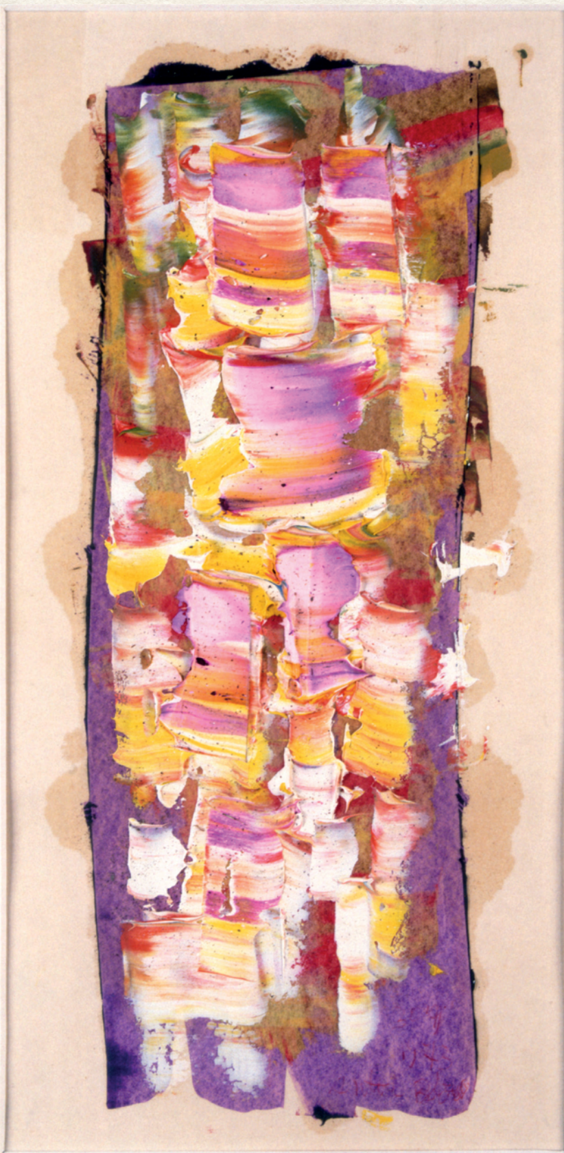
CÍM NÉLKÜL – 1970., papír, vegyes technika, 31x15 cm