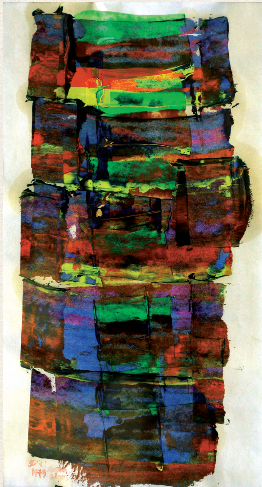
CÍM NÉLKÜL – 1973., papír, akvarell, 28x15 cm