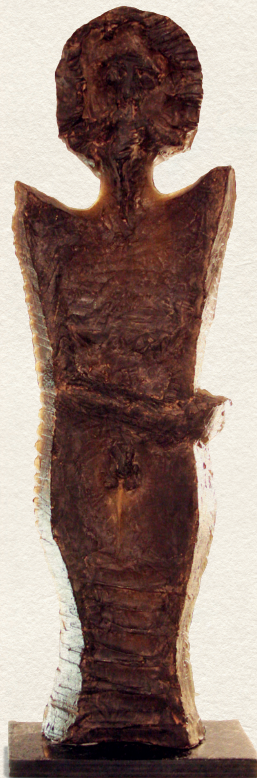
GONDOLKODÓ II. - 2006., üveg, 82x24x10 cm