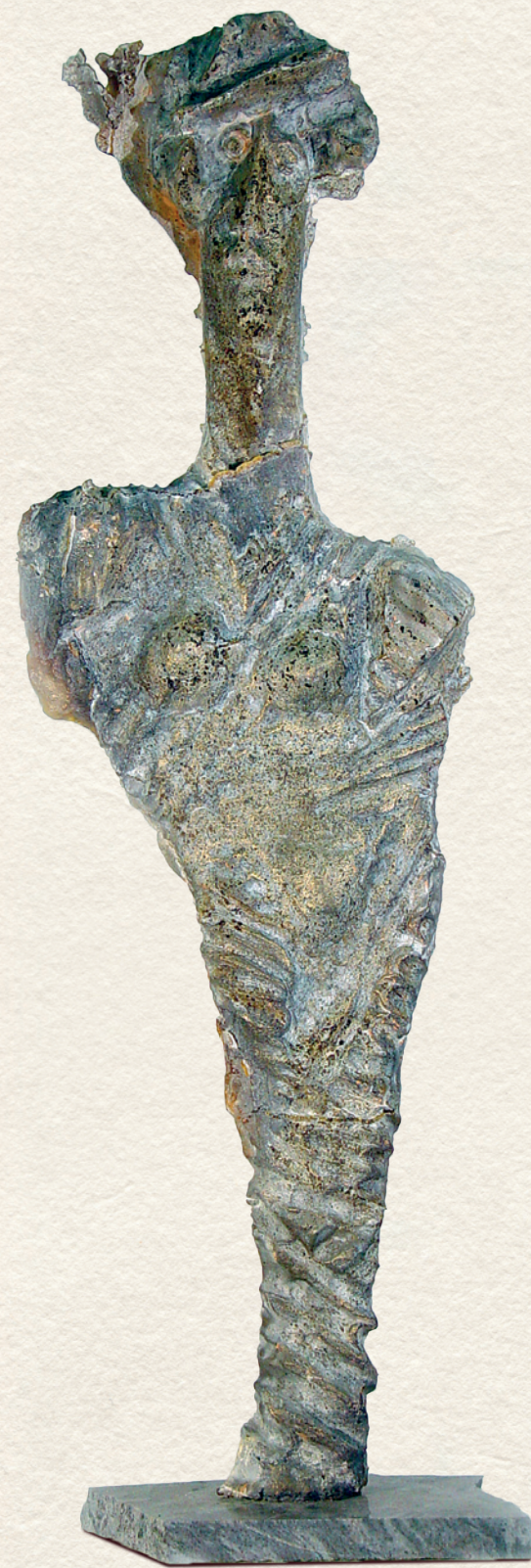
ARANY KISZEBABA – üveg, 116x37x10 cm