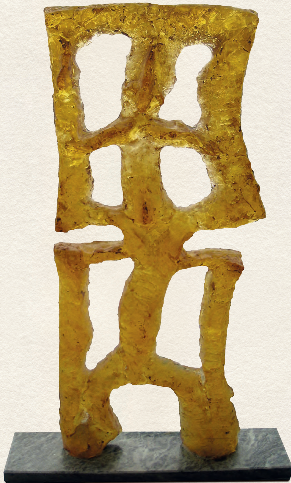
MOZDULAT - 2003., üveg, 55x30x5 cm