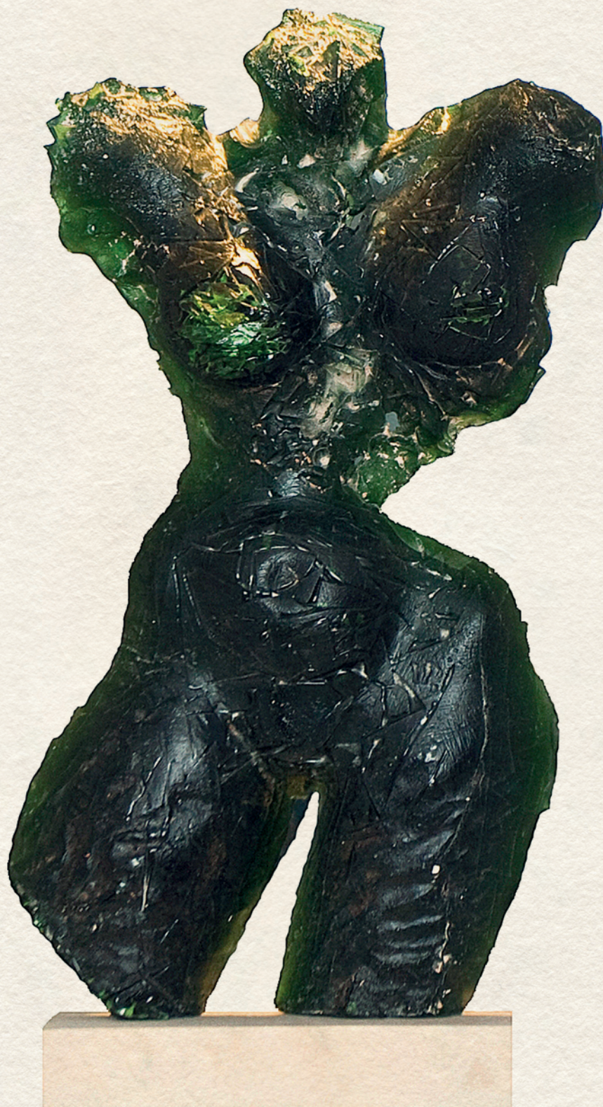
MENYECSKE - 2000., üveg, 55 cm