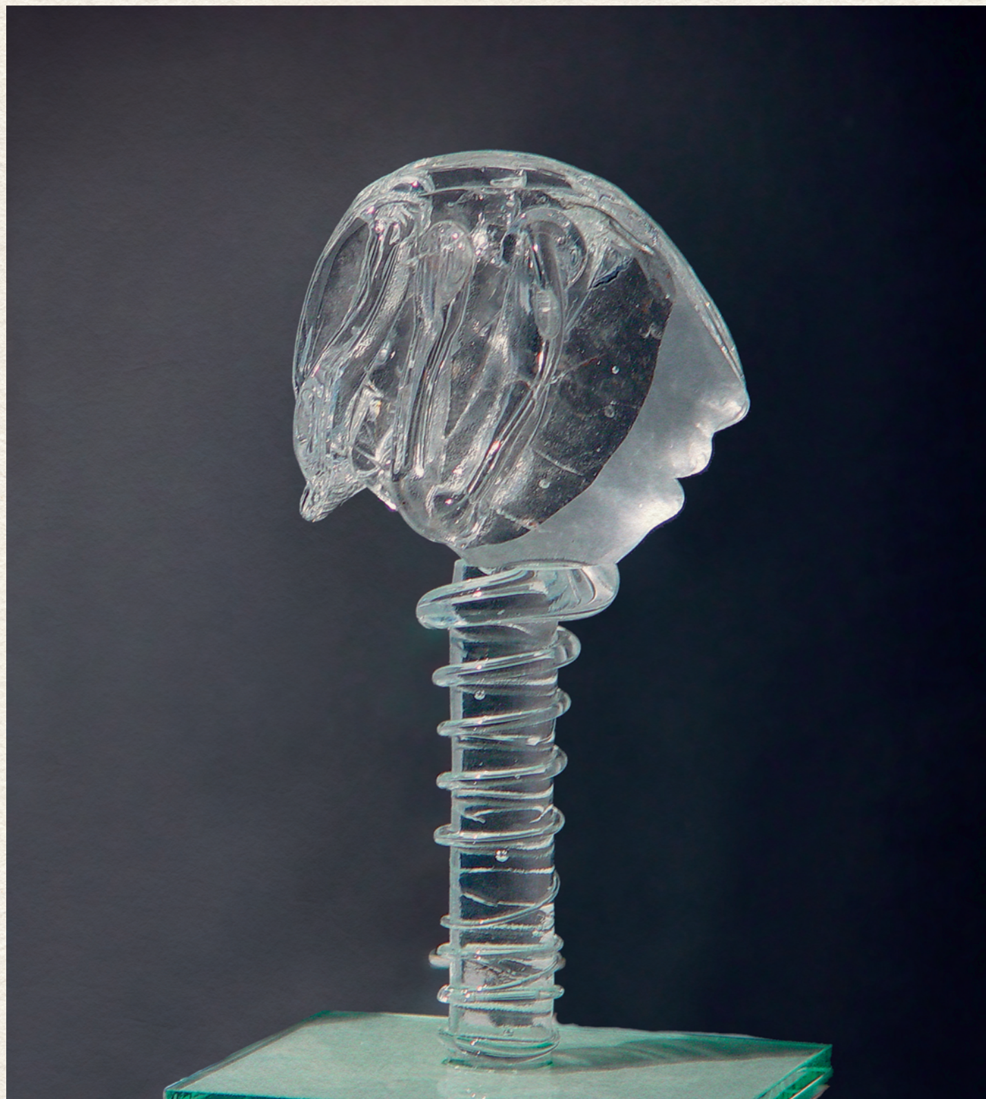
FEJ – 2003., üveg, 39x17x10 cm