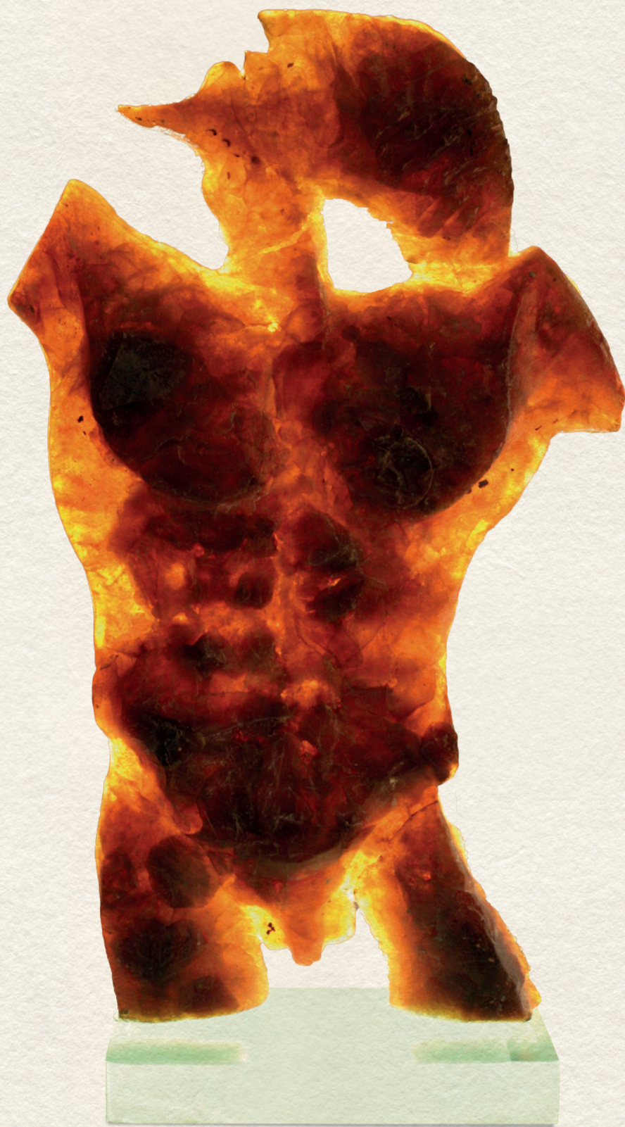
PÁSZTOR FIÚ II. - 2006., üveg, dombormű, 68x37x11 cm