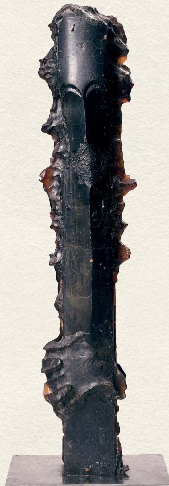
PROFESSZOR – 1997., üveg, olaj, 85x18x8 cm