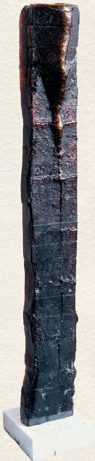
OBSITOS – 1997., üveg, 97x13x9 cm