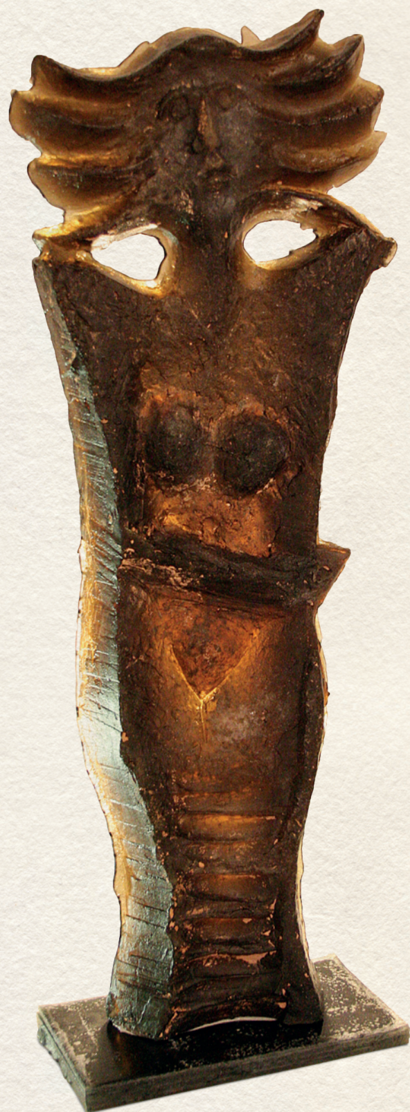
GONDOLKODÓ I. - 2006., üveg, 80x29,5x7 cm