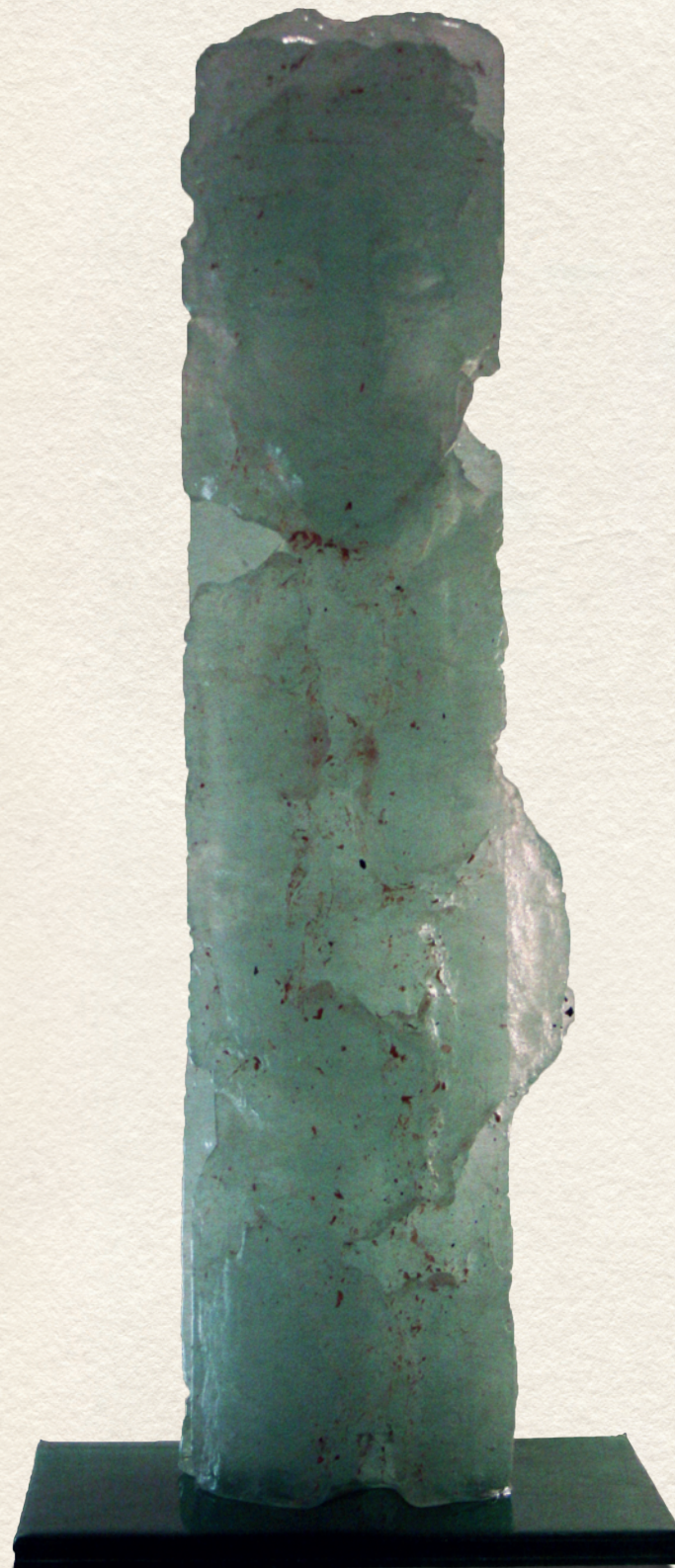
ÖRKATONA - üveg, 70x30x20 cm