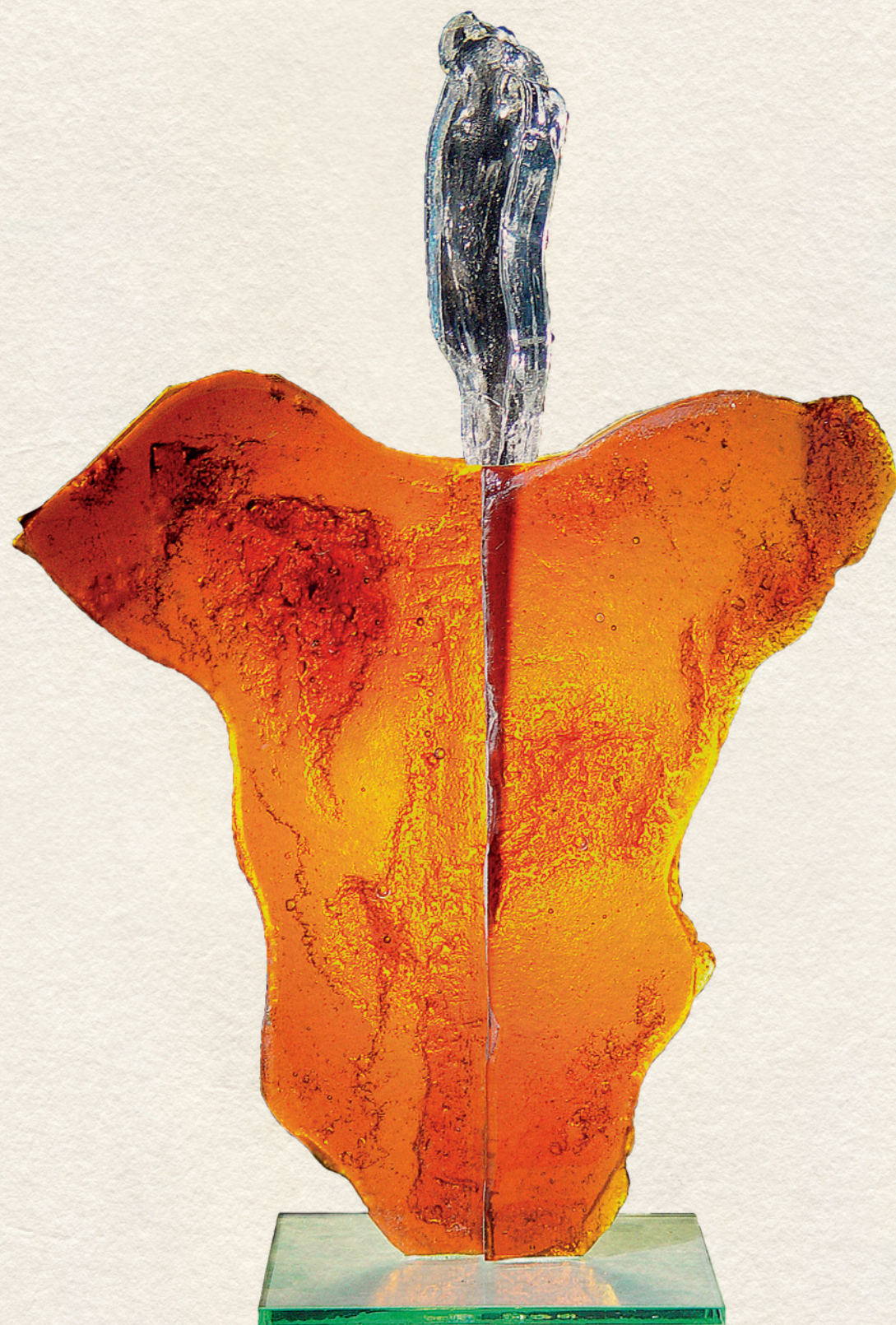
SZÁRNYALÁS - üveg, 56x36x23 cm