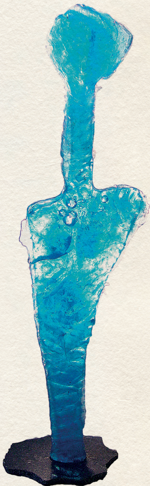
KÉK KISZEBABA – üveg, 125x30x10 cm