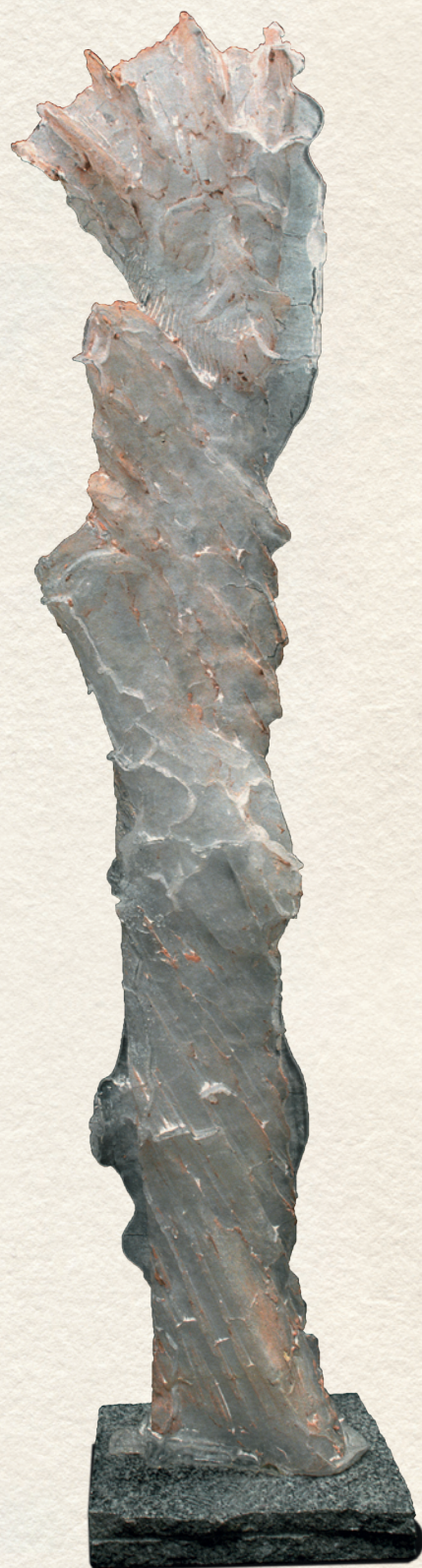
ÖREG SZERZETES - 1999., üveg, olaj, 114x21x7 cm