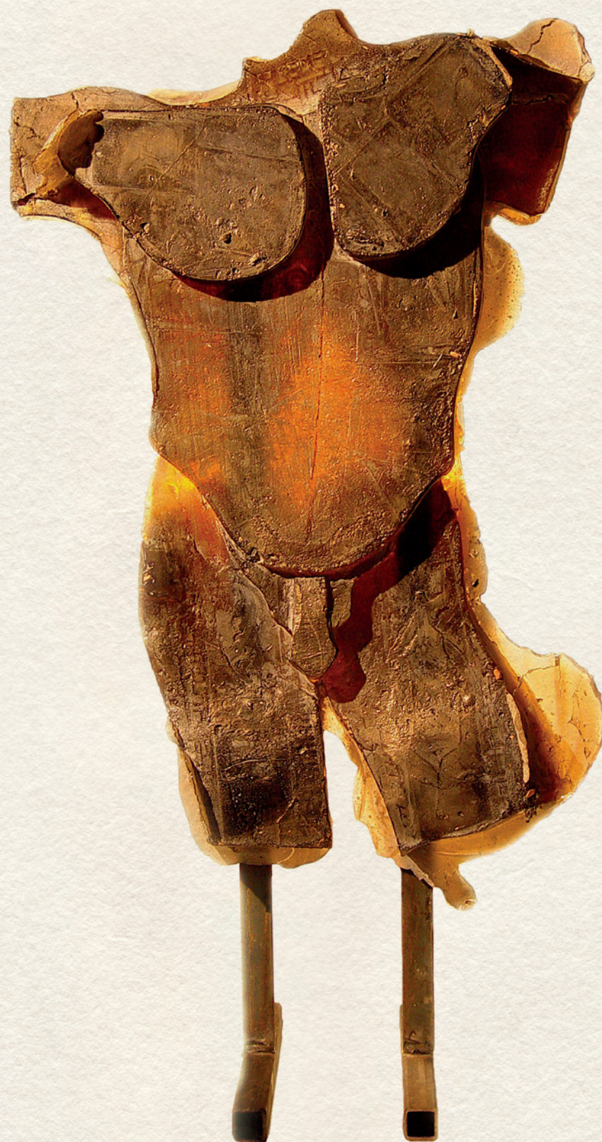
AKT - 2000, üveg, 67x35 cm