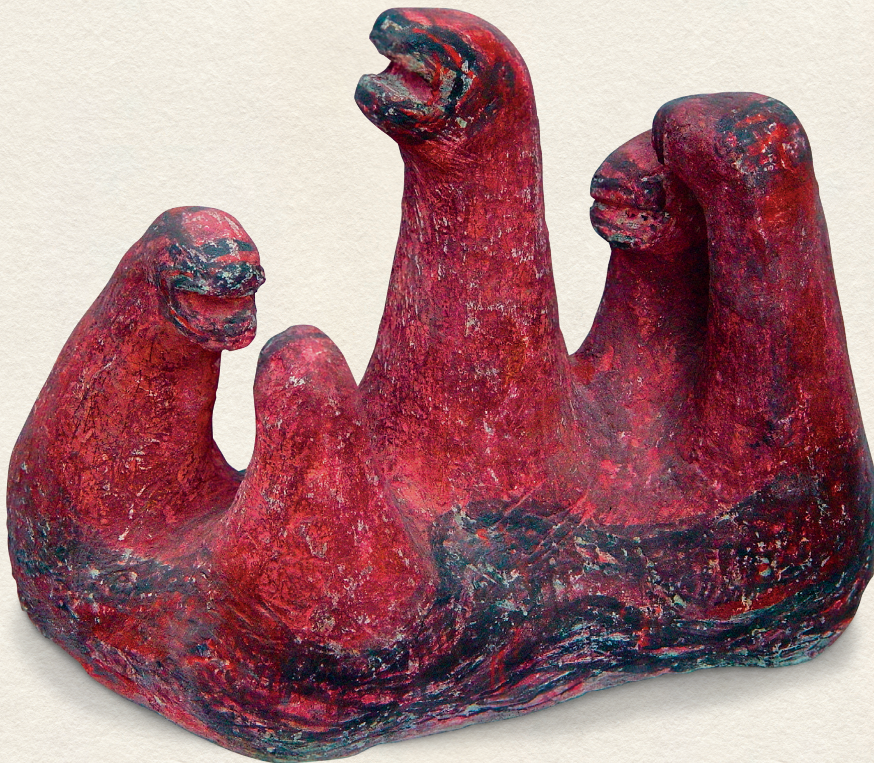
HULLÁMZÁS - 1999., festett beton, 26x33x15 cm