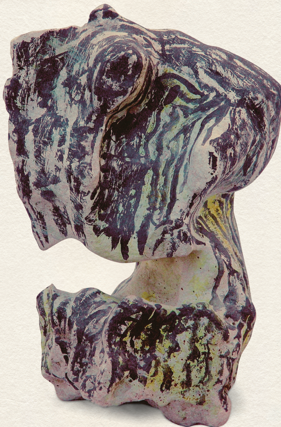
ALKONY - 1999., festett kő, szobor, 32x21x18 cm