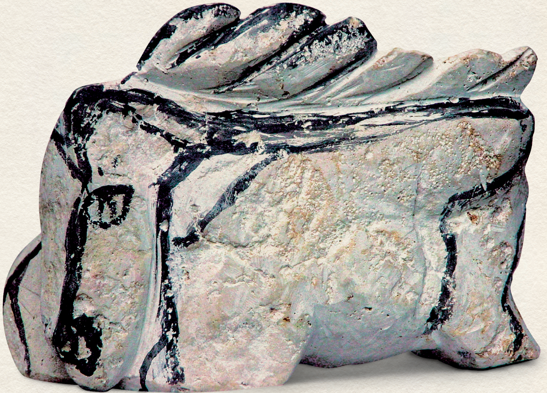
ŐSKOR - 2000., festett beton, 28x28x16 cm