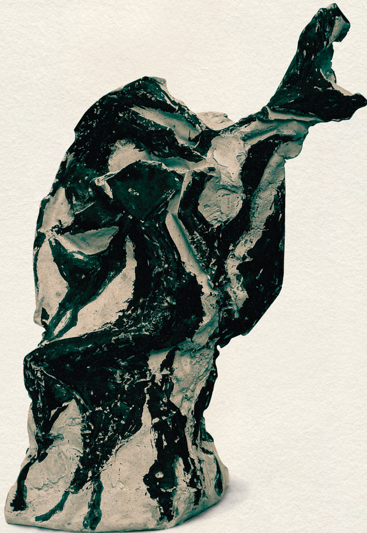
SZABADULÁS, 2003 - 2003., festett beton, 50x35x21 cm