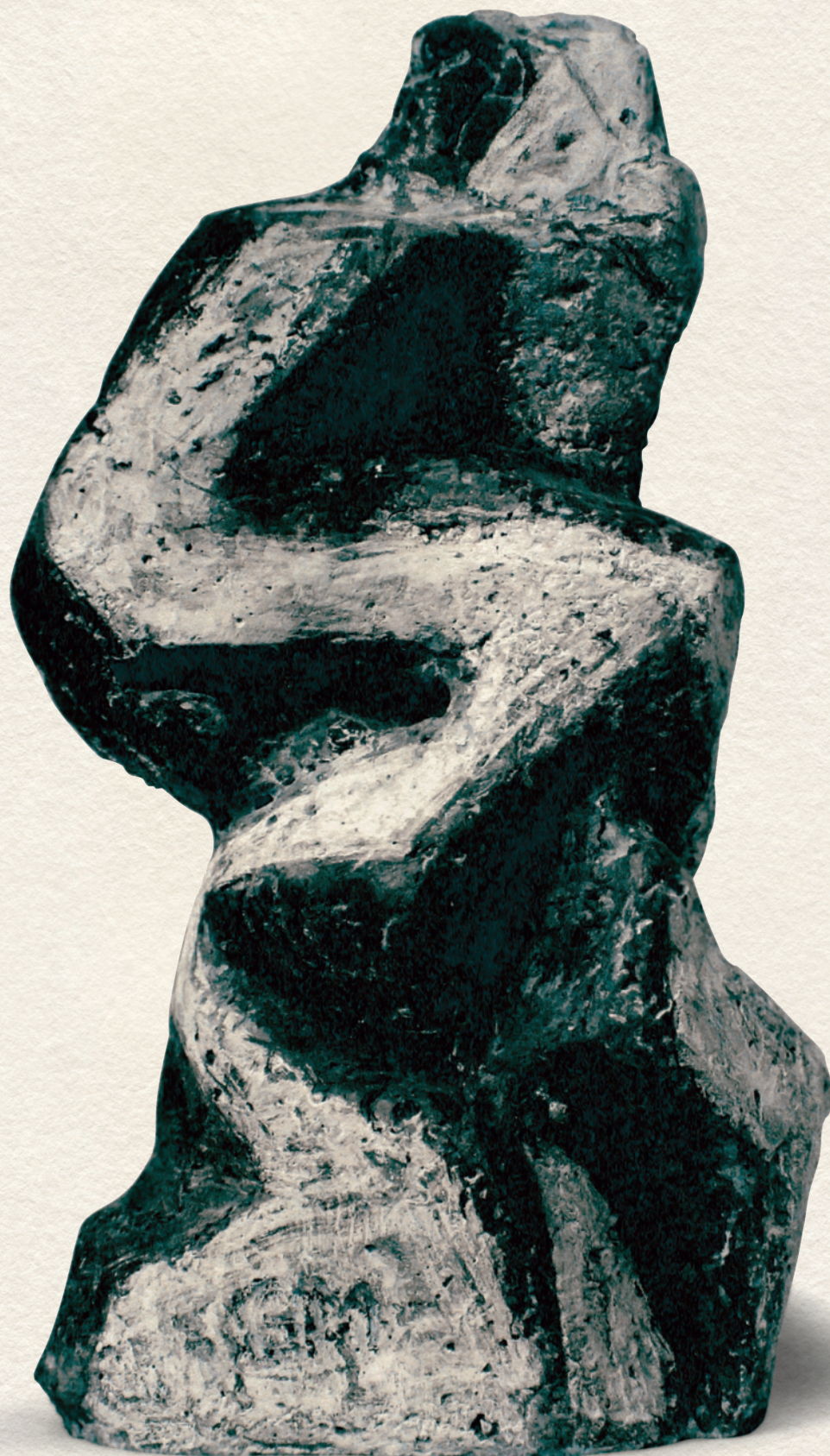
FEKETÉN-FEHÉREN - 2000., festett beton, 39x21x14 cm