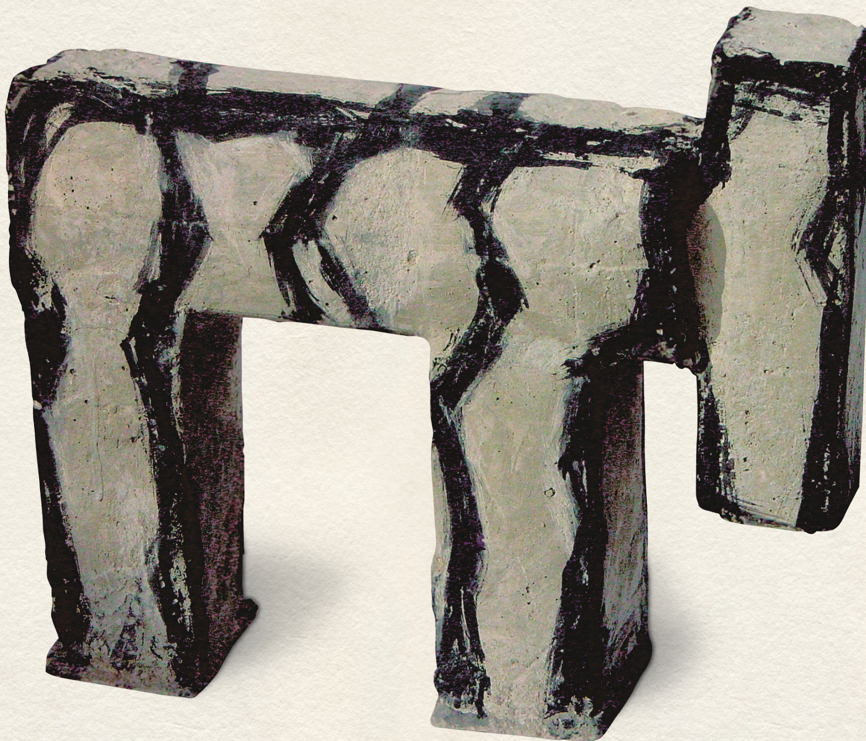
KONOK ÉS SZOMORÚ, 2003 - 2003., festett beton, 29x35x9 cm