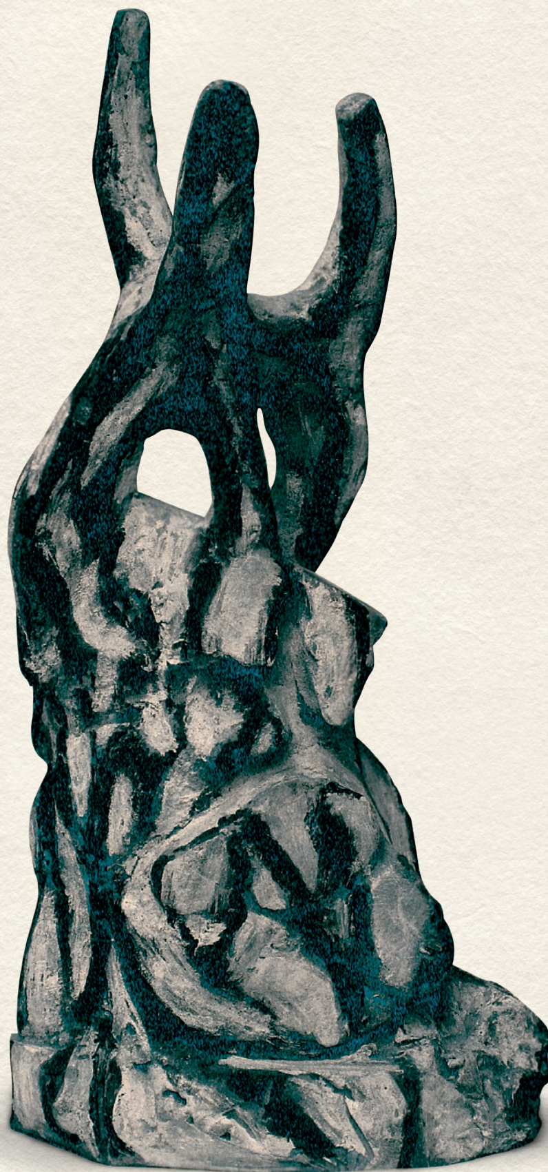
HEGYEN - 1998., festett beton, 43x15x21 cm