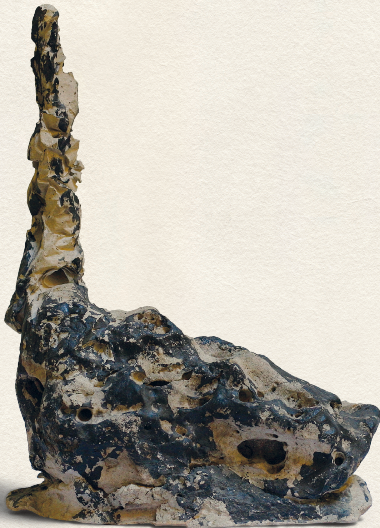
VERGŐDÉS - 2000., festett beton, 30x43x22 cm