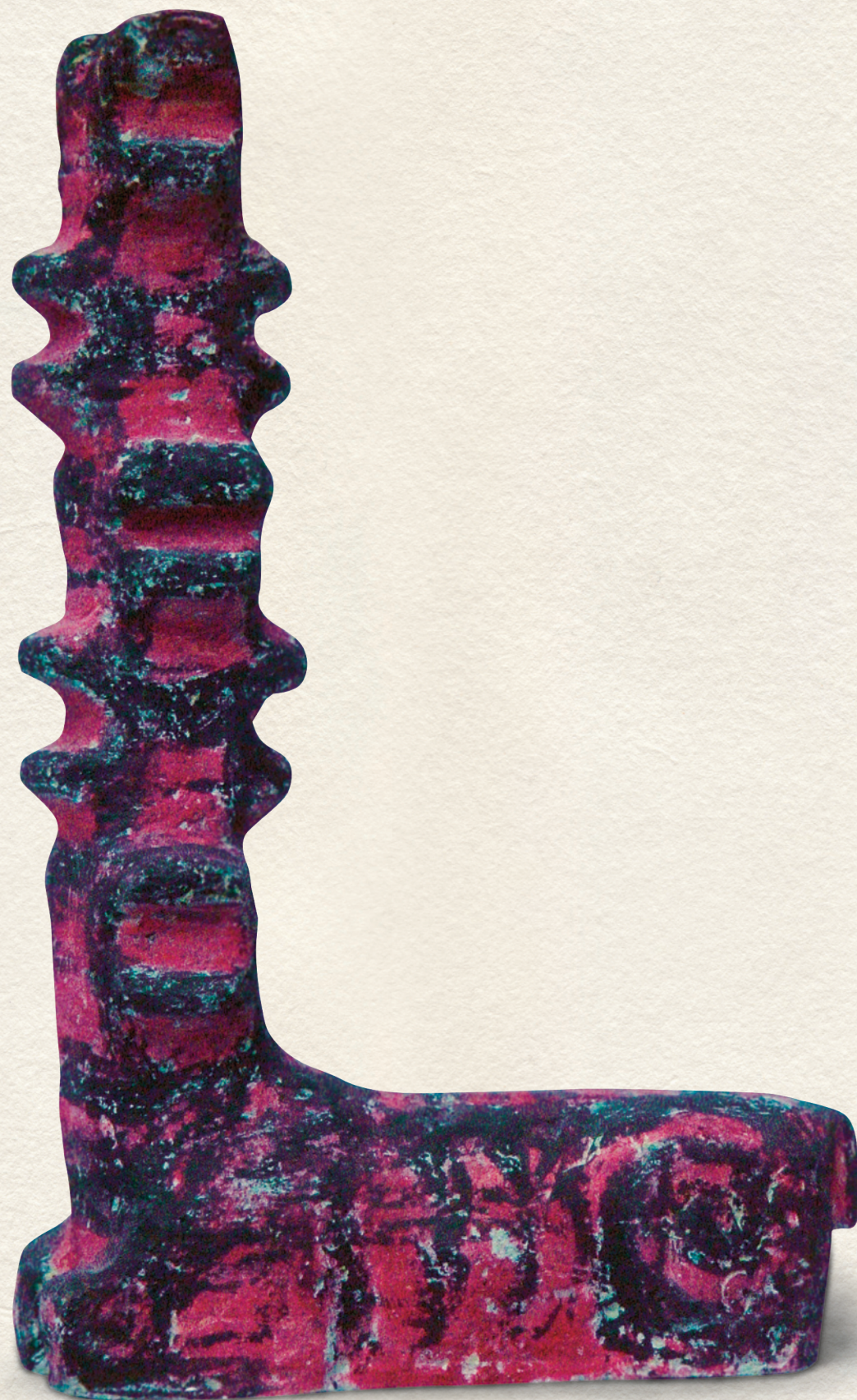
VÉLEMÉNYEK - 1996., festett beton, 47x29x11 cm