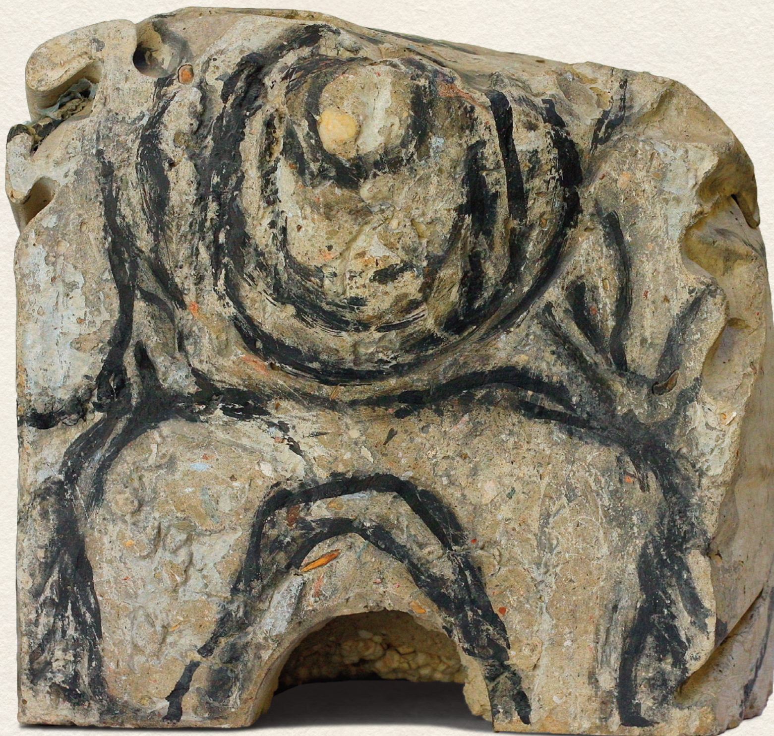
CÍM NÉLKÜL - 2007., festett beton, 26x26x26 cm