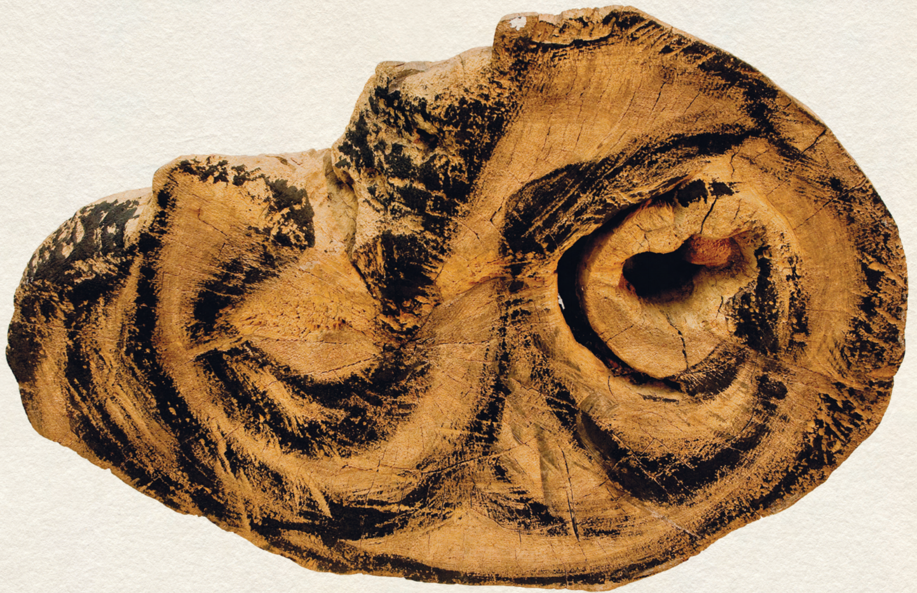
CSIGÁFA - 2013., festett fa, 47x73x22 cm