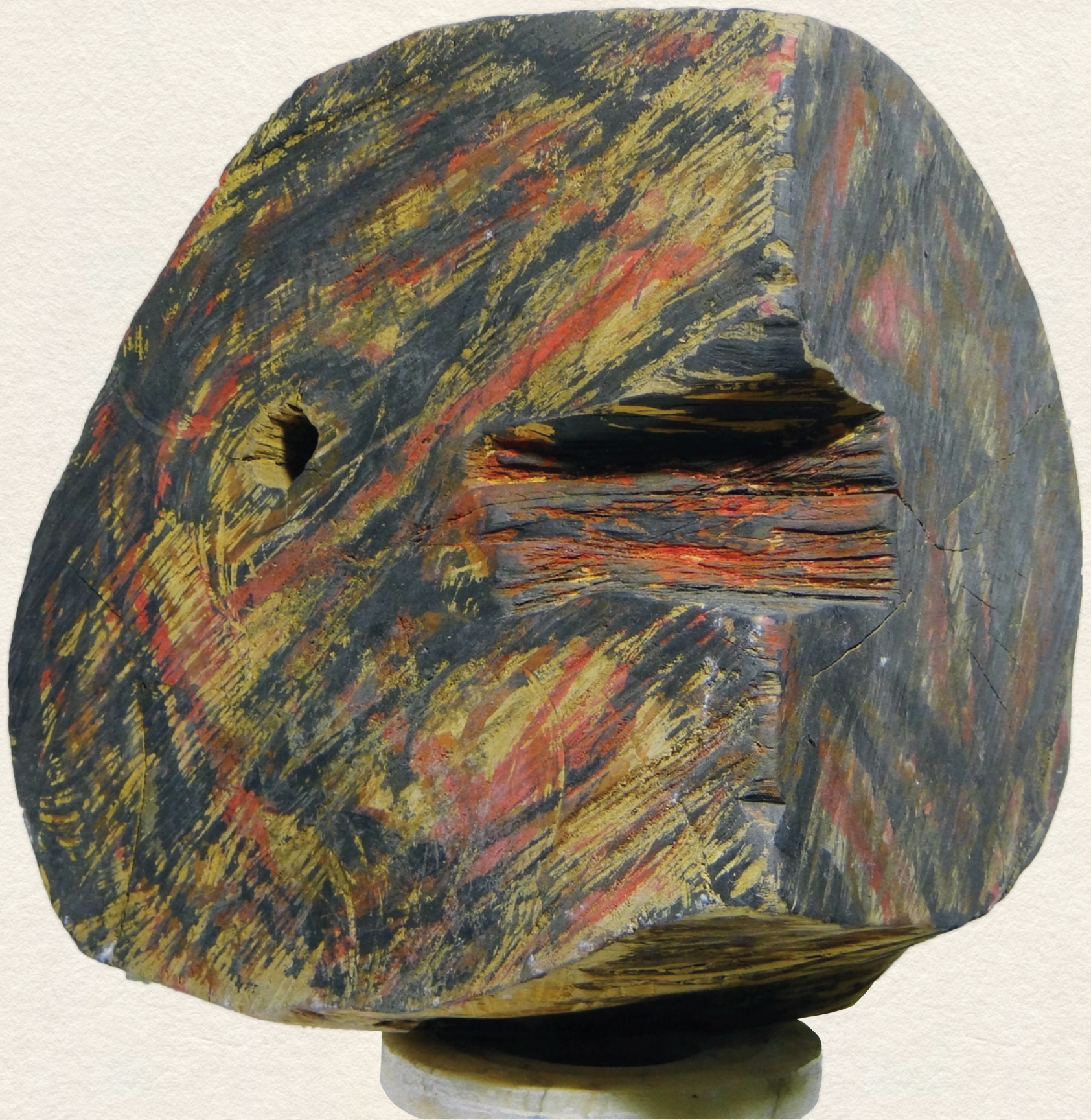
ΚΙΆΛΛΤΆΣ - 2013,. festett fa, 26,4x26,5x21 cm