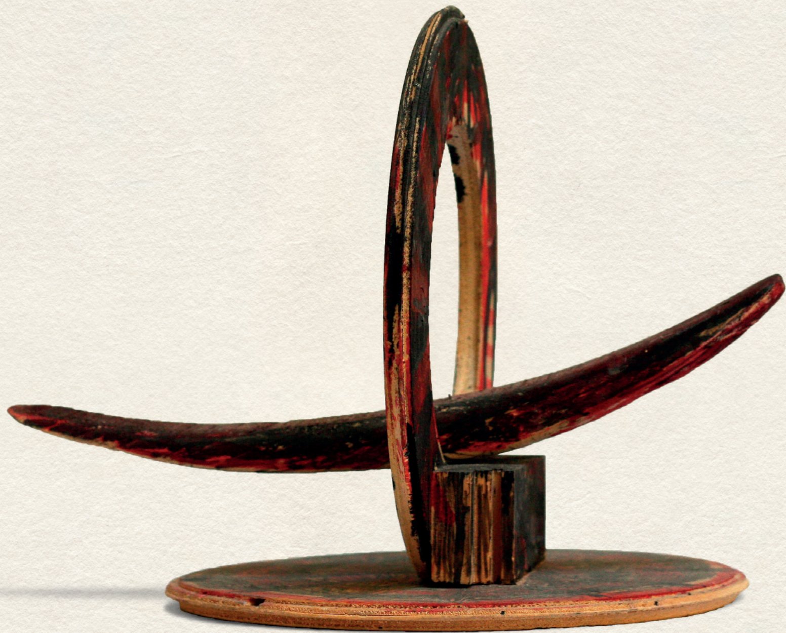
ÍVEK - 2011., festett fa, 30x23x26 cm