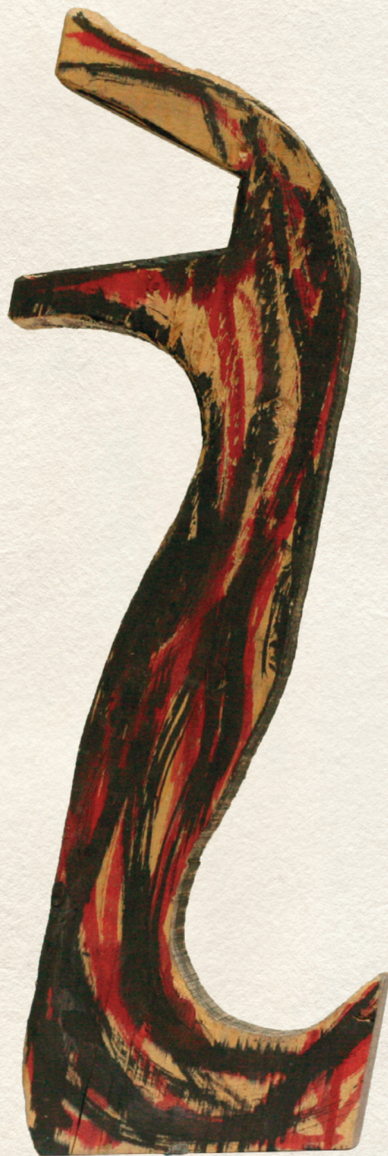
NEVETÉS - 2014., festett fa, 51x14x4,5 cm