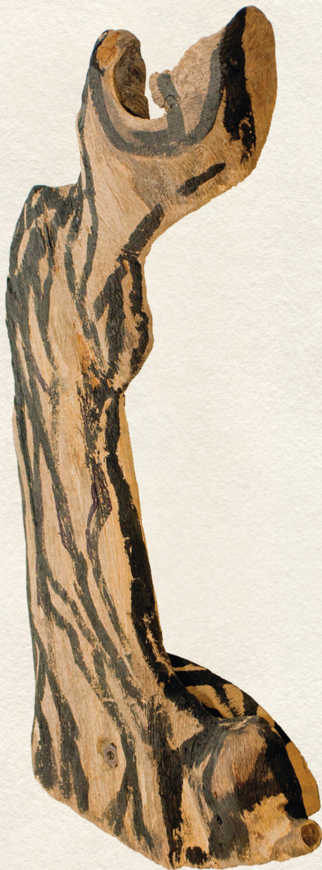
FÁJDALOM - 2009., festett fa, 54x26x13 cm