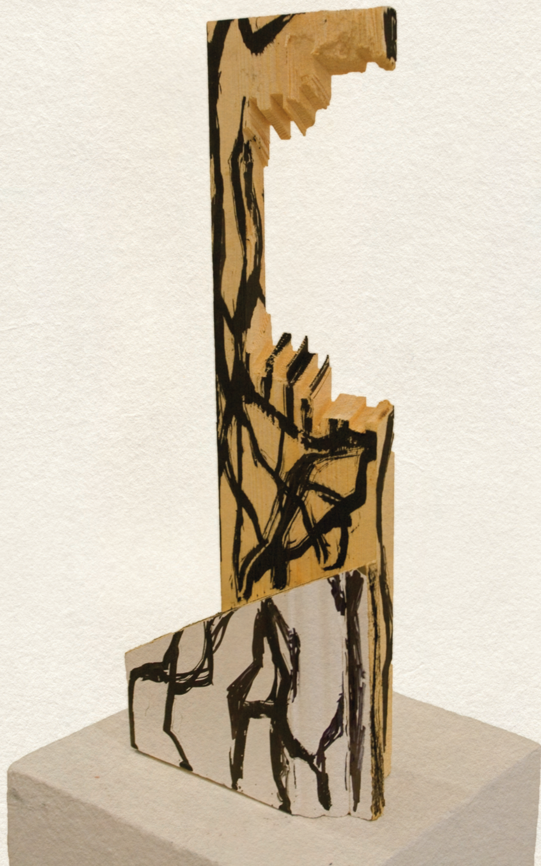
HARAPÁS - 2010., festett fa, 37x27x6,5 cm