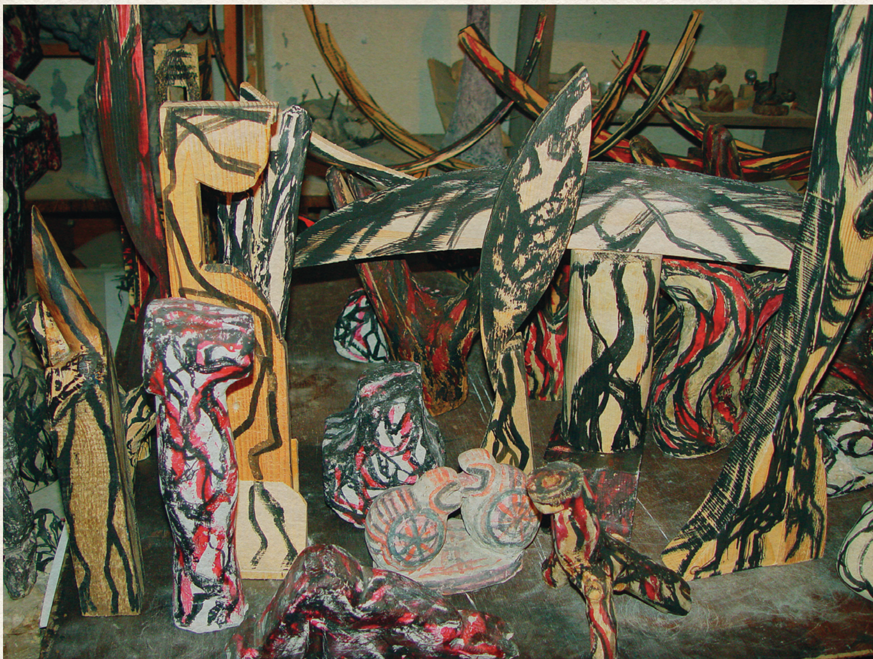
GÁDOR MAGDA MŰTERMÉBEN - 2011.