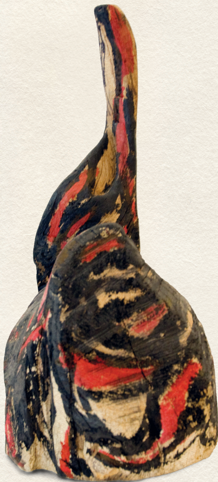
FELTŰNÉS - festett fa, 29x16x13 cm