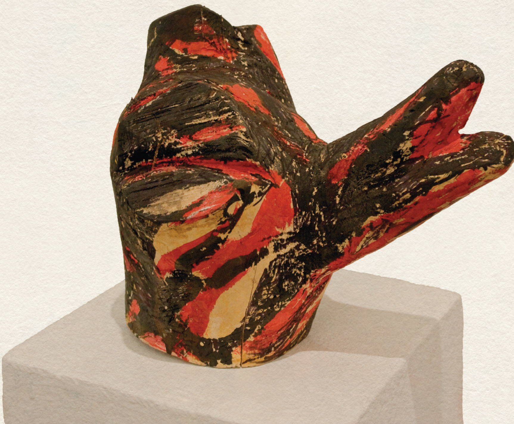
MADÁR - 2009., fa, 18x22x13 cm