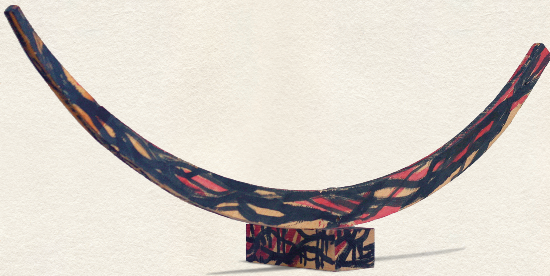
ÍV - 2011., festett fa, 28x64x18 cm