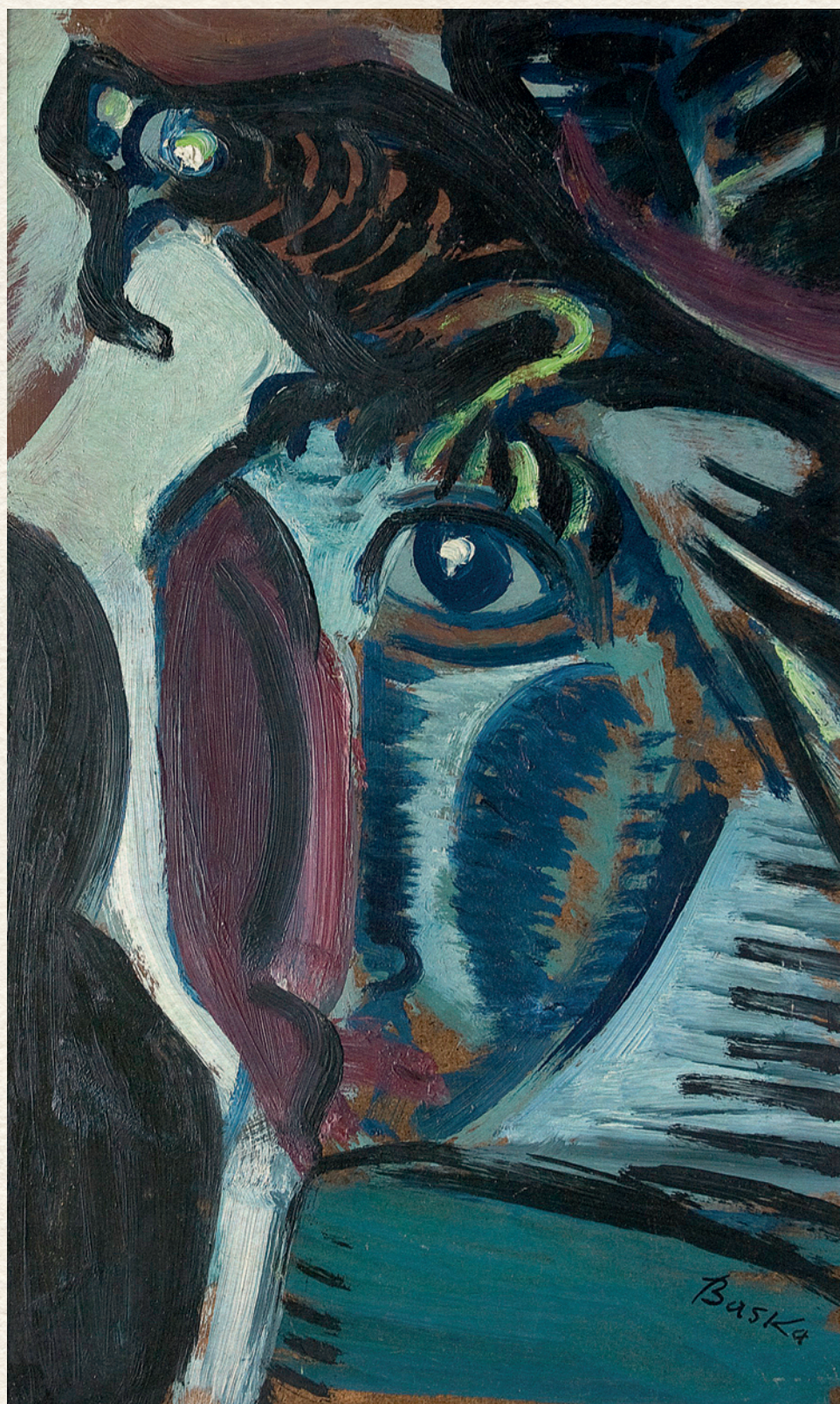
FÉLELEM - 1963., farost, olaj, 40x25 cm