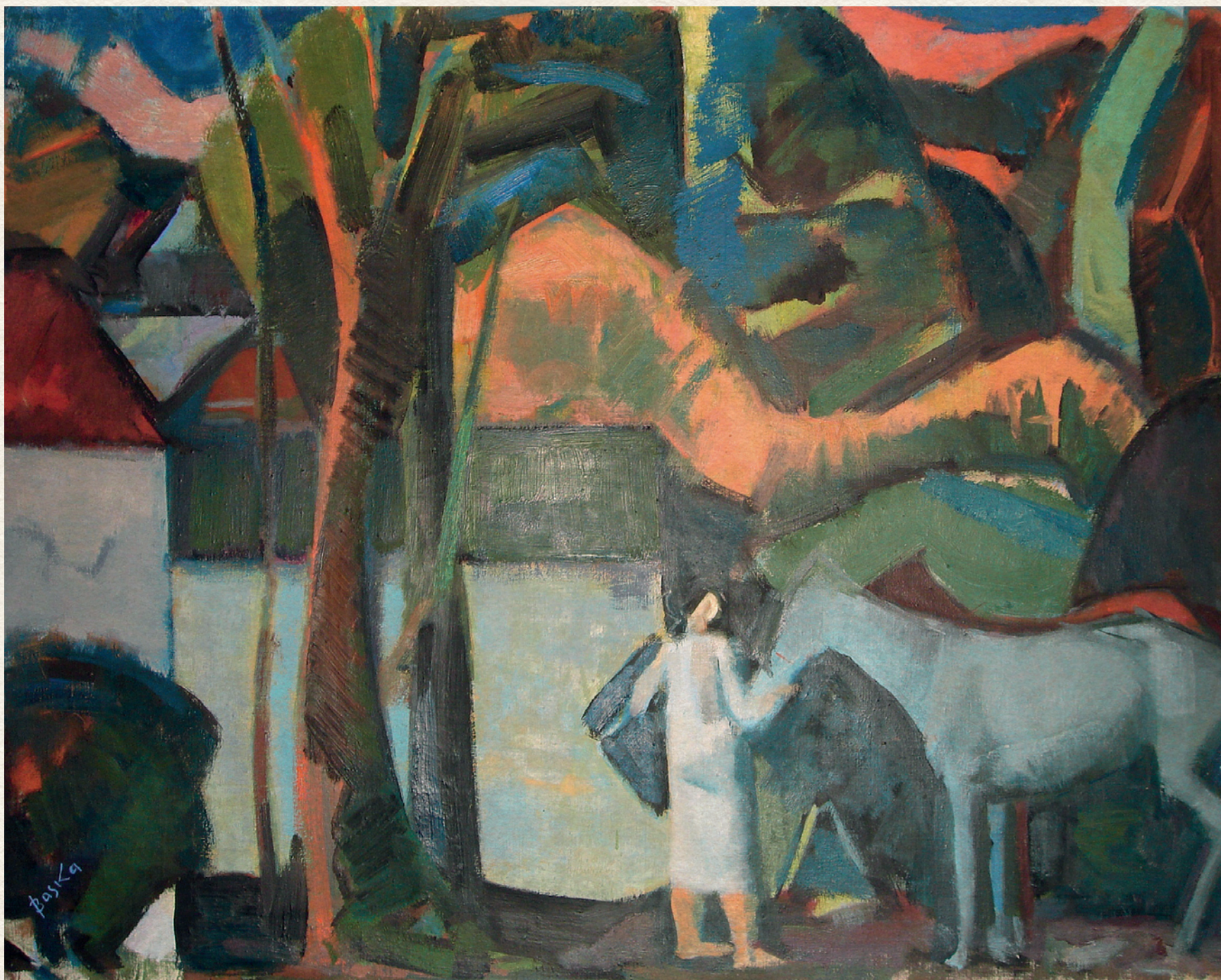
A DERES - 1959., vászon, olaj, 60x80 cm