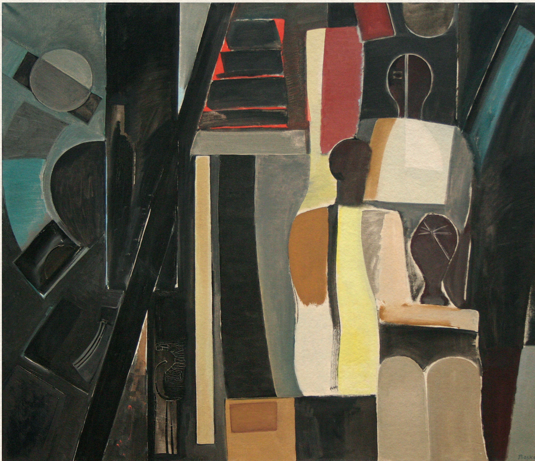
EMLÉK - 1970., vászon, olaj, 120x140 cm