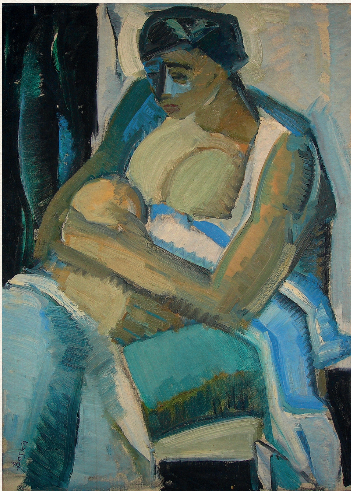
ANYA ÉS GYERMEK - 1965., vászon, olaj, 70x50 cm