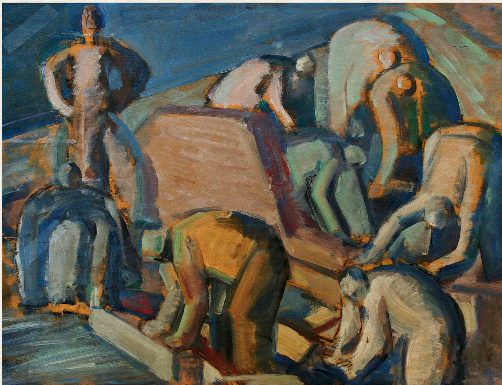
ÉPÍTŐK - 1961., fa, olaj, 47x63 cm