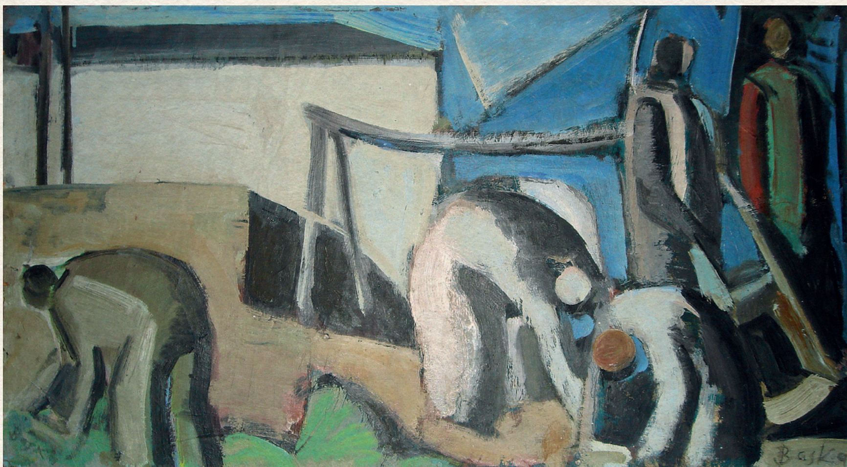
LEHAJLÓ FIGURÁK - 1961., farost, olaj, 35x64 cm