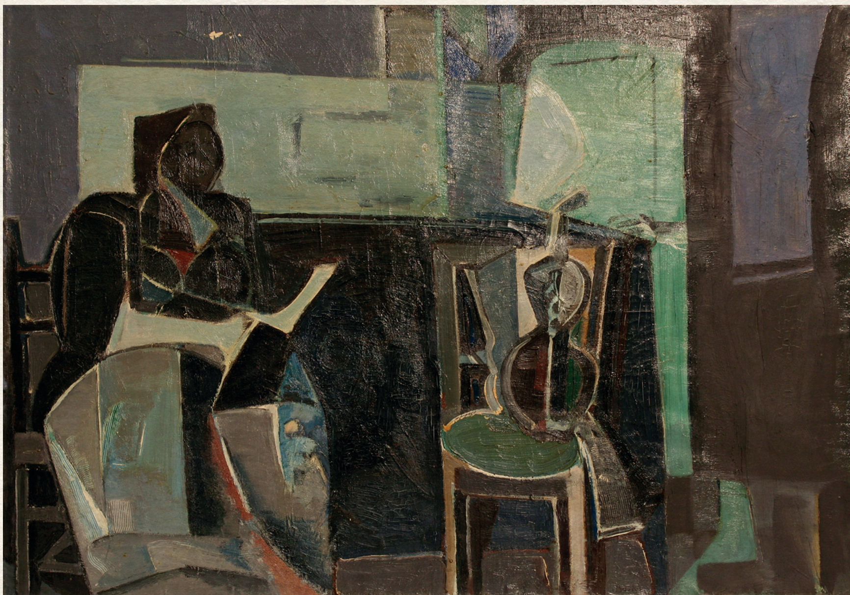
SZOBÁBAN - 1964., vászon, olaj, 70x100 cm