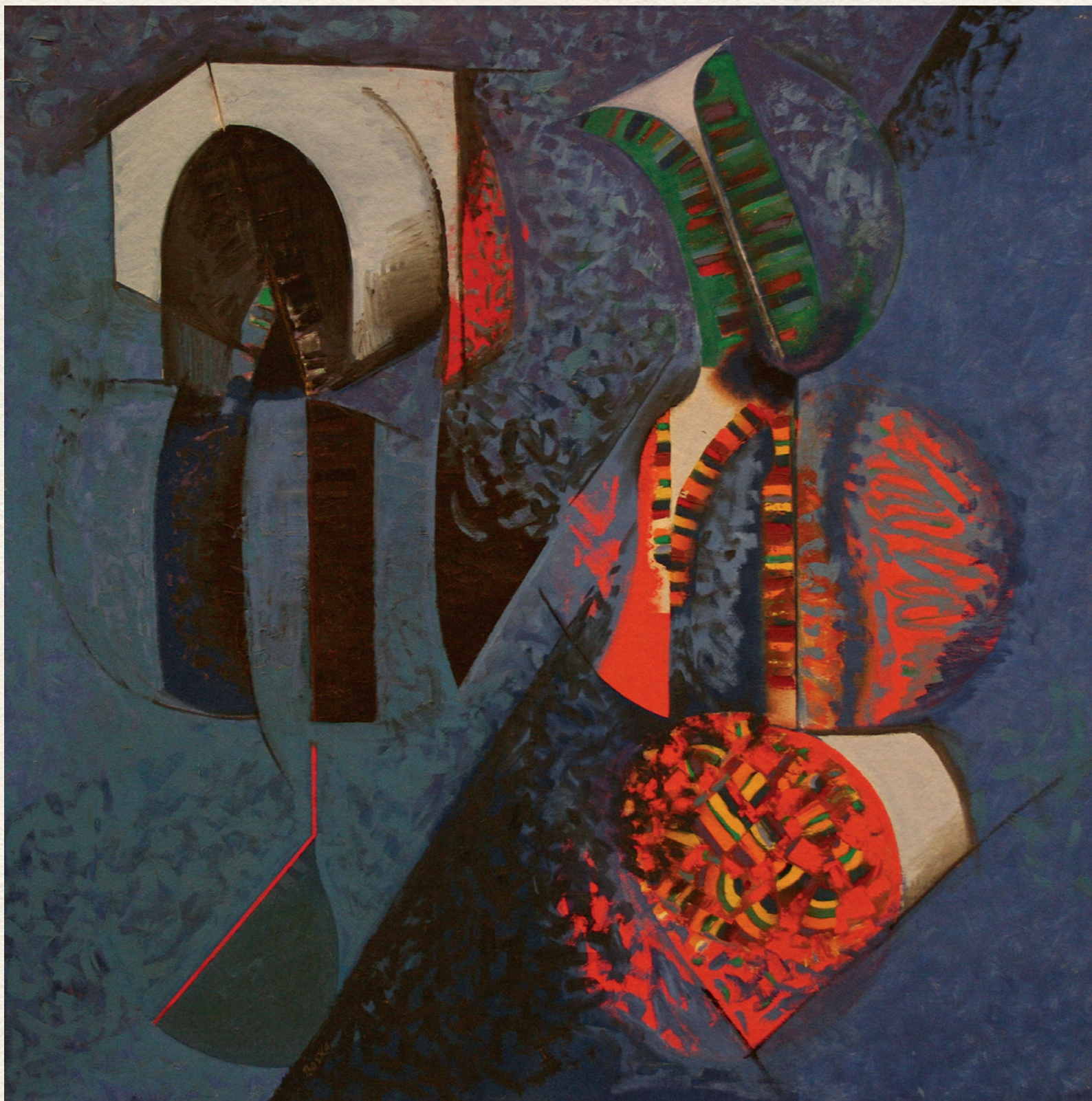
KÉK RITMUS - 1977., vászon, olaj, 150x150 cm