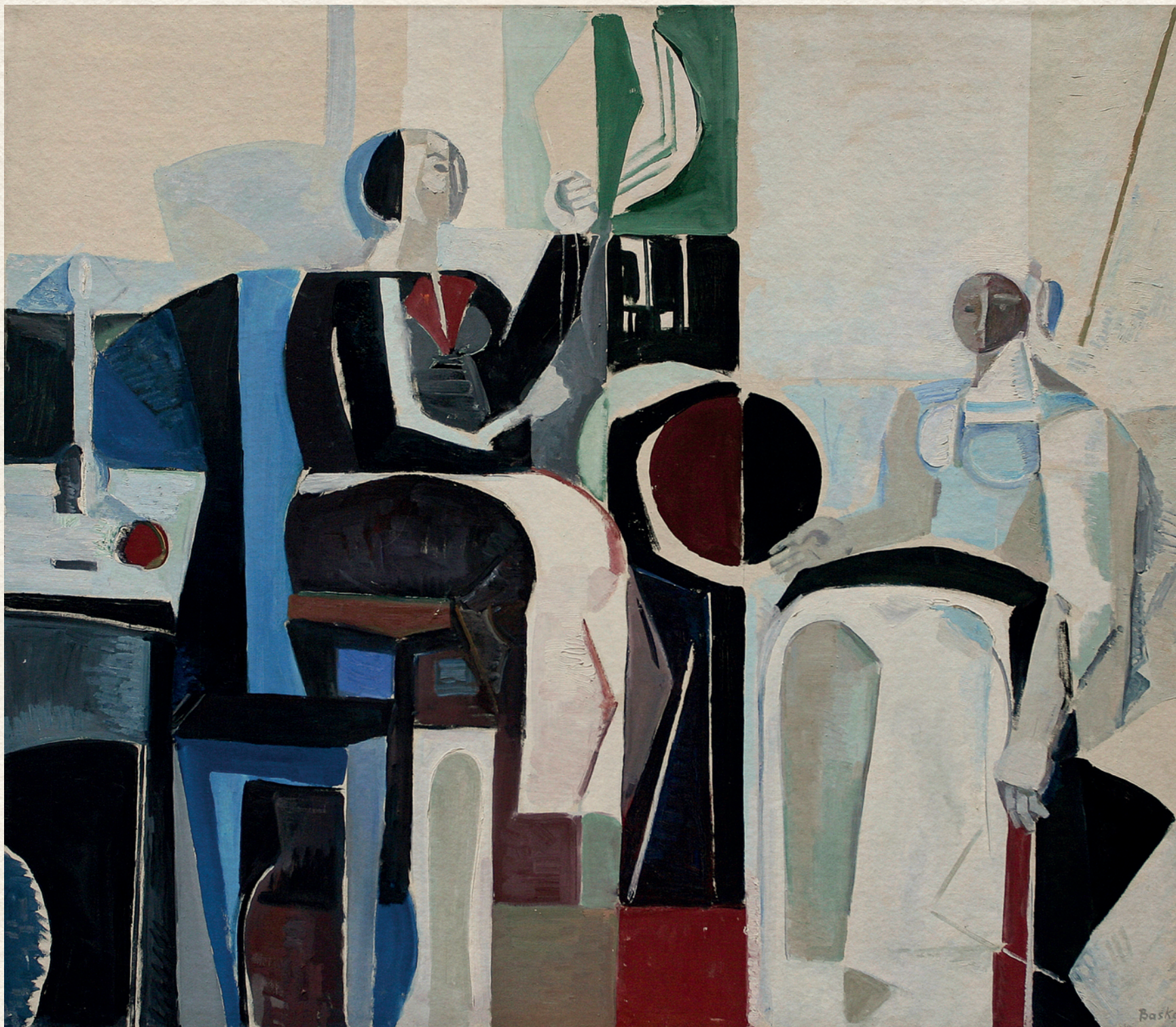
ROKKÁZÓ ASSZONYOK - 1966., vászon, olaj, 120x140 cm