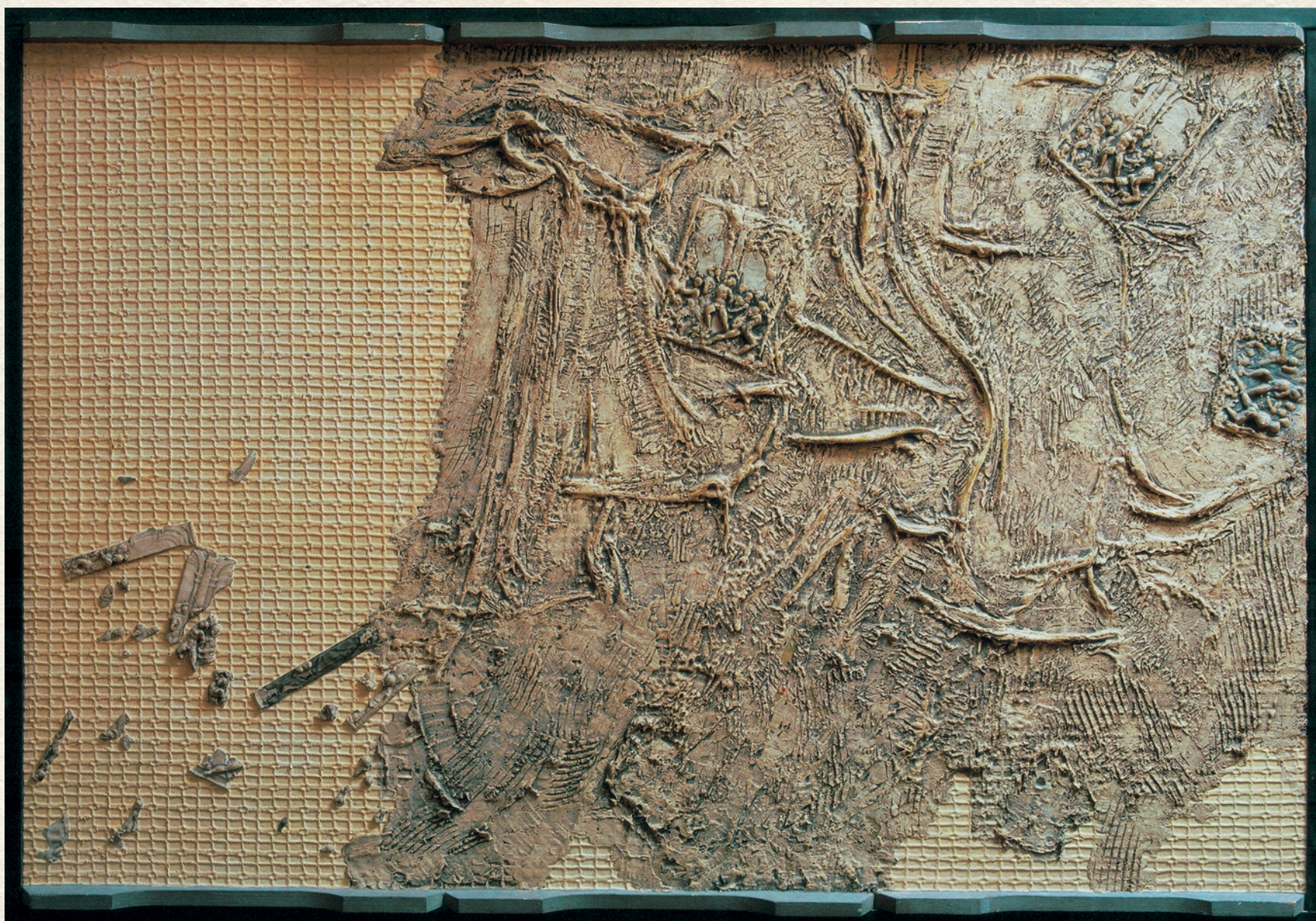
SZÉTHULLÁS - 1967., farost, vegyes technika, 85x124 cm