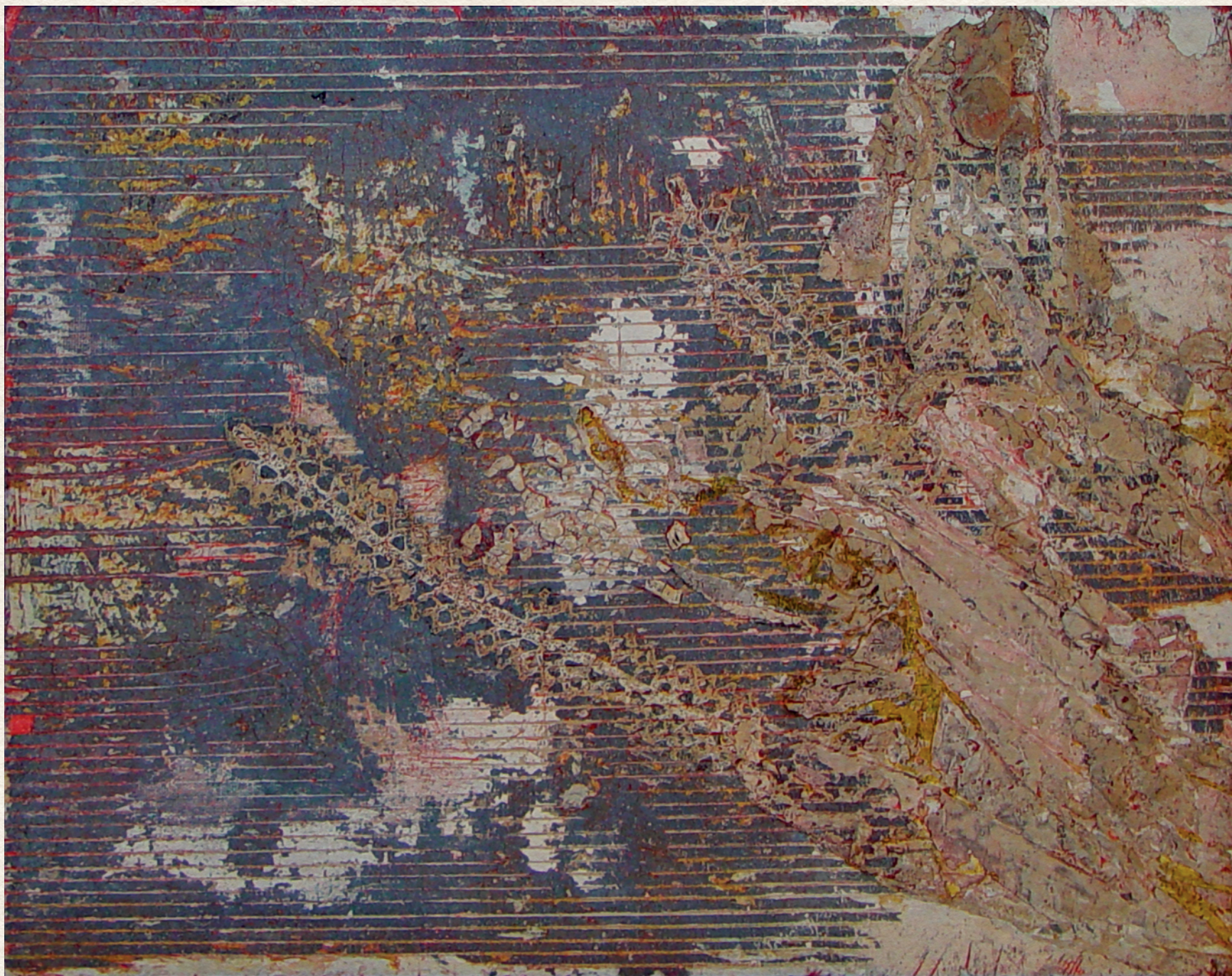
BUKOTT ANGYAL - 1968., fa, vegyes technika, 77,5x65,5 cm