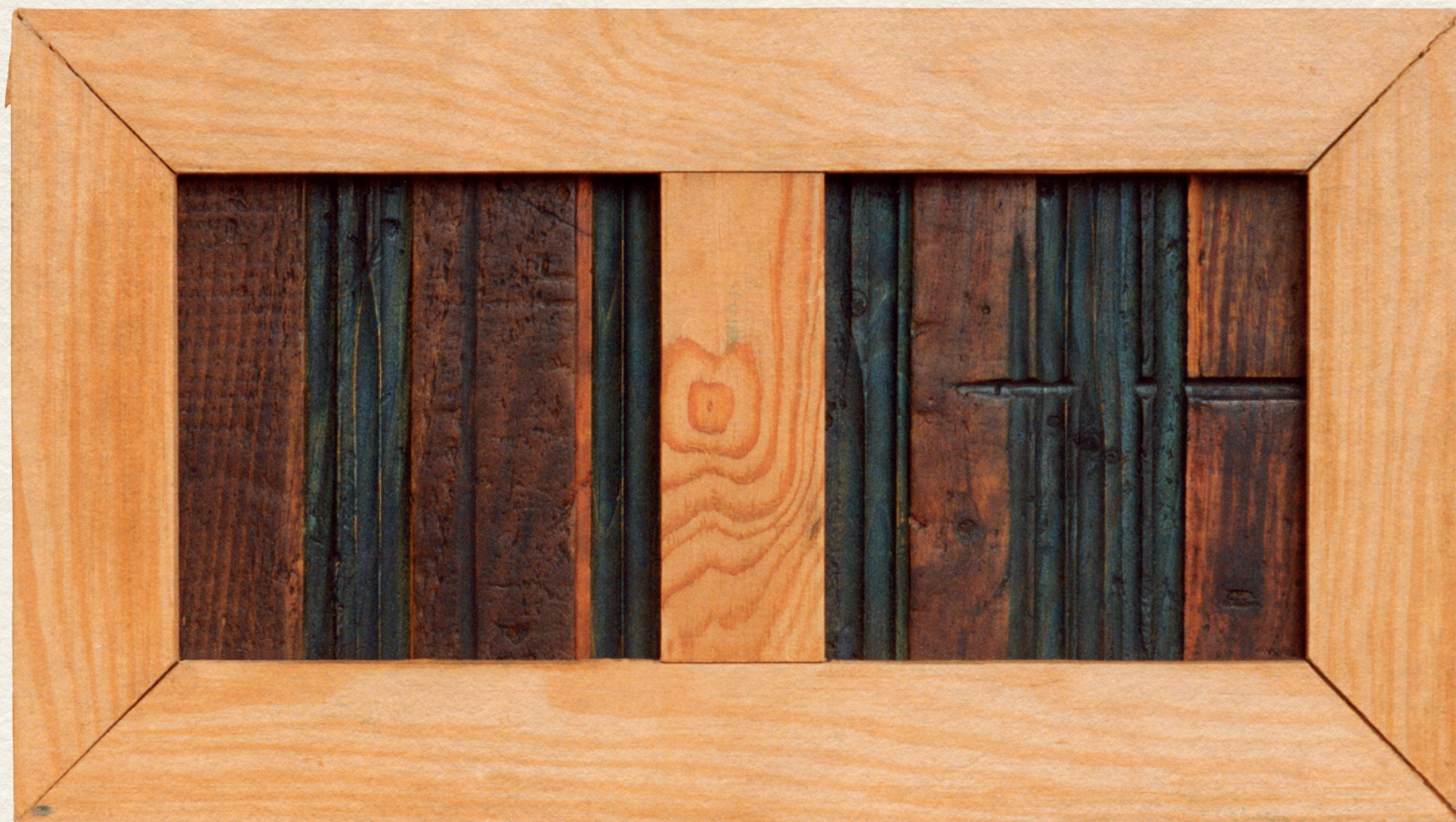
KIS DIPTICHON - 196., fa, színes pác, 35x43 cm