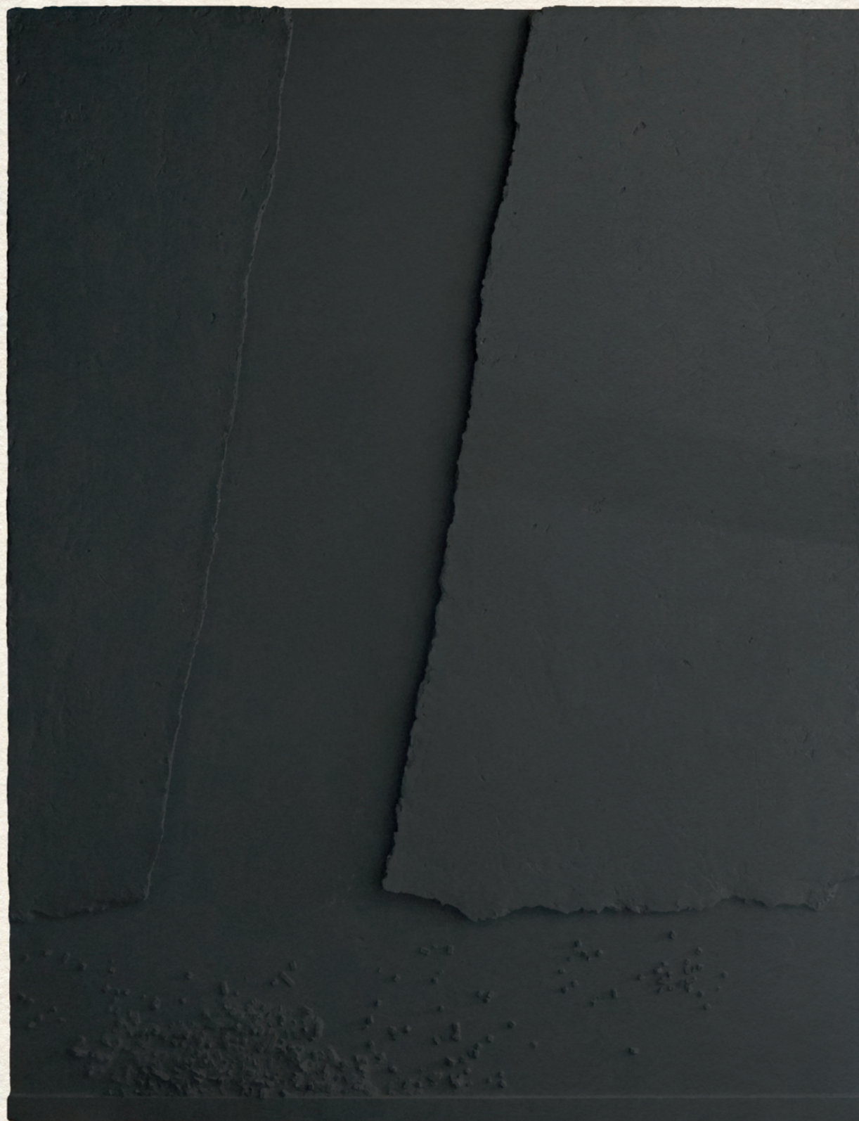
SZÜRKE KÉP - 1969., fa, vegyes technika, 125x95 cm