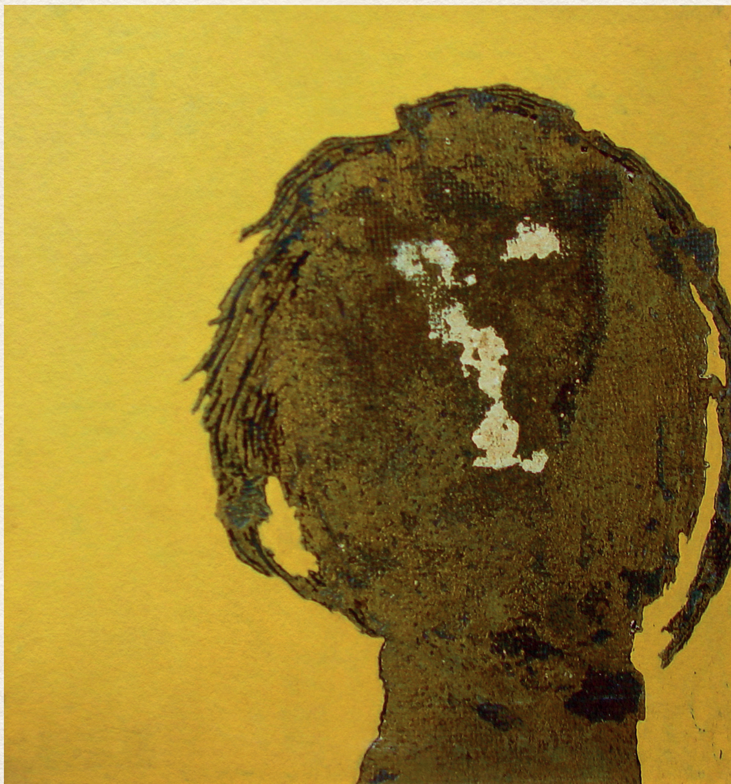
FEJ II. - 1965., farost, gitt, olaj, aranyozás, 22,5x21 cm