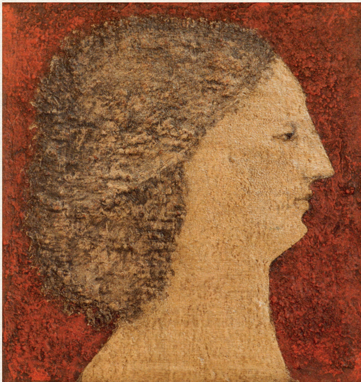
NŐI FEJ II. - 1964., farost, olaj, 25,5x24 cm