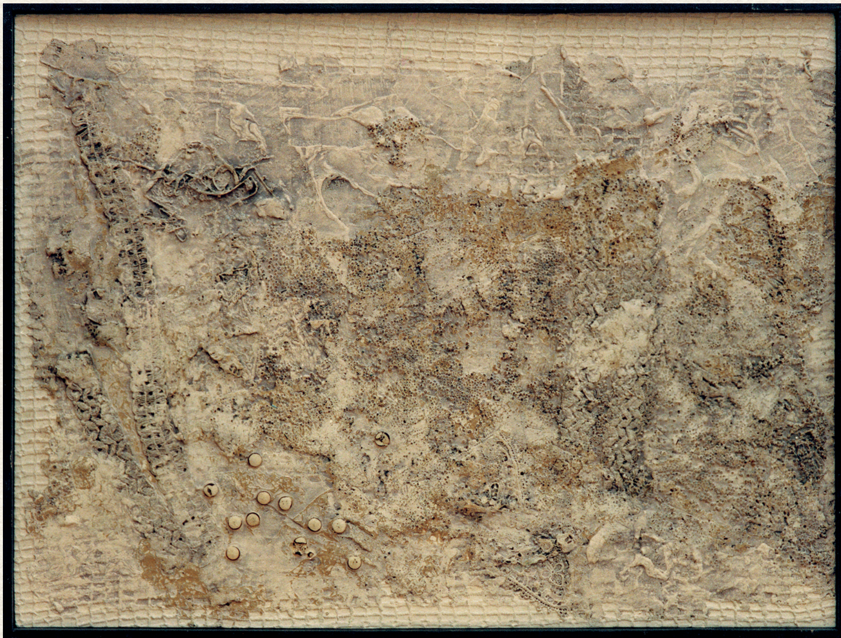
URÁNIA - 1967., farost, vegyes technika, 62x82 cm