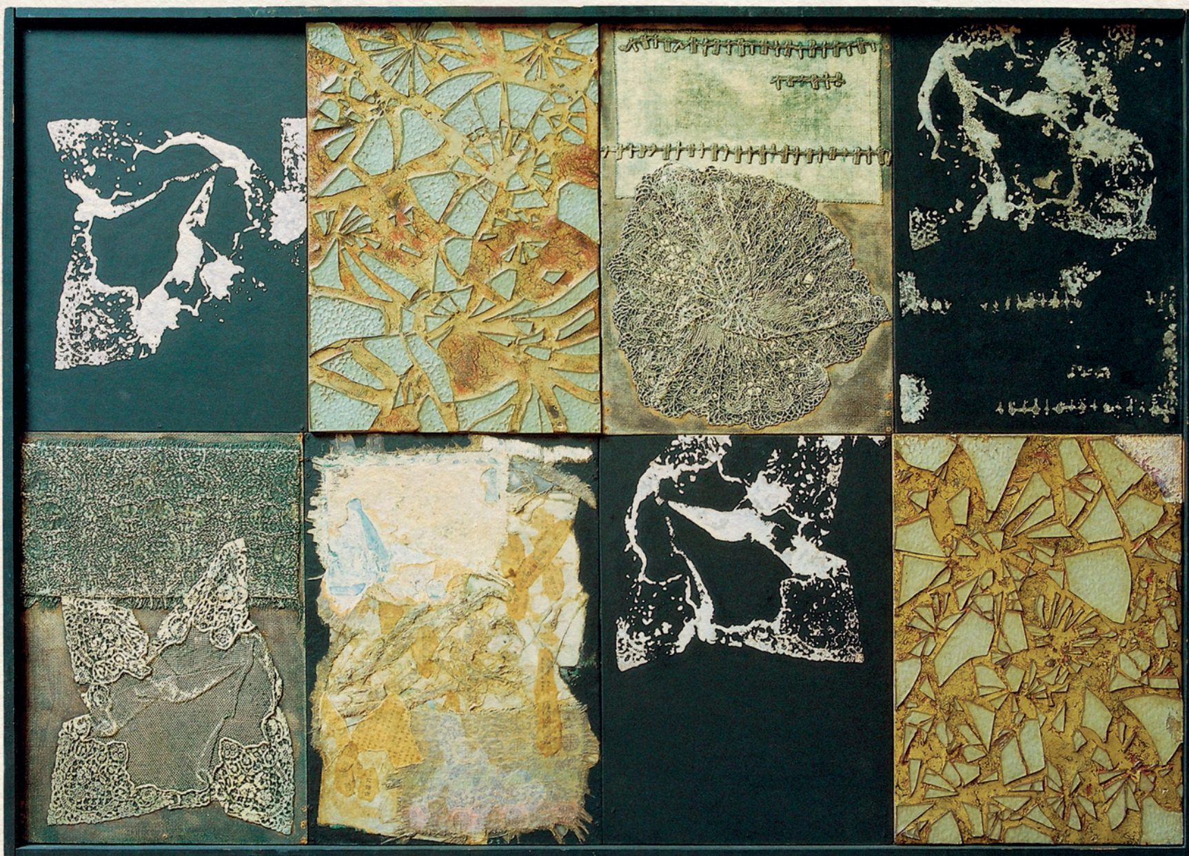
14/67 - 1967., fa, vegyes technika, 72x100 cm