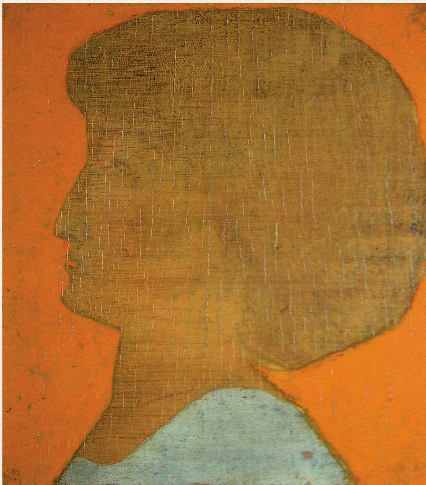
FEJ PROFILBÓL - 1965., fa, olaj, 22x19,5 cm