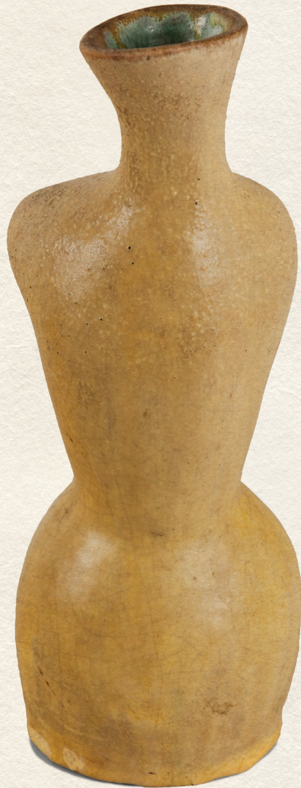
KERÁMIA VÁZA - 1950., mázas kerámia, 21x8,5x18 cm