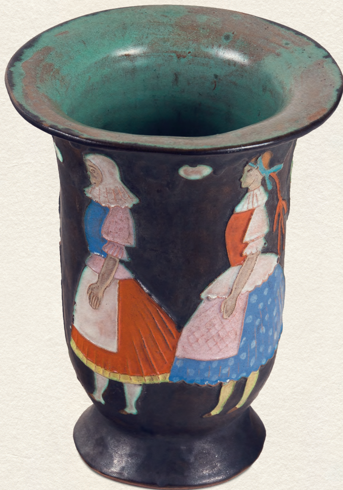
VÁZA - 1930., színes kerámia, 17x13x16 cm