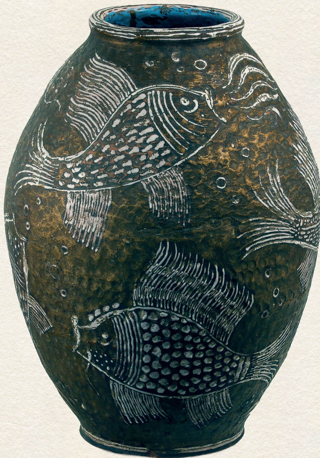
VÁZA - 1940., színes kerámia, 51x38x48 cm