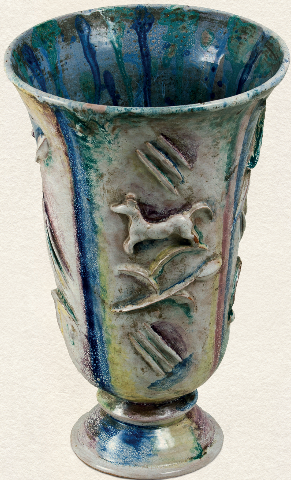
VÁZA - 1920., színes kerámia, 29x18,5x23 cm