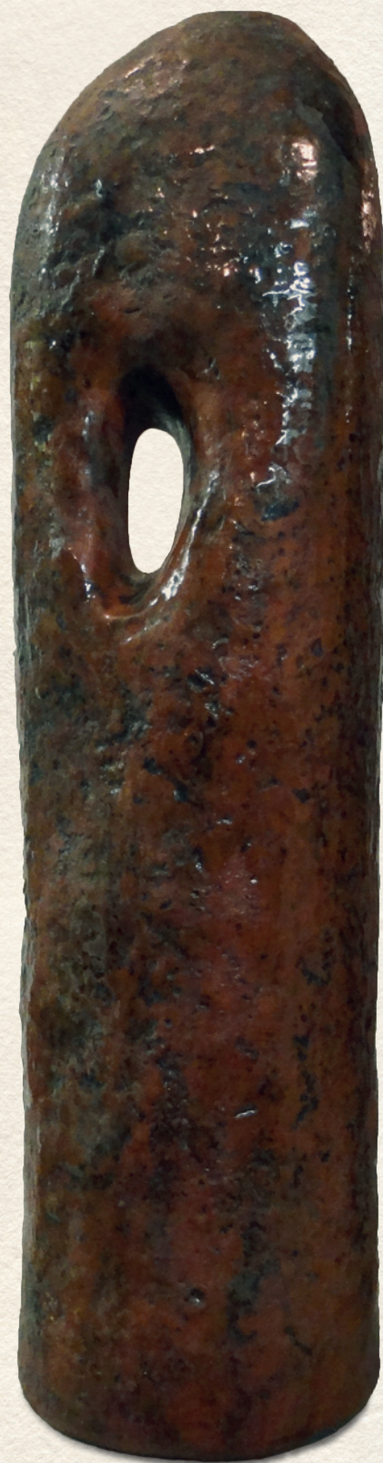
VÁZA - kerámia, 37x9,5 cm