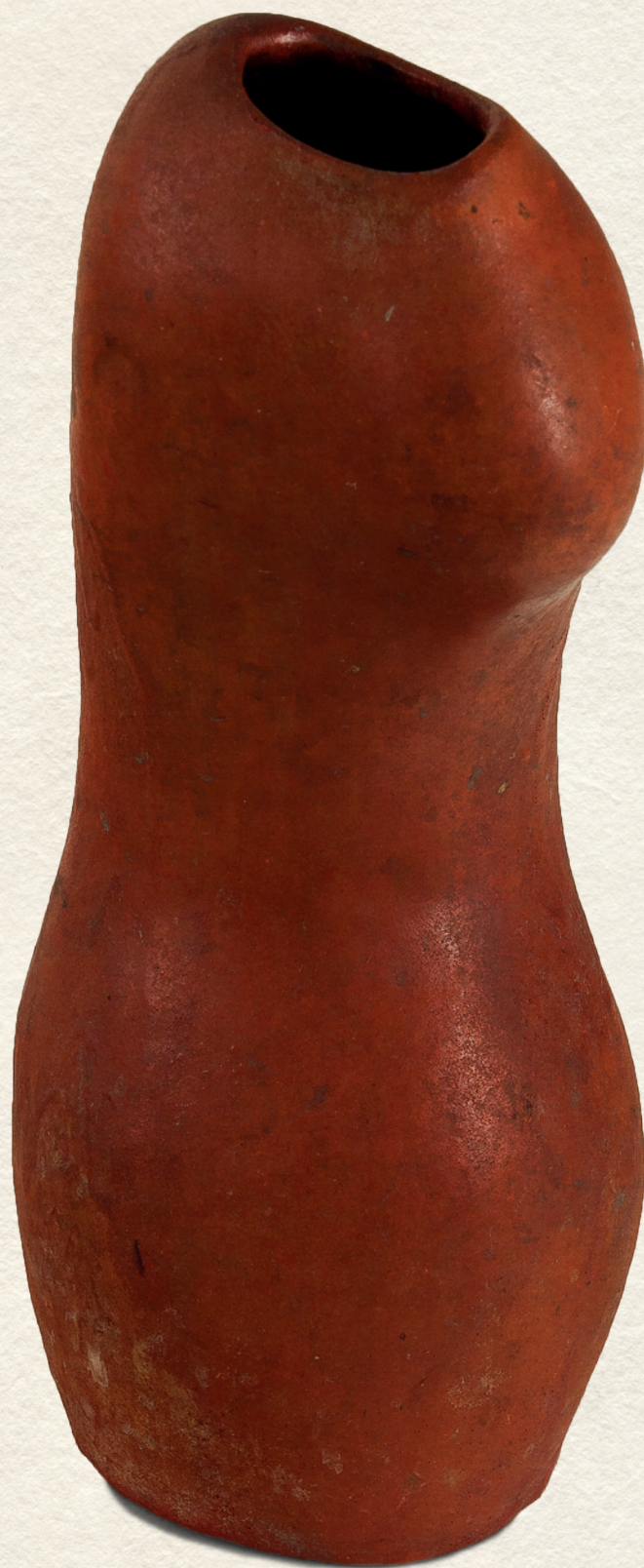
KERÁMIA VÁZA - 1940., mázas kerámia, 24x10,5x23 cm