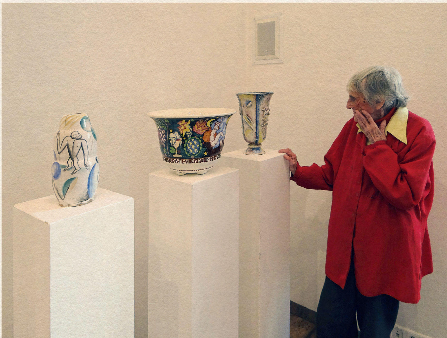
GÁDOR ISTVÁN KIÁLLÍTÁS - 2015., Budapest, Körmenđi Galéria