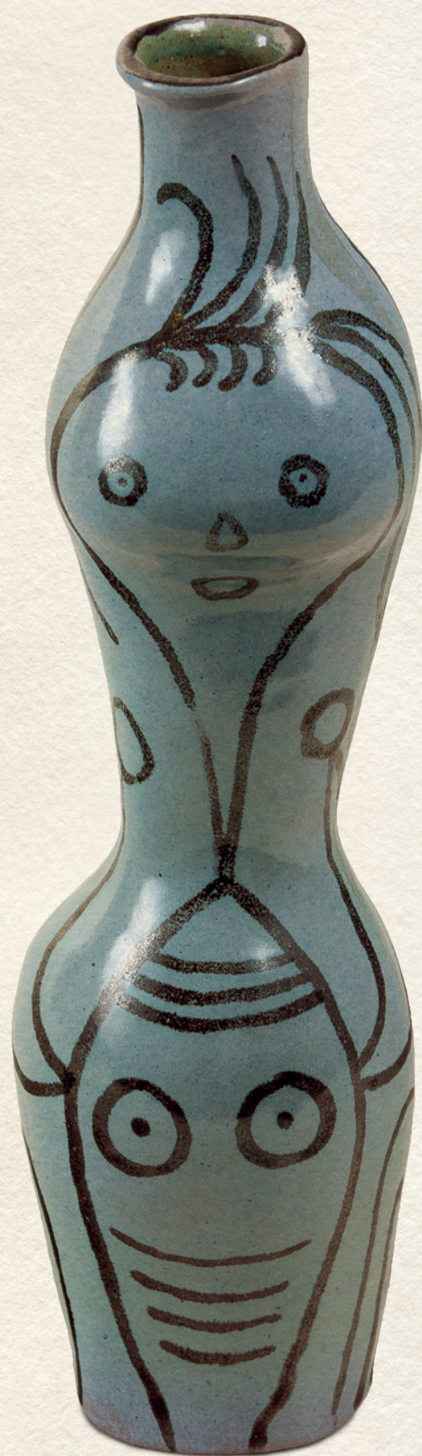
ÍRÓKÁZOTT KERÁMIA VÁZA - 1950-54., mázas kerámia, 26,5x8x25 cm