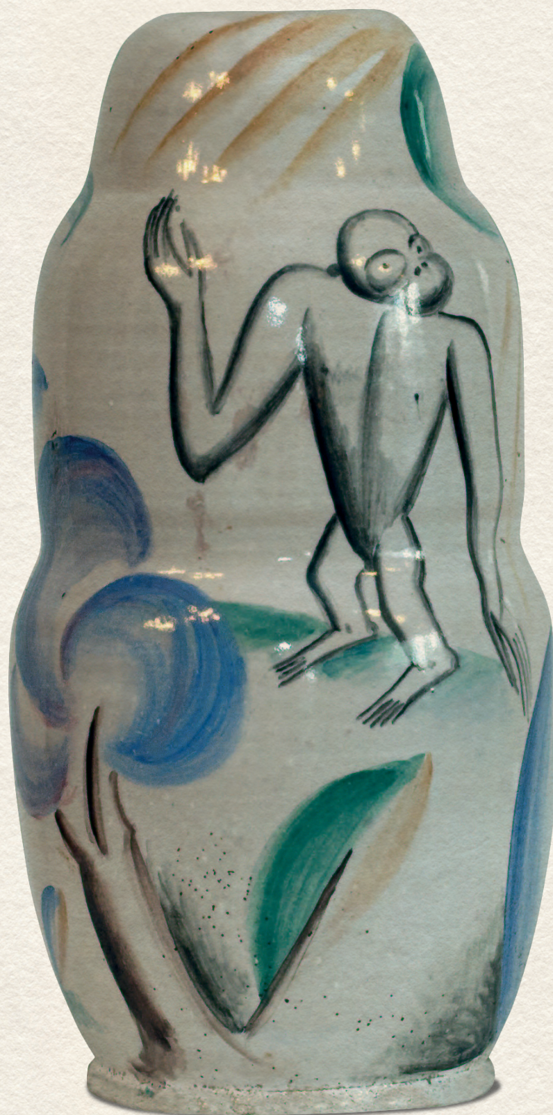
VÁZA - 1925., színes kerámia, 27x10x10 cm