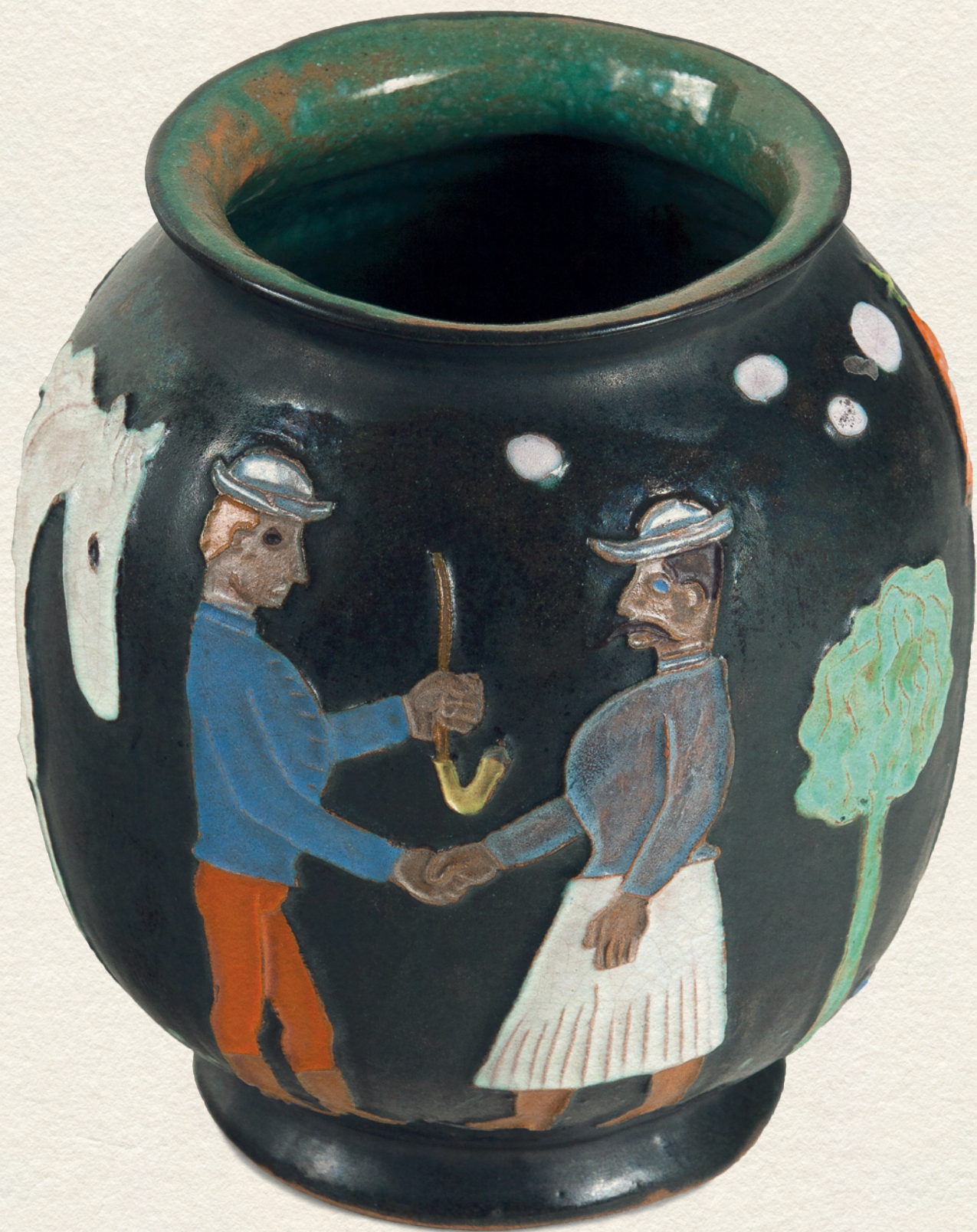
VÁZA - 1936., színes kerámia, 15x13x13,5 cm