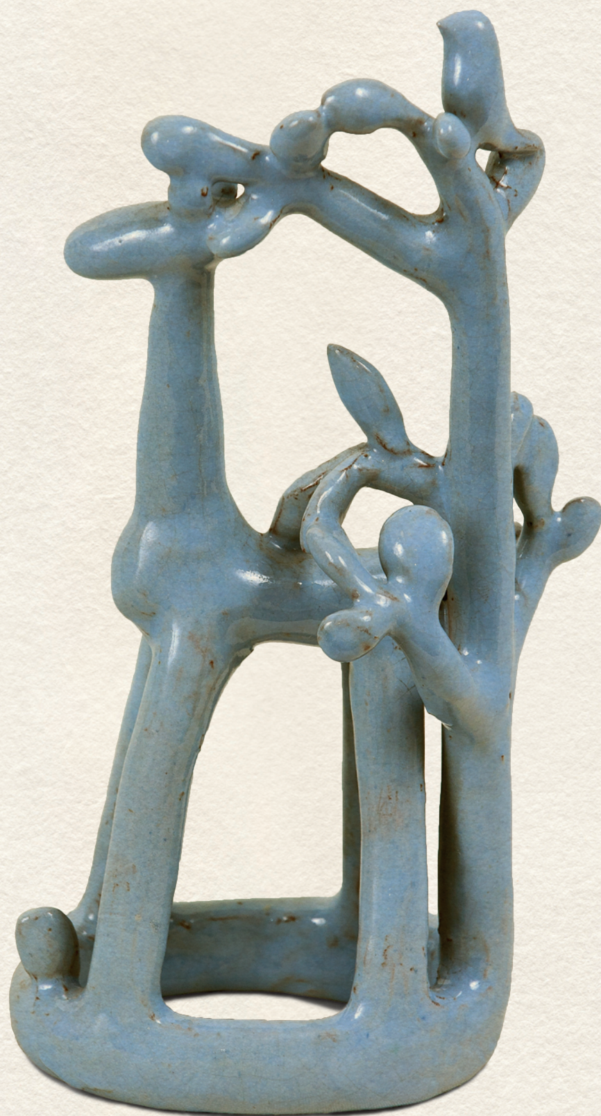
TÁJKONSTRUKCIÓ - 1940., színes kerámia, 17,8x6x8 cm