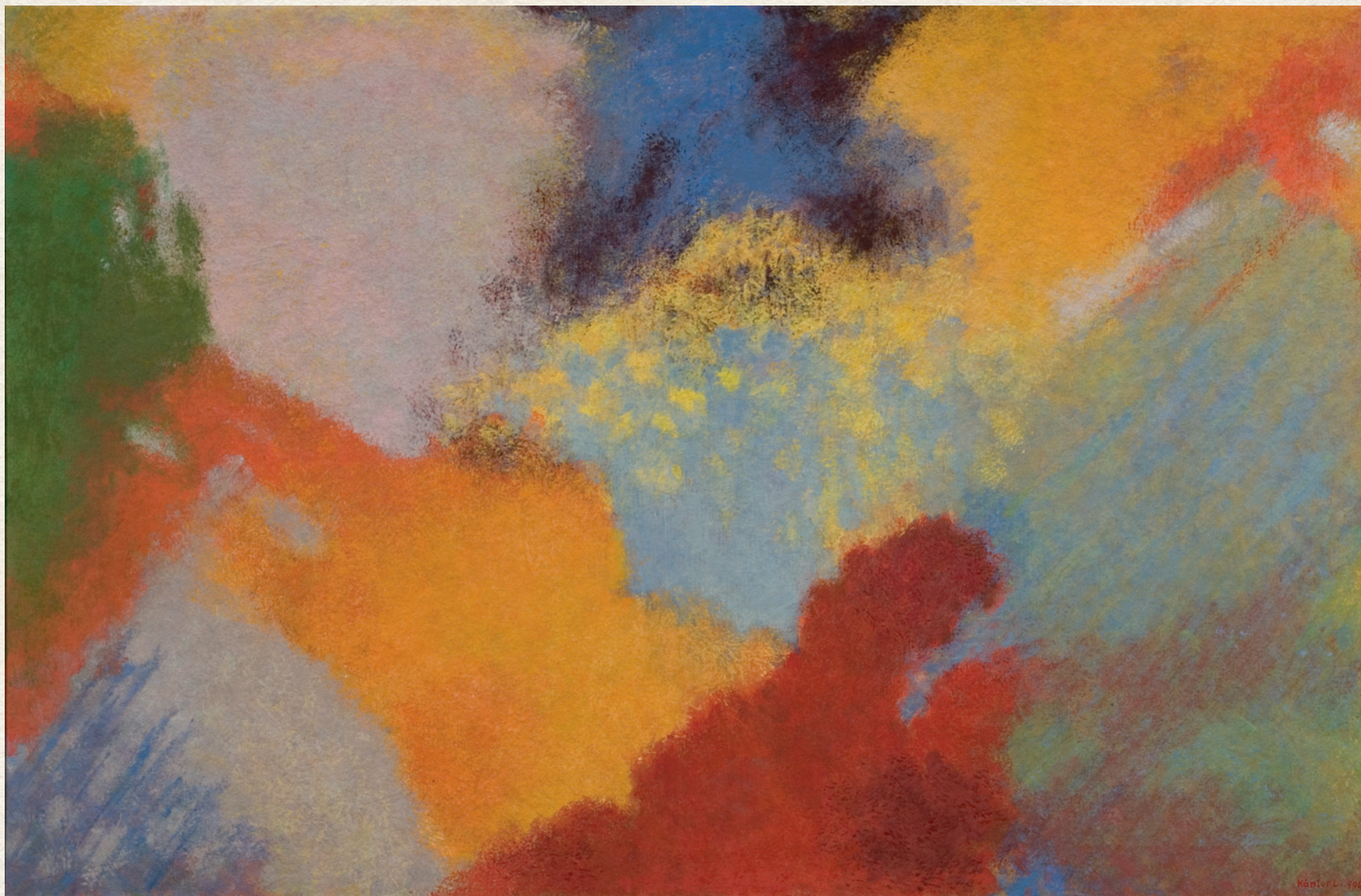
ÁLOM ÉS ÉBRENLET HATÁRÁN - 1994., vászon, olaj, 90x140 cm