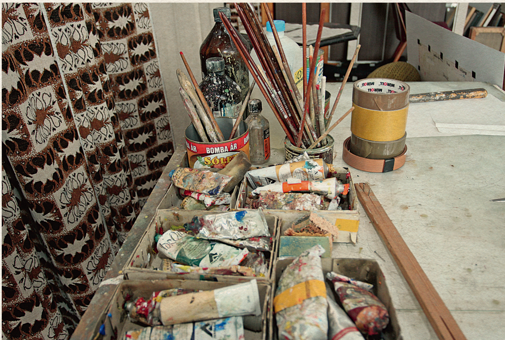
KÁNTOR LAJOS MŰTERMÉBEN - 2007.