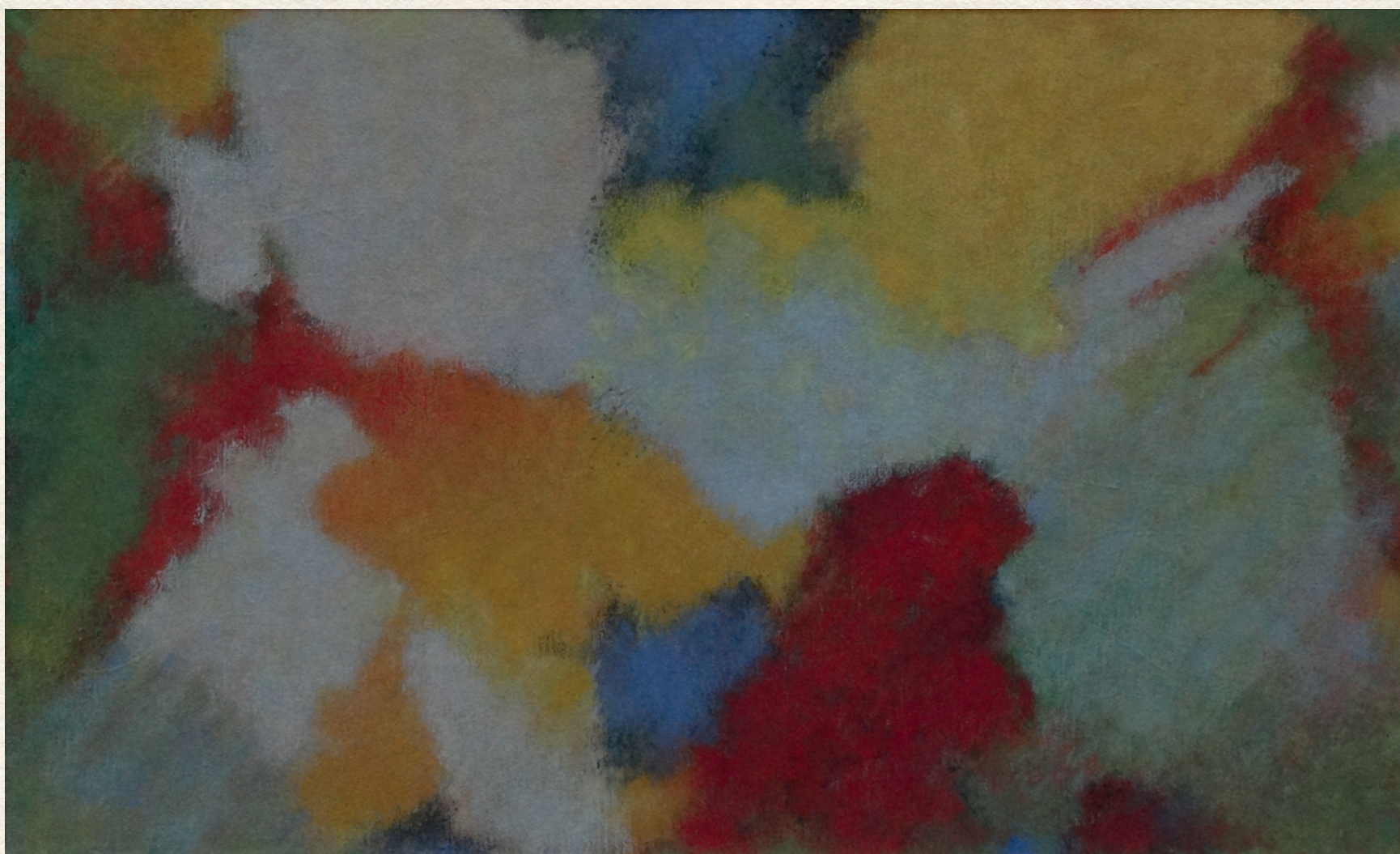
ÉLFELEJTETT MÚLT - 1989., vászon, olaj, 70x90 cm