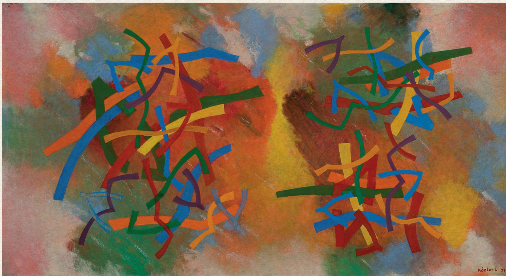
TŰZEK - 1975., vászon, olaj, 80x150 cm