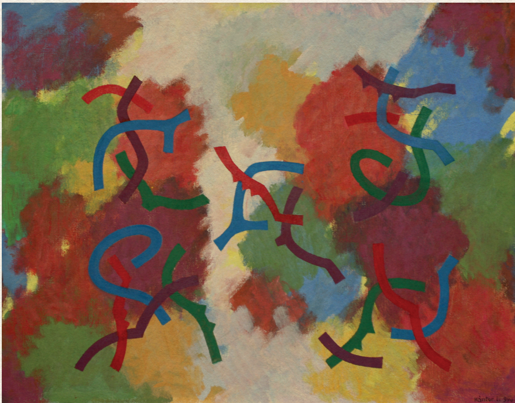
ŐSZI FÉNYEK - 1990., vászon, olaj, 70x90 cm