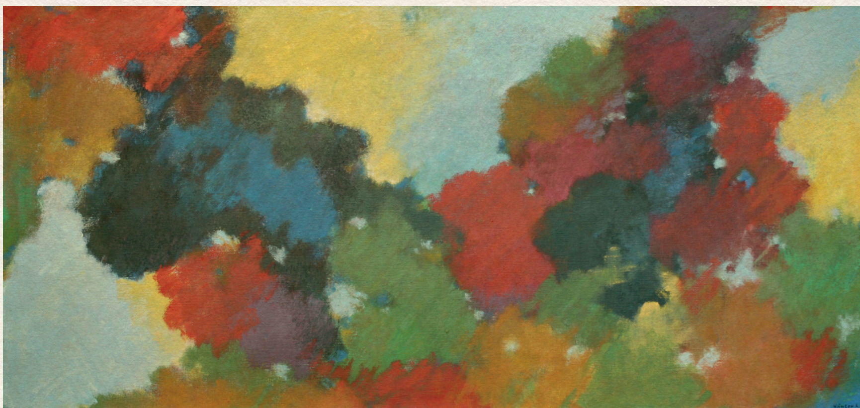
FELHŐK - 1994., vászon, olaj, 70x150 cm