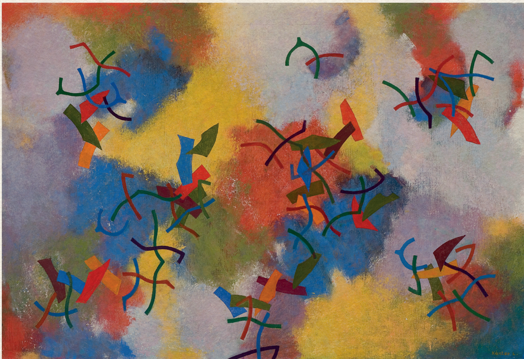
DÉLUTÁNI SZÍNEK - 1980., vászon, olaj, 81x121 cm