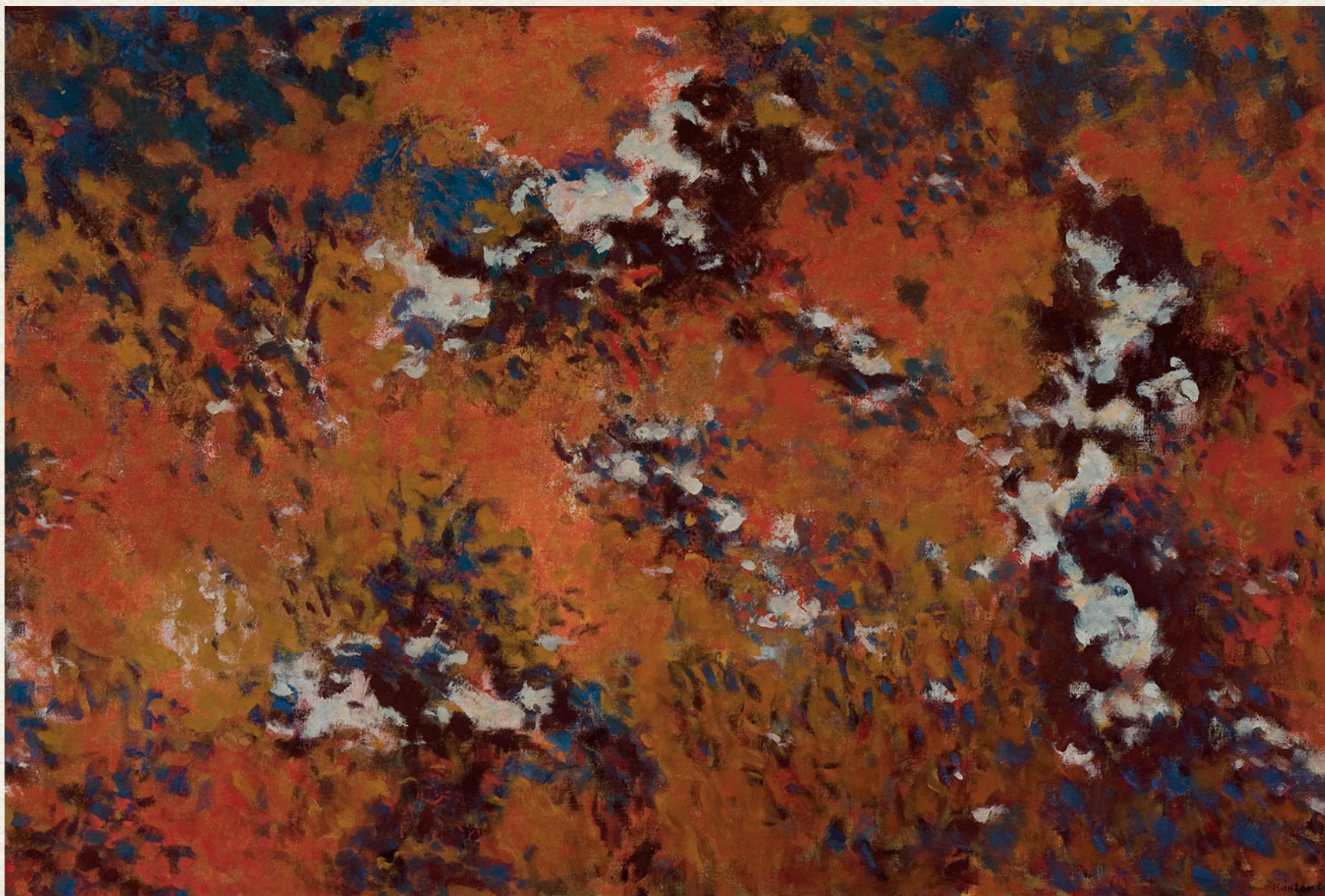
AGÓNIA I. - 1993., vászon, vegyes technika, 80x120 cm