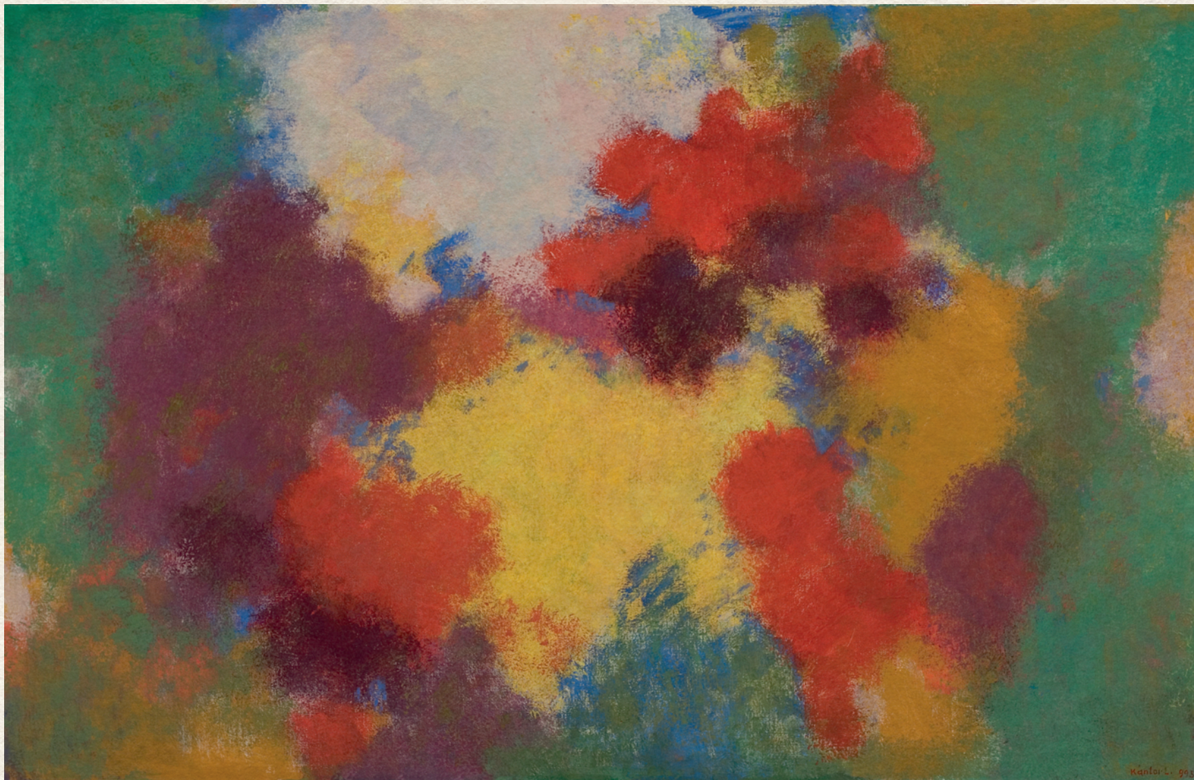
PSZICHOGÉN FORMÁK II. - 1993., vászon, olaj, 90x140 cm