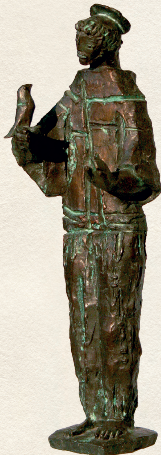
SZENT FERENC - 1964., bronz, 42x13x14 cm