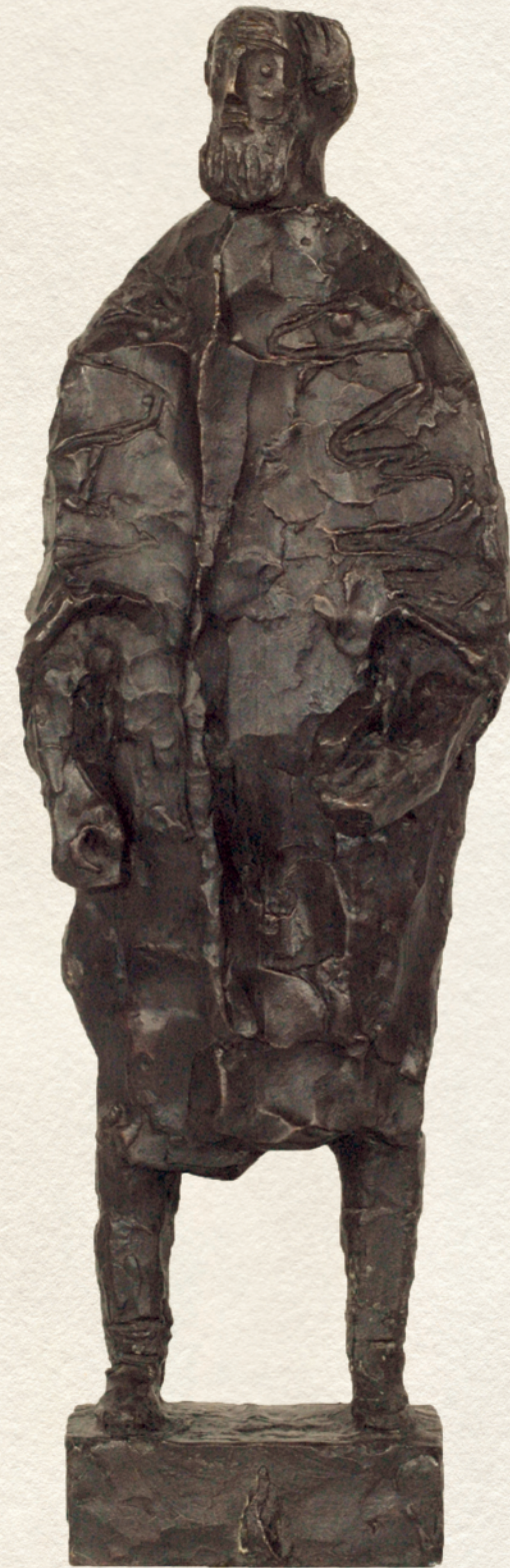
TÁNCICS - bronz, 43x14x12 cm