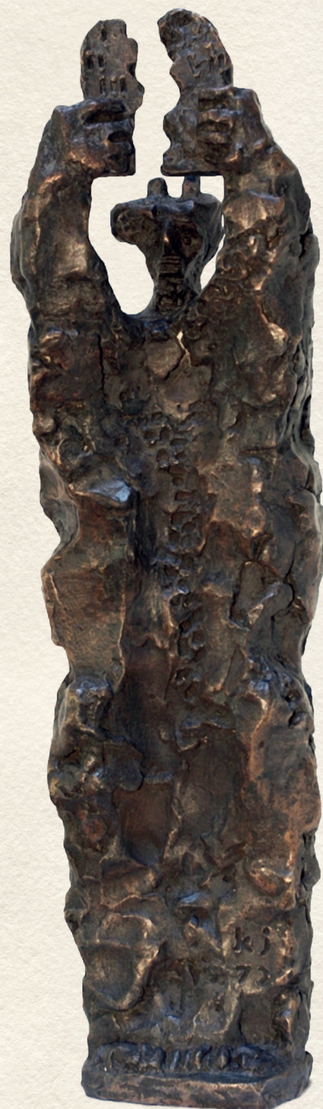
MÓZES II. - 1972., bronz, 50x14x14,5 cm