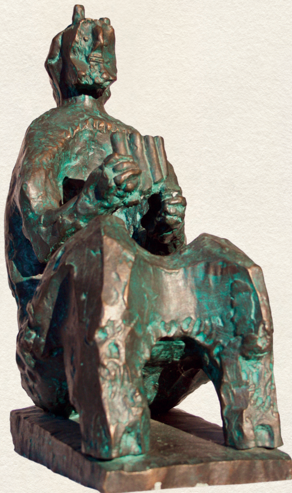
DÍSZKÚT FAUN PÁNSÍPPAL - VÁROSLIGETI SZOBORTERV - 1971., bronz, 39 cm