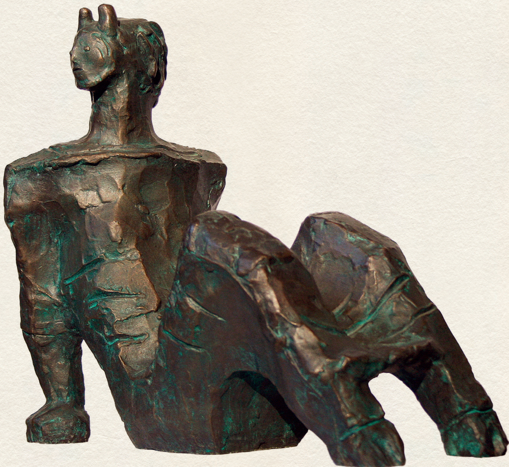
FAUN (GYŐRI KÚTNAK TANULMÁNYA) II. - 1971., bronz, 28 cm