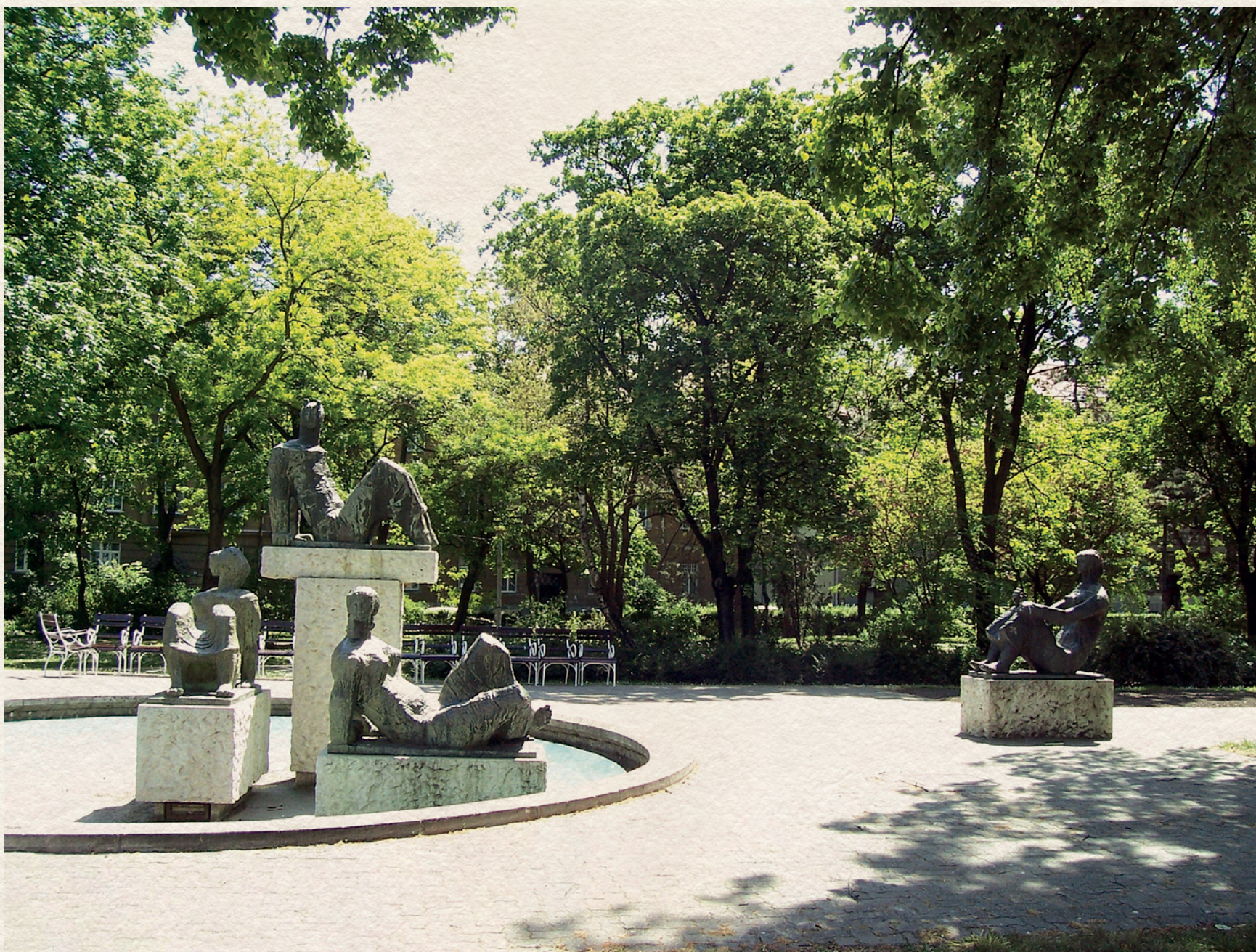
FAUN ÉS NIMFÁK (GYŐR, BIZINGER SÉTÁNY) - 1967., bronz négyfigurás díszkút, 320 cm