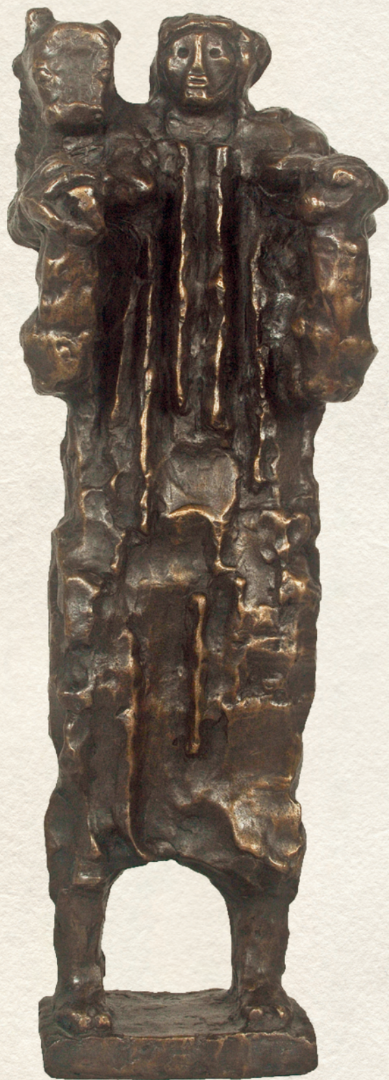
JÓ PÁSZTOR - 1974., bronz, 54x20x18 cm