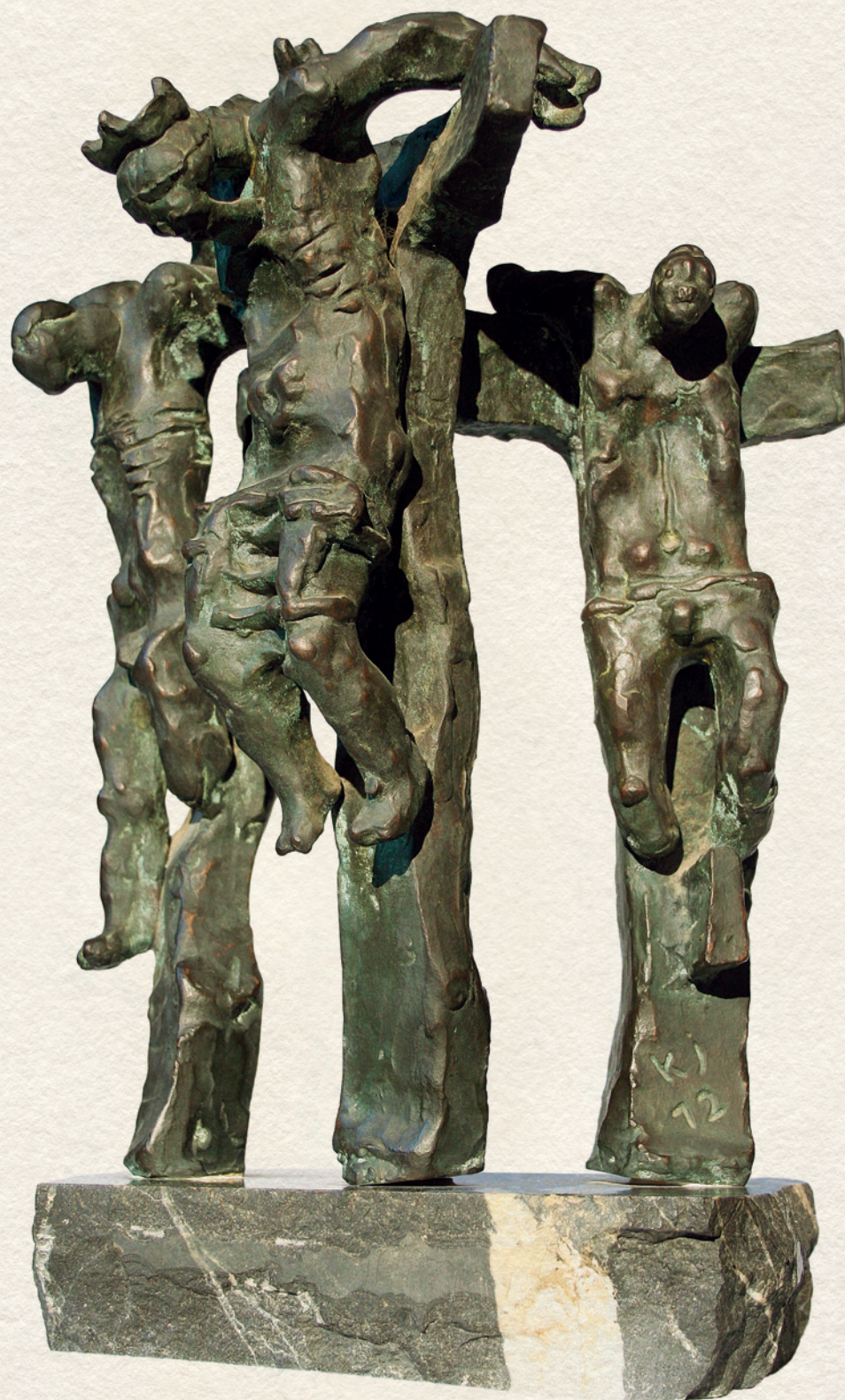
GOLGOTA - 1972., bronz, 40x28x28 cm