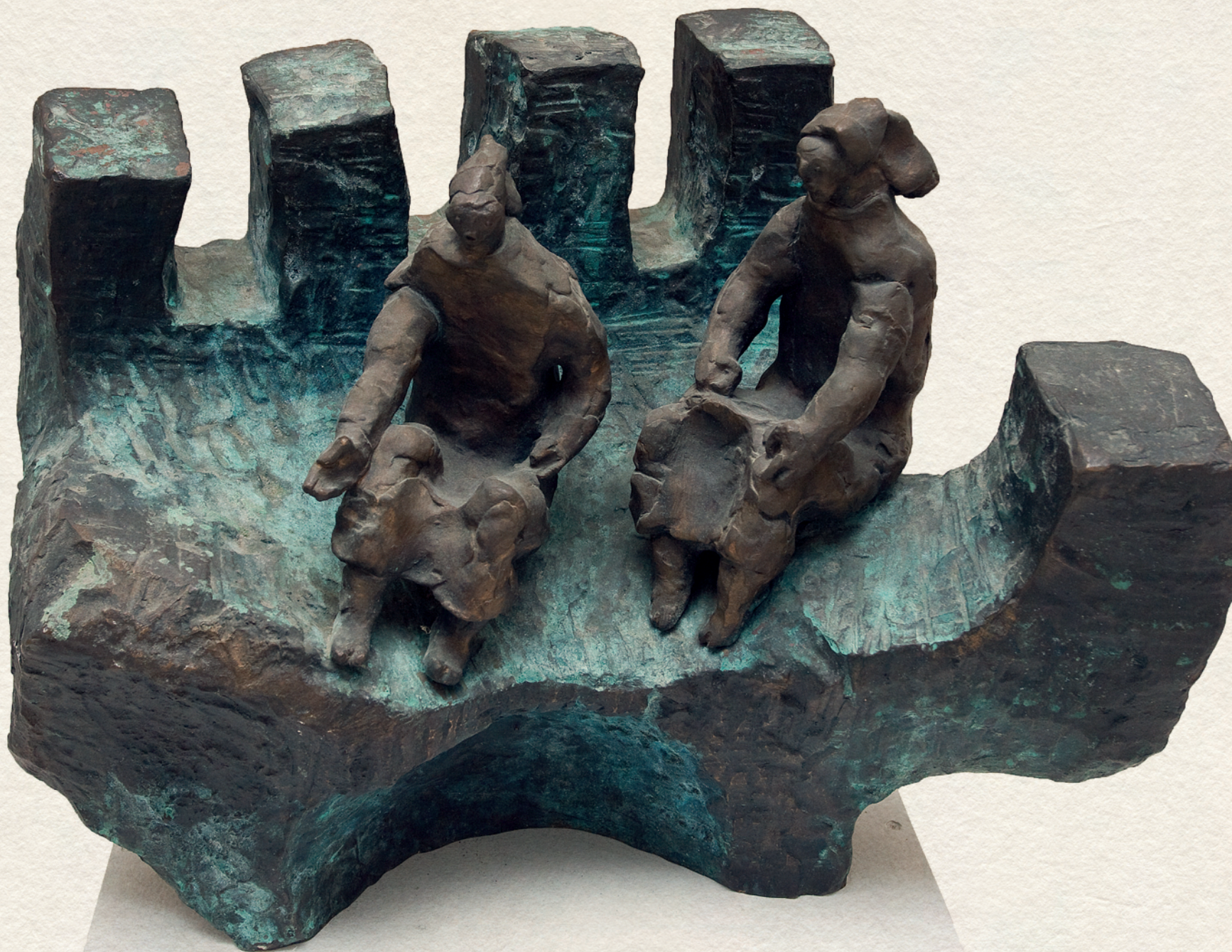
DANTE ÉS VERGÉLIUS AZ ALVILÁGBAN - 1974., bronz, 40x48x25 cm