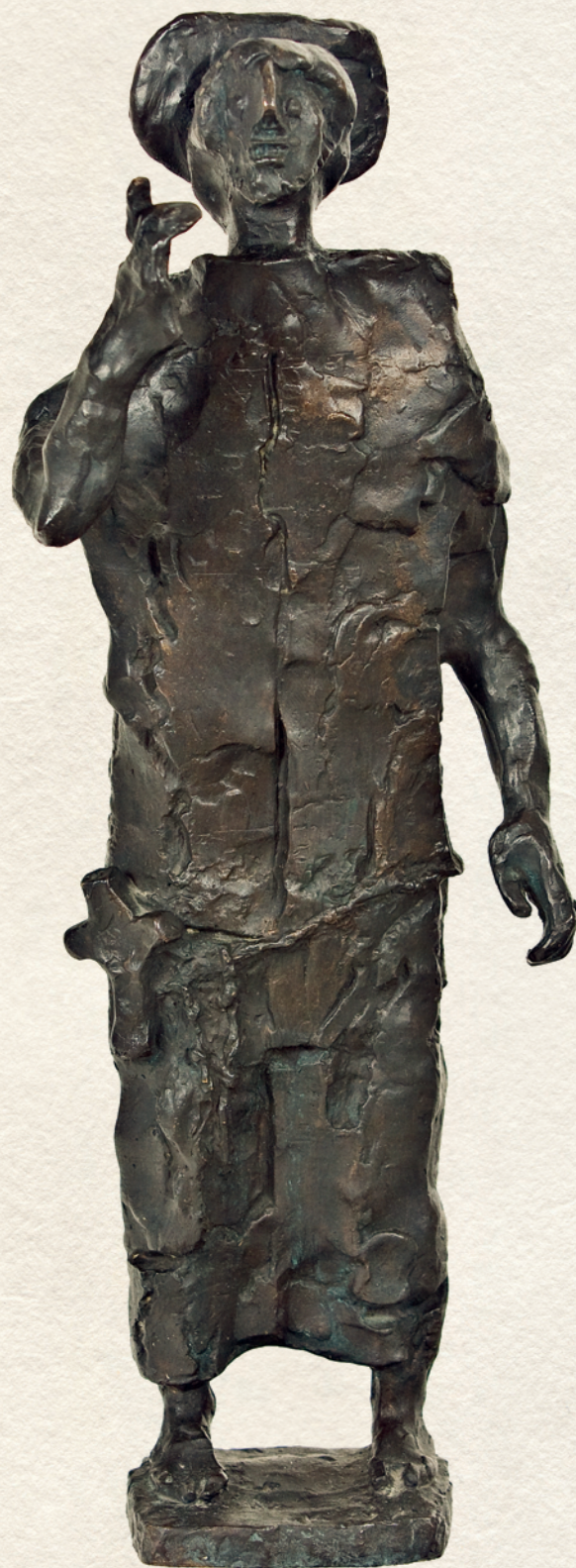
AZ ŐRÜLT PRÓFÉTA - 1962., bronz, 42x16x11 cm