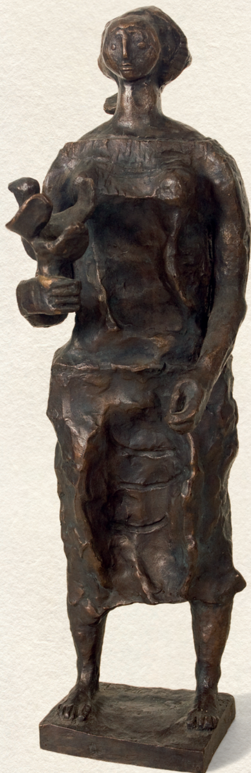
MADARAS LÁNY - 1964., bronz, 45x15x16 cm