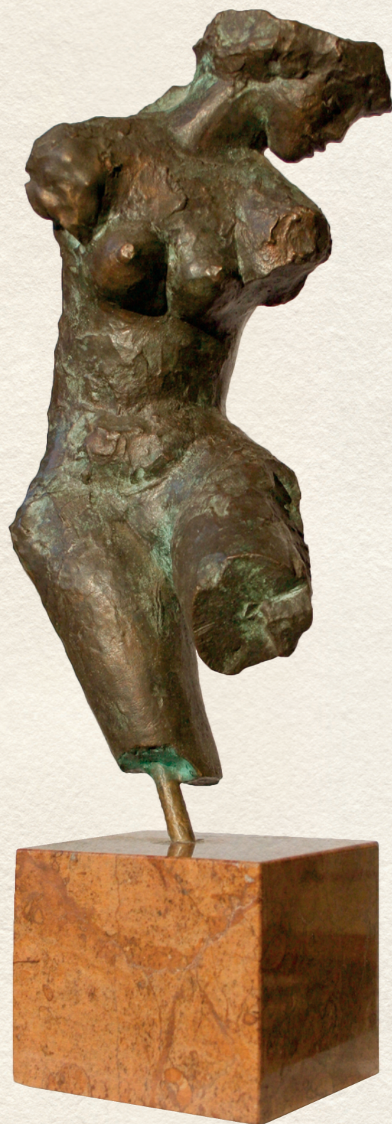
TÖRZŐ - 1962., bronz, gránit talp, dombormű, 27x10x12 cm