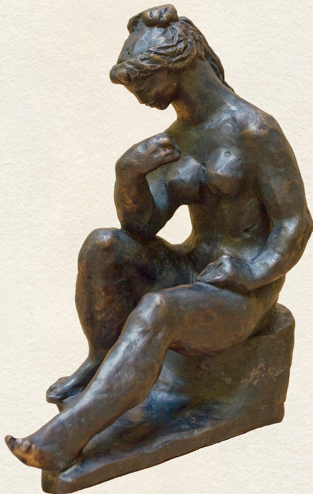
ÜLŐ LEÁNY - 1962., bronz, 25x12x22 cm