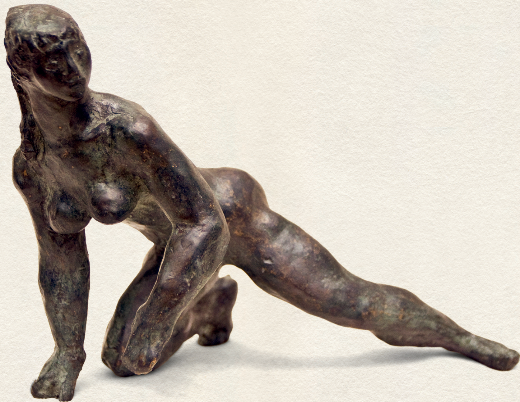
CsúszkÁLÓ - 1959., bronz, 16x20x14 cm