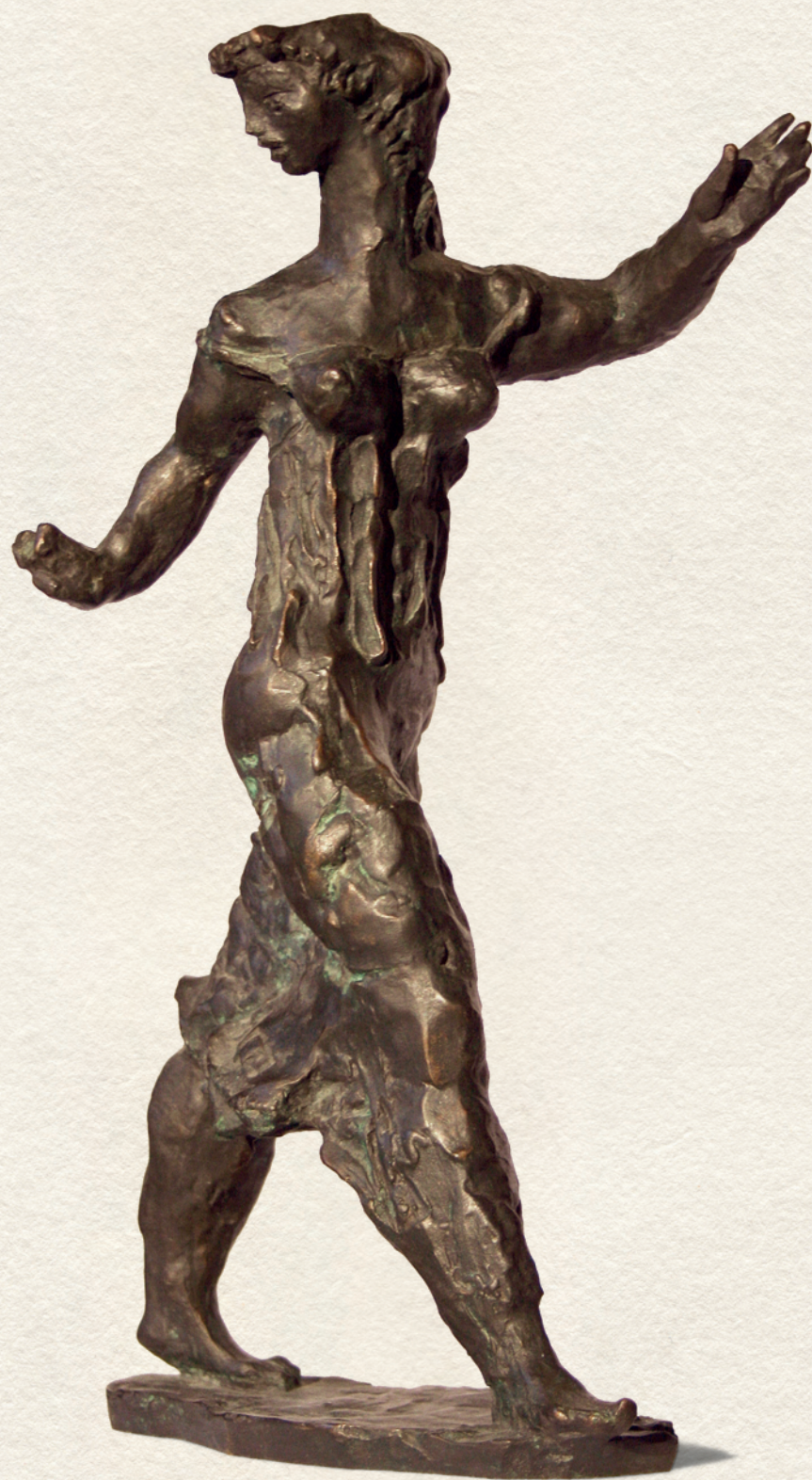
ANGYALKA - 1958., bronz, 41x24x18 cm