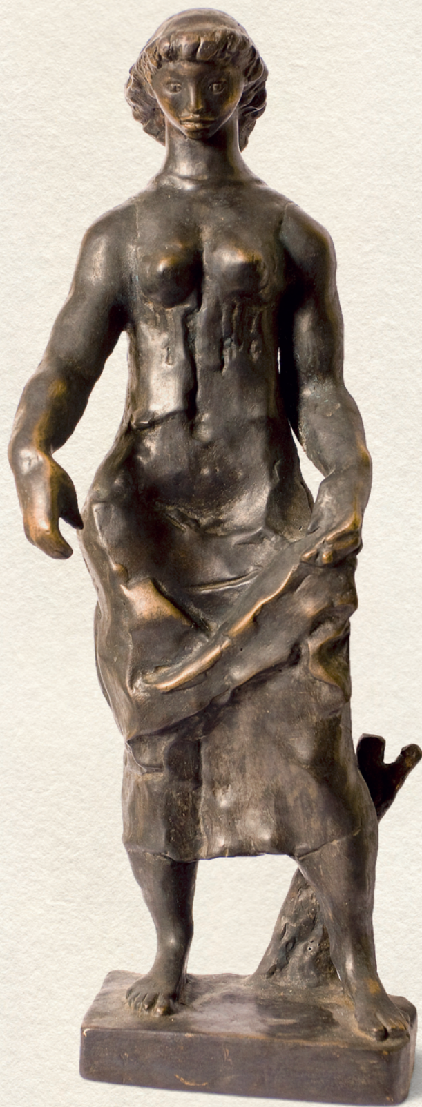
ÁLLÓ NŐ - 1955., bronz, 33x13x9 cm