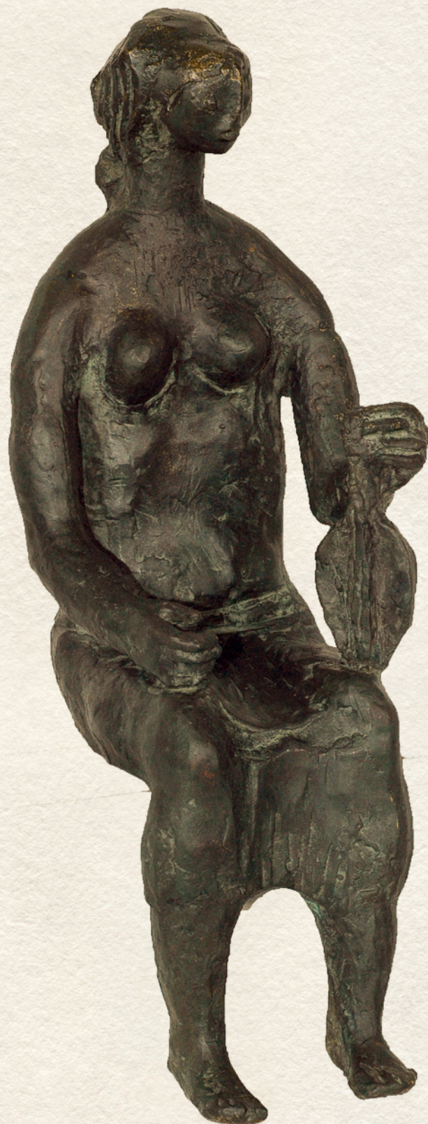
LEÁNY LANTTAL - 1964., bronz, 31x12x16 cm