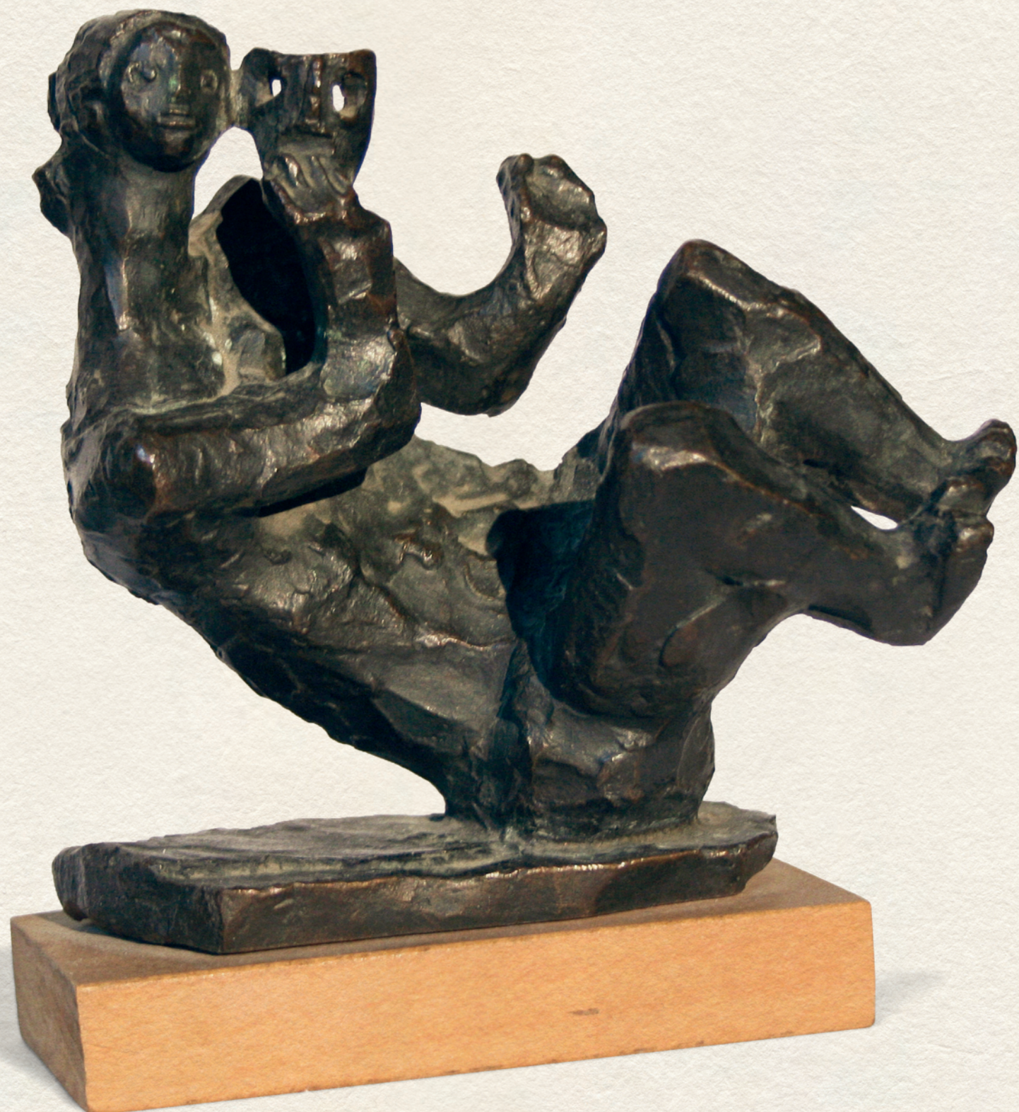
ÁLARCOS - 1962., bronz, 14x14x10 cm