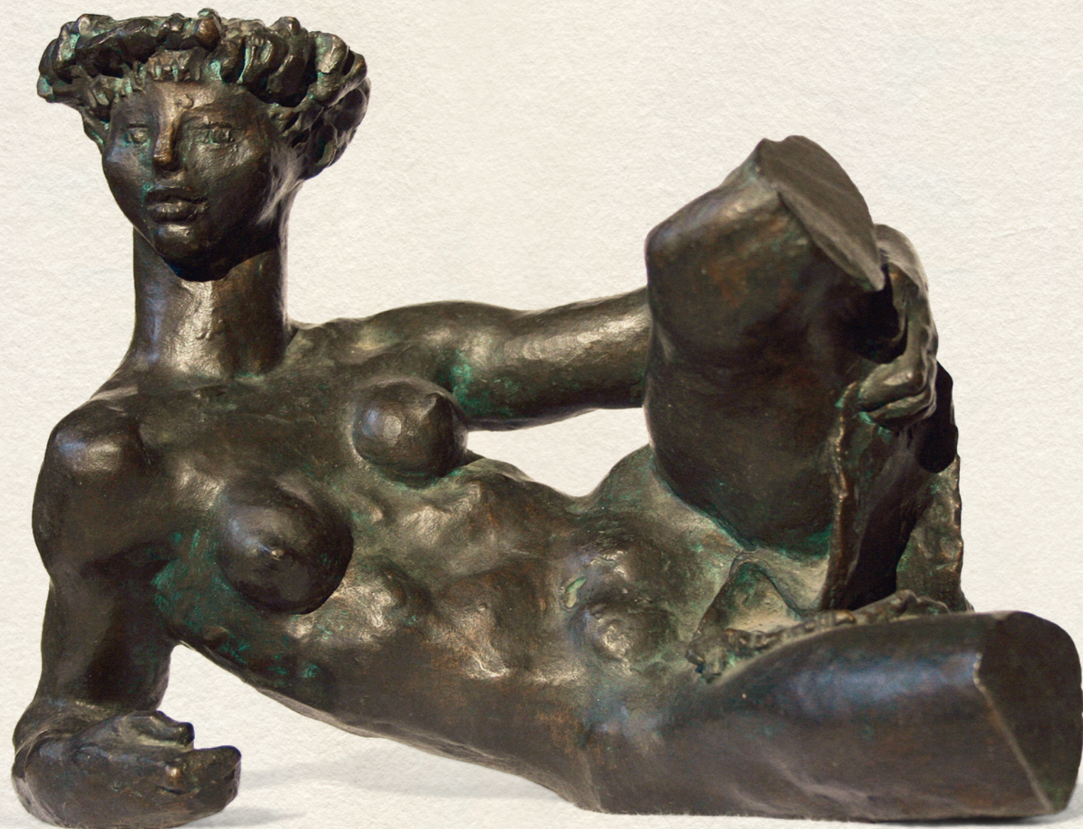
FEKVŐ TORZÓ - 1950., bronz, 16,5x21x15 cm