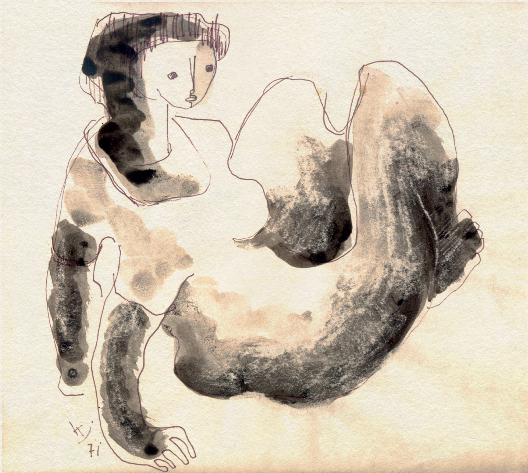
TÁMASZKODÓ II. - 1971., papír, lavírozott filctoll, 240x250 mm