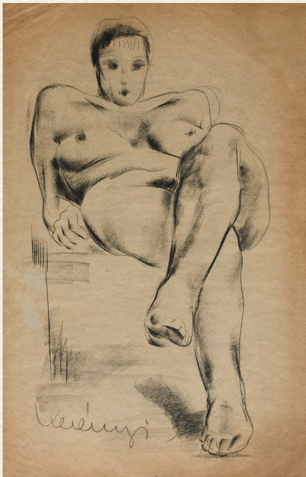
CÍM NÉLKÜL - papír, szén, 45x29 cm