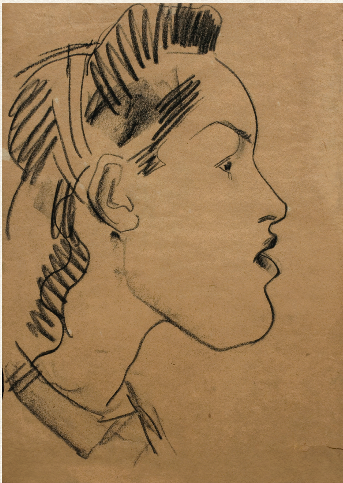
CÍM NÉLKÜL - papír, szén, 32x23,5 cm