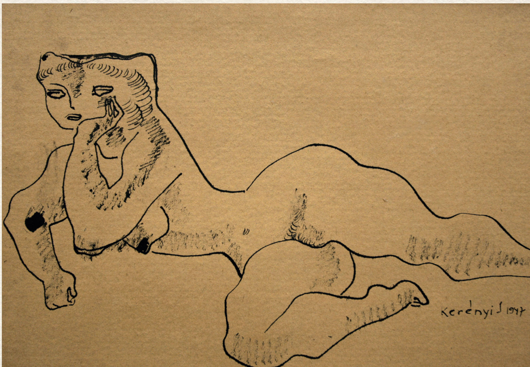
CÍM NÉLKÜL - 1947., papír, tus, 47x24 cm