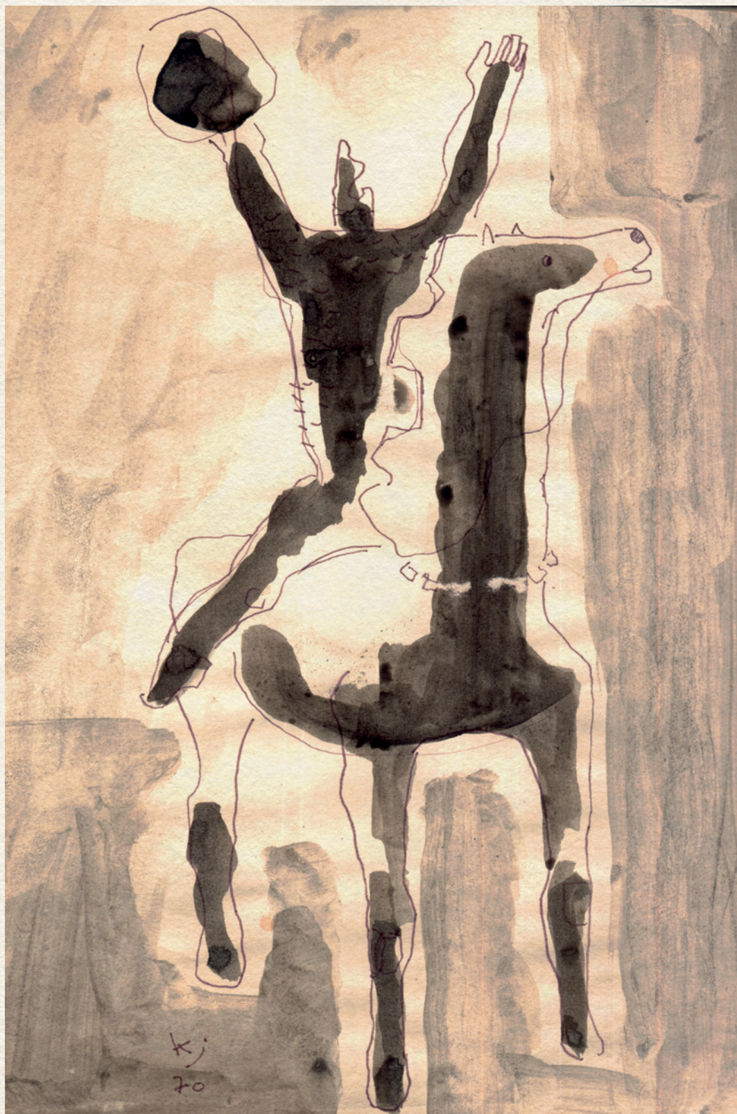
LOVAS HARCOS III. - 1970., papír, lavírozott filctoll, 300x197 mm