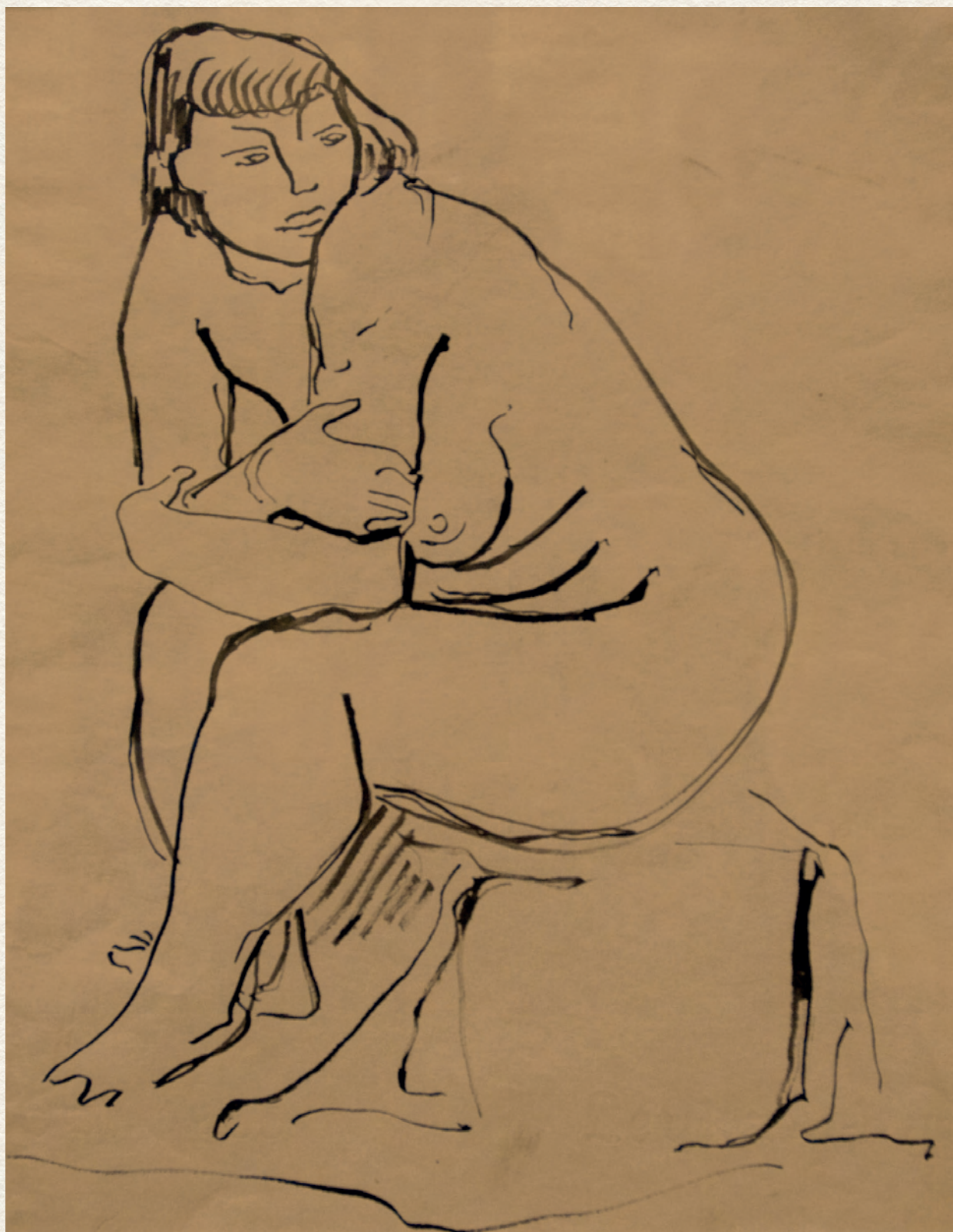
CÍM NÉLKÜL - papír, szén, 45x25,5 cm