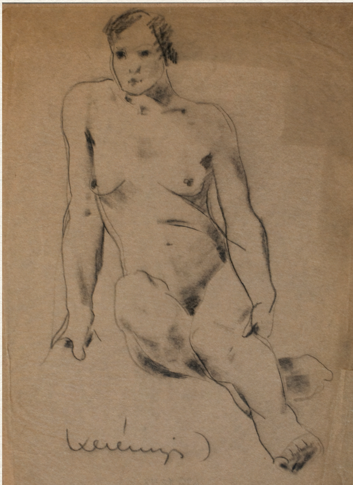
CÍM NÉLKÜL - papír, szén, 45x32 cm