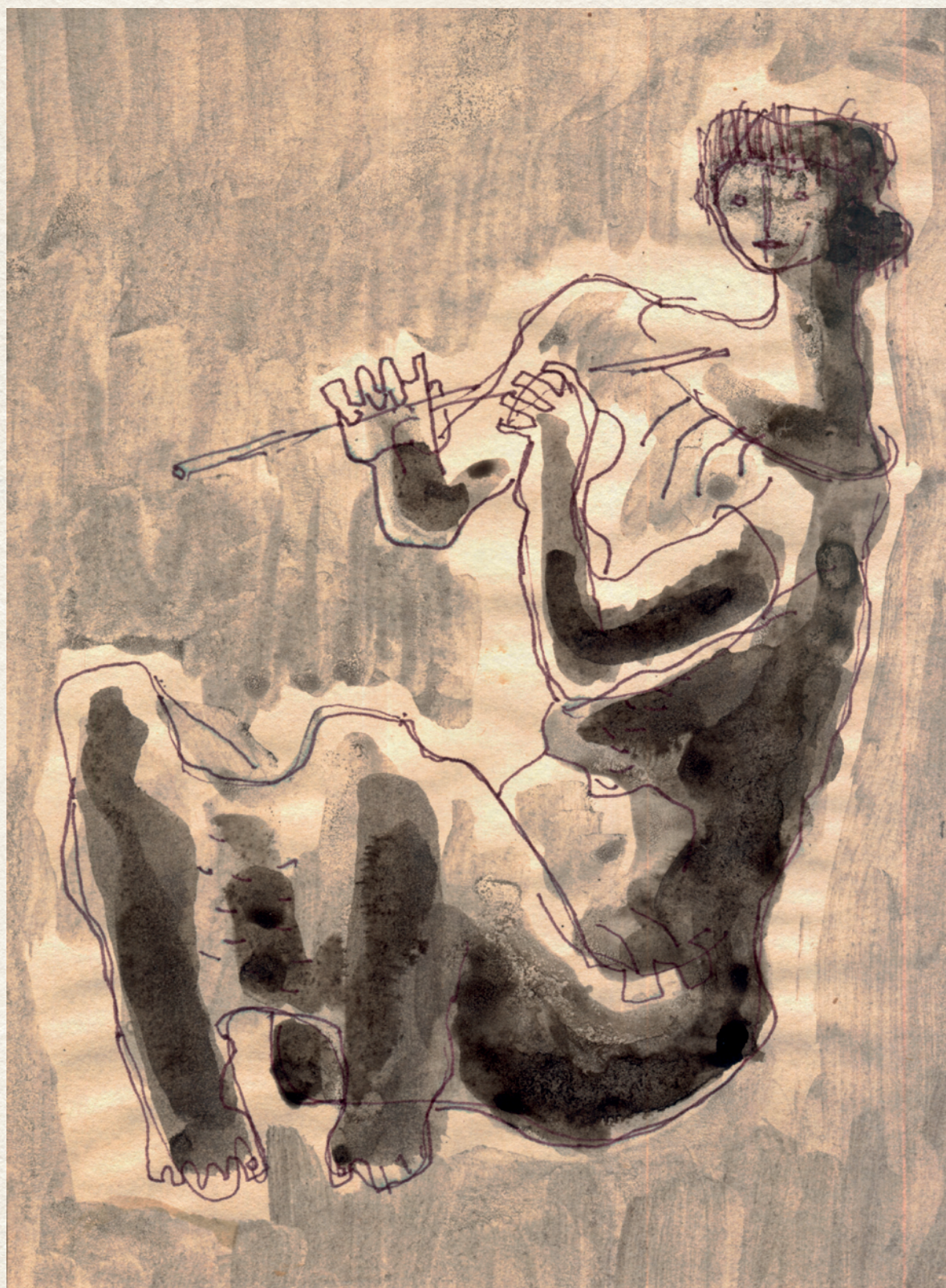
FÜVOLÁZÓ FAUNLÁNY III. - 1947., papír, lavírozott filctoll, 24,2x18 cm