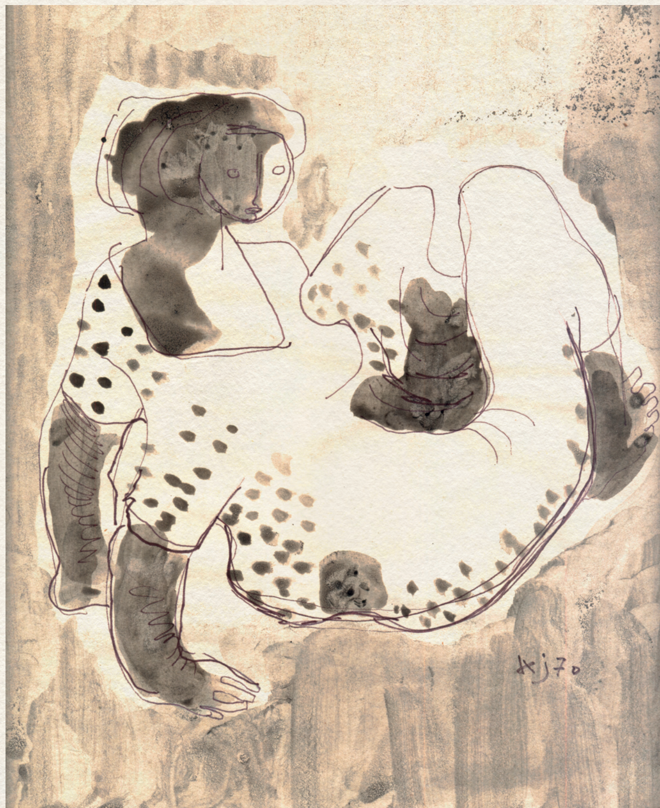
PETTYEGETETT TÁMASZKODÓ - 1970., papír, lavírozott filctoll, 28,8x25,9 cm