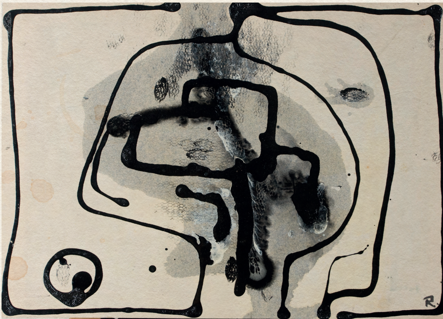
CÍM NÉLKÜL - papír, olaj, 30x43 cm