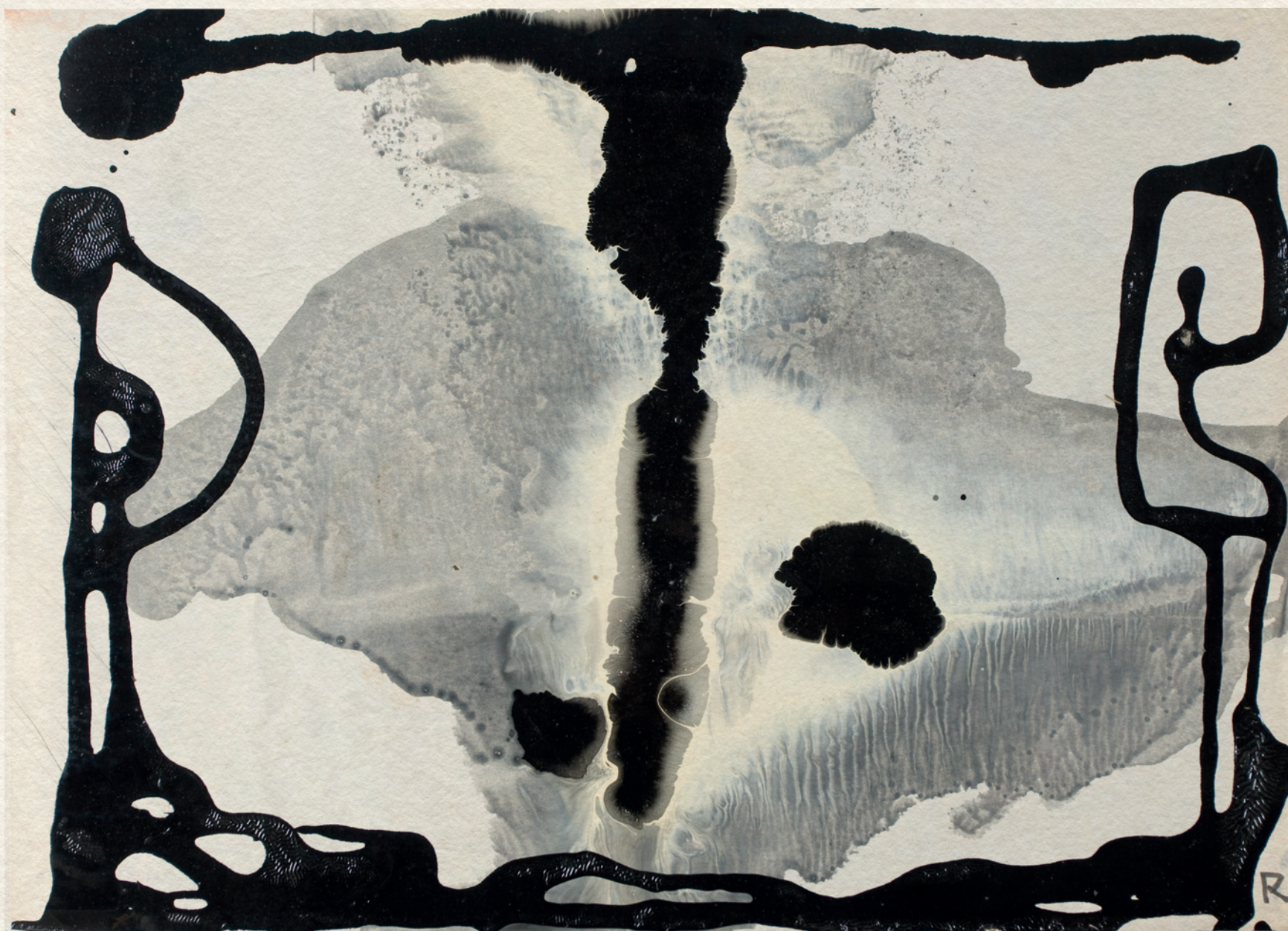
CÍM NÉLKÜL - 1970., papír, olaj, 30x42 cm