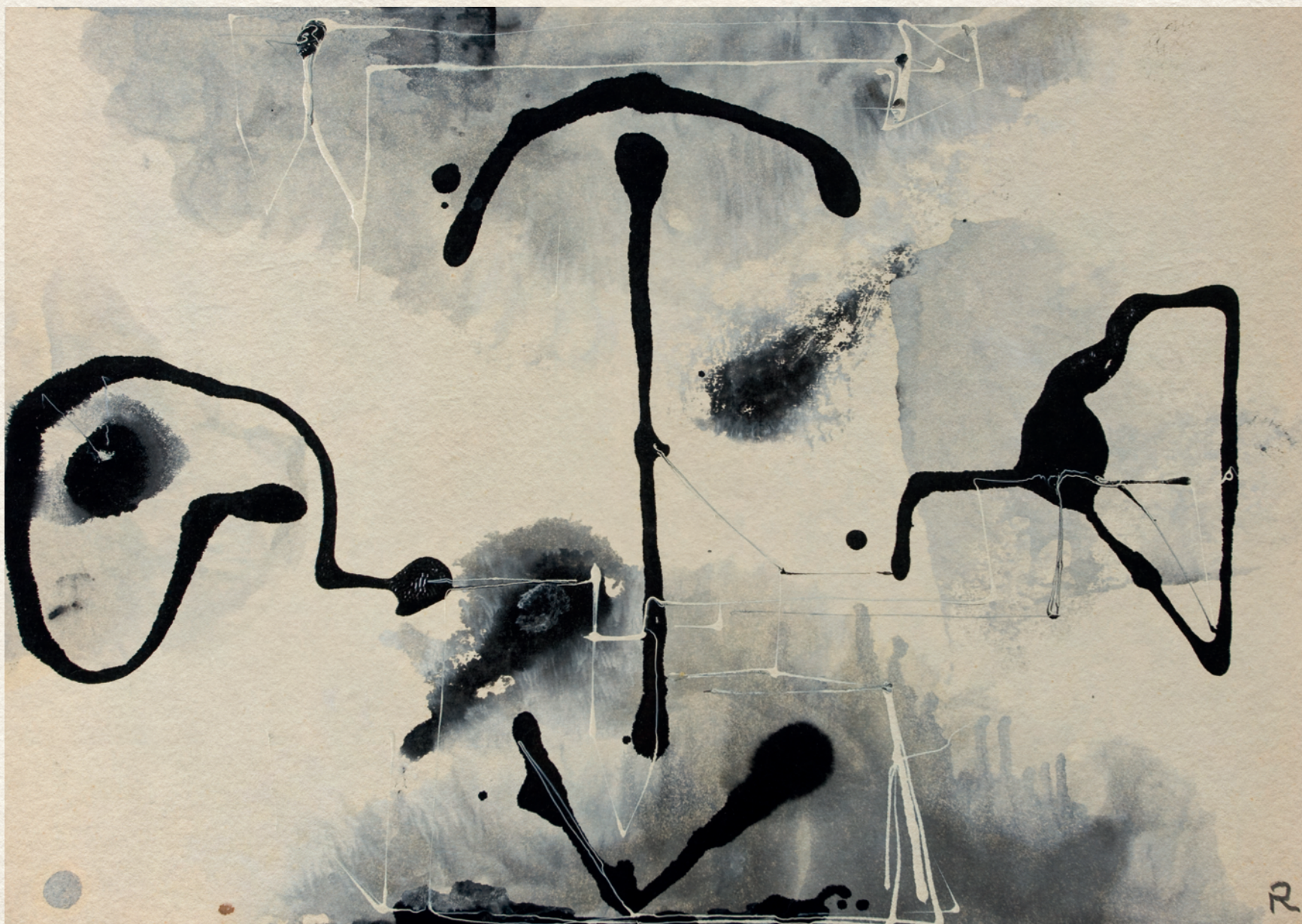
CÍM NÉLKÜL - 1970., papír, olaj, 30x42 cm