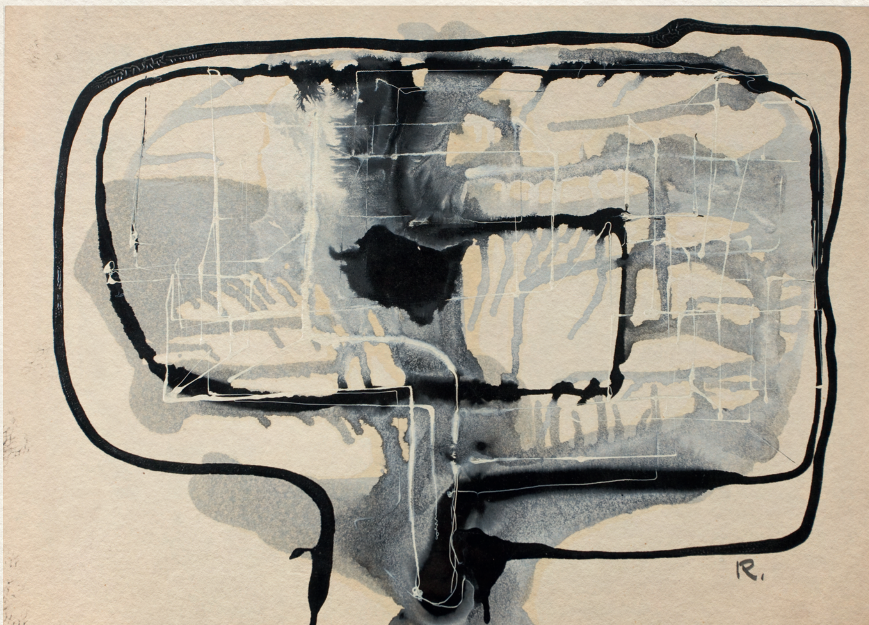
CÍM NÉLKÜL - 1966., papír, olaj, 30x42 cm