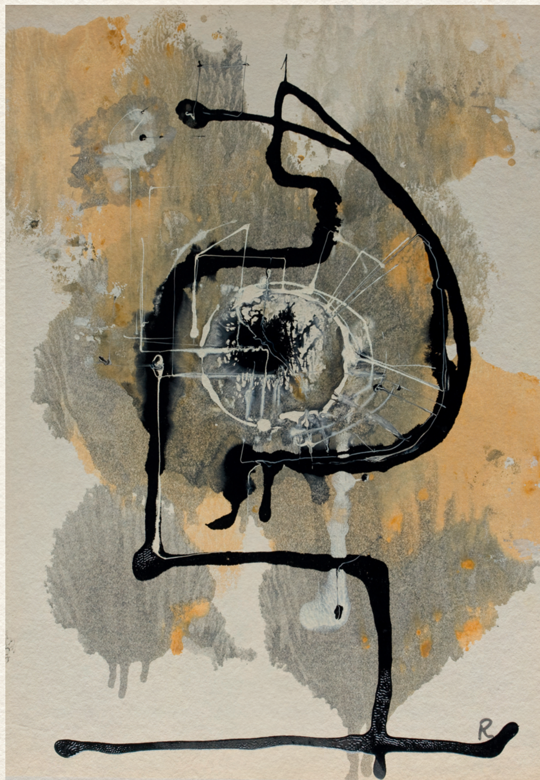
CÍM NÉLKÜL - 1969., papír, olaj, 43x30 cm