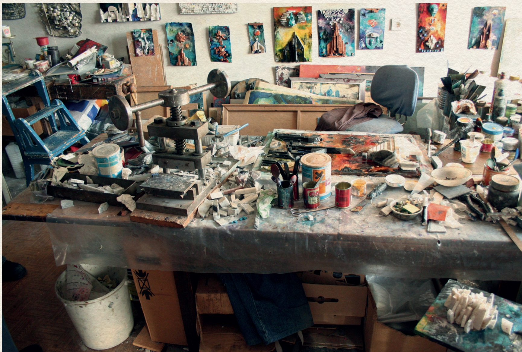
RÁC ANDRÁS MŰTERMÉBEN - 2006.