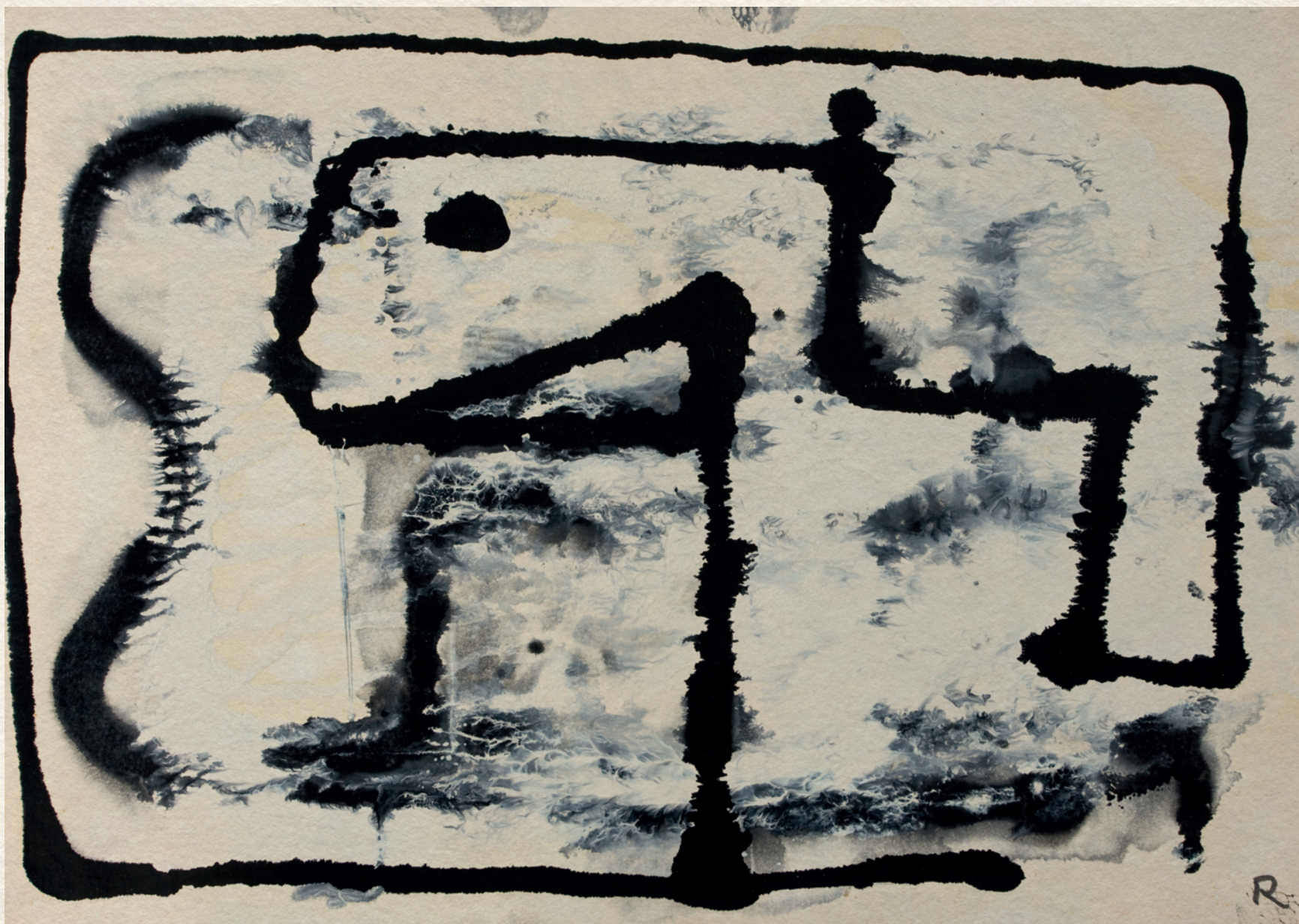
CÍM NÉLKÜL - 1970., papír, olaj, 30x42 cm