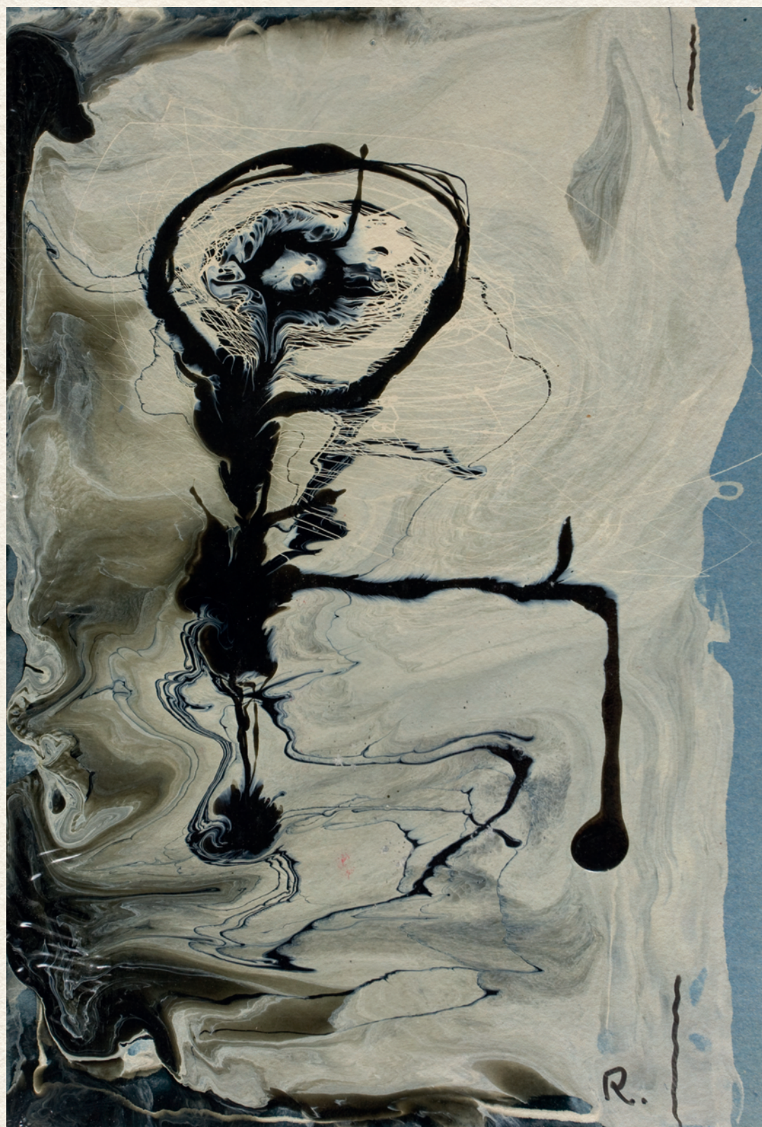
LAKFESTÉS - 1965., papír, olaj, 32x22 cm