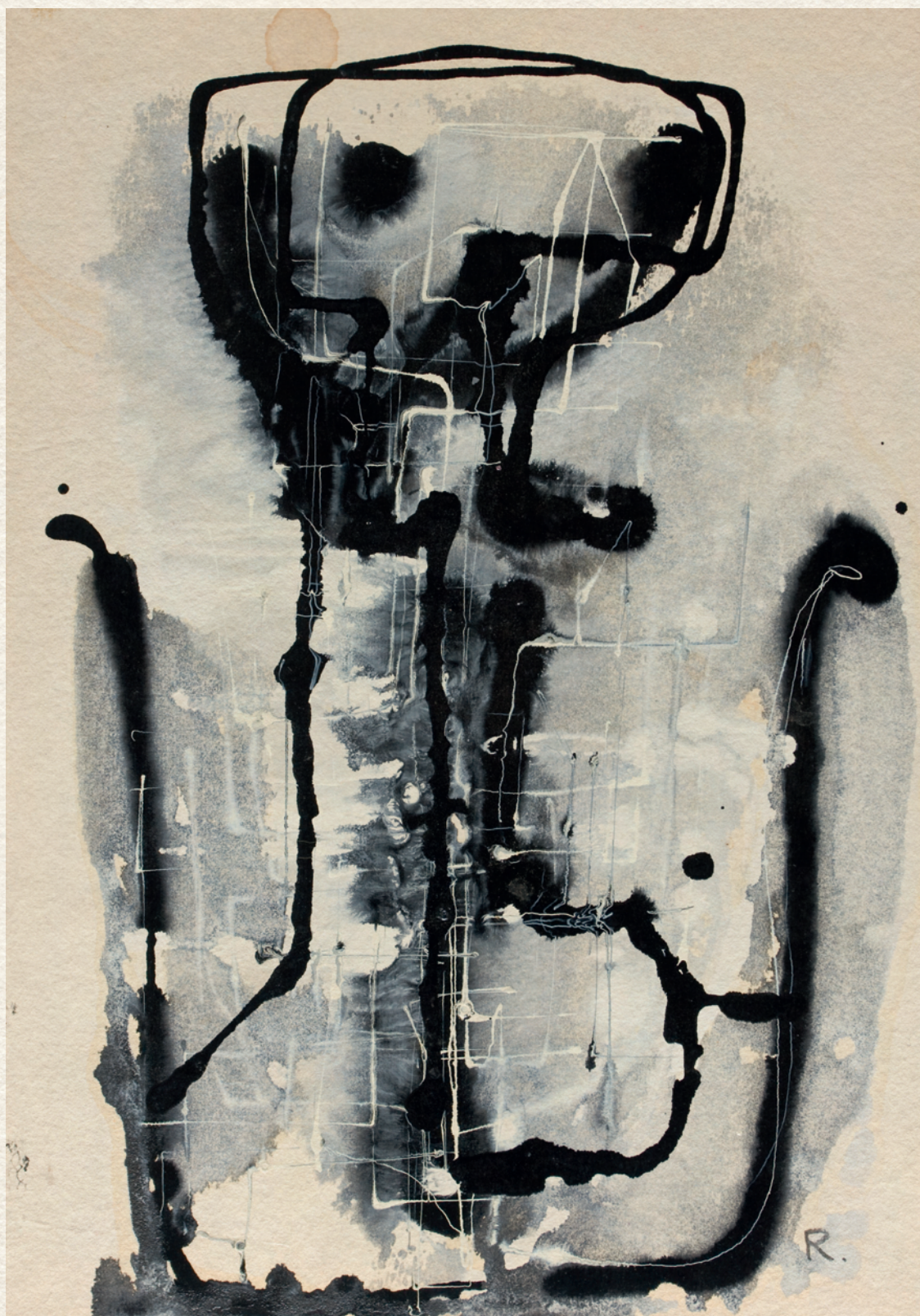
CÍM NÉLKÜL - 1966., papír, olaj, 42x30 cm