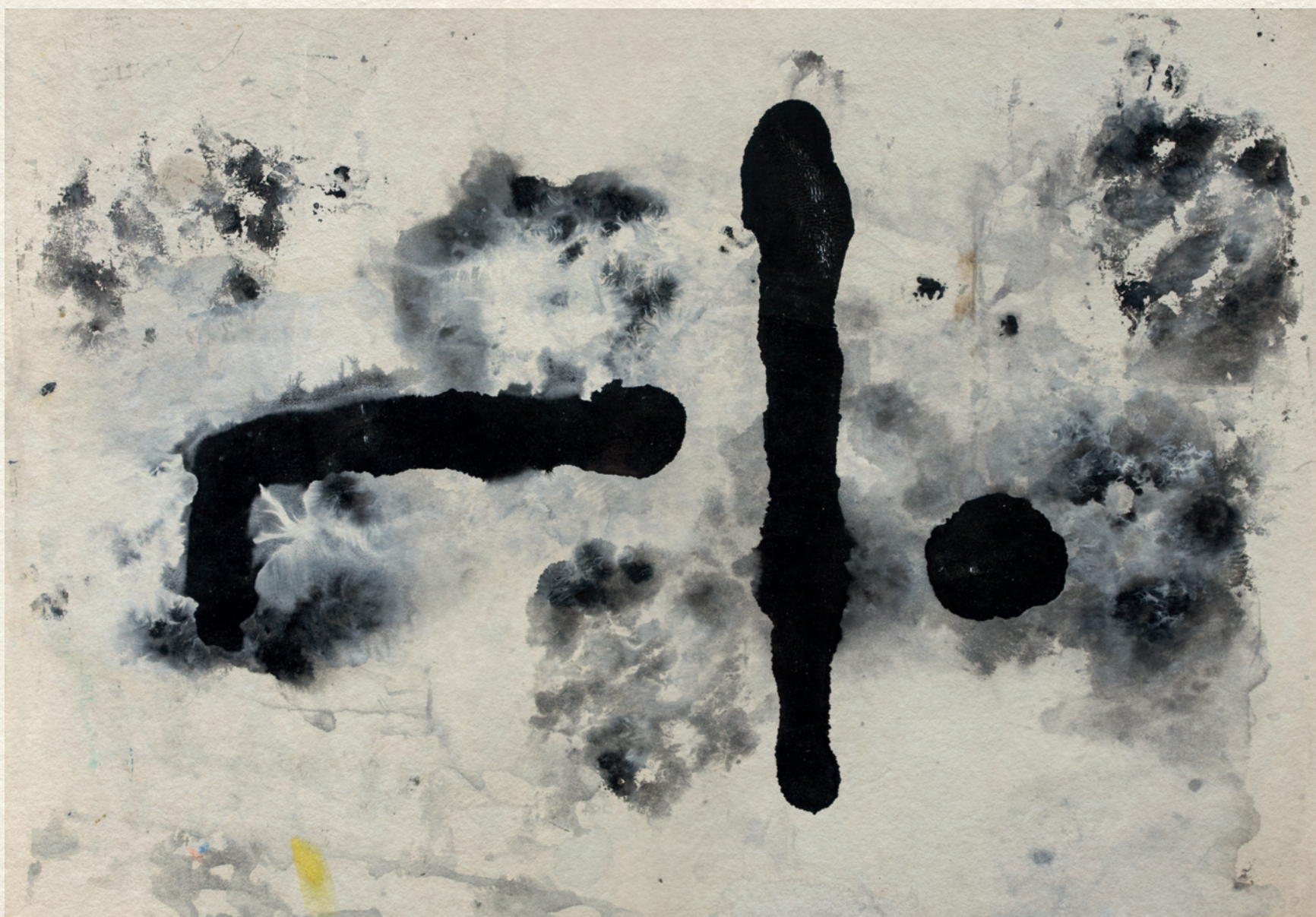
CÍM NÉLKÜL - 1970., papír, olaj, 30x42 cm