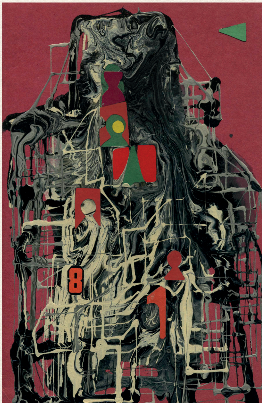
CÍM NÉLKÜL - karton, kollázs, vegyes technika, 240x160 mm