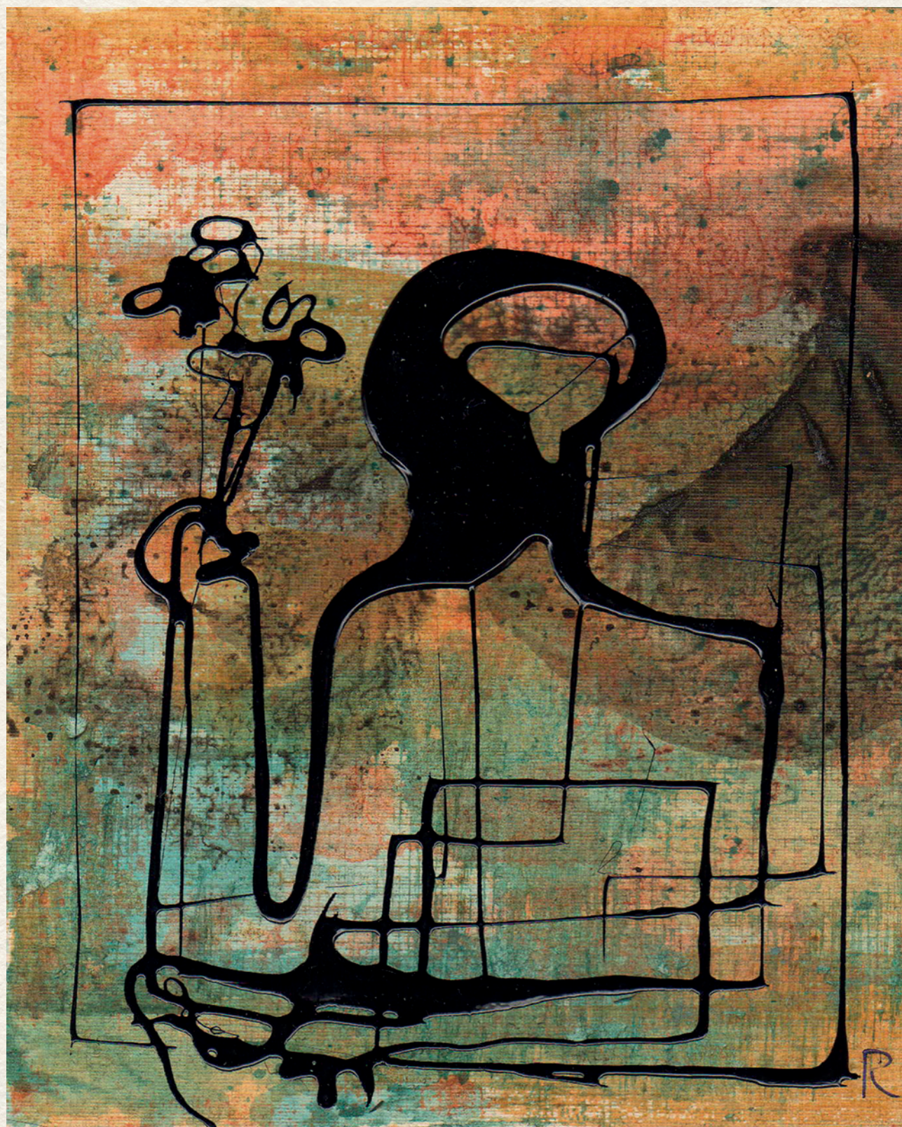
VÁRAKOZÁS - 1971., vegyes technika, papír, 145x170 mm