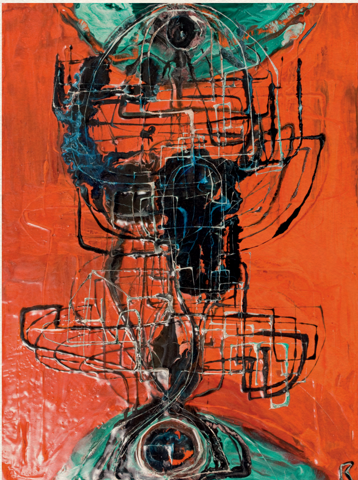
KIÁLTÁS - 1969., farost, gyantafestés, 39x30 cm