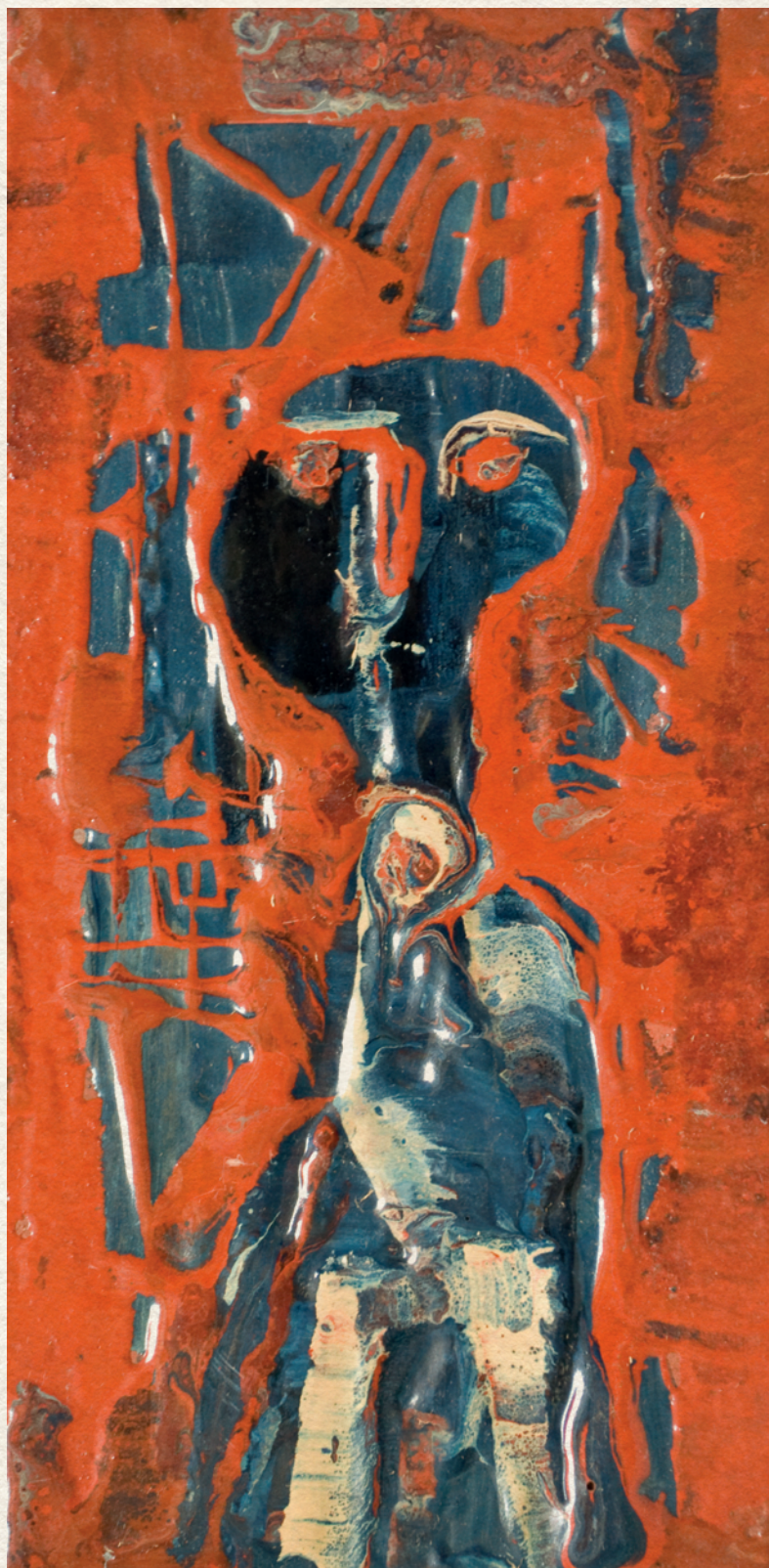
CÍM NÉLKÜL - fa, gyantafestés, 20x10,5 cm