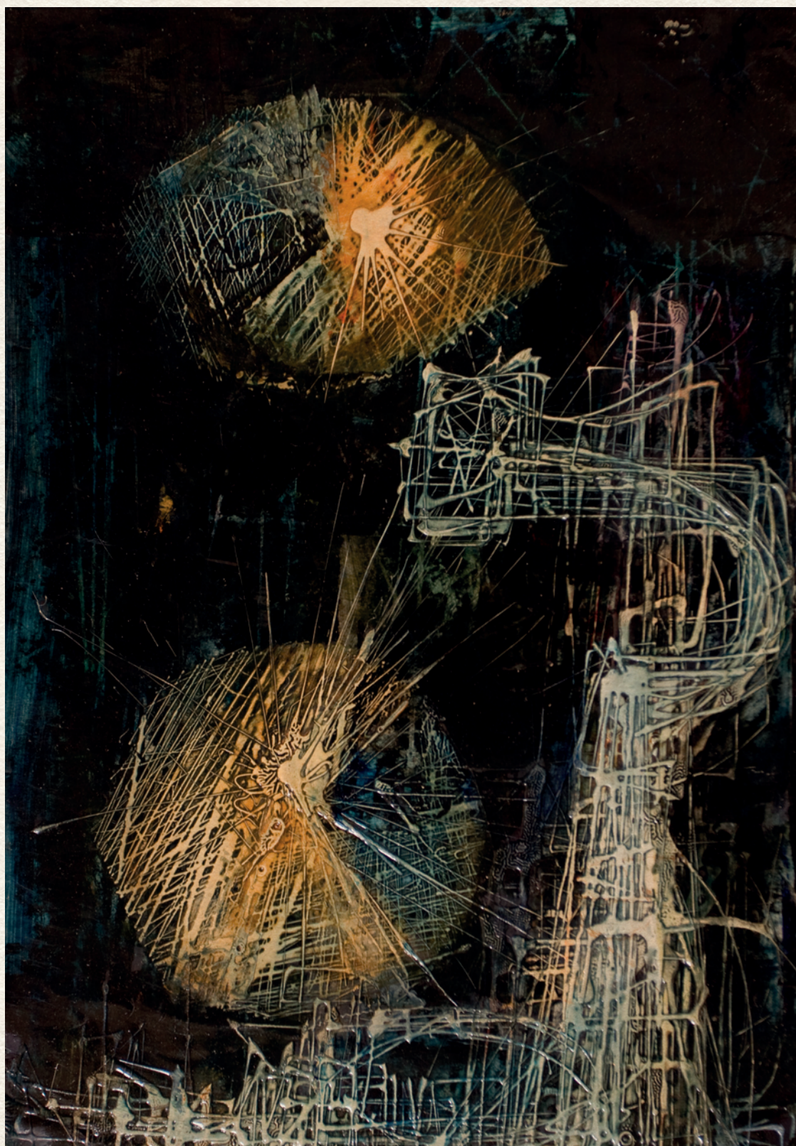
CÍM NÉLKÜL - 1969., papír, olaj, 29x21 cm