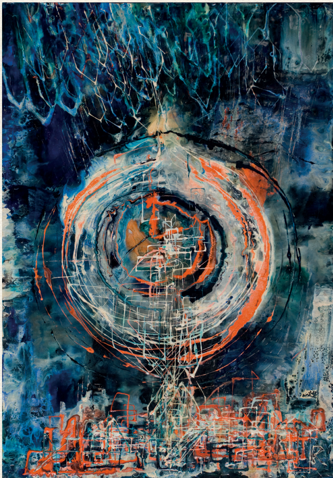
MÁGNESES TÉR - 1990., farost, gyantafestés, 77x56 cm