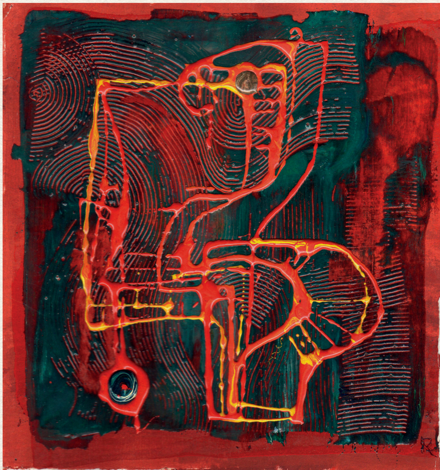
CÍM NÉLKÜL - 1972., papír, vegyes technika, 215x205 mm