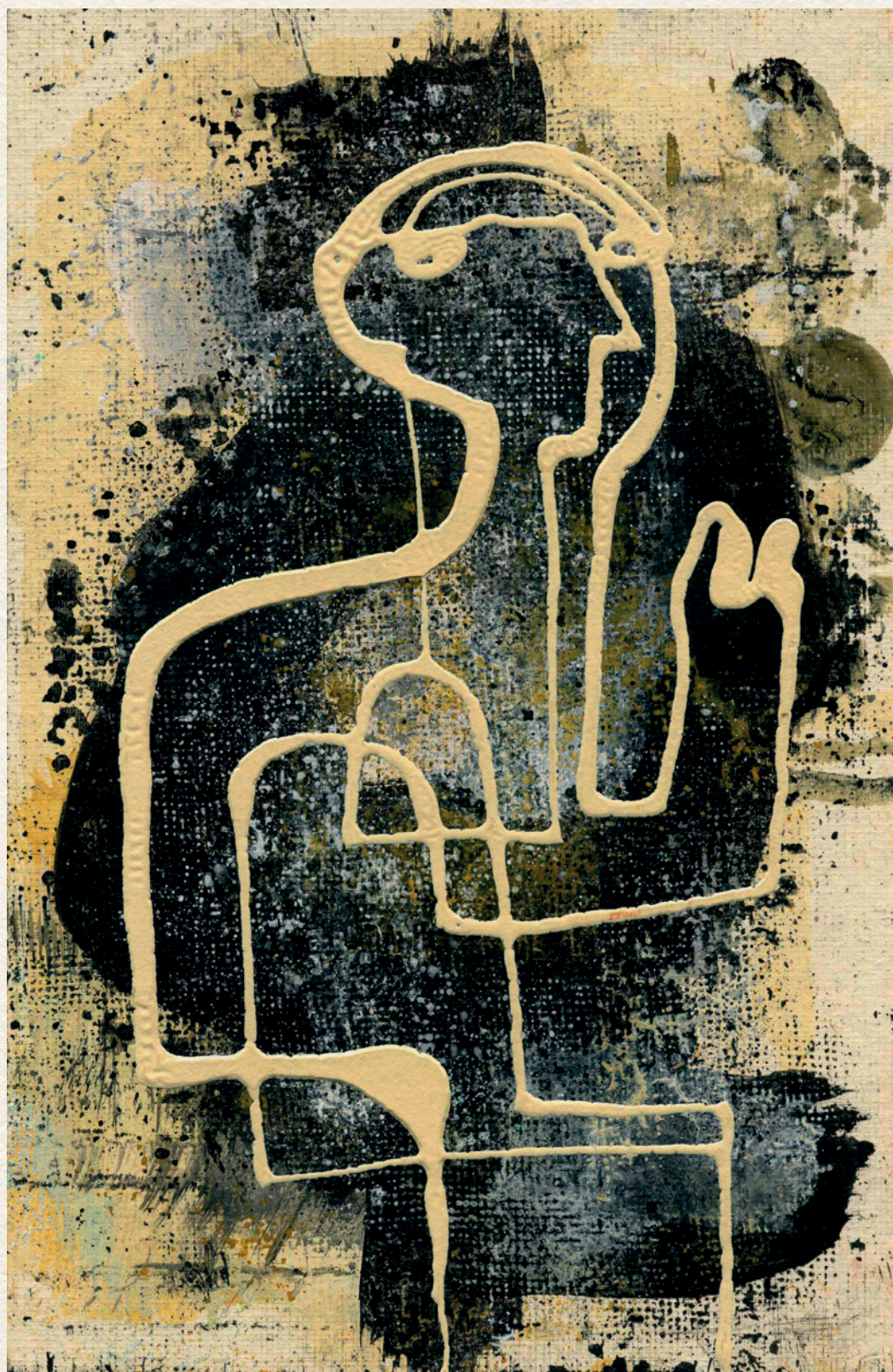
FELÜGYELŐ - papír, vegyes technika, 220x143 mm