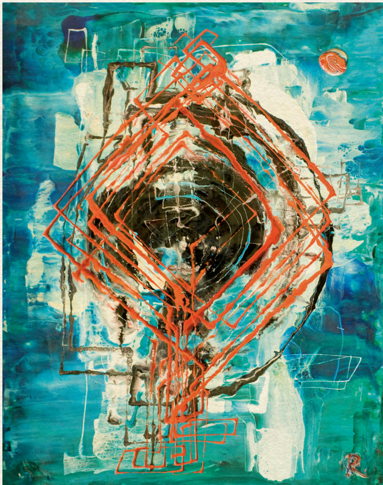
CÍM NÉLKÜL - karton, gyantafestés, 55x44 cm