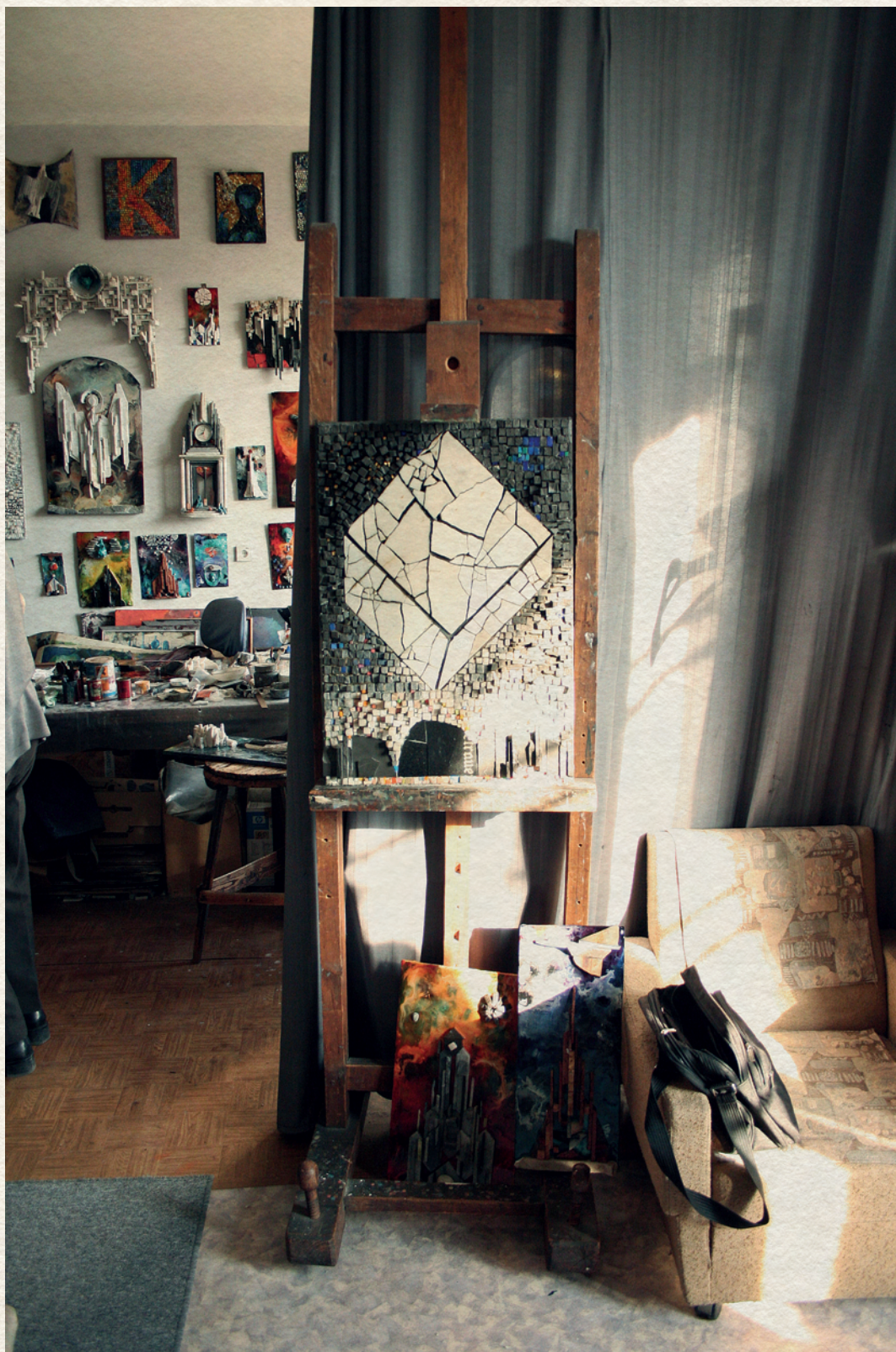
RÁC ANDRÁS MŰTERMÉBEN