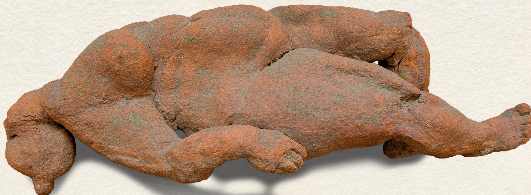
POMPEI SOROZAT - HIÚ REMÉNY - 1988., terrakota, 1200 C, 18x48x16 cm