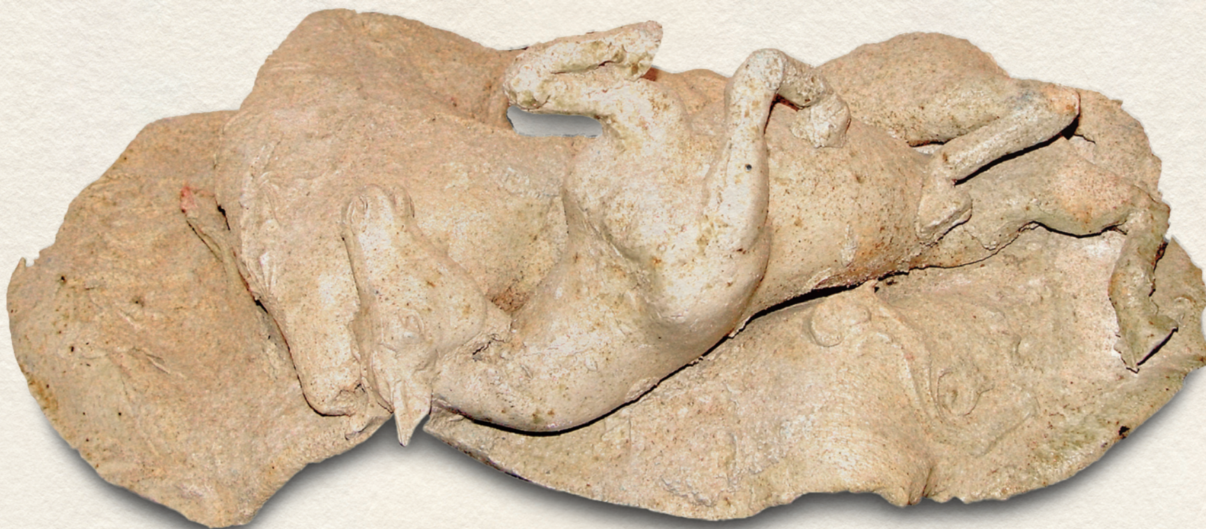
ÁRVÍZ UTÁN - 2002., kőcsérép, 1300C, 20x54x29 cm