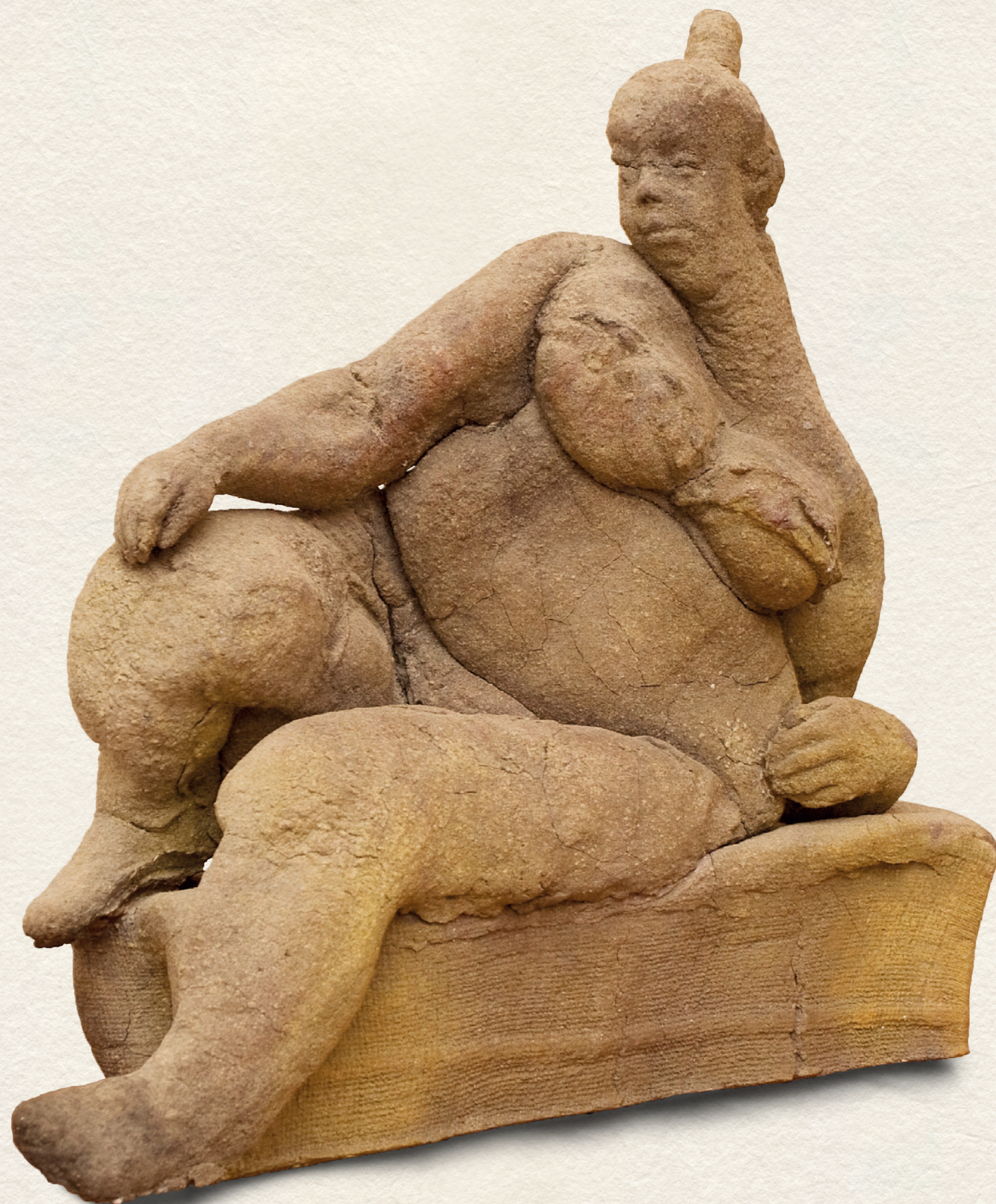
EDIT - 1989., raku, 1140C, 40x42x15 cm