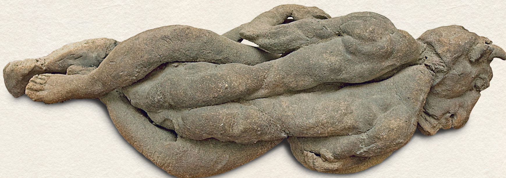
SZERLMES MINOTAUIROSZ - 1995., kőcserép, 1250 C, 20x57x21 cm