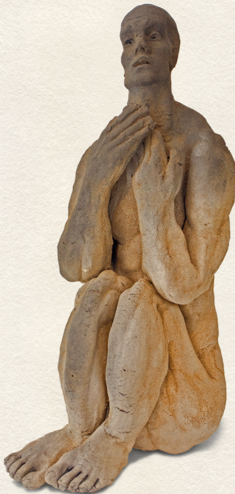
ÜLŐ FÉRFI - terrakota, 1200 C, 46x19x23 cm