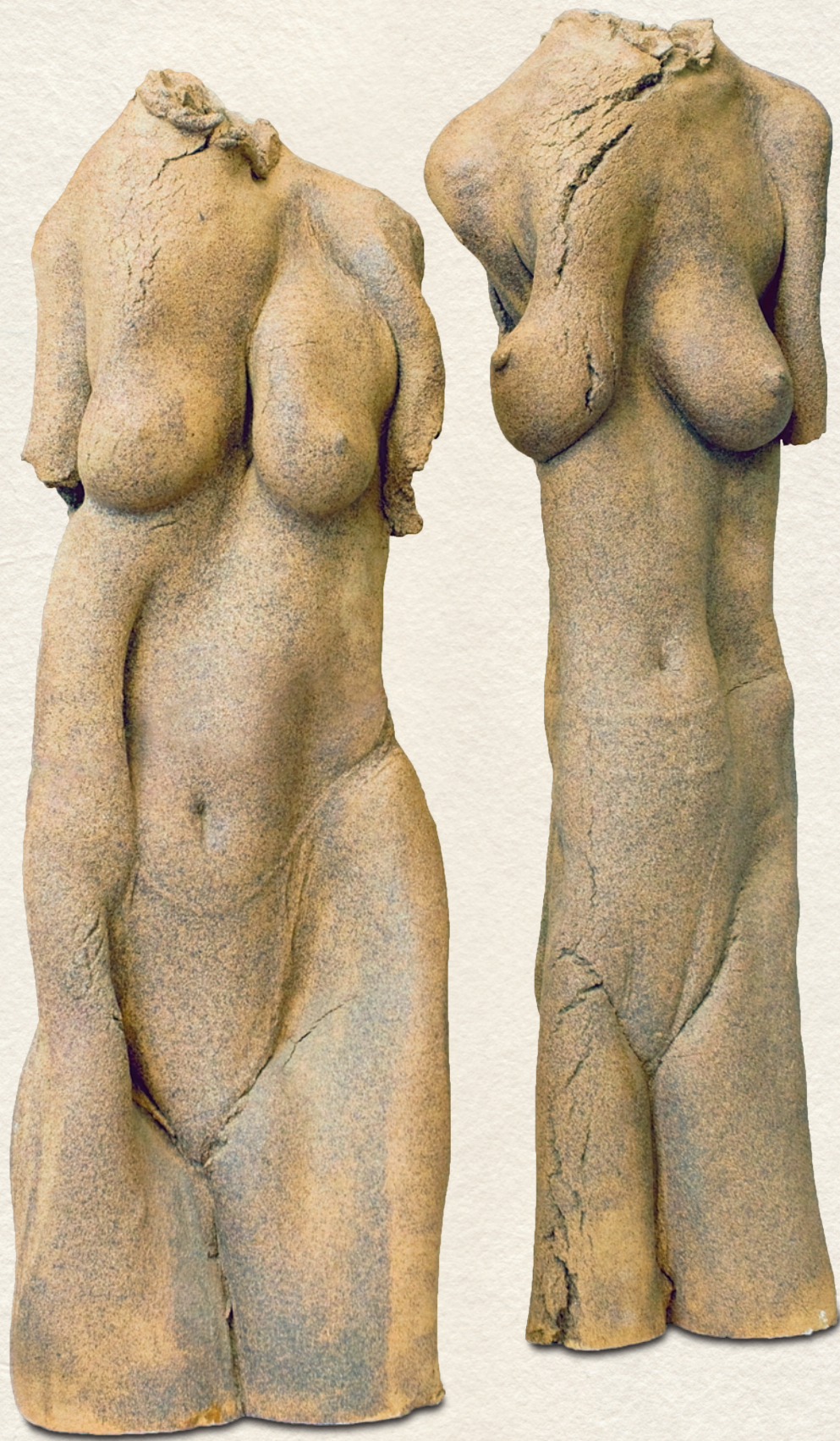
ÁRNYAK I-II. - 1993., kőcserép, 1200 C, 95x30x23 cm