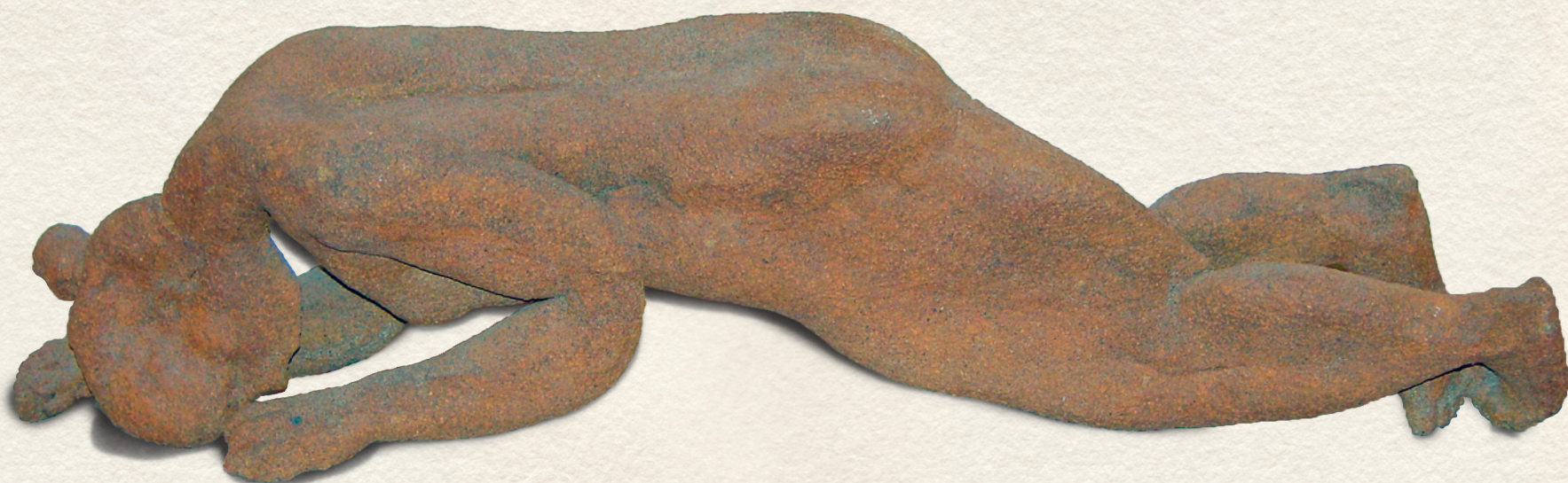
CSEND - 1988., terrakotta, 1200C, 24x76x15 cm