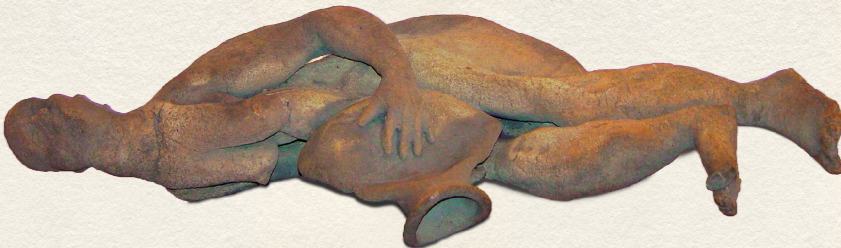
POMPEI SOROZAT - MENEKÜLÉS - 1987., raku, 1100 C, 38x74x15 cm