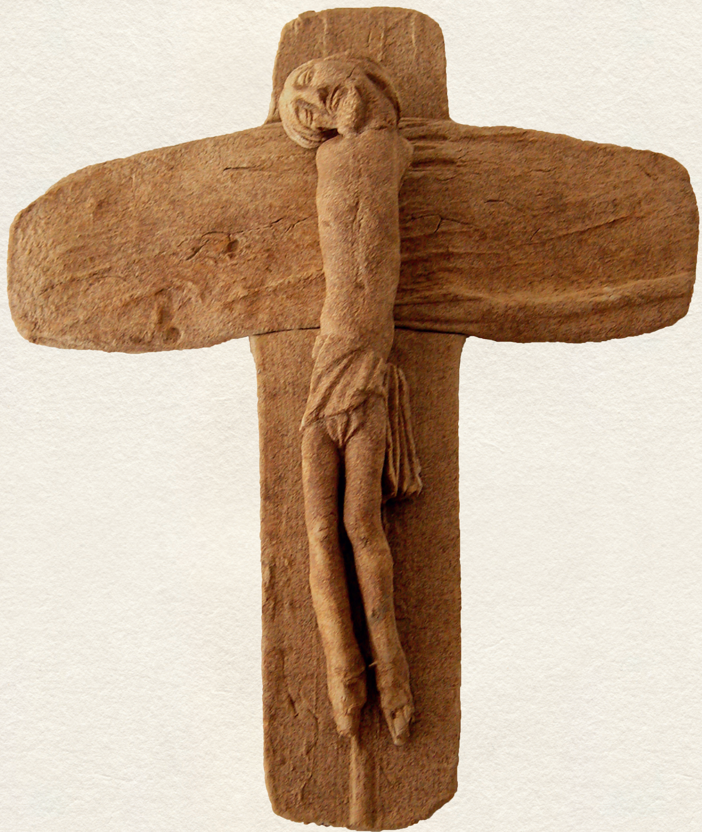
FESZÜLET – 2007., kőcserép, 1250C, 67x55x12 cm