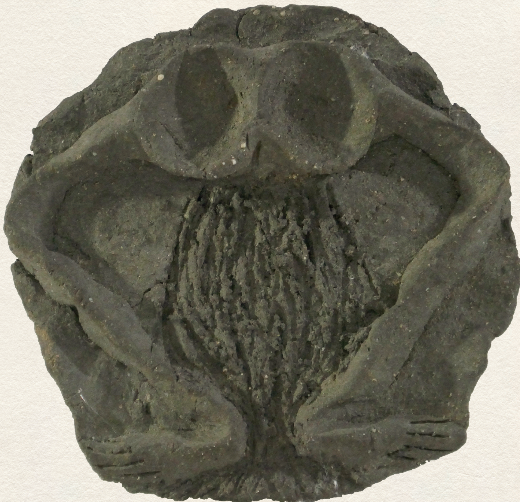
ÖSZTÖNÖK I. - kerámia, plakett, 10x10 cm