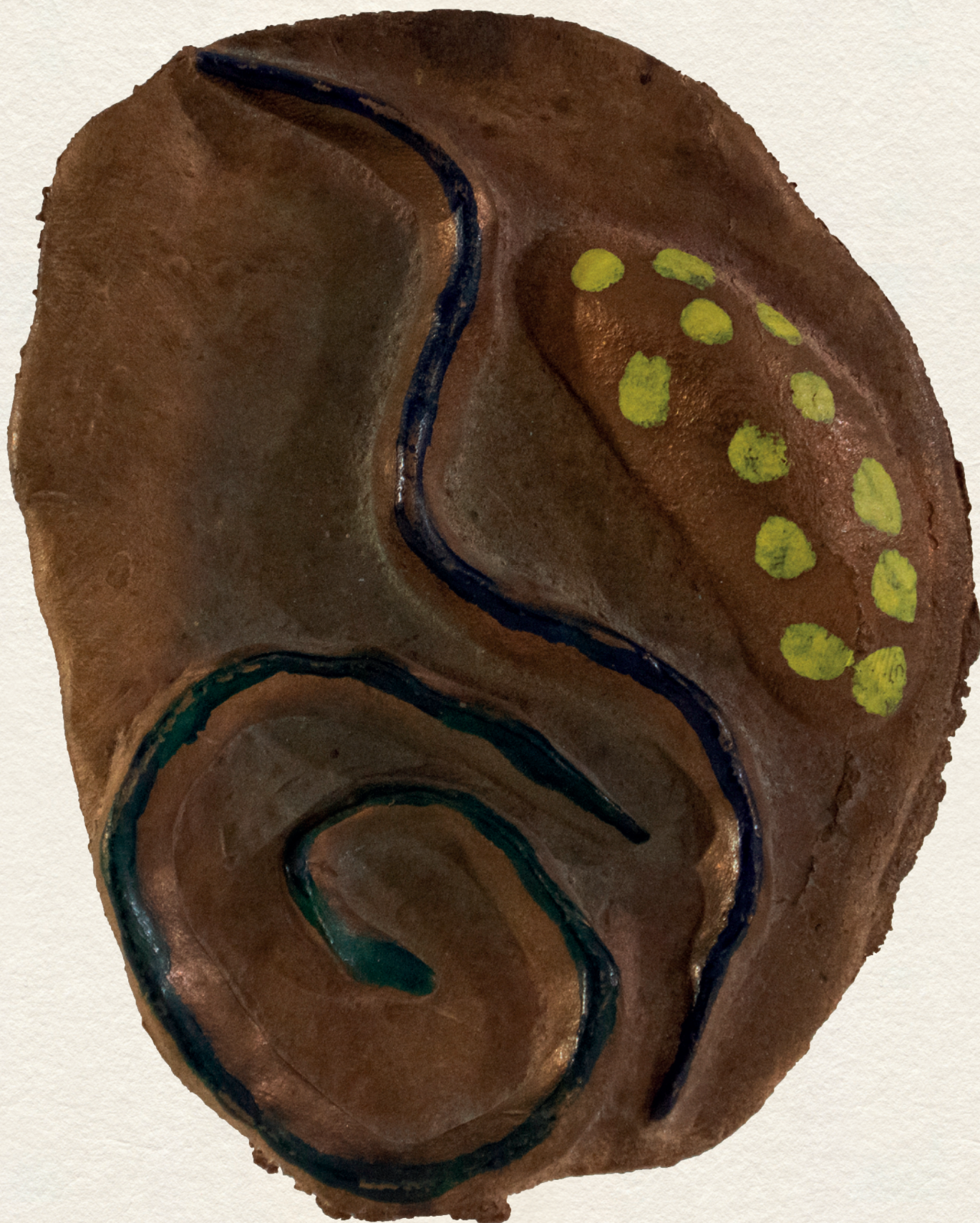
HEIDEGGER, LÉT ÉS IDŐ 8. - 1992., bronz, plakett, 10x8,5 cm