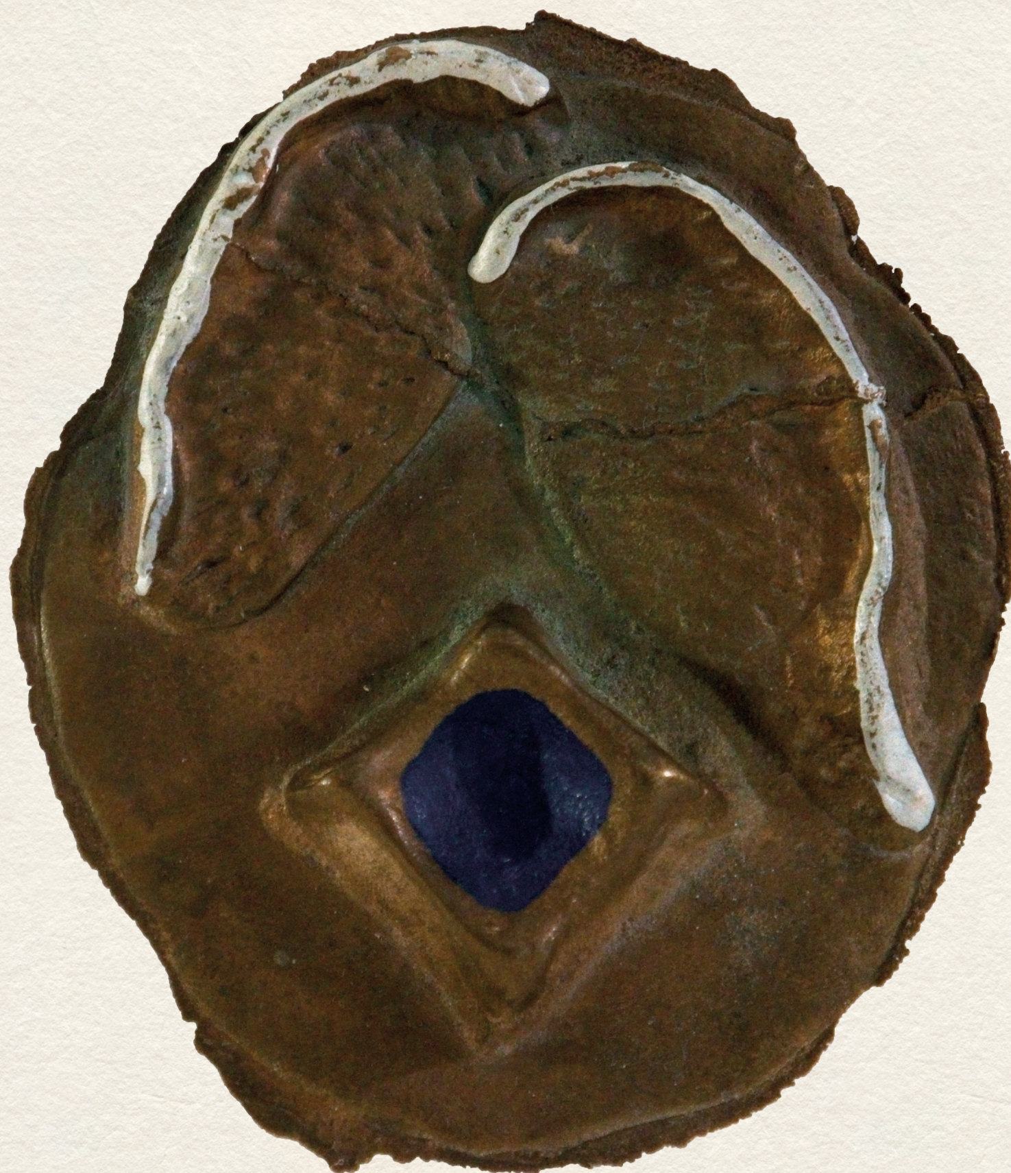
HEIDEGGER, LÉT ÉS IDŐ 5. - 1993., bronz, plakett, 10x8,5 cm