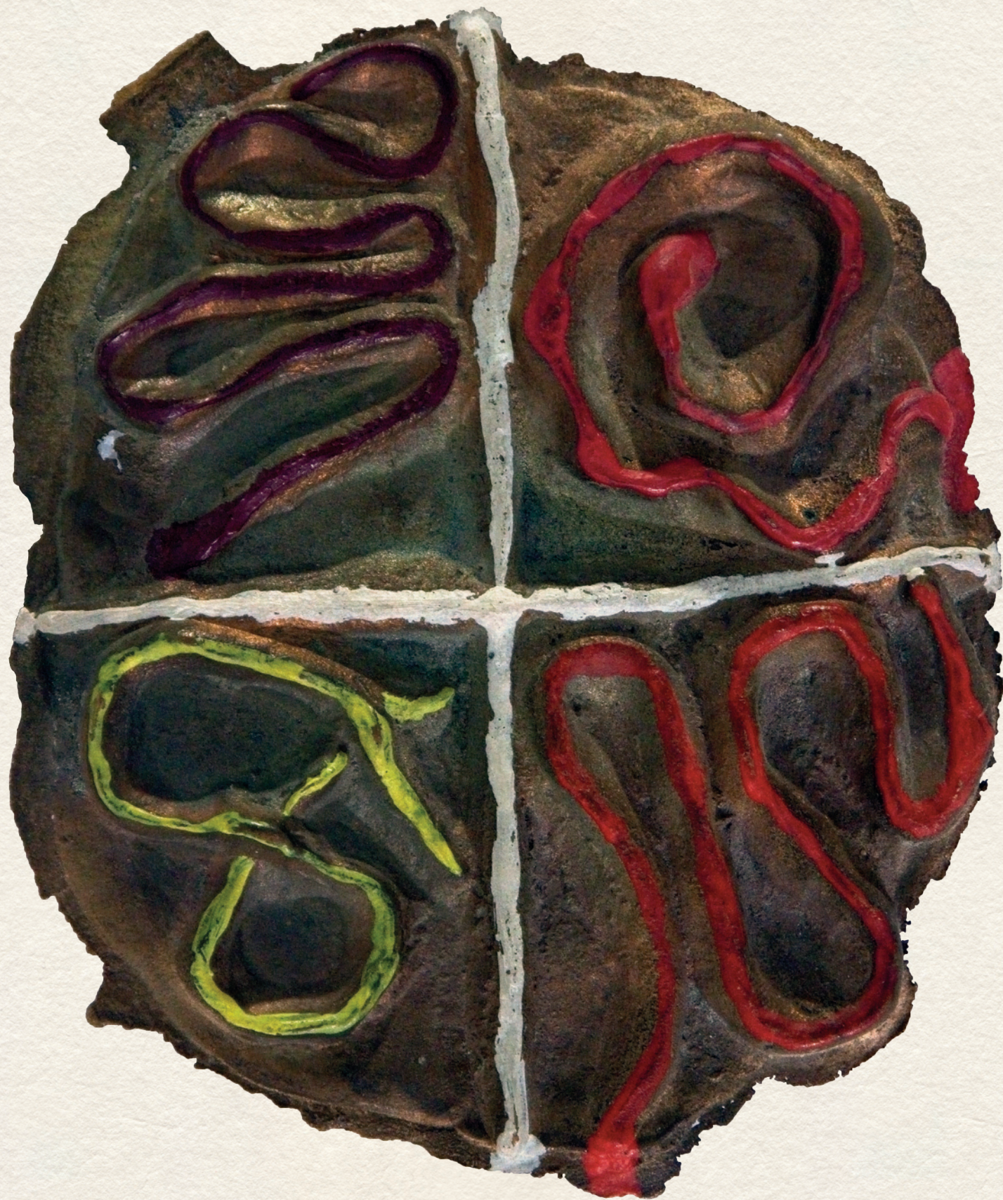
HEIDEGGER, LÉT ÉS IDŐ 6. - 1992., bronz, plakett, 9,5x11,5 cm