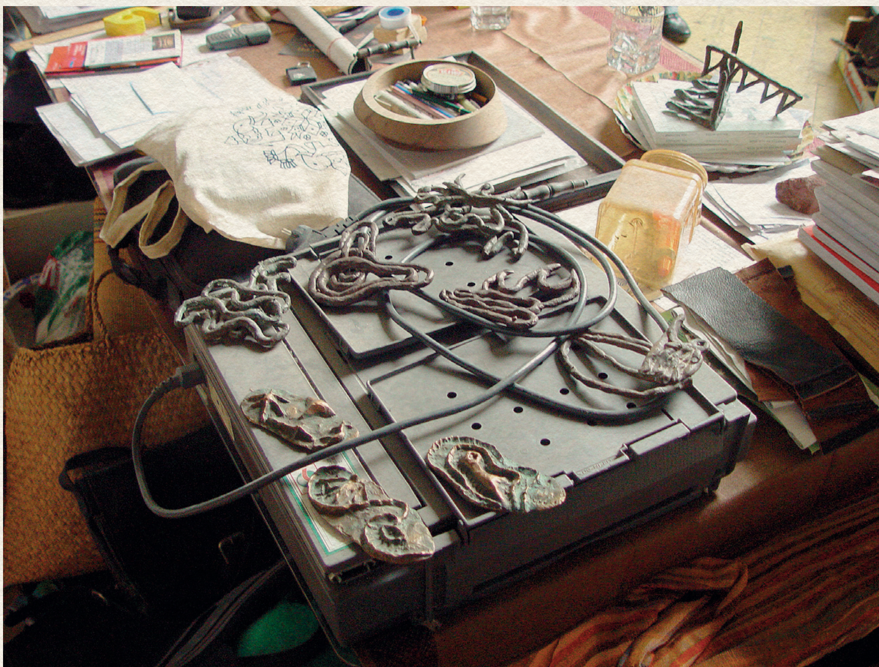
VÁRNAGY ILDIKÓ MŰTERMÉBEN - 2011.