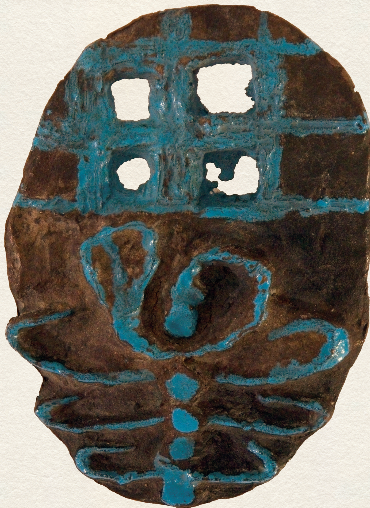
SHAKESPEARE SZONETT XXIV. - 1983., bronz, plakett, 11,5x8,5 cm