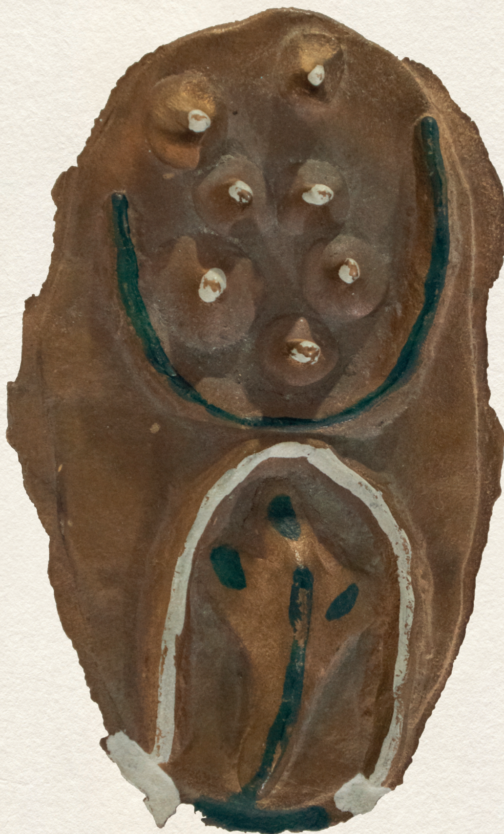
HEIDEGGER, LÉT ÉS IDŐ 4. - 1992., bronz, plakett, 7x12 cm