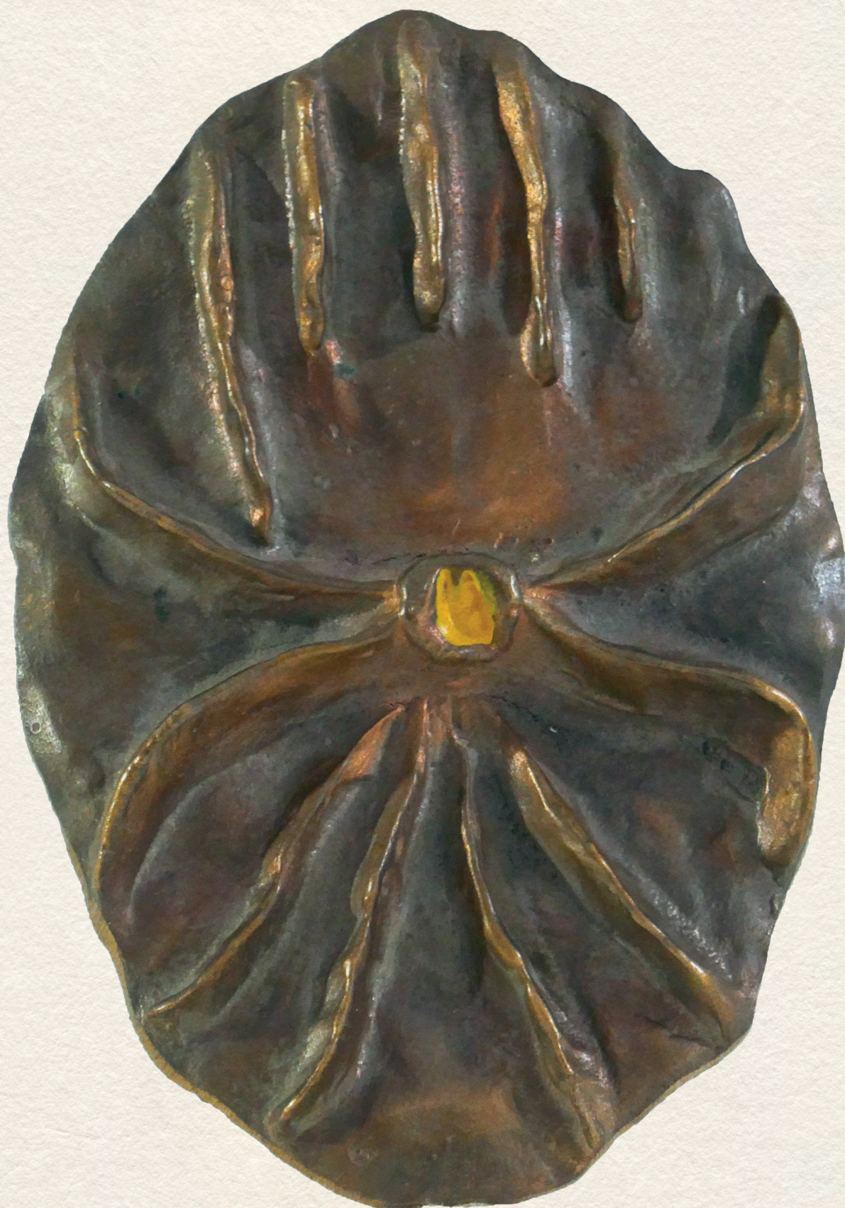
TIBETI HALOTTASKÖNYV 5. - 1983., bronz, plakett, 13x9 cm