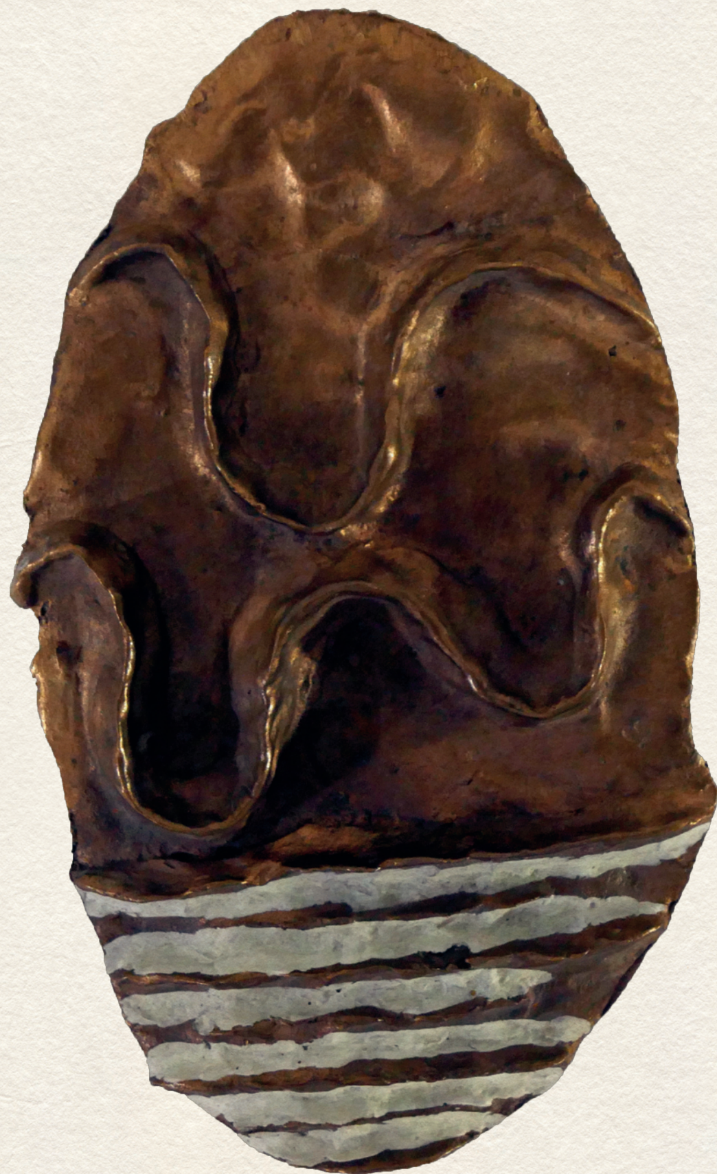
TIBETI HALOTTASKÖNYV 7. - 1983., bronz, plakett, 14x8 cm