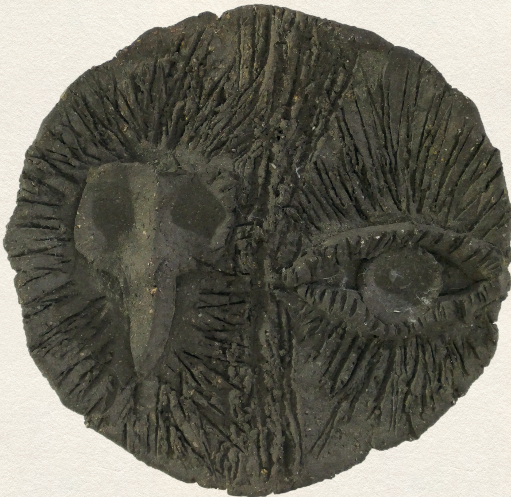
ÖSZTÖNÖK II. - kerámia, plakett, 9,5x10 cm