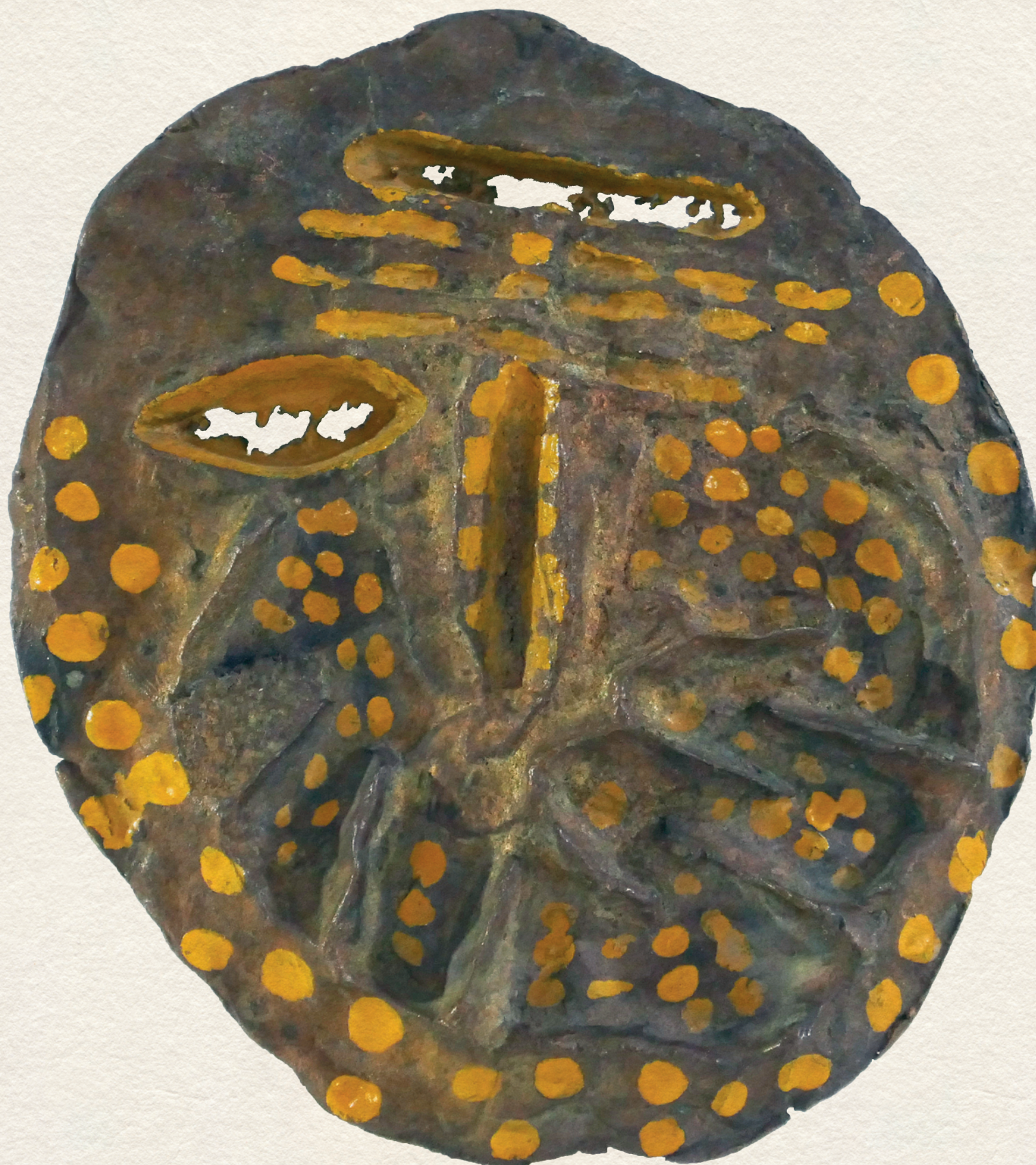
SHAKERPEARE SZONETT II. - 1986., bronz, plakett, 11x9.5 cm