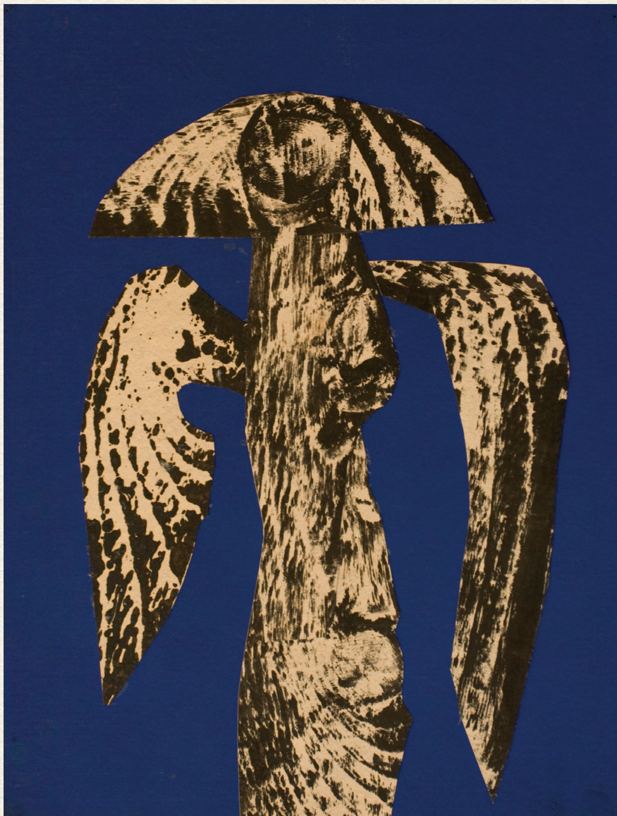
MADÁRBÁLVÁNYKA – 1970., papír, kollázs, 29x22 cm