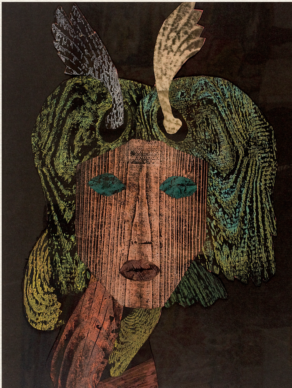
SZIRÉNEK ARCKÉPE – 1977., papír, kollázs, fanyomat, 40x30 cm