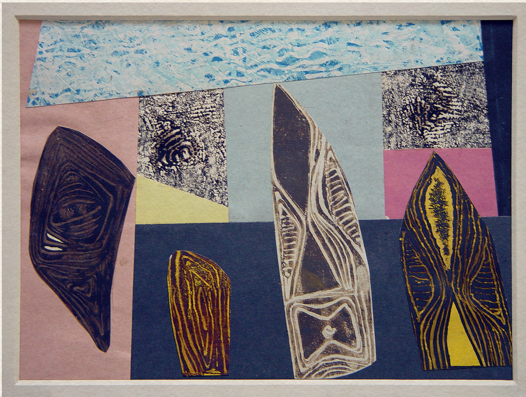
BÁLVÁNY-MOTÍVUMOK II. - 1986., fa, kollázs, 26x39 cm