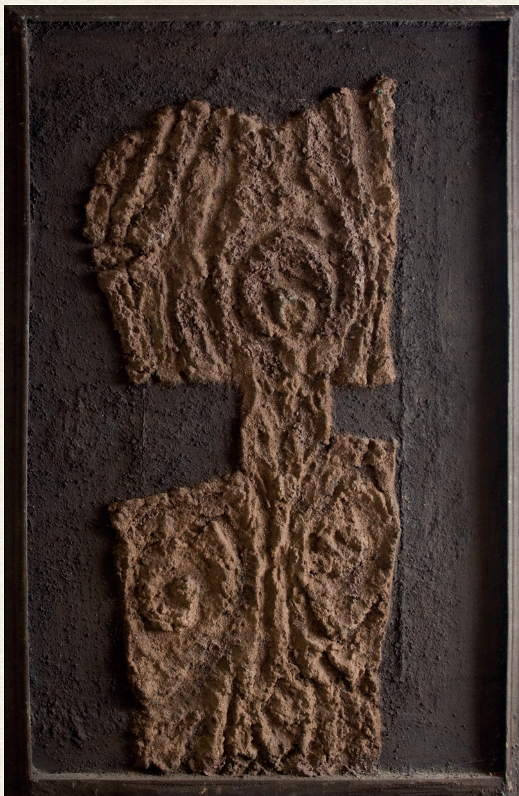
ÁSATAG BÁLVÁNY III. – 1981., farost, salakrelief, 73x46 cm