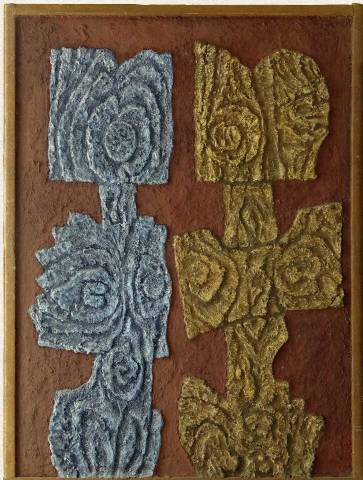
TÁNCOLÓ BÁLVÁNYOK – 1981., falemez, olaj, 100x80 cm