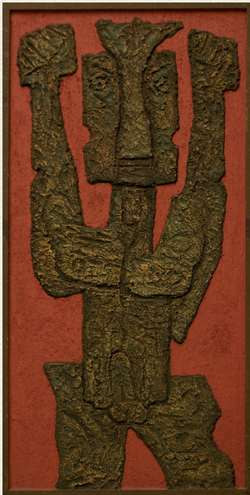
KANBÁLVÁNY – 1987., fa, salakrelief, 75x37, 5 cm