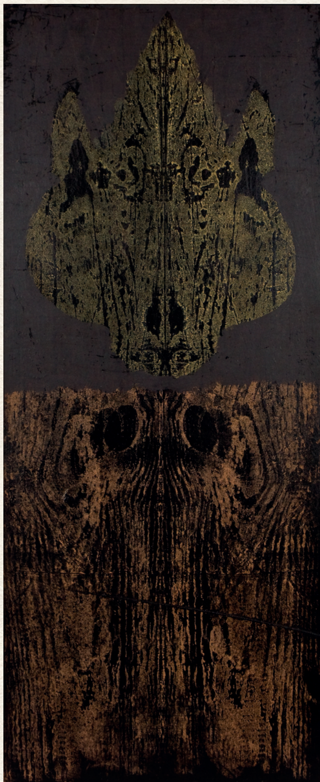
RORSCHACH-FIGURÁK I. – 1990., farost, olaj, 69x29 cm