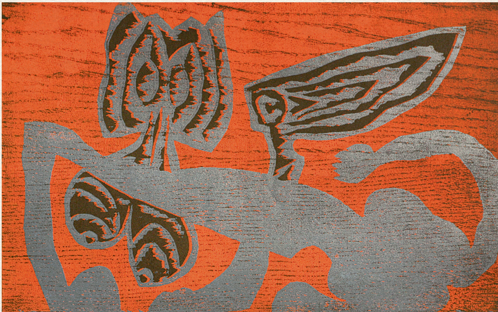
SZFINX VARIÁCIÓ II. – 1983., karton, fametszet, 330x490 mm