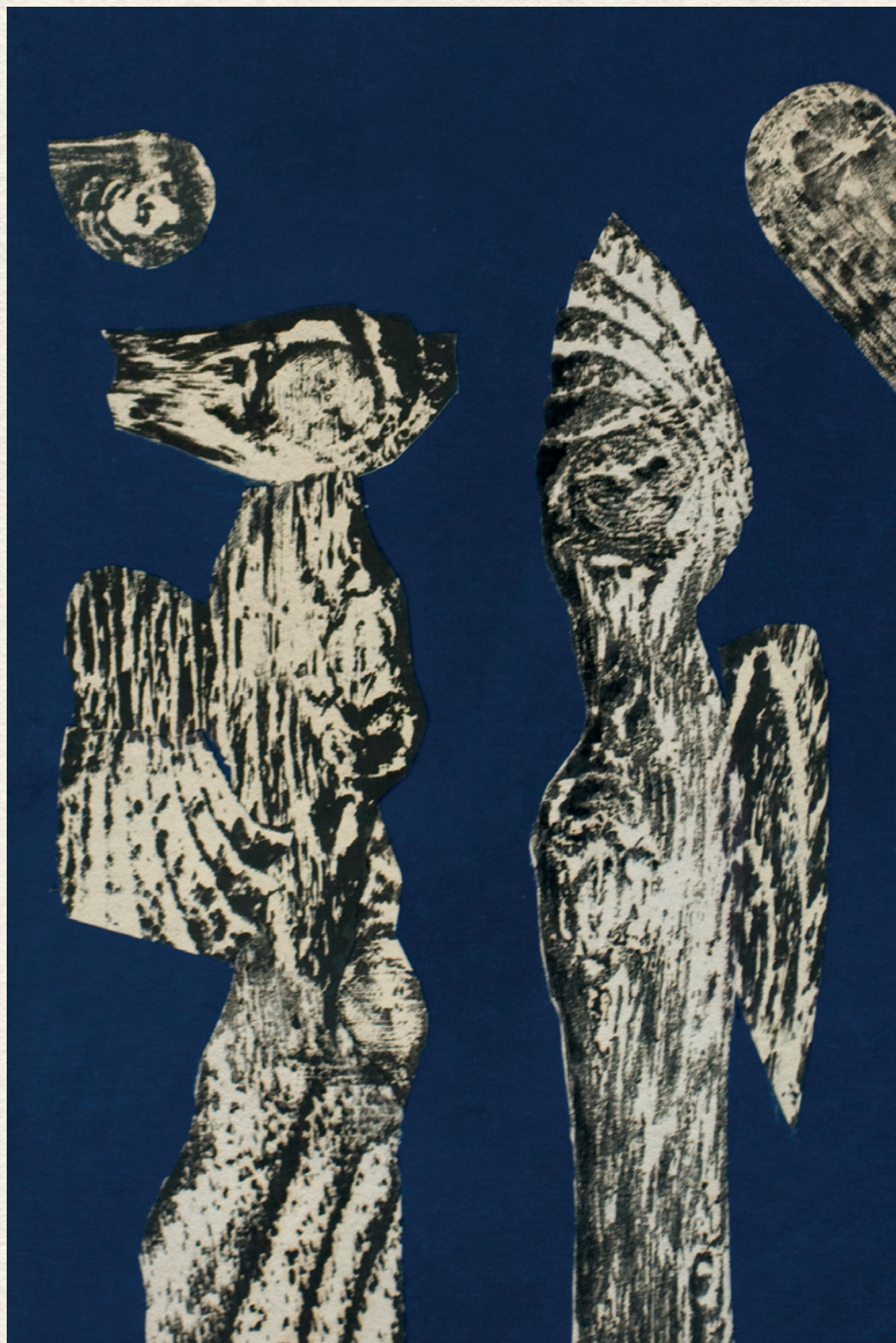
ÉGIEK TALÁLKOZÁSA – 1970., papír, kollázs, 31x21 cm