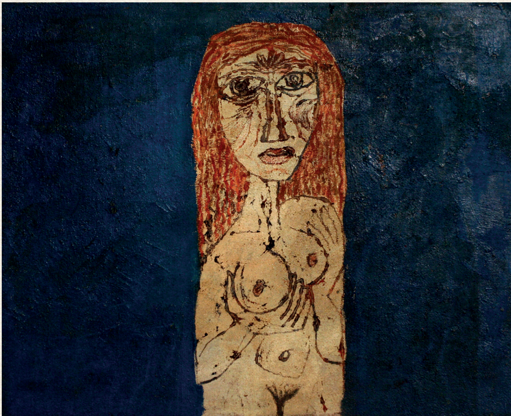
SZORONGÓ OLIMPOSZ III. – 1966., farost, vegyes technika, 40x50 cm