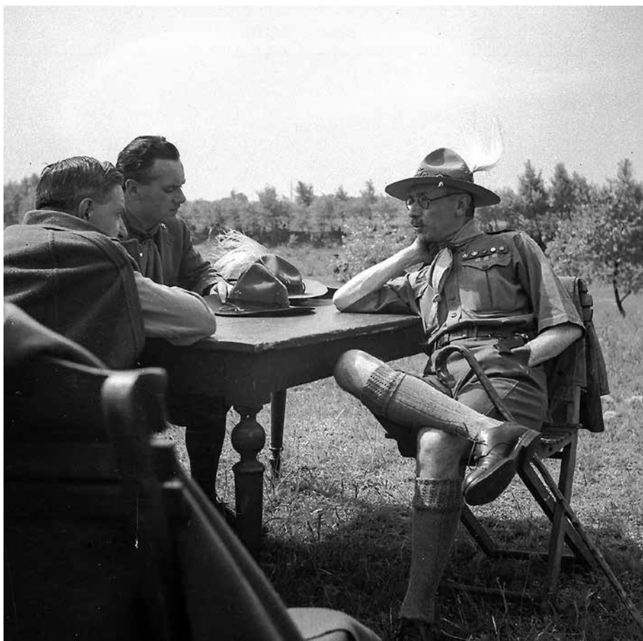
1. kép. Teleki Pál az 1933-as, Gödöllőn megrendezett dzsemborin.