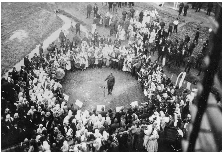
3. kép. Honvéd térzene Szilágyperecsen főterén