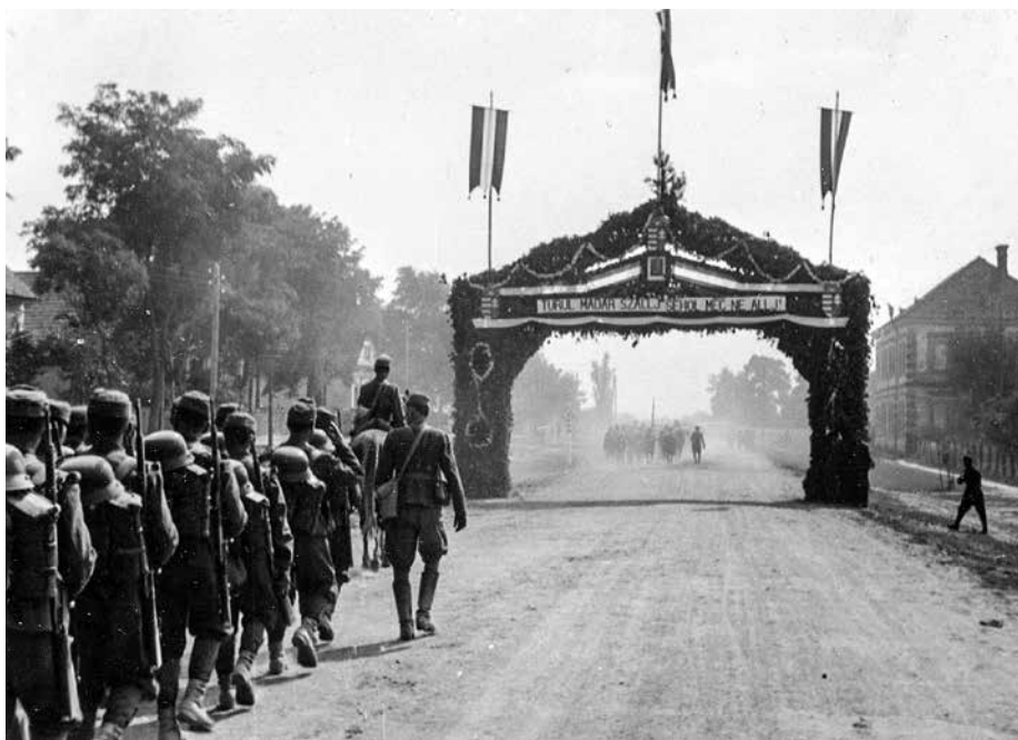
1. kép. A 32. honvéd gyalogezred Vállajnál, 1940. szeptember 5-én