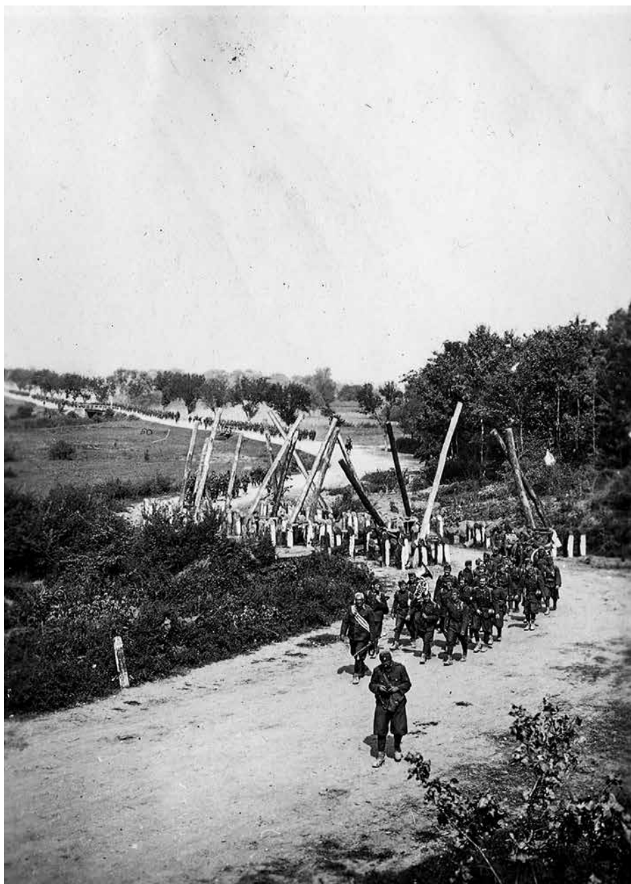
2. kép. A 2. honvéd gyalogezred ezredzenekara a Hadad előtti úttorlaszoknál, 1940. szeptember 7-én