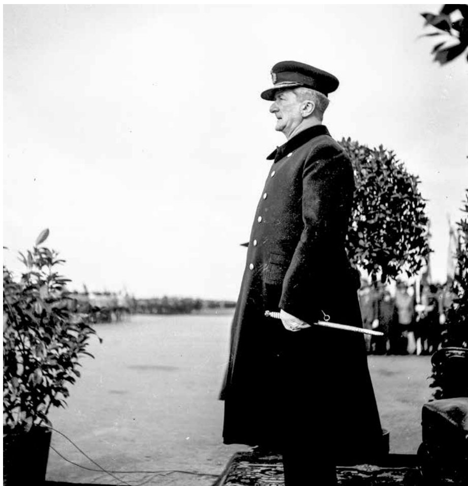
2. kép. Horthy Miklós 1938 áprilisában a budaörsi repülőtéren, amikor a magyar cserkészlet fennállásának 25. évfordulóját ünnepelték.