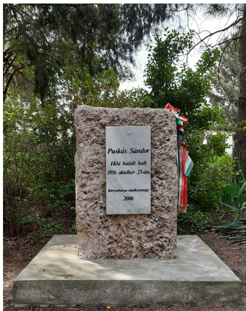
19. 2006-ban, a forradalom 50. évfordulóján Puskás Sándor emlékére Környebányán felállított emlékkő. (A szerző fotója, készült 2020. április 19.)